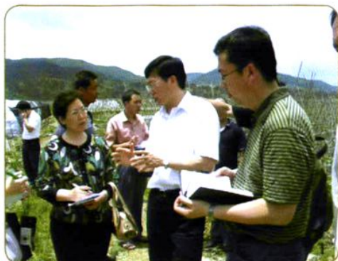
2008年5月农经所科研人员在福建三明市调查台资企业的农业生产问题