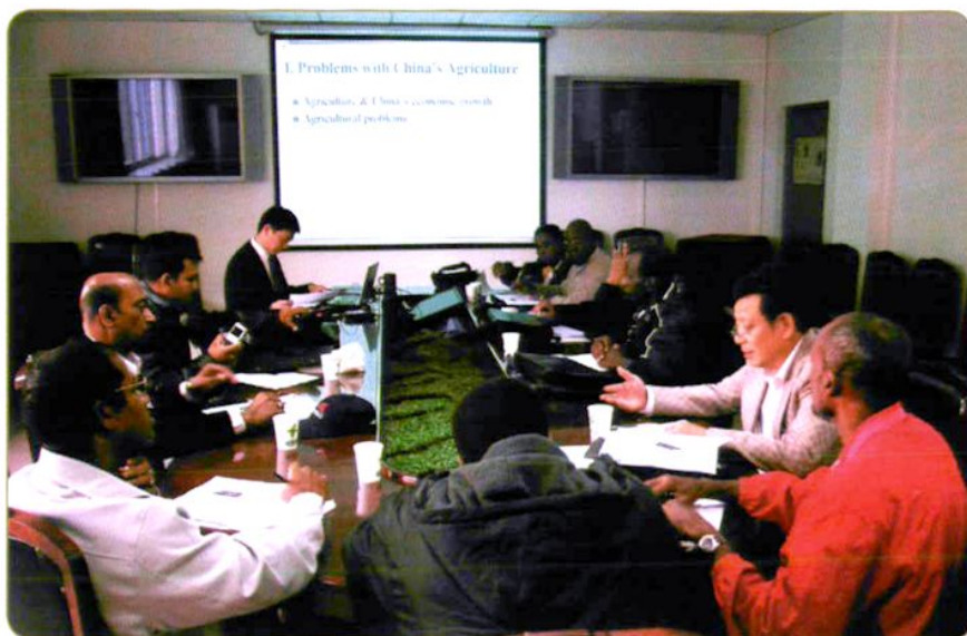
2006年10月农经所科研人员在农业部国际合作司举办的“中国农业管理项目培训班”上为中美洲及加勒比地区国家的学员做学术报告