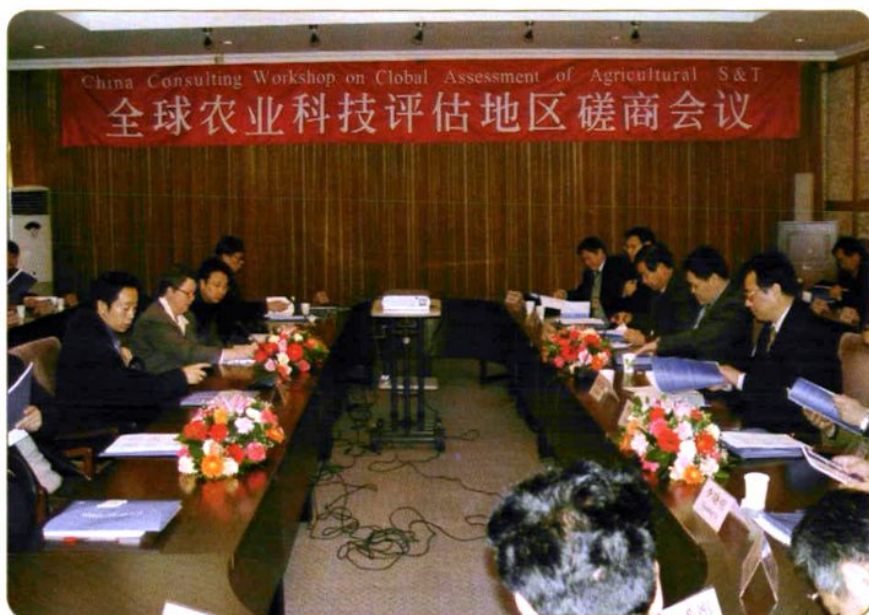
2003年11月，农业部、世界银行主办，农业部对外经济合作中心与农经所承办的“全球农业科技评估地区磋商会议”在中国农业科学院召开