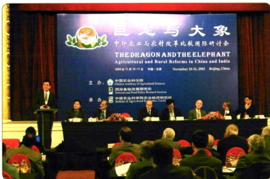
2003年11月，中国农业科学院与国际食物政策研究所主办，农业经济研究所承办，在北京召开的“巨龙与大象”中印农业与农村发展及改革经验国际研讨会会场。