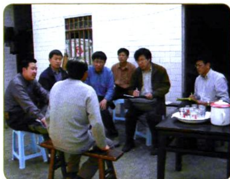
2004年4月农经所科研人员在贵州普定县考察农村贫困问题