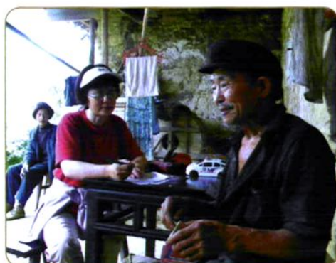
2008年9月农经所科研人员在重庆市武隆县调查贫困地区农村低保问题