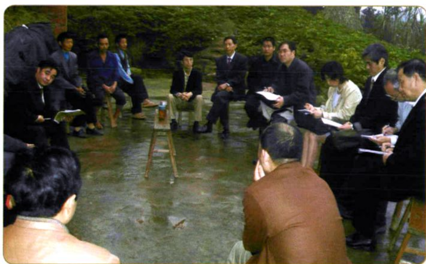
2005年8月农经所科研人员与日本农业经济专家共同在湖南常德考察农民合作经济组织问题