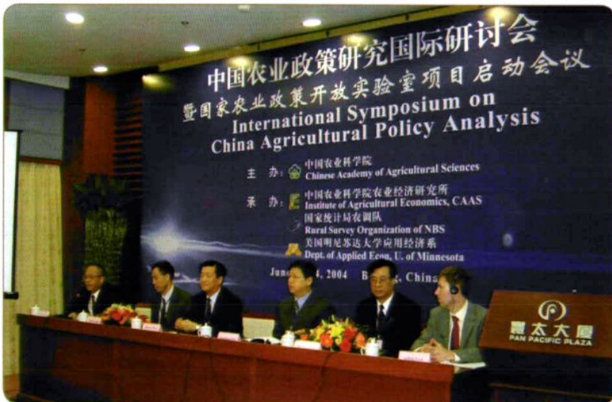
2004年6月，中国农业科学院主办，农经所、国家统计局农调队与美国明尼苏达大学应用经济系承办的“中国农业政策研究国际研讨会暨国家农业政策开放实验室项目启动会议”。