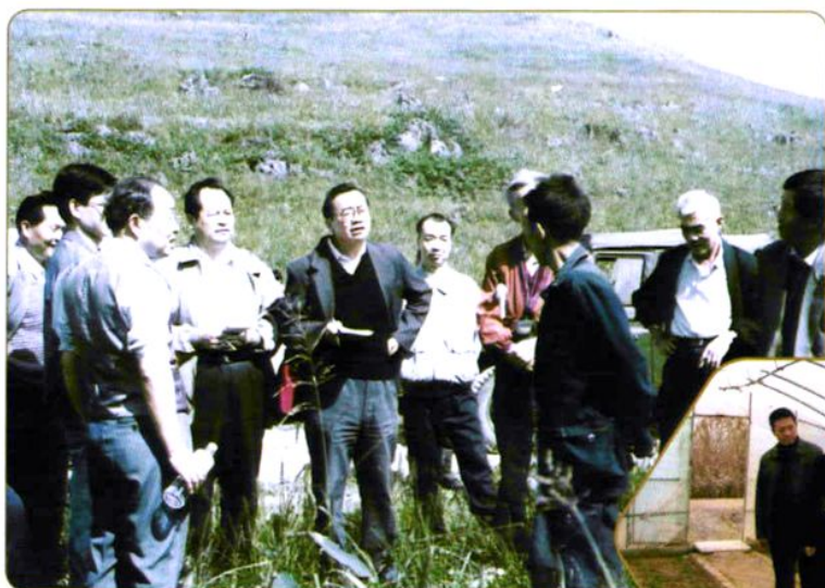
1985年农经所科研人员在湖北恩施考察 南方草山草坡的开发利用问题