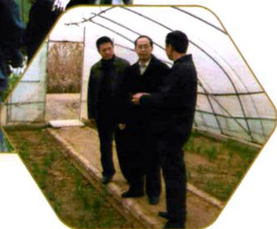
2007年12月农经所科研人员在重庆市 国家农业科技园考察园区建设问题