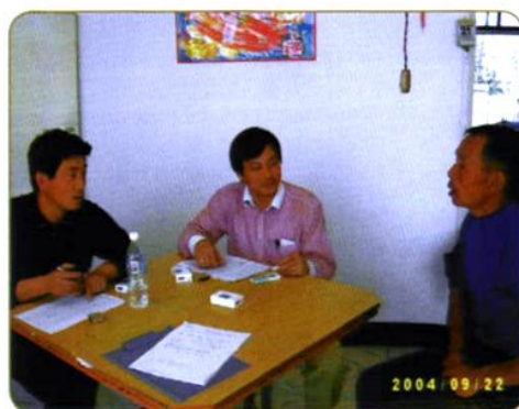
2004年农经所科研人员在黑龙江绥化调查水稻生产问题