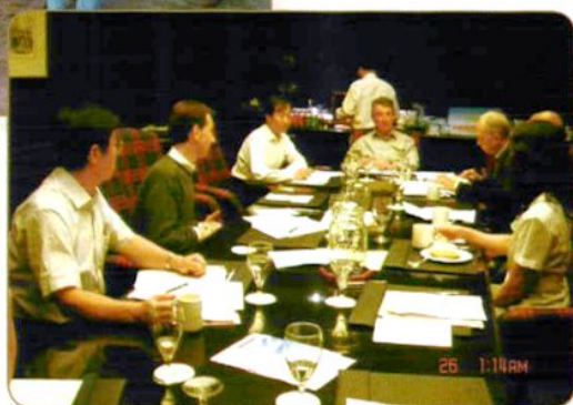
2008年7月秦富所长率团赴 美国参加IAAE执委会会议