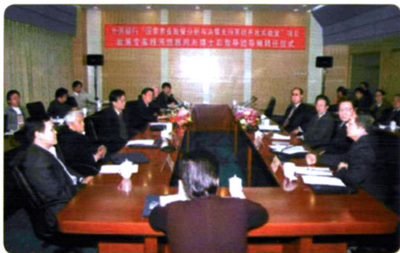
2005年12月，农经所举行世界银行“国家农业政策分析与决策支持系统开放实验室”项目政策专家组顾问与博士后指导团导师聘任仪式