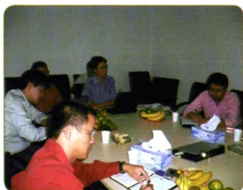
2007年9月农经所科研人员在天津市畜牧局调查猪肉质量安全可追溯系统的实施情况