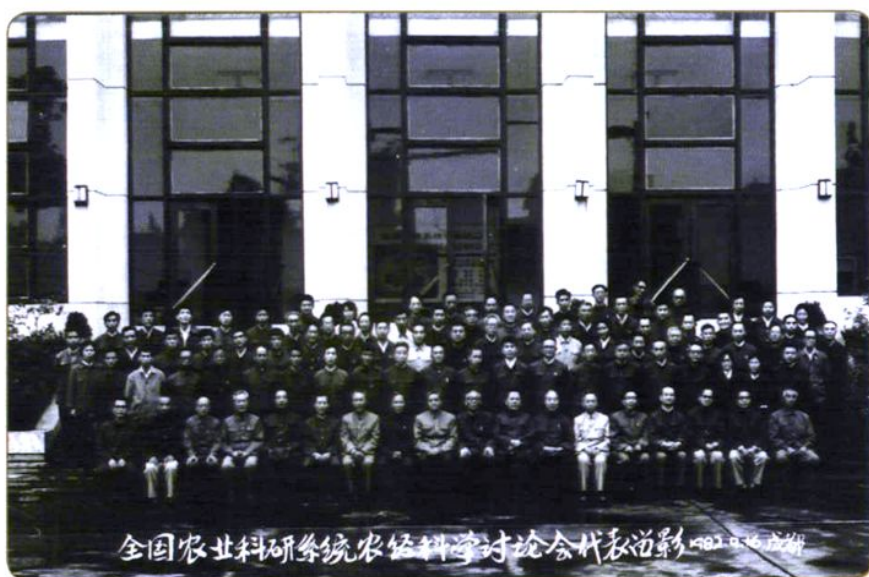
1982年9月参加由中国农业科学院主办、农业经济研究所承办，在成都召开的“全国农业科研系统农经科学讨论会”全体代表。