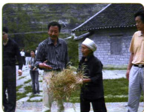
2007年7月农经所科研人员在湖南武陵山区调查农业生产问题