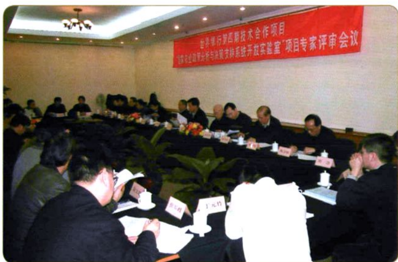
2005年12月，农经所召开世界银行第四期技术合作项目“国家农业政策分析与决策支持系统开放实验室”项目专家评审会议