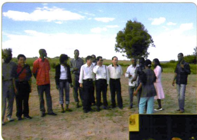
2006年9月农经所科研人员 赴安哥拉进行农业考察