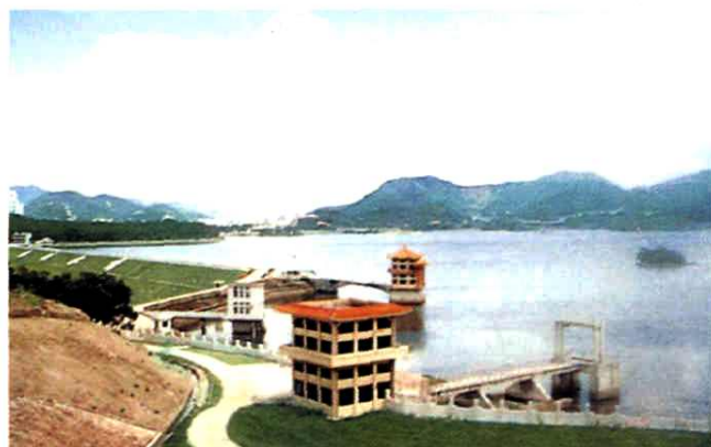
深圳水库东坝头取水建筑物 (向香港输水的起点) ▶