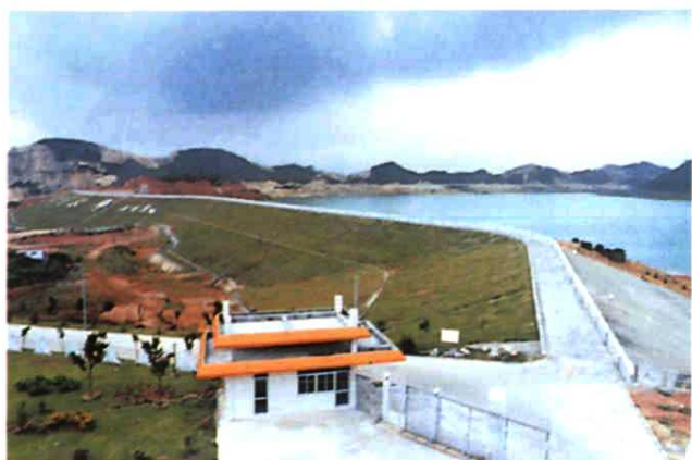
◀ 深圳市东部供水水源工程调 节水库—松子坑水库