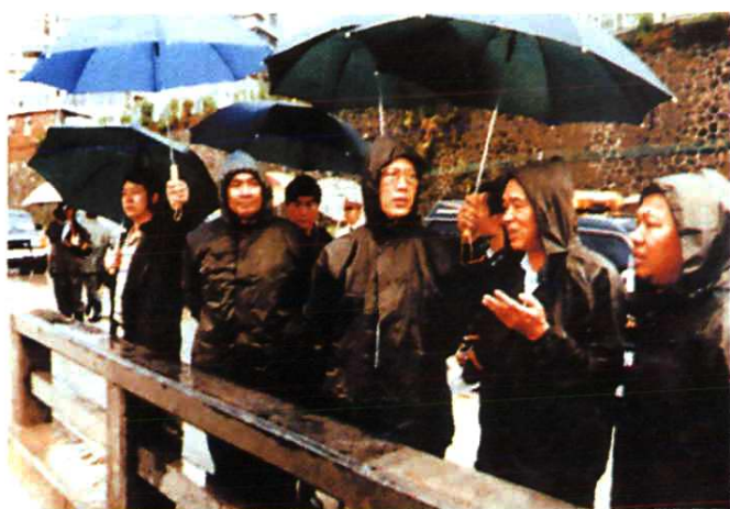
▲ 1998年夏，省委副书记、深圳市委书记张高丽、市委副书记李容根在市水务局长黄添元陪同下冒雨检查市区防洪工程。