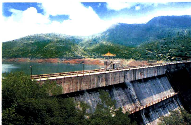
赤坳水库 (浆砌石重力坝) ▶