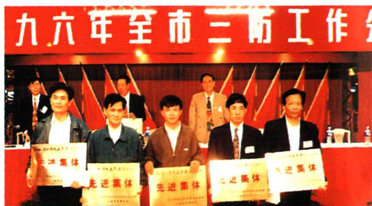
▲ 一年一度的市三防工作会议表彰先进集体。