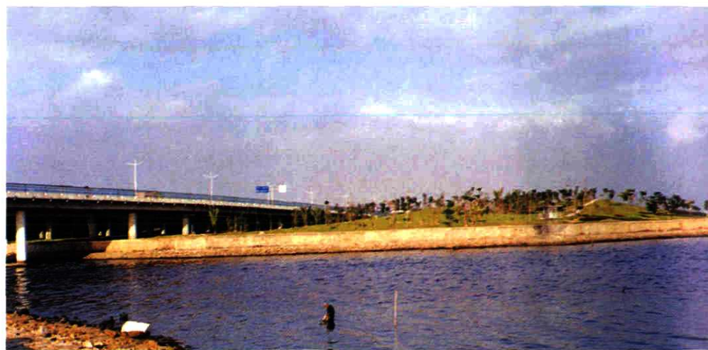
▲ 1998年治理后大沙河河口。