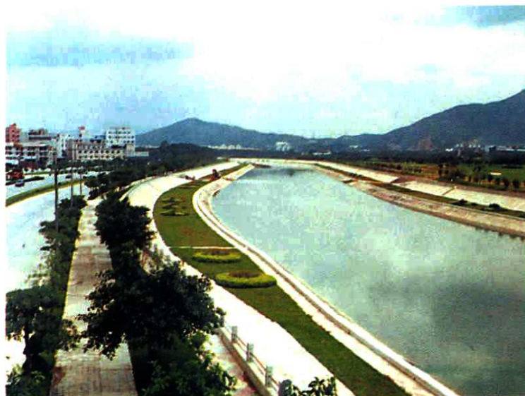
◀ 1997年治理竣工的一段大沙河。