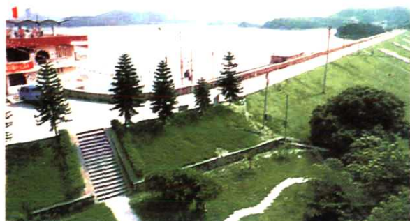
◀ 1986年加固扩建后的铁岗水库