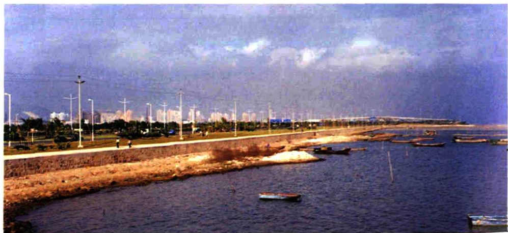
▲ 南山区后海湾防波堤。