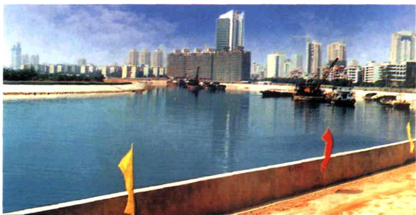
▼ 1997年竣工的深圳河渔民村下河段。