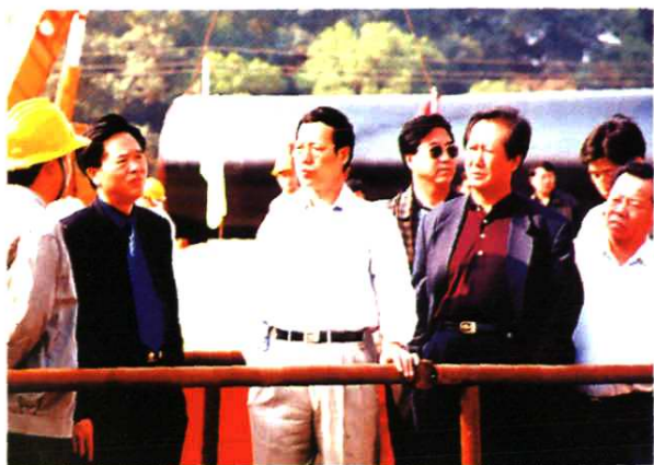
▲ 1998年秋，省委副书记、深圳市委书记张高丽，深圳市常务副市长李德成，在市水务局长黄添元陪同下视察东部供水水源工程施工现场。