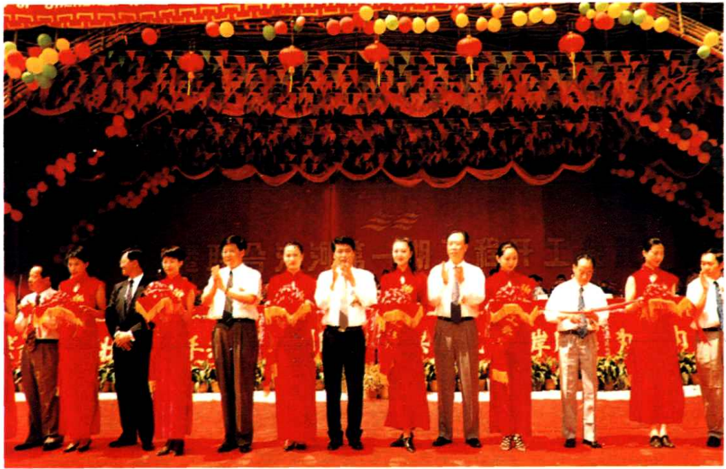
▲ 1995年5月，广东省政府、深圳市政府领导以及香港有关官员为治理深圳河一期工程开工典礼剪彩。下图为工程奠基场面。