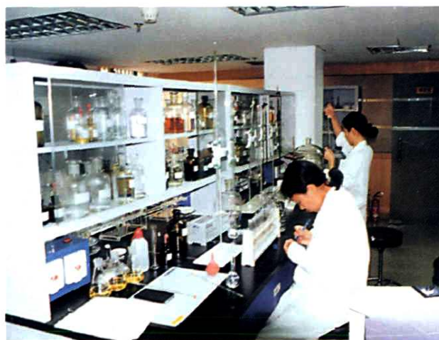
深圳市水质检测中心工 作人员在测试水样。