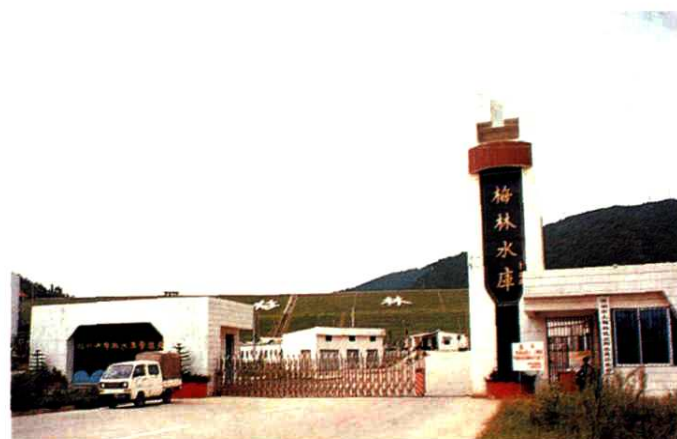
◀ 1993年建成的梅林水库