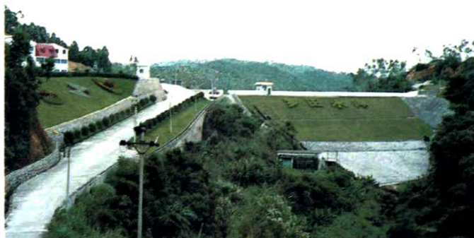
◀ 1997年治理后的罗田水库