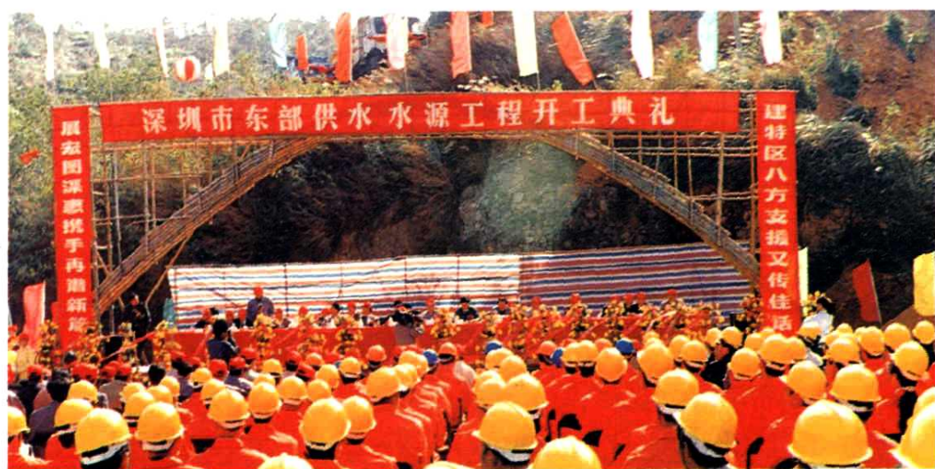
▲ 1996年11月30日，深圳市东部供水水源工程在惠阳永湖输水隧洞口举行开工典礼。下图，李子彬市长和其他领导为工程开工奠基。