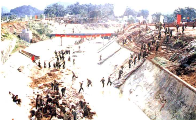
1996年夏，驻深解 放军和武警官兵数 千人清淤福田河。 ▶