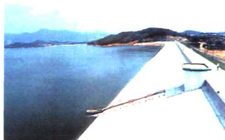
1995年加固改建后的 西沥水库主坝 ▶