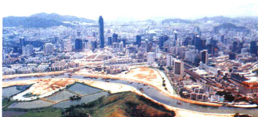
▲ 1996年施工中的治理深圳河工程渔民村河段。