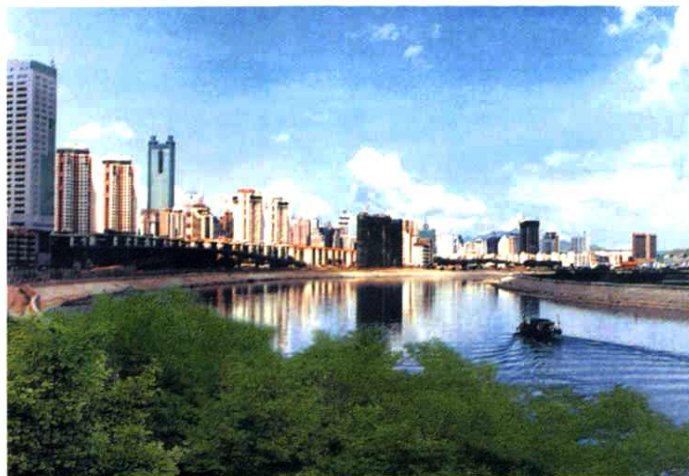
◀ 1996年整治后的深圳河 “料坳—赤尾”河段。