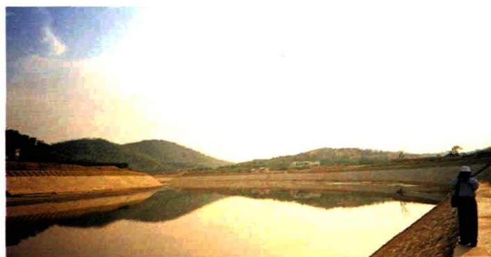
▼ 1998年底治理竣工的龙岗河油坑口和鲤鱼坝河段。 ▲