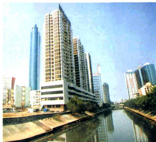
◀ 穿过深圳市区的一段布吉河。