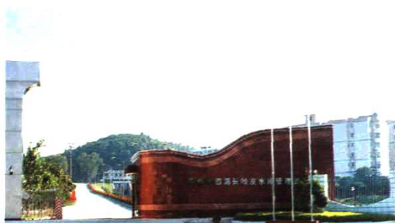
◀ 西沥—长岭皮水库管理处