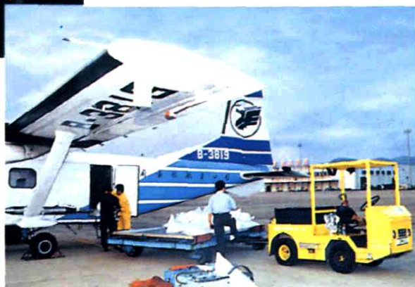
运用飞机播撒化学 物品，聚云降雨。