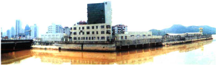
▼ 布吉河笋岗滞洪区自记水位测站