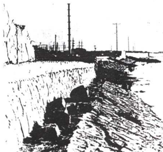
蓟运河防浪墙震毁残景