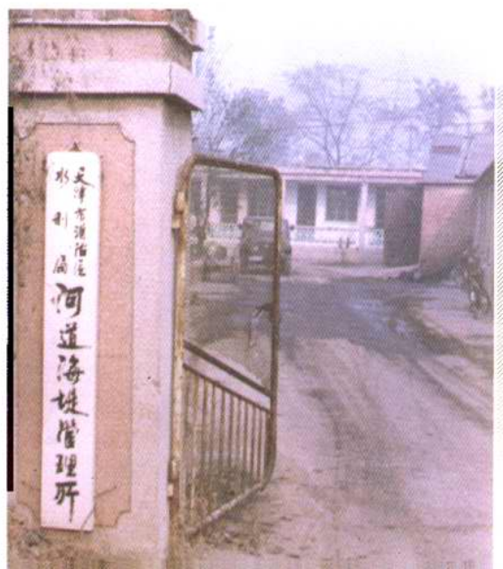
汉沽区河道海堤管理所