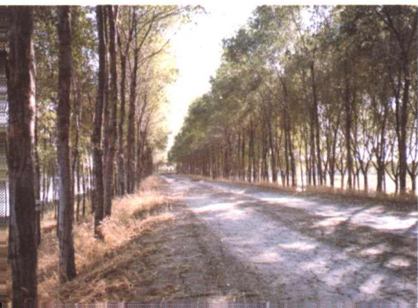
蓟运河大堤堤顶路面