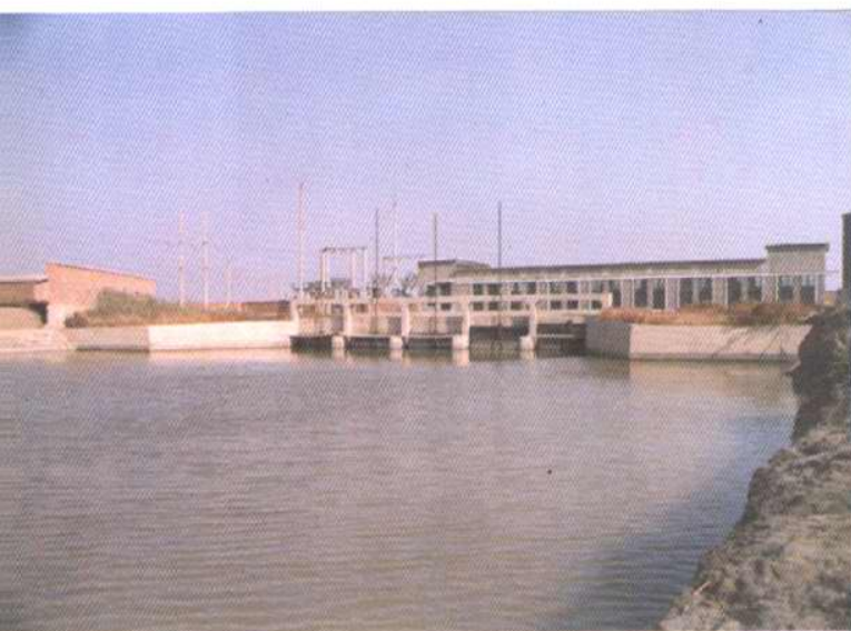
付庄排水站及站内机组