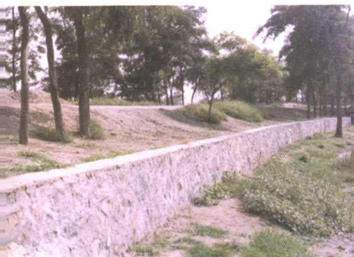
蓟运河农村段防浪墙