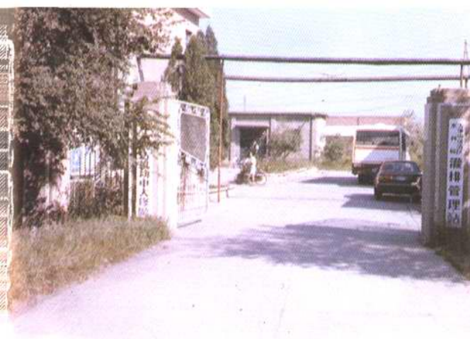
汉沽区灌排管理站办公地点