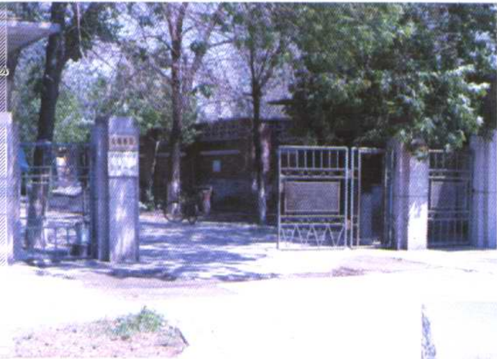
汉沽区河西二经路处的城市 生活供水泵站