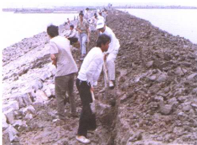
汉沽盐场张家新沟段海挡 护坡工程正在施工