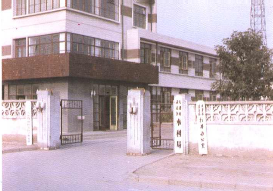
汉沽区水利局办公楼