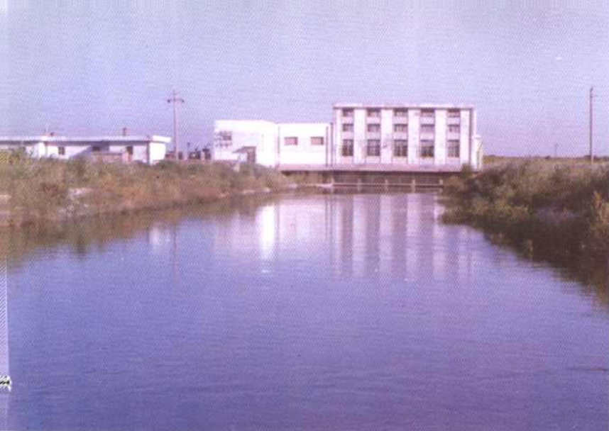
营城水库蓄水泵站