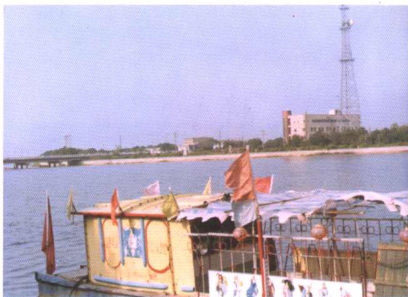
蓟运河上的游乐船