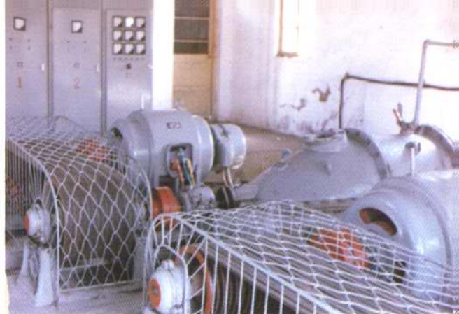
大田灌排站及站内机组