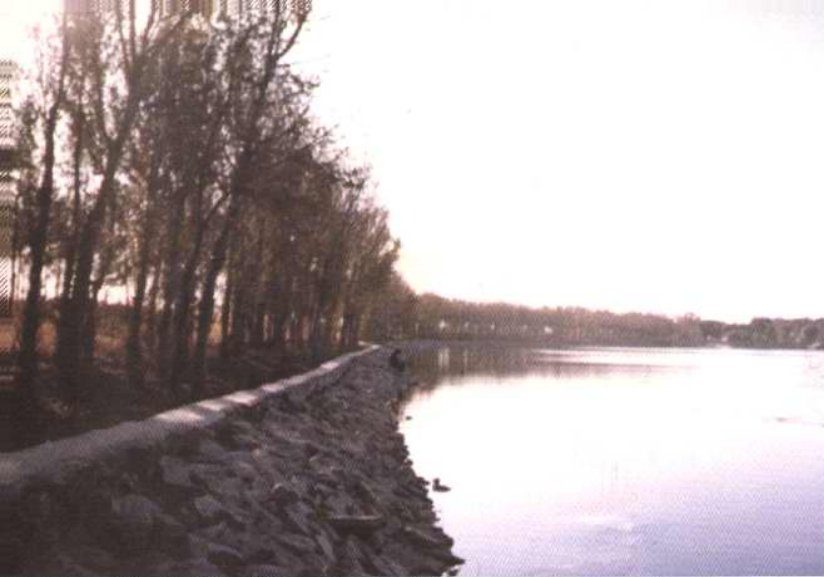
蓟运河干砌片石护坡