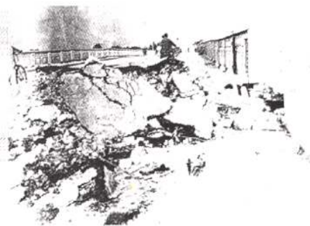
蓟运河察上大桥震损残景