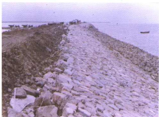
汉沽盐场火神庙段海挡 干砌石护坡工程