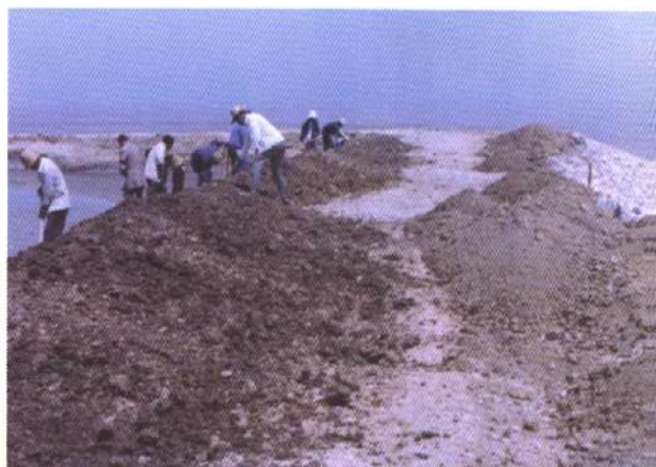
蛭头沽海挡护坡工程正在施工