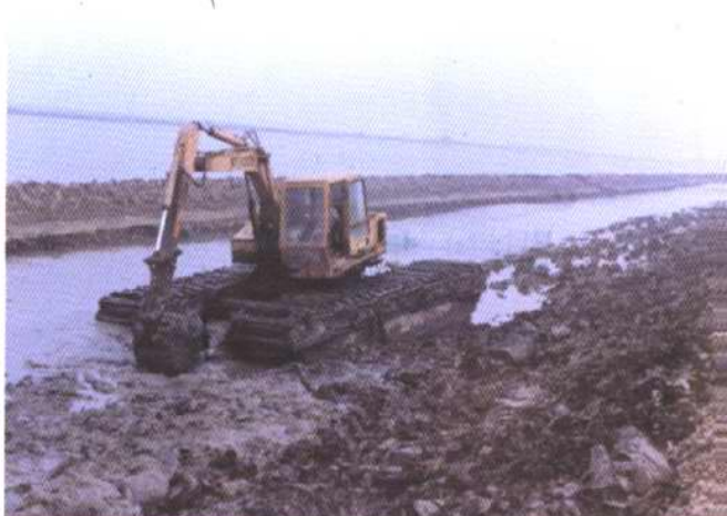
汉沽区盐场段海挡 水陆两用挖掘机正在挖泥复堤