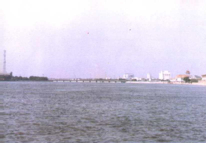
蓟运河宽阔的水面纵贯汉沽区