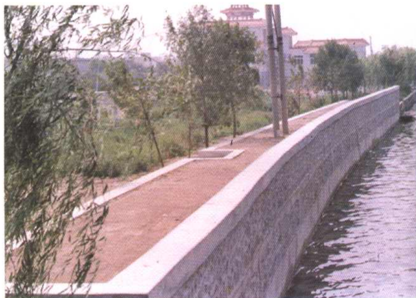
蓟运河城市段防浪墙