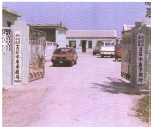
汉沽区高庄水库管理所办公地点