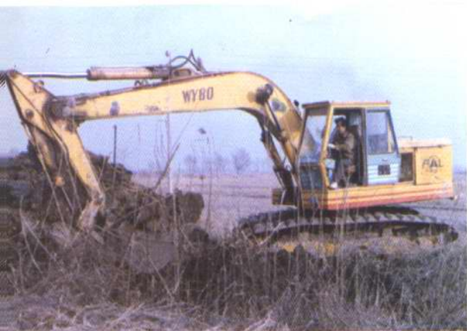
冬季农田清淤干支渠工程