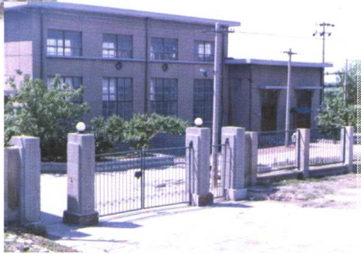
城区福顺街排水泵站