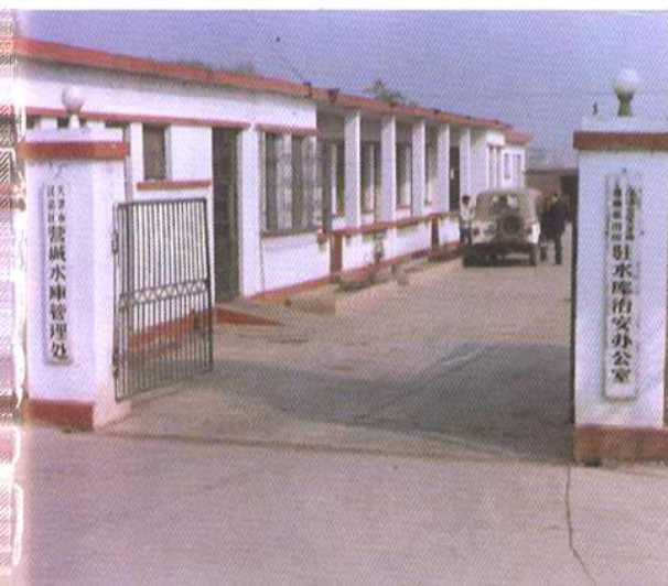
汉沽区营城水库管理处办公地点