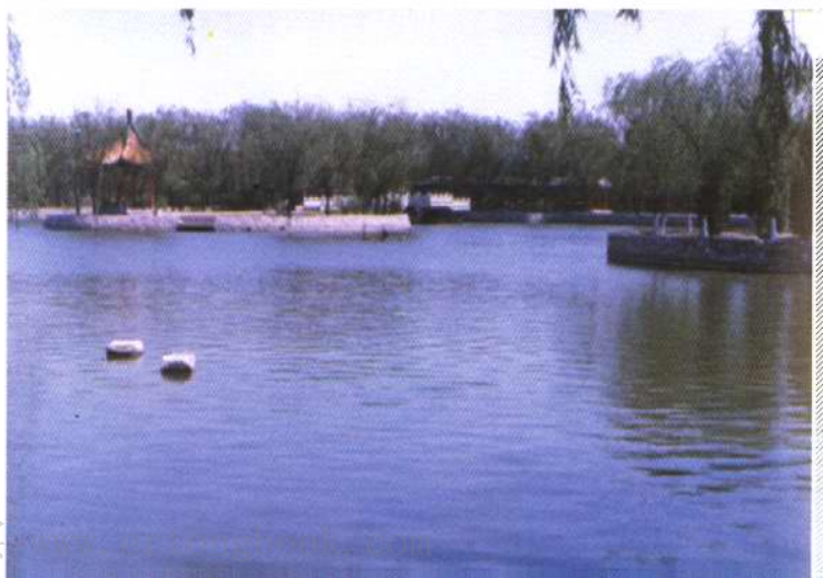
城区环境美化用水