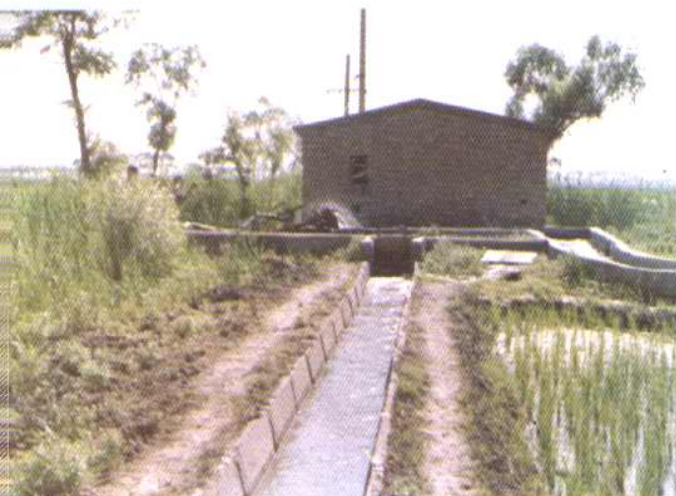
田间机井站抽水入防渗渠道