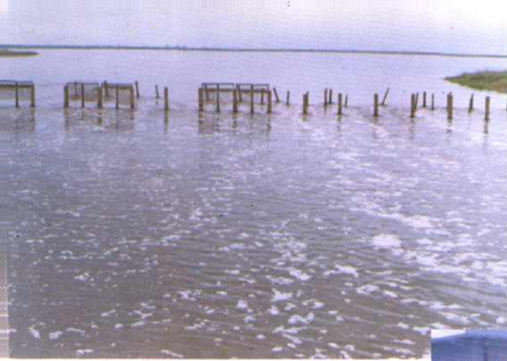
汉沽区工业污水库拦污自然氧化塘