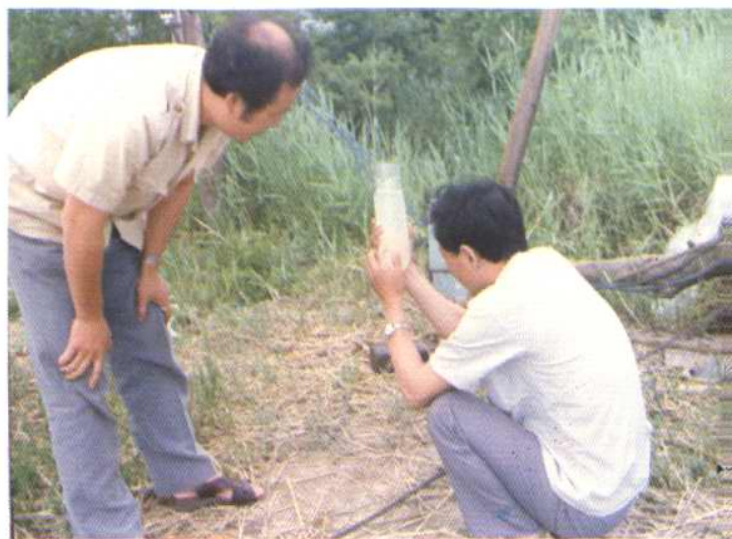
地下水管理人员进行水样检测