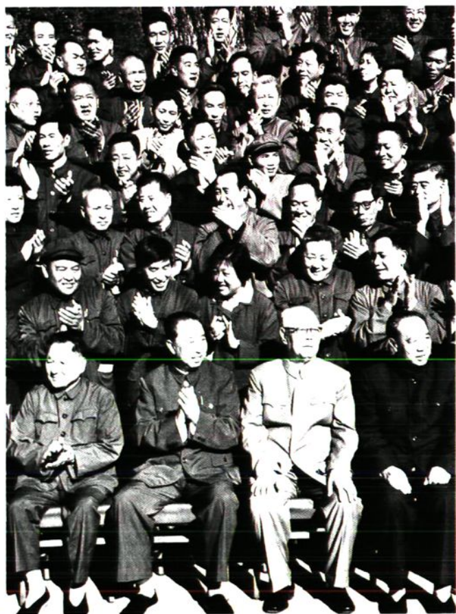
1977年8月，邓小平、华国峰等国家领导人接见中国共产党第十一次党代会代表（二排左二为“毛泽东号”第七任司机长陈福汉）