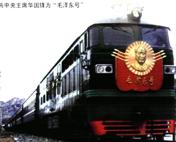
1977年12月24日中共中央主席华国锋为“毛泽东号” 机车题写车名