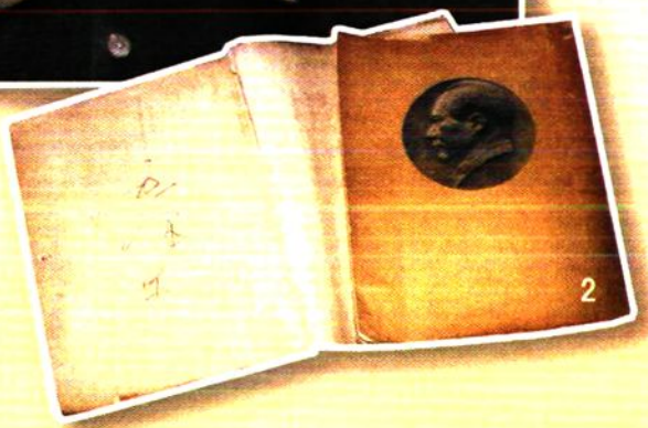
2. 毛泽东为郭树德亲笔签名的《毛泽东选集》