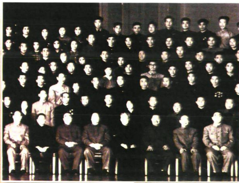
◀ 1964年10月5日，毛泽东、刘少奇、朱德、邓小平接见国庆十五周年劳模观礼代表（三排右起第6人为“毛泽东号”第五任司机长蔡连兴）