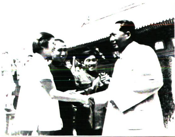
1954年8月22日，毛泽东在接见北京市人大一届一次会议代表(左三为“毛泽东号”机车第三任司机长郭树德)。