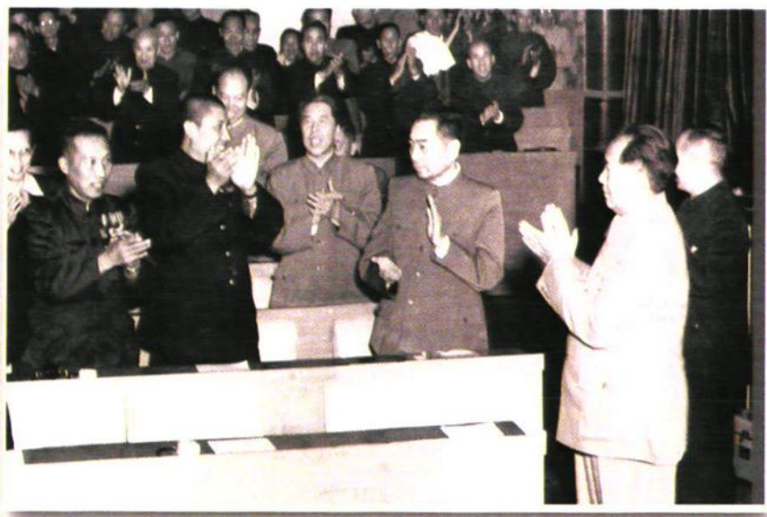
1950年9月25日，毛泽东、周恩来在全国人大一届一次会议上亲切接见包括全国铁路系统第一位全国劳模“毛泽东号”第二任司机长李永（左二）在内的会议代表