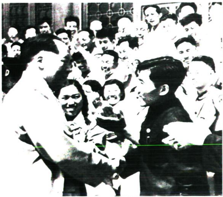
1954年8月22日，毛泽东在接见北京市人大一届一次会议代表时同“毛泽东号”机车第三任司机长郭树德亲切握手。