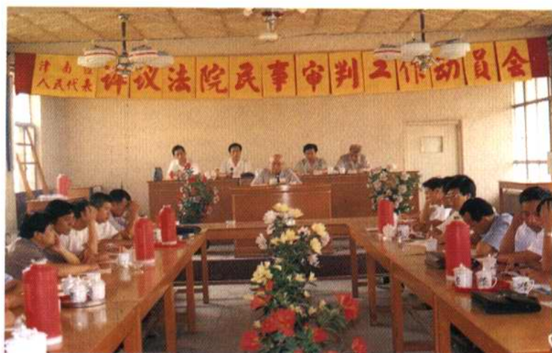
评议法院民事审判工作动员会