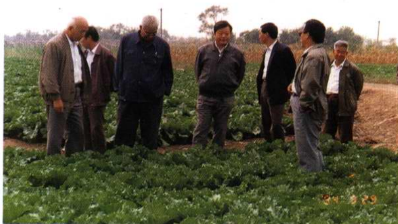
区人大代表视察特种蔬菜、大白菜