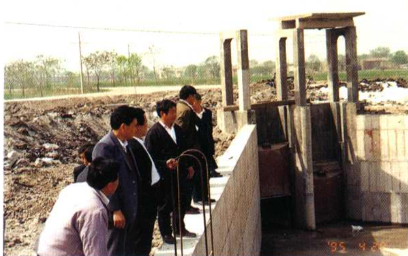
区人大农业代表组视察四面平交闸