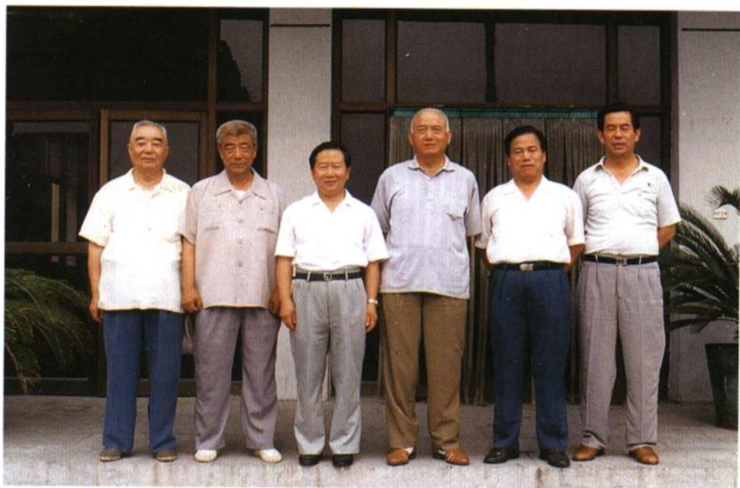
第十二届区人大常委会正副主任