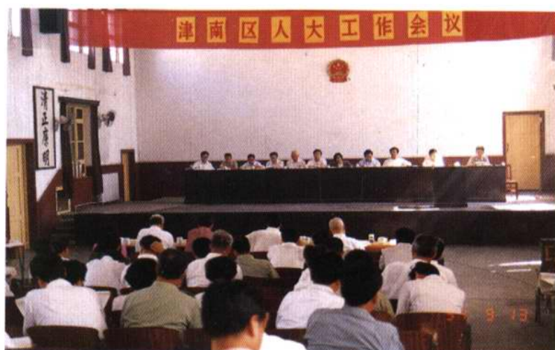
区委召开的首次人大工作会议