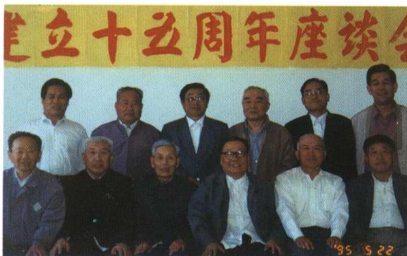
8—12届部分人大领导合影