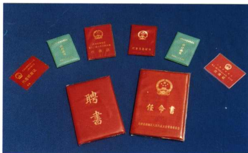
区人大颁发、使用的证书证件