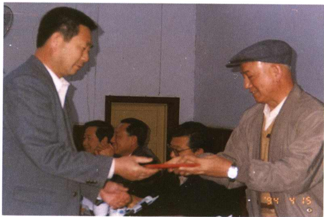
区人大常委会召开颁发任命书大会