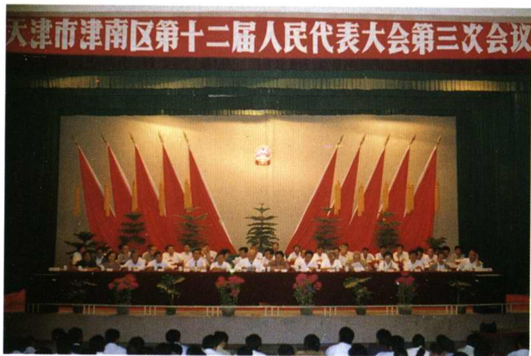
区人民代表大会召开盛况