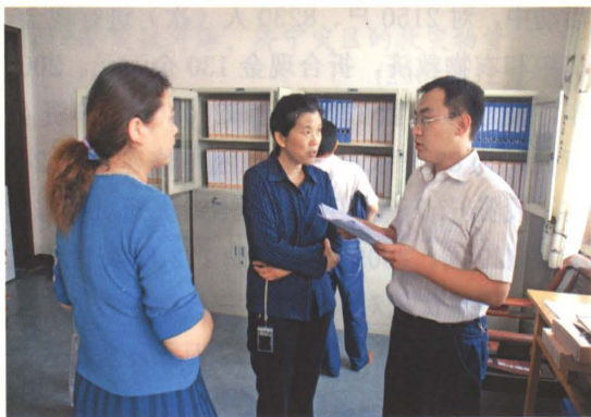
图21-1 县村务公开工作领导小组到基层检查村务公开民主管理工作 (2010年6月 摄)

村务公开规范程序，实现阳光村务立体互动；完善民主管理模式，实现民主决策立体互动；优化村级工作方法，实现两委建设立体互动；开展镇村纵横联结活动，实现比学赶帮立体互动；实施优质服务惠农措施，实现巩固村级自治立体互动；建立多方位监督机制，实现多种监督立体互动。2011年，印发《济阳县村务公开目录》《济阳县村务公开民主管理实施细则》等文件，全县推广“一访四议两公开”（村党支部走访老党员、老干部和群众代表征求意见，了解群众需求；村级事务由党支部提议，村“两委”商议，党员大会再议，村民代表和村民大会决议；决议公开、结果公开）的民主管理模式。全县所有村（居）均成立村务监督委员会。