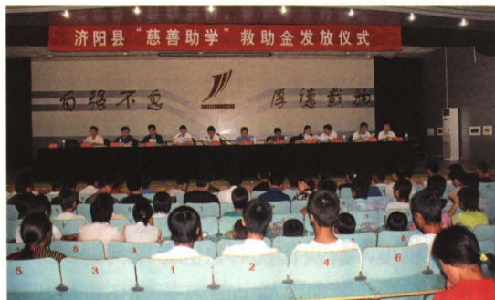
图21-3 慈善助学金发放仪式 (2007年8月 摄)

2005年,县政府印发《关于建立城乡医疗救助制度的实施意见》,通过政府拨款和社会各界自愿捐助等多渠道筹资,对患大病农村五保对象、困难优抚对象和城乡低保户等贫困家庭实行医疗救助,并就如何做好城乡医疗救助工作、救助对象、救助方式范围、具体救助办法、申请和审批程序、基金的筹集和管理等做出具体规定。2010年,印发《关于建立城乡居