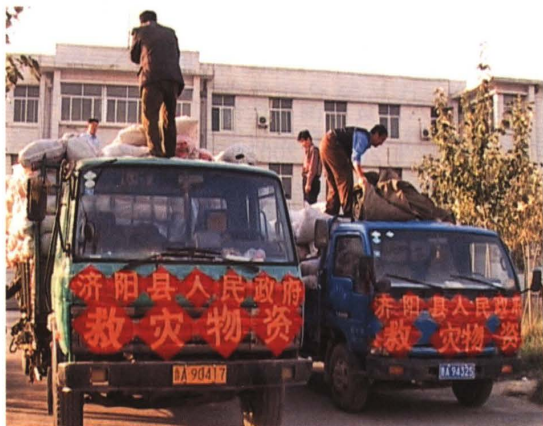
图21-2 发往菏泽、济宁灾区的救灾物资 (2003年12月 摄)

2008年,向四川省汶川地震灾区捐款和捐物折价826.9万元。2010年4月14日,青海省玉树县发生地震,全县人民向灾区捐款捐物折价74.8万元。