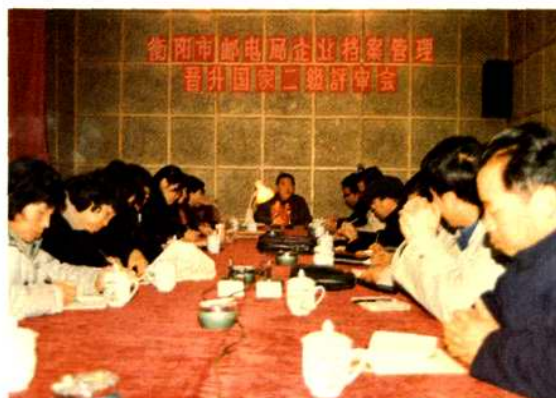
1989年衡阳市邮电局企业档案管理晋升国家二级评审会