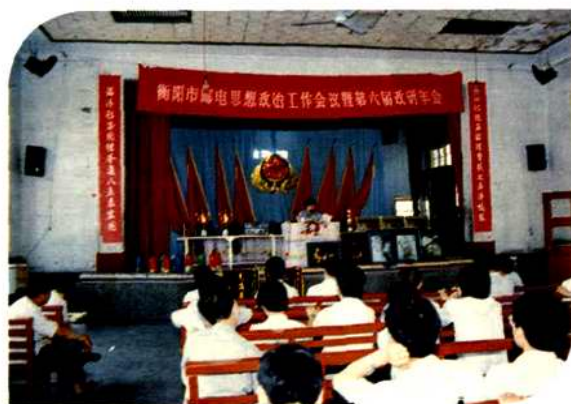
衡阳市邮电局思想政治工作会议 暨第六届政研年会