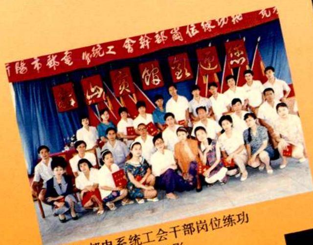
衡阳市邮电系统工会干部岗位练兵 知识竞赛全体代表合影