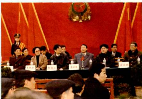
衡阳市市长贺同新(前排右2) 副书记陈安众(前排左3) 市人大副主任王美斌(前排右1) 副市长李湘源(前排左2) 湖南省邮电管理局副局长李国栋(前排右3) 等参加衡阳市长途通信传输大楼奠基典礼