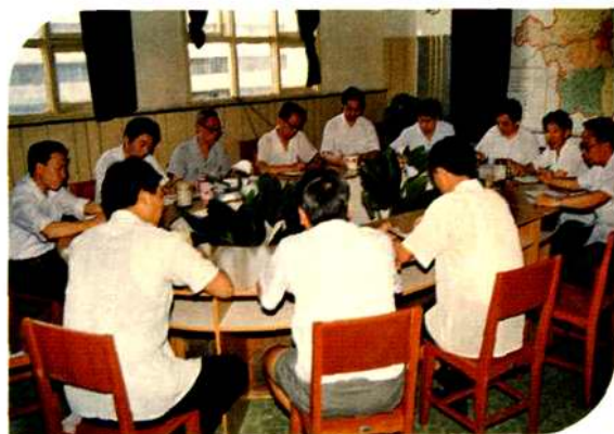
衡阳市邮电局局长办公会