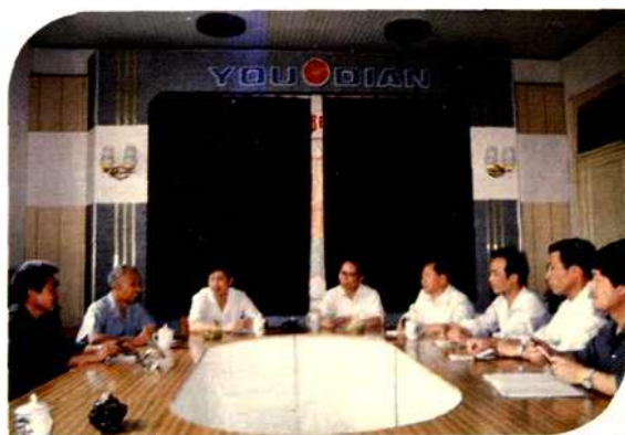
1992年4月衡阳市邮电志编纂委员会 成员及邮电志办公室人员研究工作