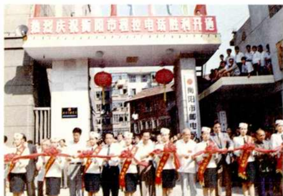
衡阳市人大主任彭仁阶(前排左1),原衡阳地委秘书长、离休老干部王来苏(前排左3),衡阳市市长何文彬(前排左5),湖南省邮电管理局副局长李国栋(前排左7),湖南省计划委员会副主任肖大雍(前排左9),湖南省人大常委会委员廖仁科(前排左11),法国驻长沙总代理利比希(前排左13),原衡阳地区副专员、老红军陈鹏(左15),衡阳市市委书记苏建民,衡阳市政协主席李明来,常务副市长钟名智,副书记陈伯槐等领导参加1992年10月2日衡阳市程控电话开通典礼剪彩