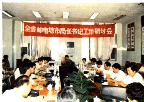
1994年6月在衡阳市召开全省邮电地市局长书记工作研讨会