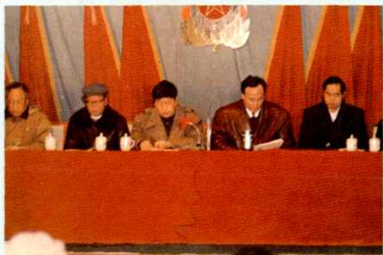
衡阳市市委书记颜永盛(右2)参加衡阳市邮电工作会议