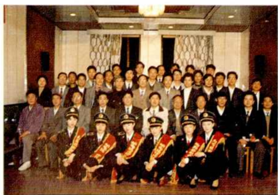
衡阳市邮电局程控电话由6位升7位,局领导与技术人员,工作人员合影