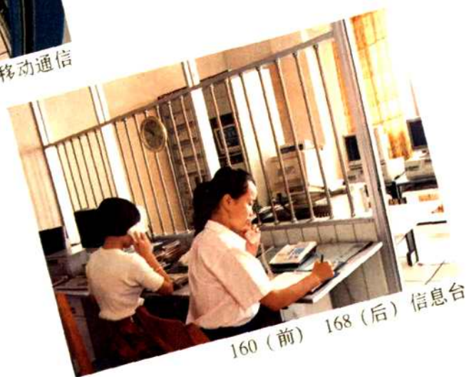
160 (前) 168 (后) 信息台