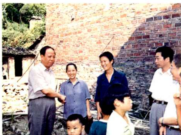
1994年邮电部副部长林金泉(左1)慰问 衡阳县介牌邮电支局遭受水灾职工