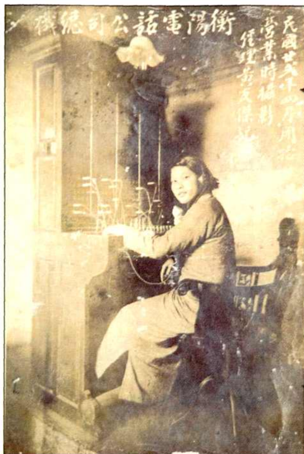
民国 22 年 4 月衡阳电话公司总机及女话务员