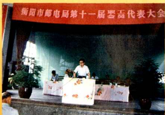
衡阳市邮电局第十一届职工会员代表大会