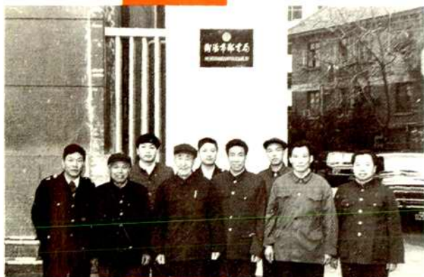
1988年1月14日原邮电部部长文敏生 (前排左3)视察衡阳市邮电局