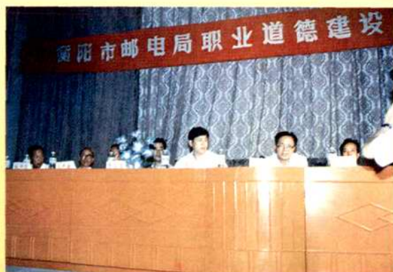
衡阳市邮电局职业道德建设动员大会