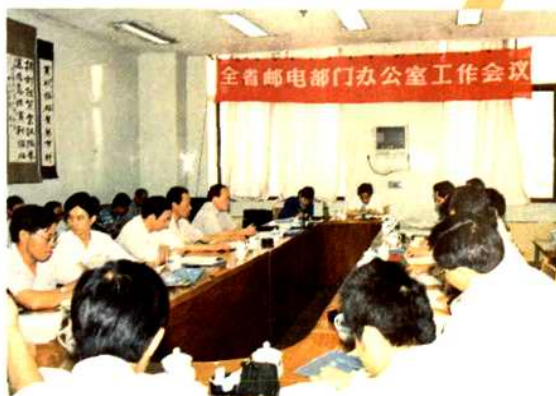
1994年在衡阳市召开全省邮电部门办公室工作会议