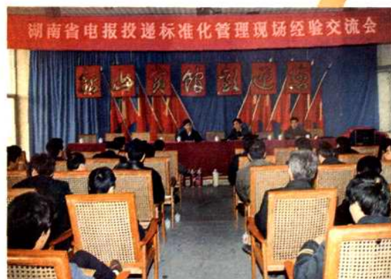
1993年在衡阳市召开湖南省电报投递标准化管理现场经验交流会