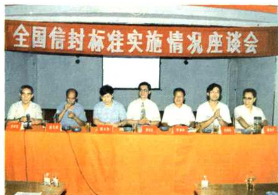
1994年在南岳召开全国信封标准实施情况座谈会