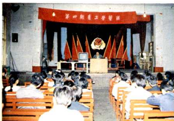
第四期青工学习班