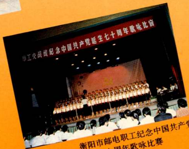
衡阳市邮电职工纪念中国共产党 诞生七十周年歌咏比赛