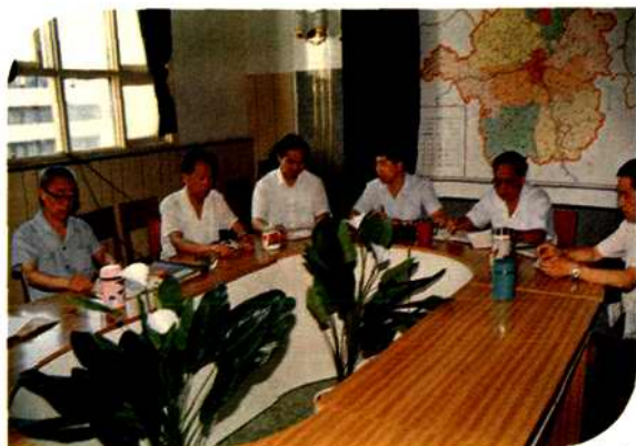
中共衡阳市邮电局党委一班人 在认真研究通信发展规划