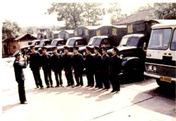
邮件运输班出班之前坚持召开班前会， 班长强调安全及有关注意事项