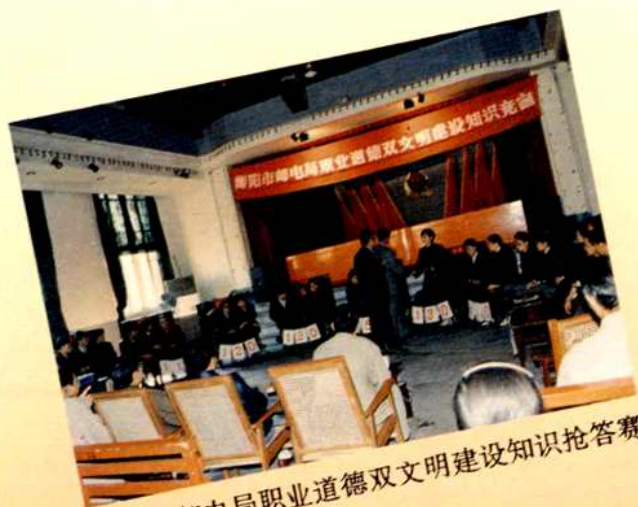
衡阳市邮电局职业道德双文明建设知识抢答赛