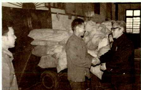
1985年邮电部副部长宋直元(右)视察衡阳市邮电局时在邮件转运班与职工亲切交谈