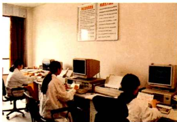
邮政储蓄微机处理