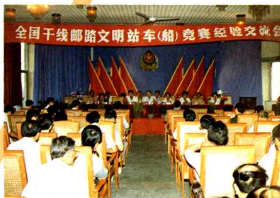
1991年9月在衡阳市召开全国干线邮路文明站车(船)竞赛经验交流会