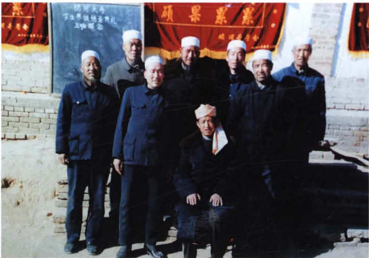
● 往届寺管会班子成员