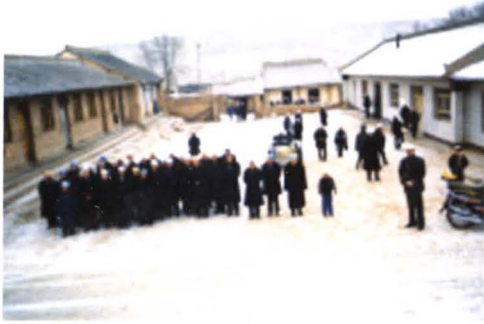
● 1980年代的确河城清真大寺