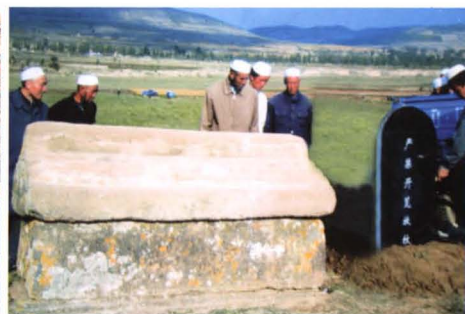
● 苏家大坟中的石墓基和石盖板