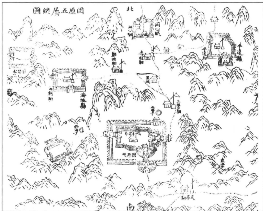
图 1-1 固原五属总图(见王学伊《宣统新修固原直隶州志(一)》,第 58 页)

硝河地处唐代开拓的“萧关道”辐射之地。宋夏时期,北宋以镇戎军为中心,东南西北各有干道,其中西去有二路:一路经怀远城(今西吉县偏城乡)到德胜寨(今西吉县硝河乡),南往羊牧隆城、隆德寨和静边寨等地(葫芦河流域);另一路由德胜寨北去宁安寨(今西吉县白城子乡),再达西安州。 ①