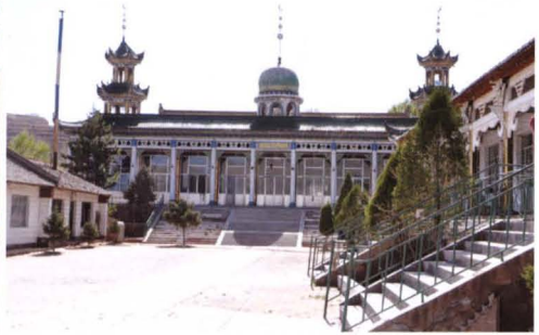
● 现在的确河城清真大寺