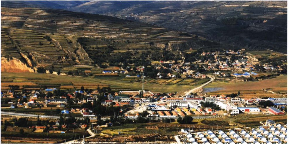
● 确河古城与确河乡政府驻地