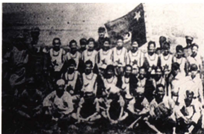
● 红军战士剧社在硝河城给红二方面军演出节目