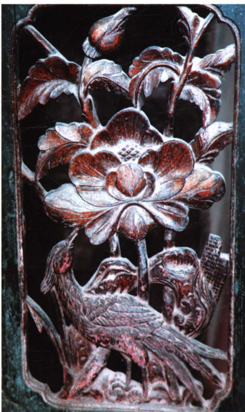
● 硝河城清真大寺收藏的桌案雕花