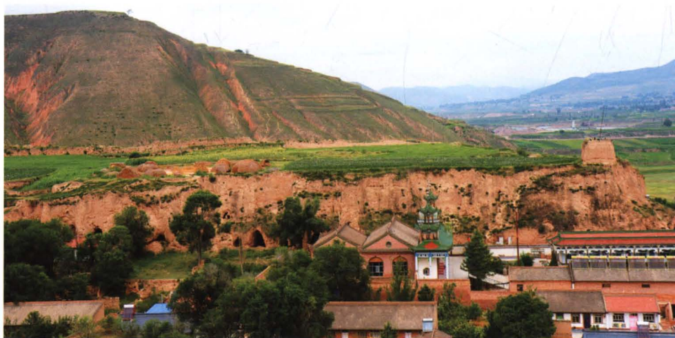
● 图正面为硝河城清真大寺、明代满四官邸遗址、红二方面军 1936 年 10 月住过的窑洞遗址