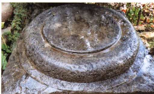
● 明代建造硝河城清真大寺时用过的柱顶石