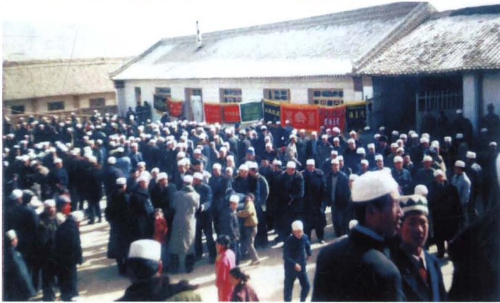
● 确河城清真大寺搬请教长场面