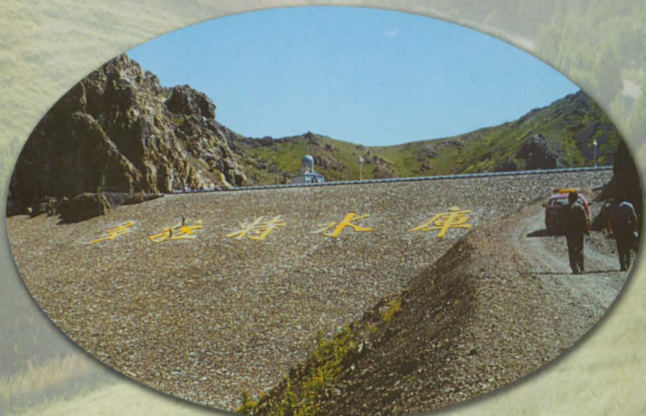
塔城地区多拉特水库大坝。