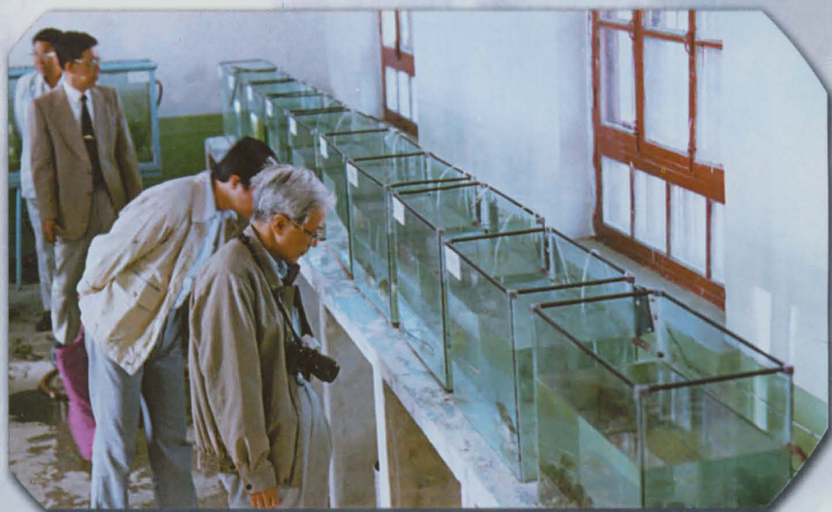
国家农业部水产司 司长余大龙在伊犁州考察当地土著鱼类品种。