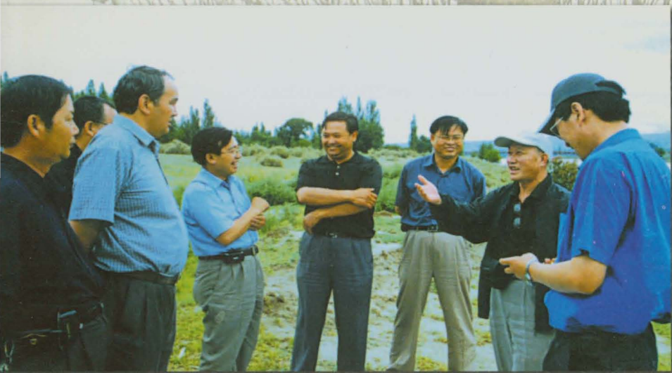
自治州州长努尔兰·阿布都满金、州长助理万水专程检查水利工程时与州水利局领导交谈。