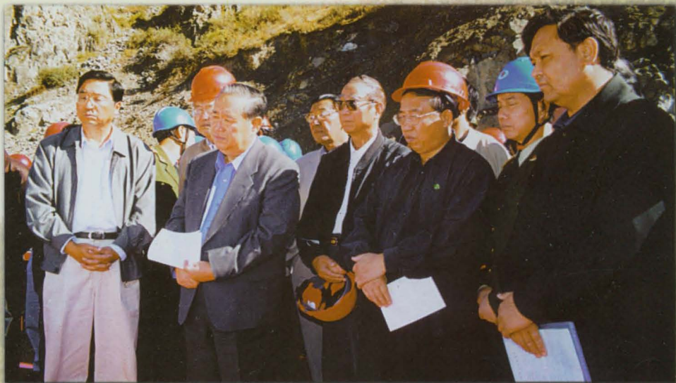
2002年9月17日，全国人大副委员长姜春云在伊犁州党委副书记张国梁陪同下视察重点工程吉仁台电站工地。