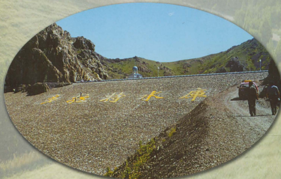
塔城地区多拉特水库大坝。