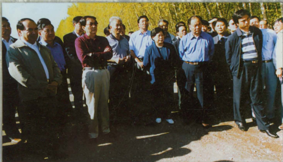
2000年9月4日, 中央政治局常委、国务院总理朱镕基及夫人、国家水利部部长汪恕诚在自治区党委书记王乐泉、自治区人民政府主席阿不来提·阿不都热西提、自治州党委书记林天锡、自治州党委副书记张国梁陪同下视察伊犁州喀什河总干渠渠首。