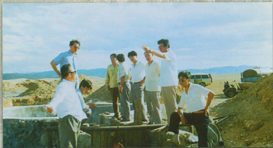
州水利局局长朱赐干在视察改水防病工程建设。