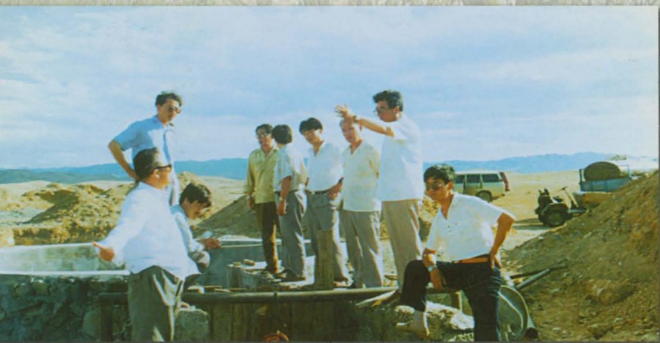
州水利局局长朱赐干在视察改水防病工程建设。