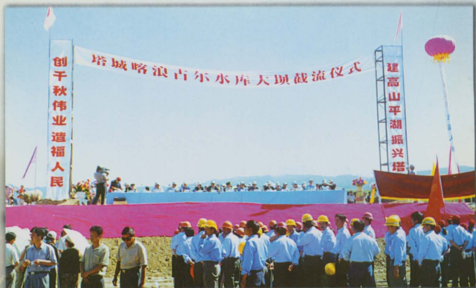
塔城地区喀浪古尔水库大坝截流仪式。