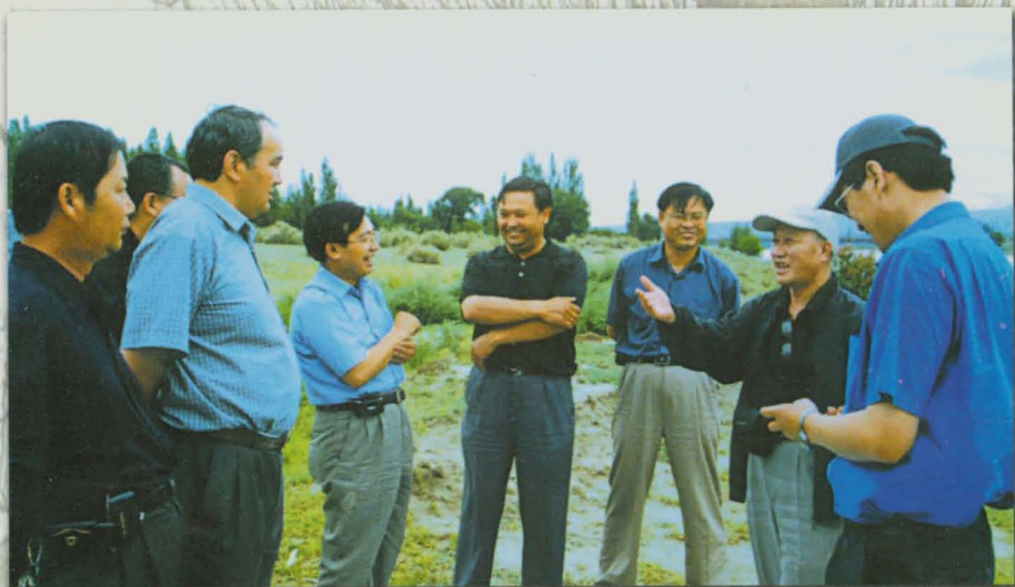
自治州州长努尔兰·阿布都满金、州长助理万水专程检查水利工程时与州水利局领导交谈。