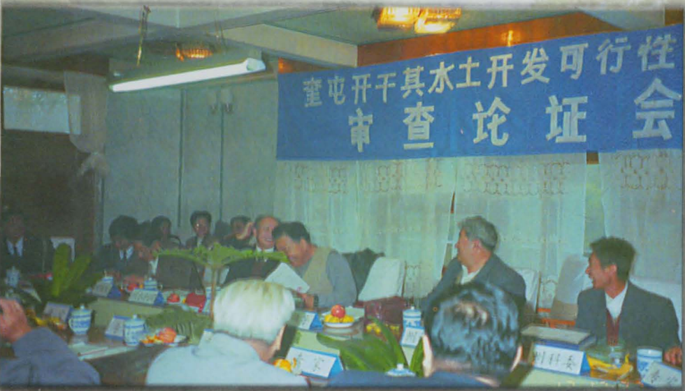
伊犁州奎屯市召开开干其水土开发可行性报告审查论证会。