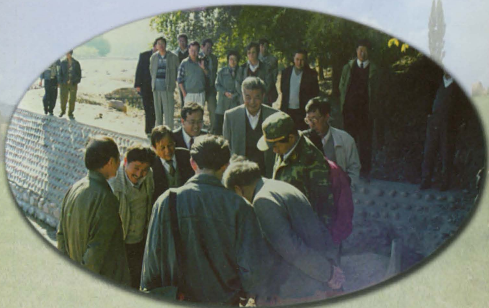
中国国际咨询公司的专家在伊犁州水利工程现场考察。