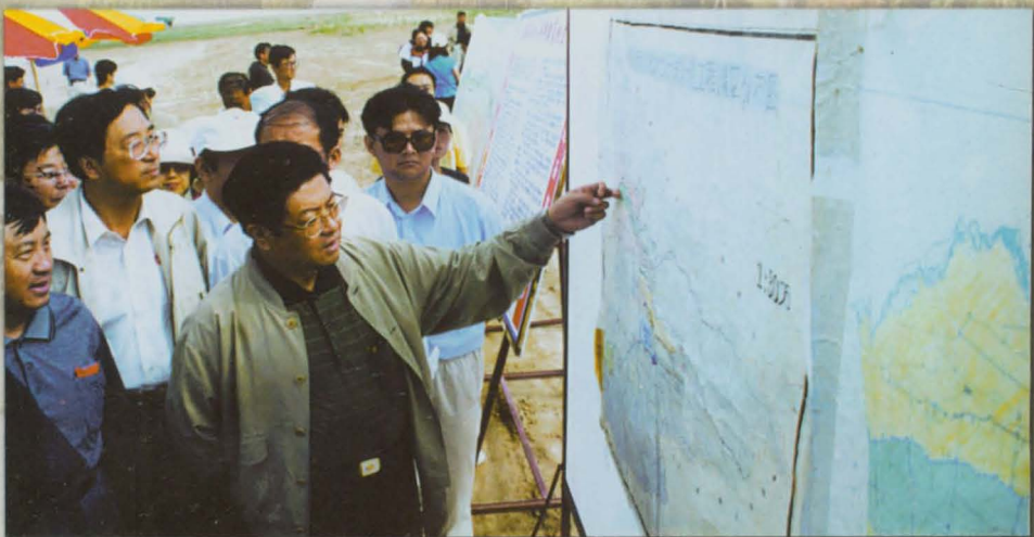
2000年5月29日，全国政协副主席王兆国在自治州党委书记林天锡、副书记张国梁陪同下视察伊犁南岸大渠时作现场调查。