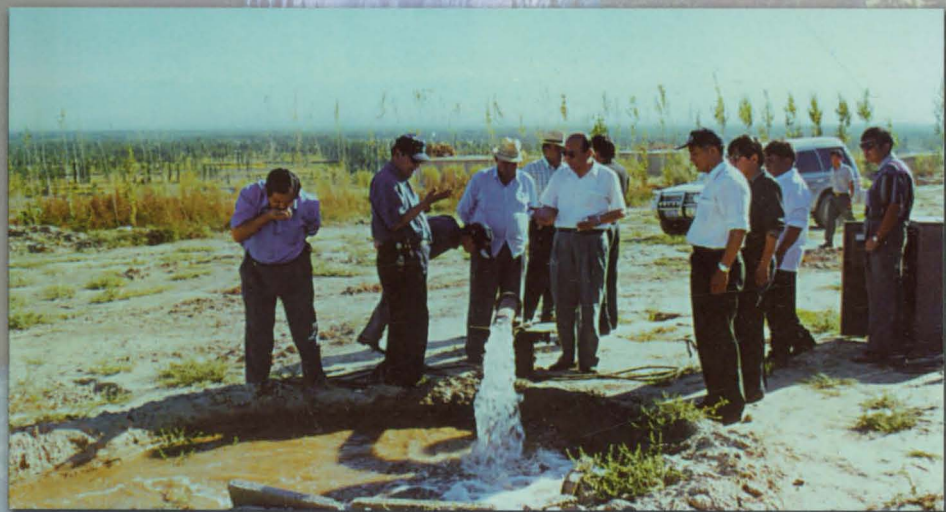
自治区水利厅厅长吐尔逊·托乎提在伊犁州检查工作。