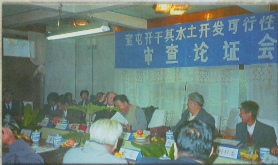
伊犁州奎屯市召开开干其水土开发可行性报告审查论证会。