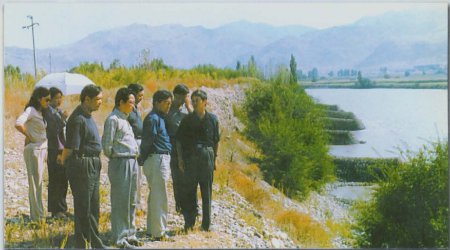
州水利局党组书记、副局长巴合提亚尔检查喀什河防洪堤建设情况。