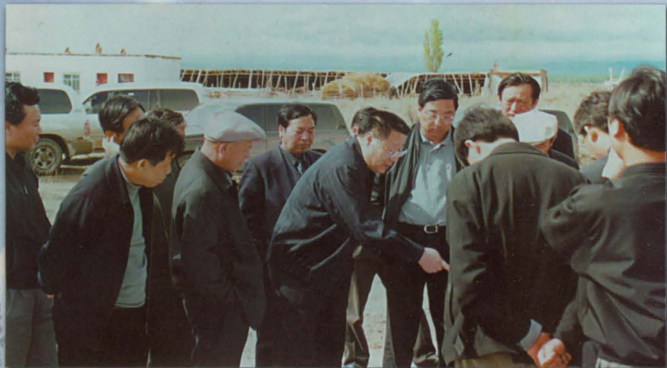
2002年4月19日,国家水利部副部长张基尧在自治区人民政府副主席熊辉银、自治州党委副书记张国梁陪同下视察霍城县西部莫乎尔沙漠生态。