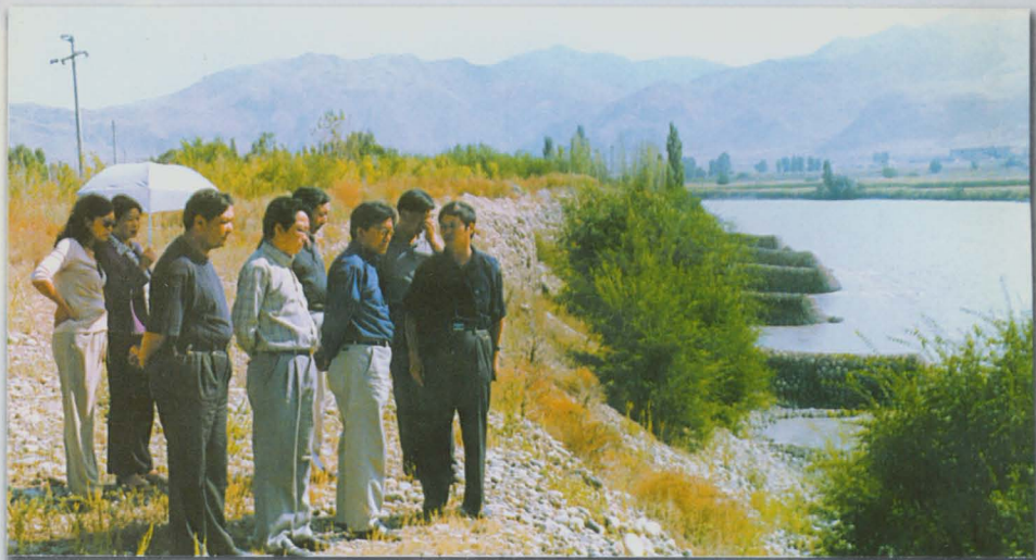
州水利局党组书记、副局长巴合提亚尔检查喀什河防洪堤建设情况。