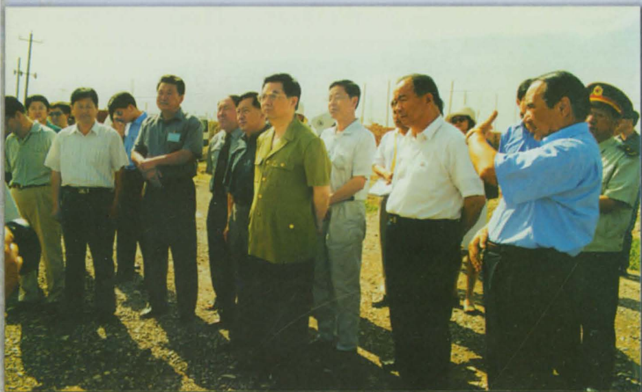
2001年6月10日, 中央政治局常委、国家副主席胡锦涛在自治区党委书记王乐泉、自治区人民政府主席阿不来提·阿不都热西提、自治州党委书记林天锡、自治州人民政府州长阿拉布斯拜陪同下视察伊犁河南岸大渠。