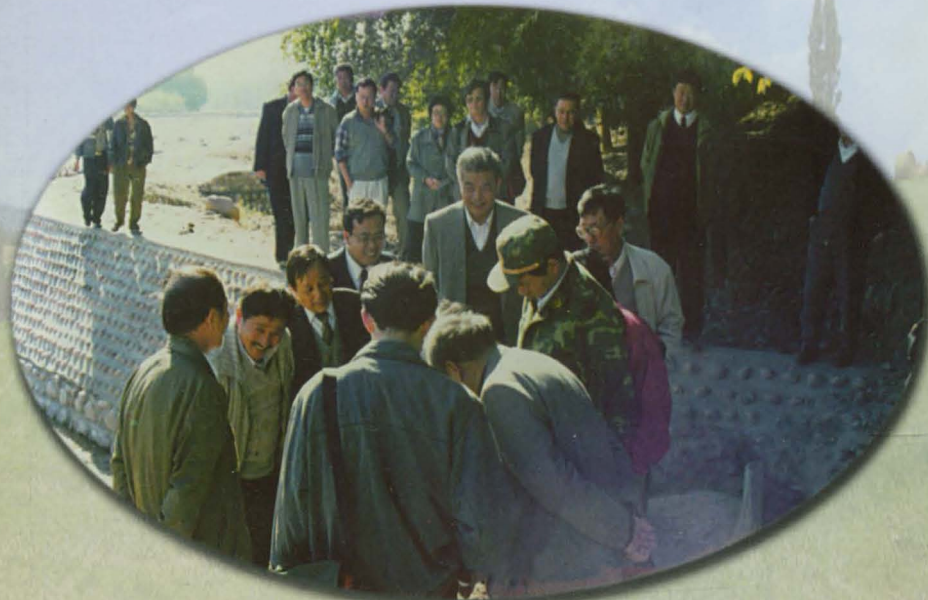
中国国际咨询公司的专家在伊犁州水利工程现场考察。