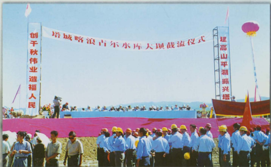
塔城地区喀浪古尔水库大坝截流仪式。