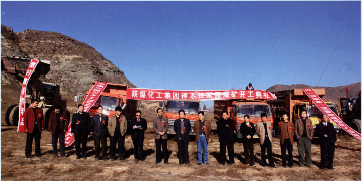
2006年12月1日公司矿井开工庆典