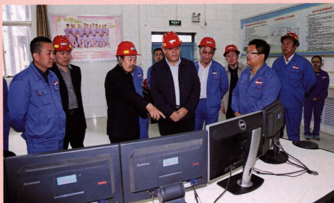
2014年8月时任神木县县长张生平（左四）来公司调研节能减排工作