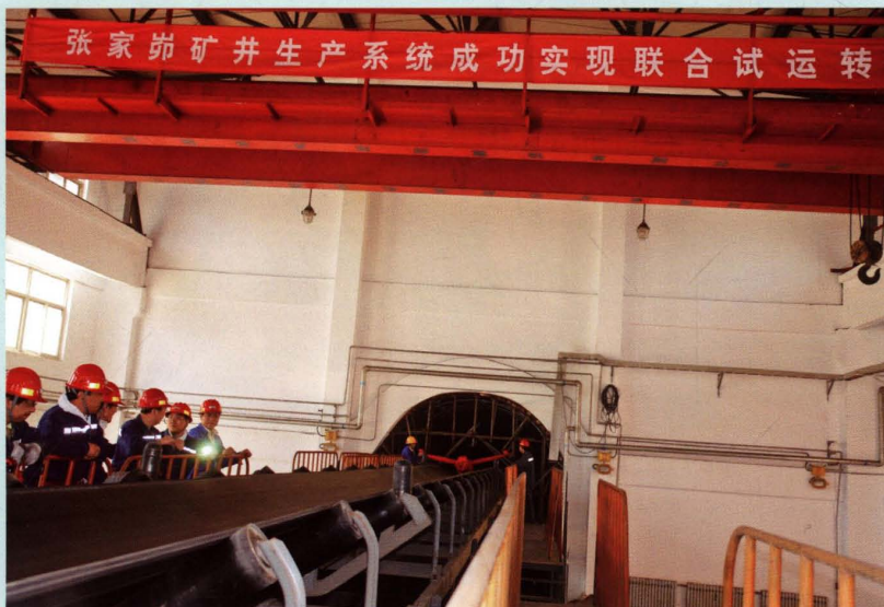
2009年5月29日公司矿井 成功实现联合试运转