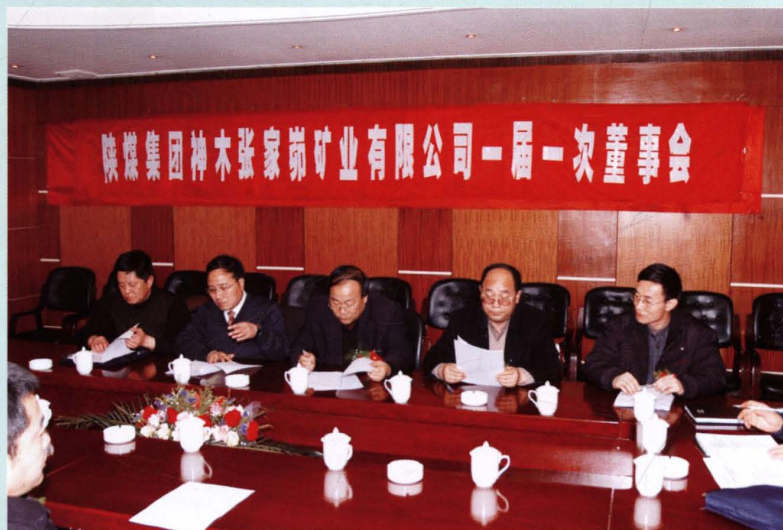
2006年1月公司召开一届 一次董事会