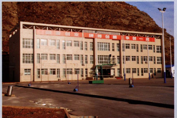
公司职工活动中心