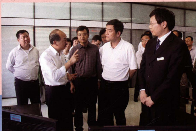
2012年9月13日时任榆林市常务副市长高中印（右二）在公司调度指挥中心了解安全生产工作情况