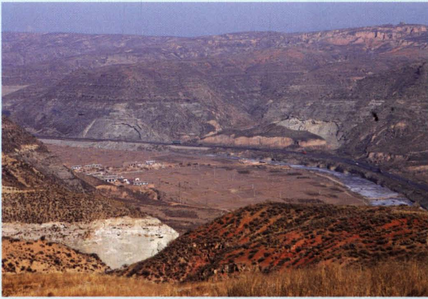
公司所在地原始地形地貌