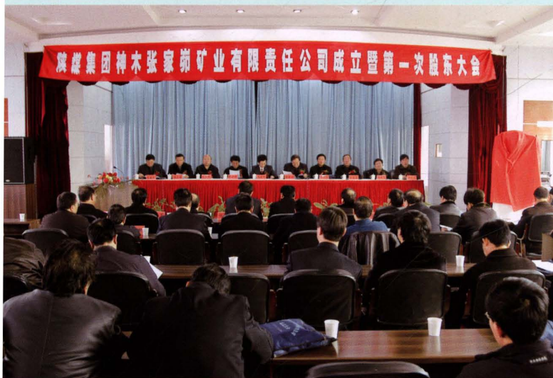
2006年1月16日公司召开成立 大会暨第一次股东大会