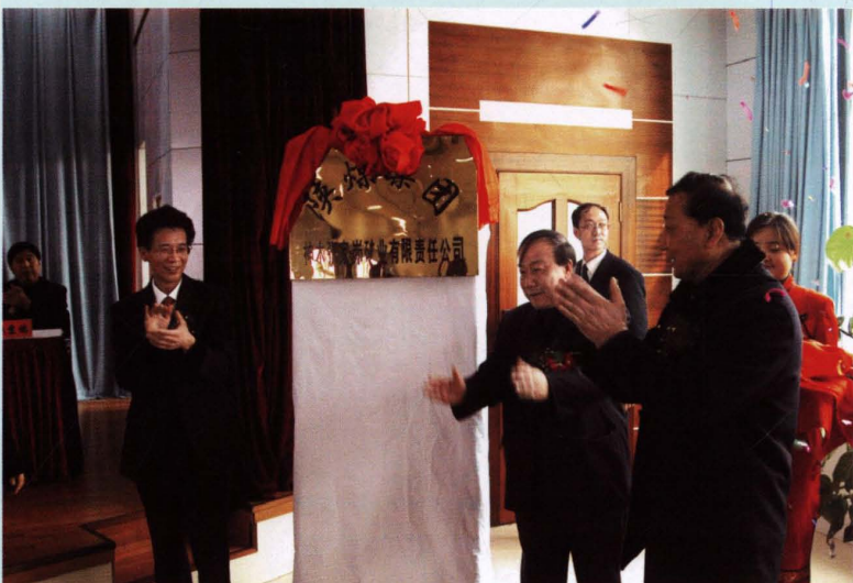
公司成立揭牌仪式