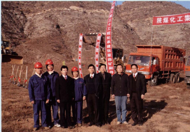
参加开工庆典部分人员