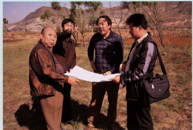
2005年9月现场勘察井口选址