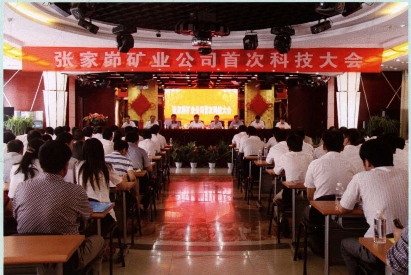
2009年公司召开 首届科技大会