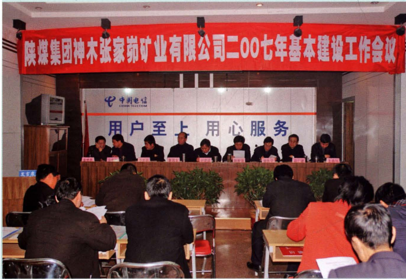
2007年公司召开基本建设会