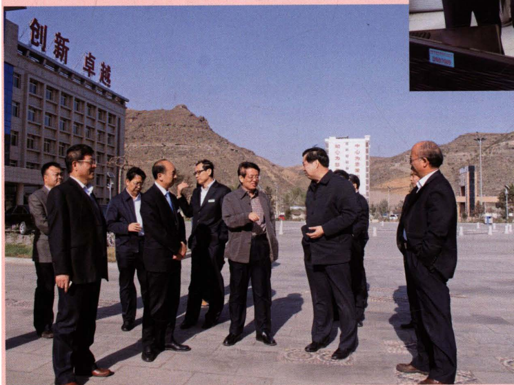
2012年4月25日时任神木县委书记雷正西（右三）来公司调研