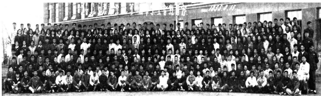
▼ 首届298名毕业生在学校（现南湖校区）主楼前合影

首届毕业生的特点：绝大部分学生，成绩优良，品质较好。第一是：他们在三年的学习中，一直有苏联专家的直接指导，学习上有苏联经验借鉴，学习、设计等实践教学环节要求十分严格；第二是：该届毕业生均为部队转业调干的调干学生，经过党的培养教育