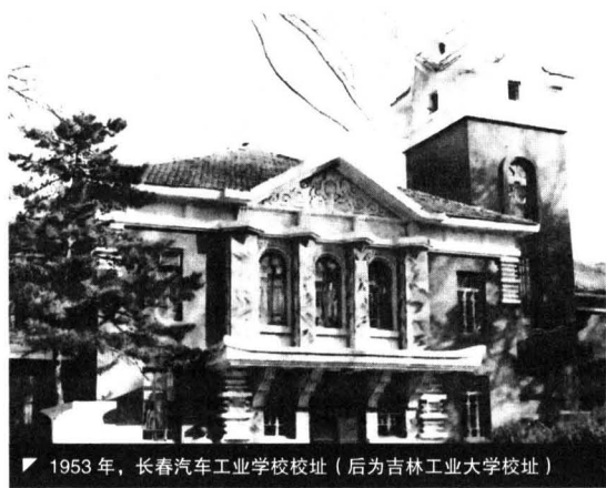
1953年，长春汽车工业学校校址（后为吉林工业大学校址）

1953年12月1日，学校接一机部指示，改名为中央第一机械工业部长春汽车制造学校。同时，接一机部汽车局通知，学校除教学方针计划等重大事项报局外，一般行政工作委托一汽全权代管。此时，学校学生已逾千人，教职员工300多人，其中教师80多人。