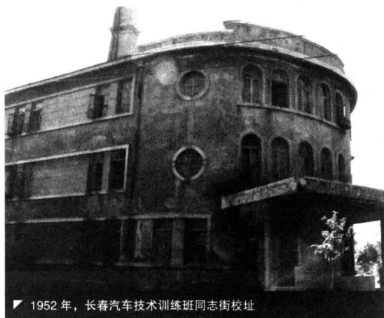
1952年,长春汽车技术训练班同志街校址

1952年4月上旬,在我国国民经济恢复取得巨大成绩,大规模经济建设的第一个五年计划即将开始的形势下,中央人民政府重工业部汽车工业筹备组(汽车局的前身)决定在长春成立培养汽车工业中级技术干部的汽车技术训练班,学制为三年,培养对象系从中国人民解放军转业来的青年知识分子。4月中旬,汽车工业筹备组派干部数人来长春进行筹备。4月底,首批学员150人自张家口到达长春。6月底,又自各地陆续来校数百人,先后近800人(其中有近40名原牙科医生,到校后不久仍回部队)。当时,校址设在同志街38号,第一汽车制造厂(以下简称一汽)厂长郭力兼任校长。学校设教务处(下设教务组、辅导组)及秘书、总务、会计和人事等组。