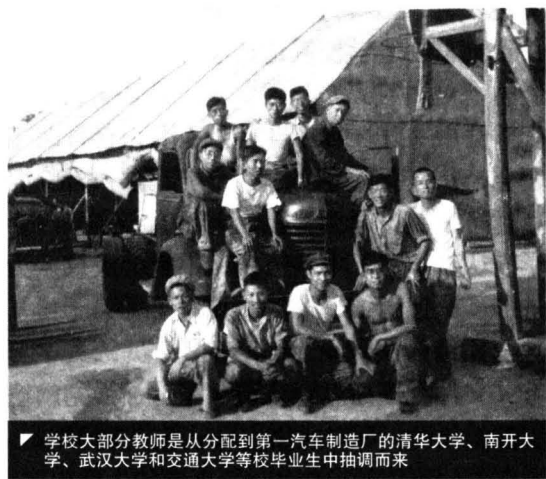
学校大部分教师是从分配到第一汽车制造厂的清华大学、南开大学、武汉大学和交通大学等校毕业生中抽调而来

从1952年4月长春汽车技术训练班成立，到1953年末学校正式改名为中央第一机械工业部长春汽车制造学校，短短的一年半时间，学校从小到大，校舍、设备从无到有，初步建设成为全国一所较好的中等技术学校，成为国家培养汽车工业中级技术干部的摇篮。学校之所以在这么短的时间里，取得这样大的成绩，除了全校师生的努力外，还与一机部的重视、一汽的支持和苏联专家的帮助分不开。建校伊始，困难重重，一汽建