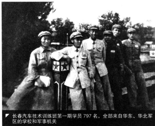
▼ 长春汽车技术训练班第一期学员 797 名，全部来自华东、华北军区的学校和军事机关

校舍，略加装修，购置一些教学设备进行复习。与此同时，学校着手修建西安广场的校舍（西安大路 166、170 号）。当时，学校非常重视实习基地的建设，在训练班阶段，根据汽车工业筹备组的指示，将筹备组所属的十九厂第三分厂拨给学校作实习厂，学校组织人力进行改装及修配机器设备工作，至 9 月，该厂改归第二机器工业管理局领导，所有厂房、设备不再给学校，于是学校又在西安广场重新建立实习厂。