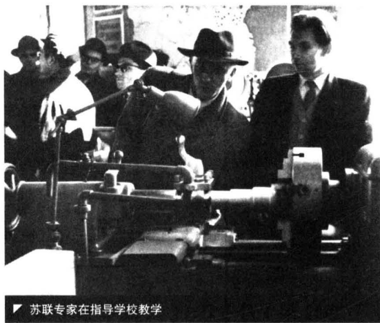
▼ 苏联专家在指导学校教学

6 月份开始复习时，学生已有近 800 人，但当时能任课的教师仅有五六人，所以只能采用“自学为主，答疑辅导”的方式进行教学。7 月下旬，利用大学暑假的机会，从东北师范大学、东北工学院等校短期借用教师及高