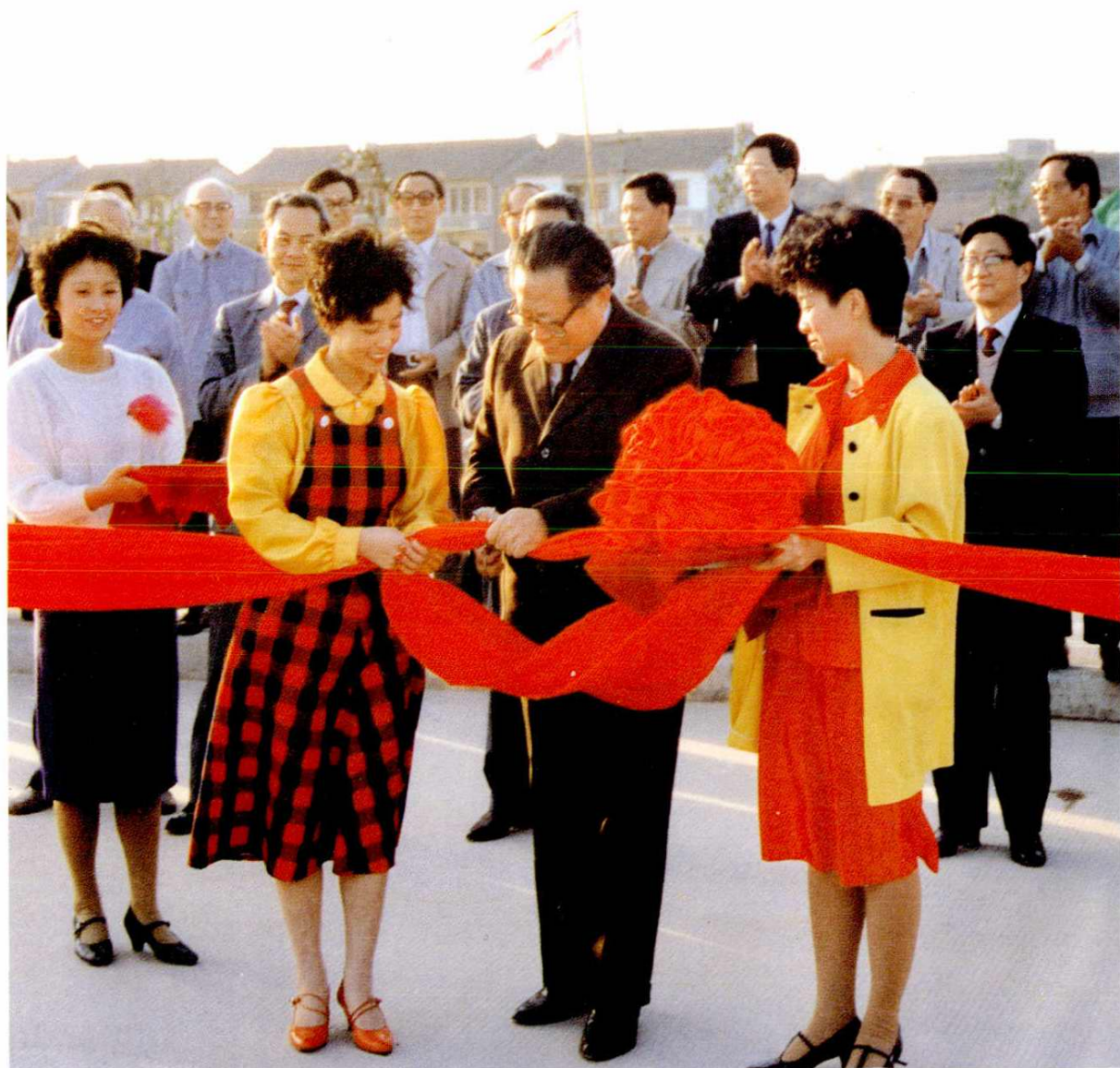
△ 1988年10月31日，中共上海市委书记江泽民（中）为沪嘉高速公路通车剪彩