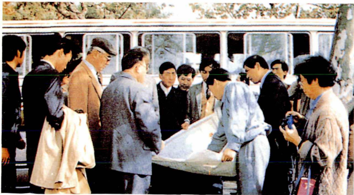
△ 1988年11月15日，全国人大常委会副委员长荣毅仁(左三)视察嘉定工业开发区(后易名嘉定工业区)