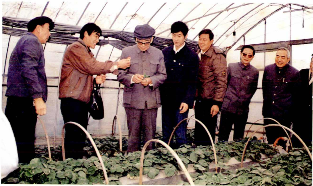
△ 1989年1月7日，全国政协副主席王任重（左三）视察长征乡中日合作上海蔬菜园艺设施试验场