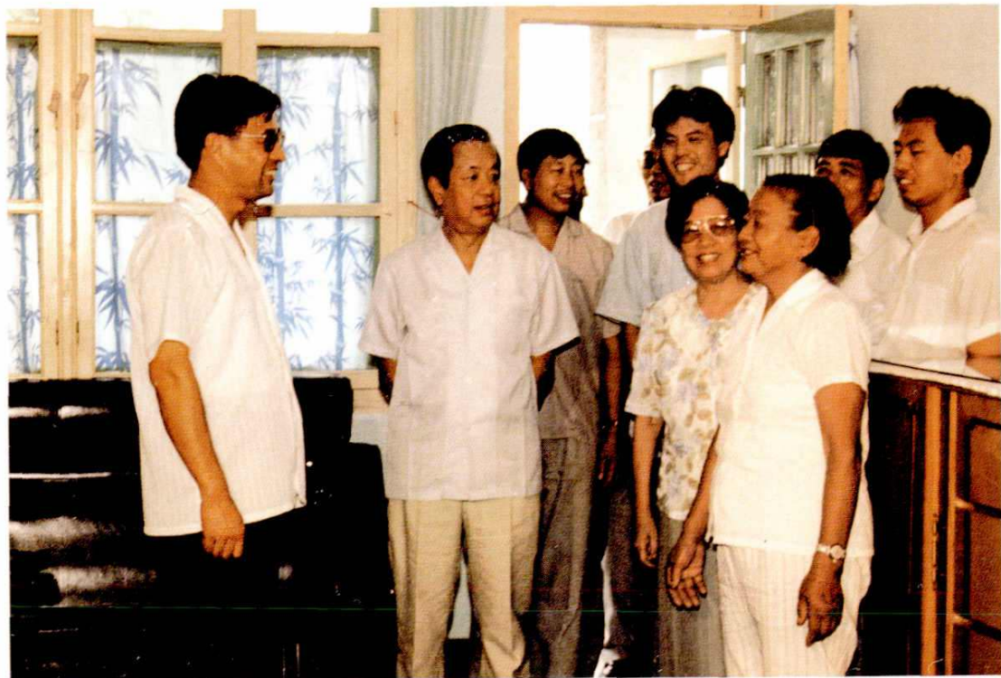
△ 1992年8月19日，国务委员、外交部部长钱其琛（左二）回故乡嘉定参观访问