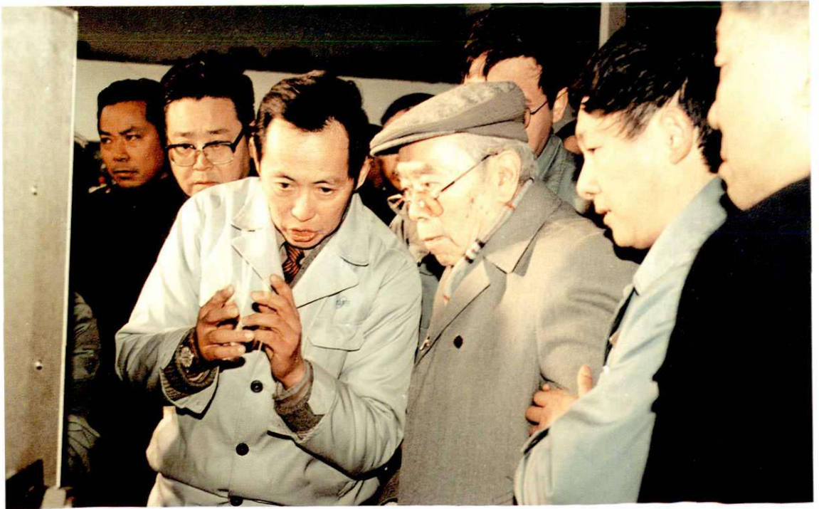
△ 1989年11月29日，全国人大常委会副委员长朱学范（前左二）视察上海通信电缆厂