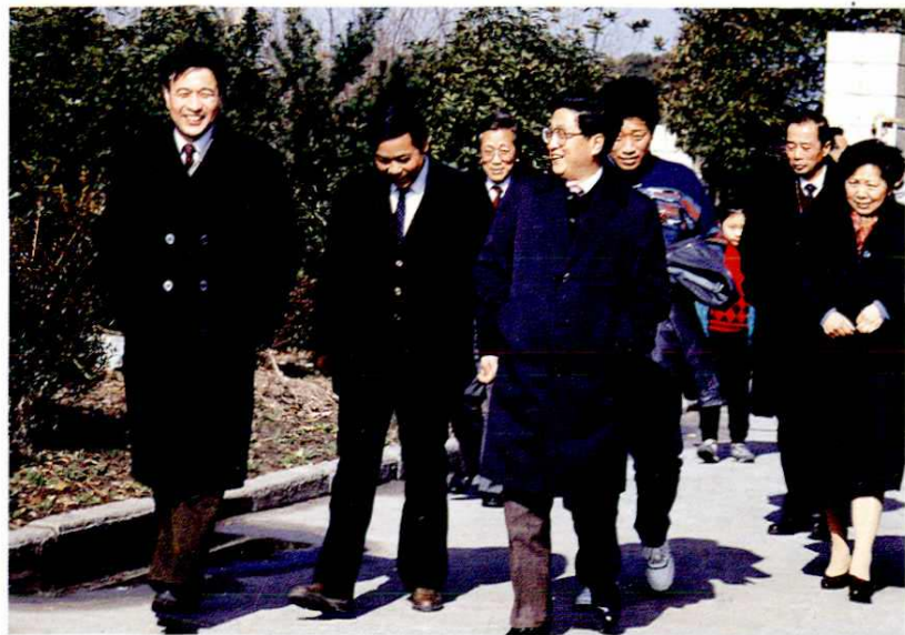
◀ 1992年2月6日，上海市市长黄菊（前左三）视察唐行乡浏岛风景区