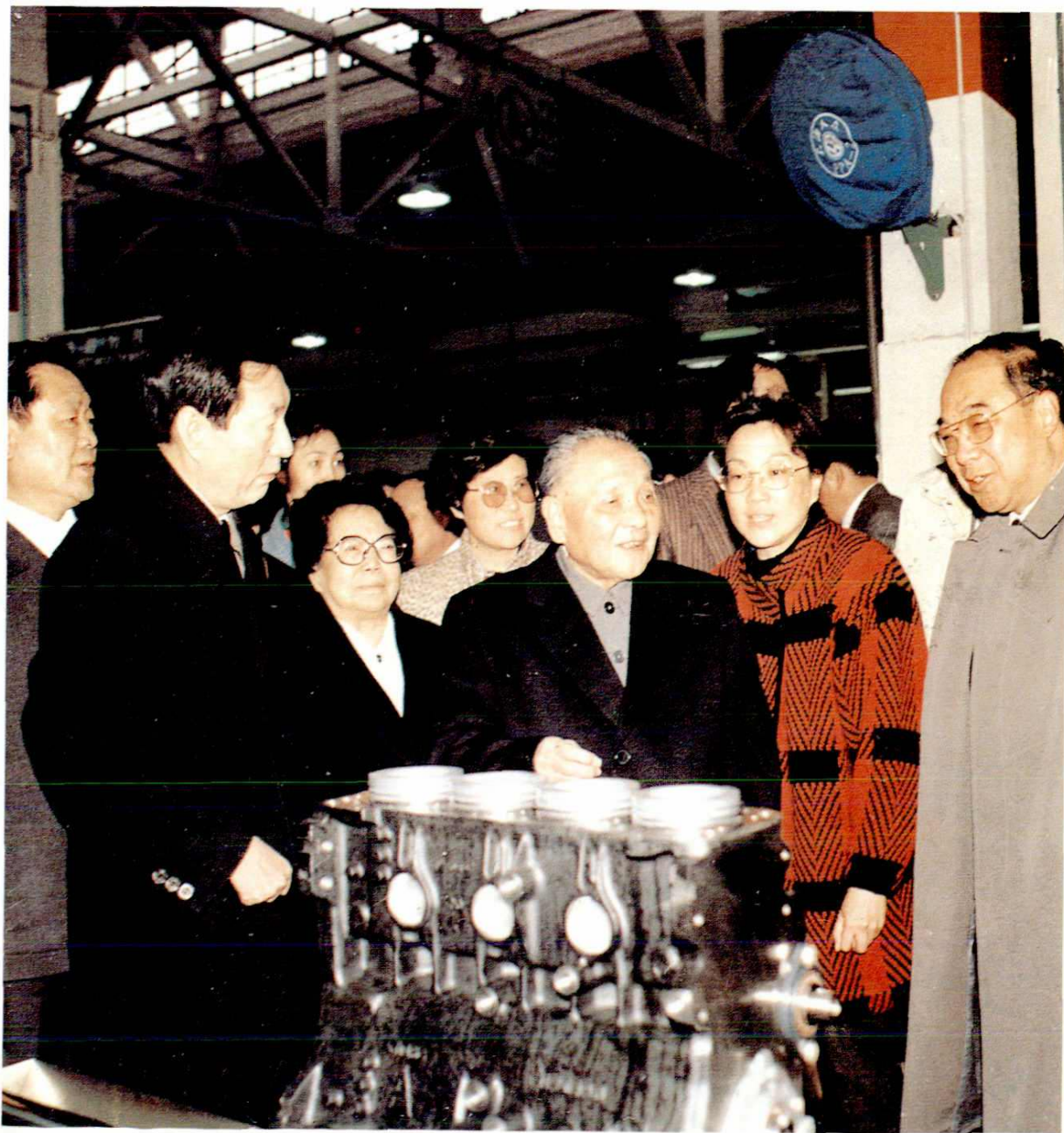
▲ 1991年2月6日，邓小平视察上海大众汽车有限公司