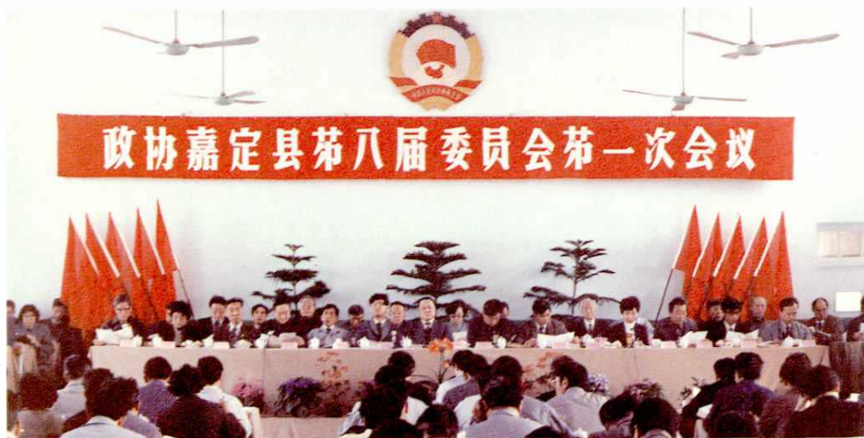
◁ 1990年4月2~6日，政协嘉定县第八届委员会第一次会议召开