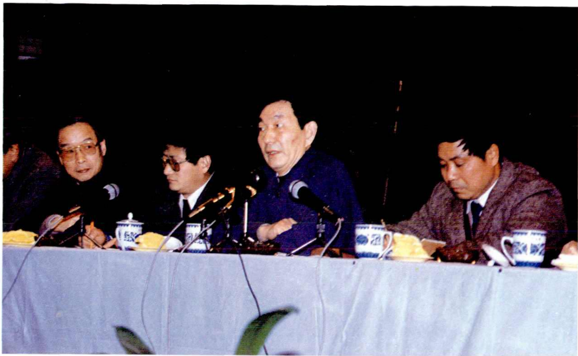
△ 1990年3月3日，中共上海市委书记朱镕基(右二)在嘉定县党政干部会议上作“一要稳定，二要鼓劲”的重要讲话