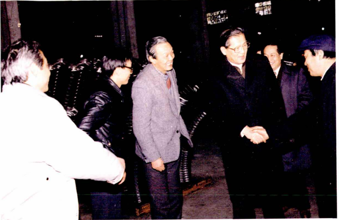
△ 1989年2月9日，全国人大常委会副委员长倪志福（前右二）视察上海汽车厂