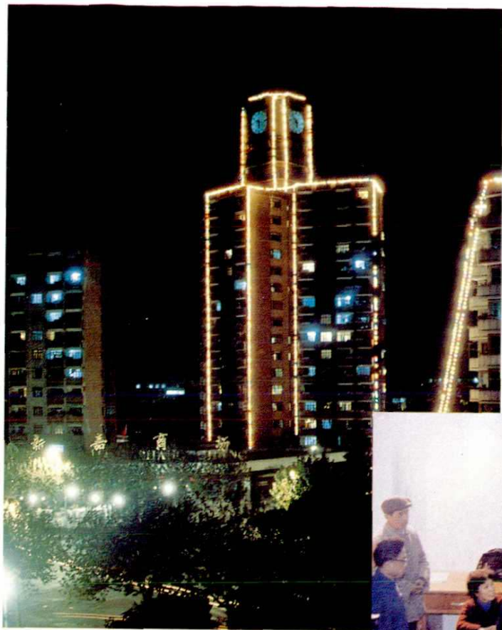
◁ 1989年9月28日，时为上海市第二大钟的嘉定镇清河大楼“摩士达”自鸣钟开始报时