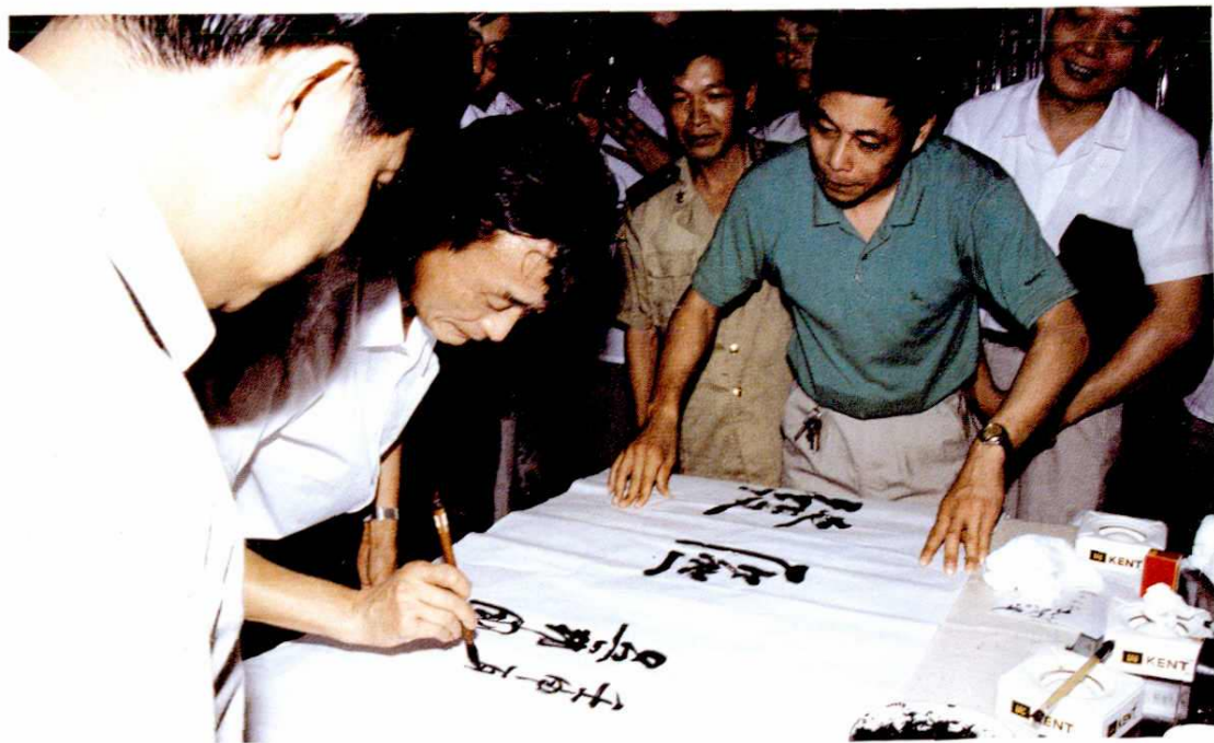
△ 1992年7月2日，中共上海市委书记吴邦国（左二）为嘉定工业开发区题词