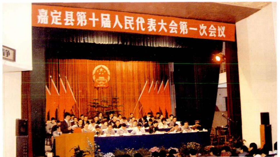
▷ 1990年4月2~7日，嘉定县第十届人民代表大会第一次会议召开