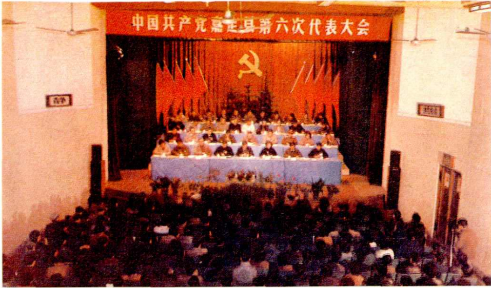
◁ 1990年2月13~17日，中共嘉定县第六次代表大会召开