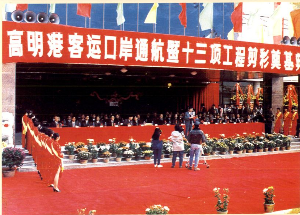
1993年12月18日，高明县举行庆祝高明港客运口岸通航及13项工程剪彩奠基典礼。省、市领导及来自10多个国家和地区的100多位外宾参加庆祝活动