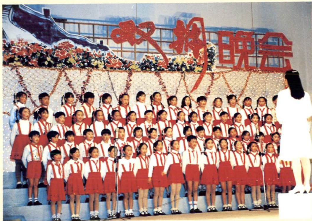
举办双拥文艺晚会，开展国防教育活动