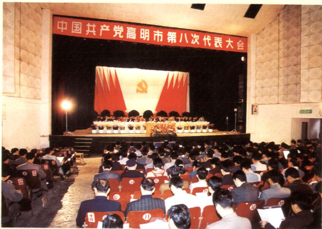
1998年3月，中国共产党高明市第八次代表大会在高明影剧院隆重召开