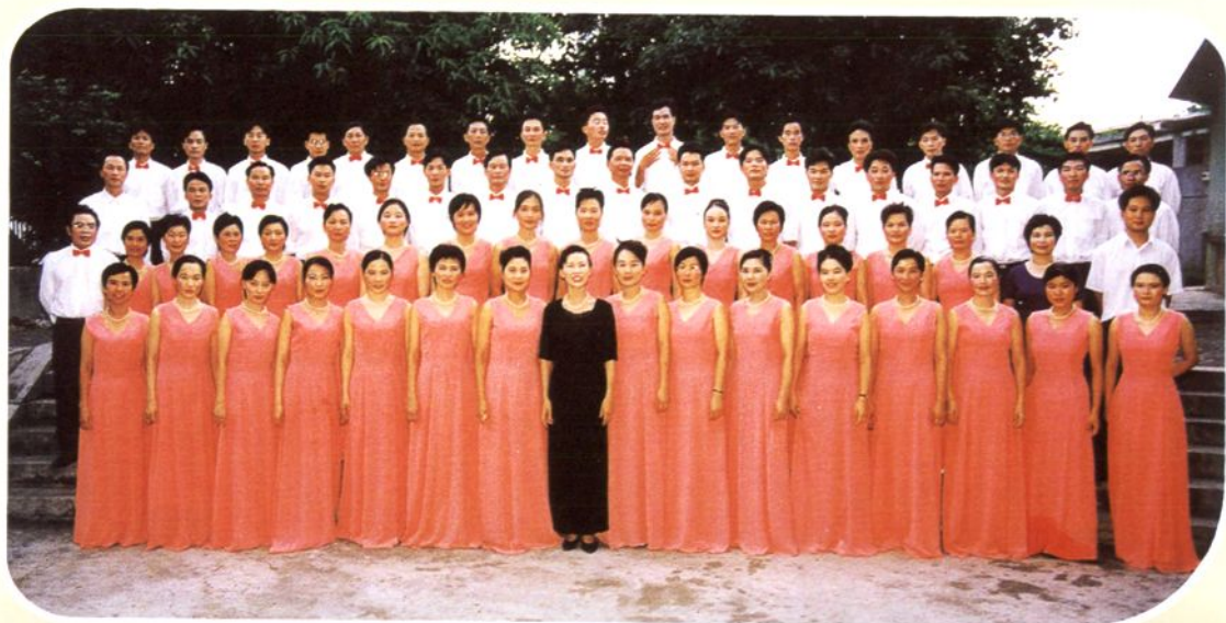
1999年，以迎接新世纪和庆祝澳门回归为契机，广泛开展爱国主义宣传教育活动。图为歌咏队在参赛前排练