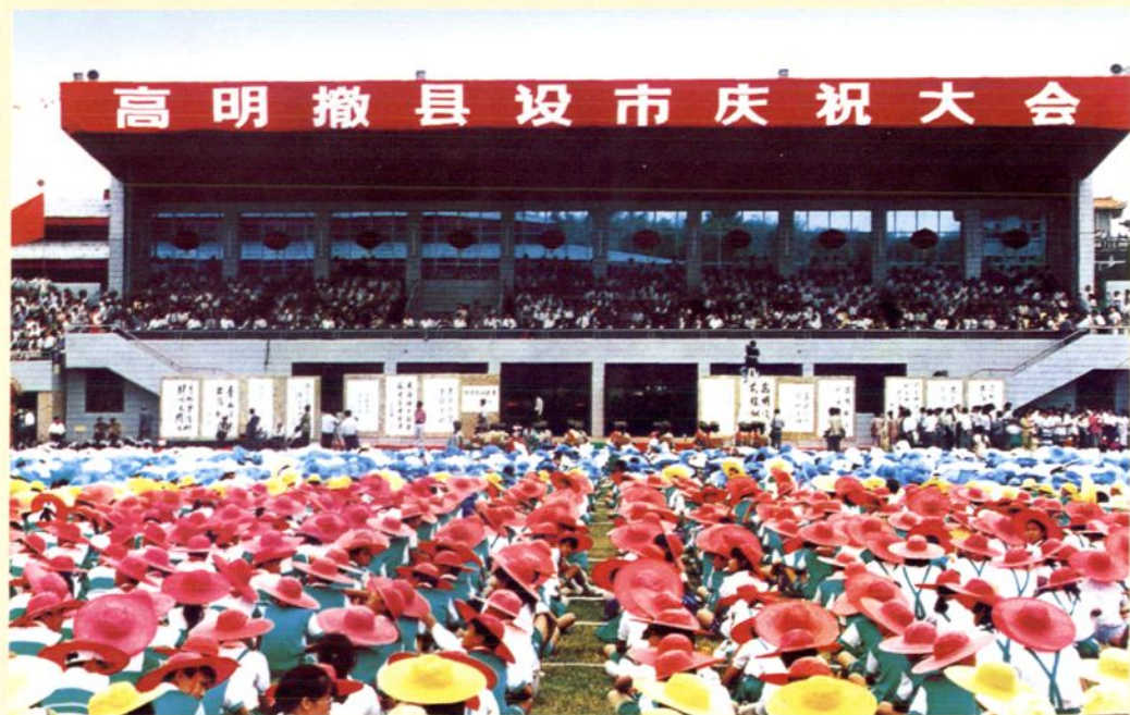
1994年9月28日，高明市隆重举行撤县设市庆祝大会，大会在新落成的市体育场举行，与会来宾及群众1万多人