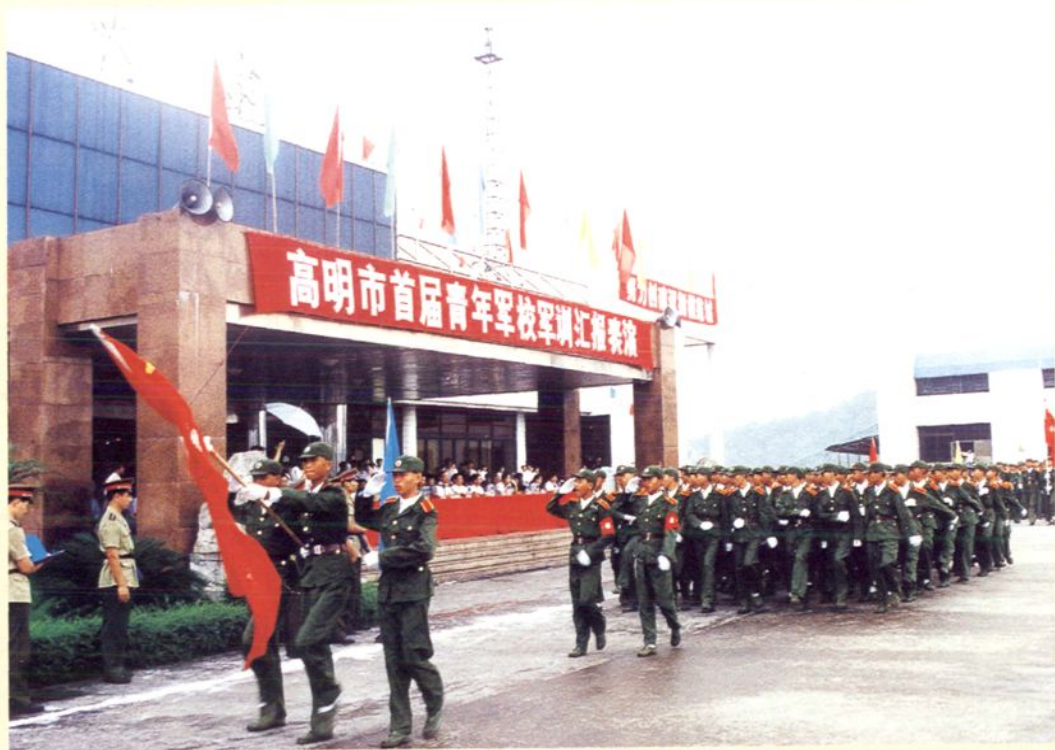
1997年，在高明港广场举行“高明市首届青年军校军训汇报表演”