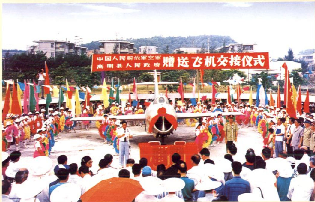
中国人民解放军空军赠飞机给高明人民政府。图为赠送飞机仪式