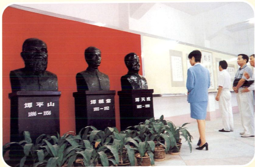
1998年，中共高明市委宣传部与党史办、明城镇政府筹建“三谭革命事迹展览馆”