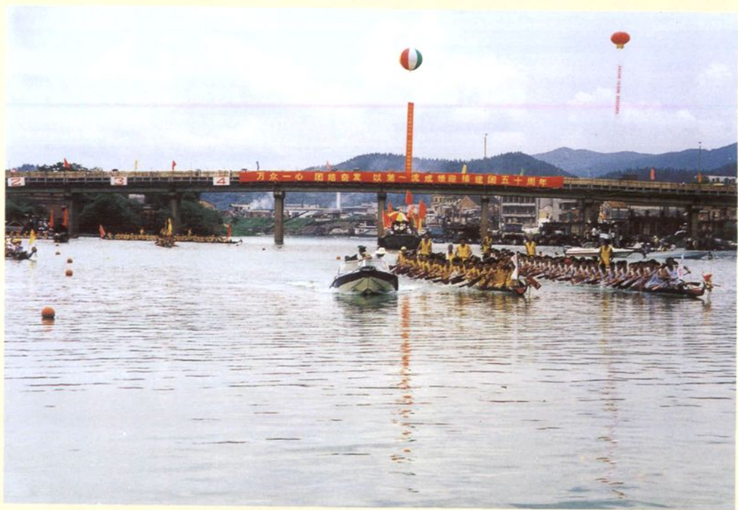
1999年6月18日，高明市在沧江举行全市龙舟竞赛