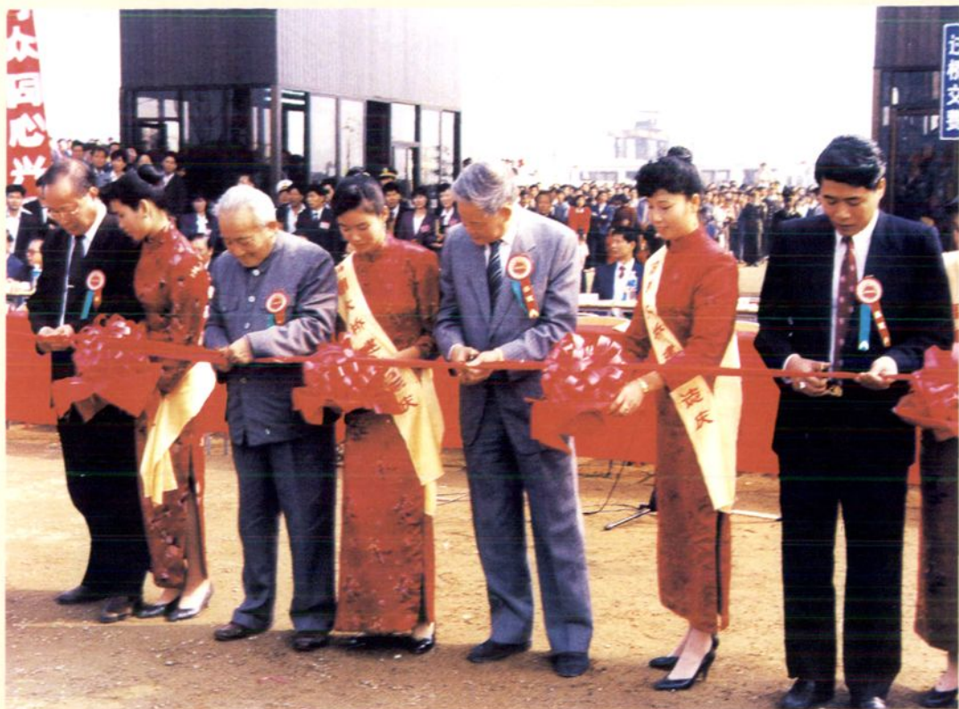
1991年12月7日，全国政协副主席叶选平（右三）、中顾委委员刘田夫（左三）及省市领导为高明大桥建成剪彩