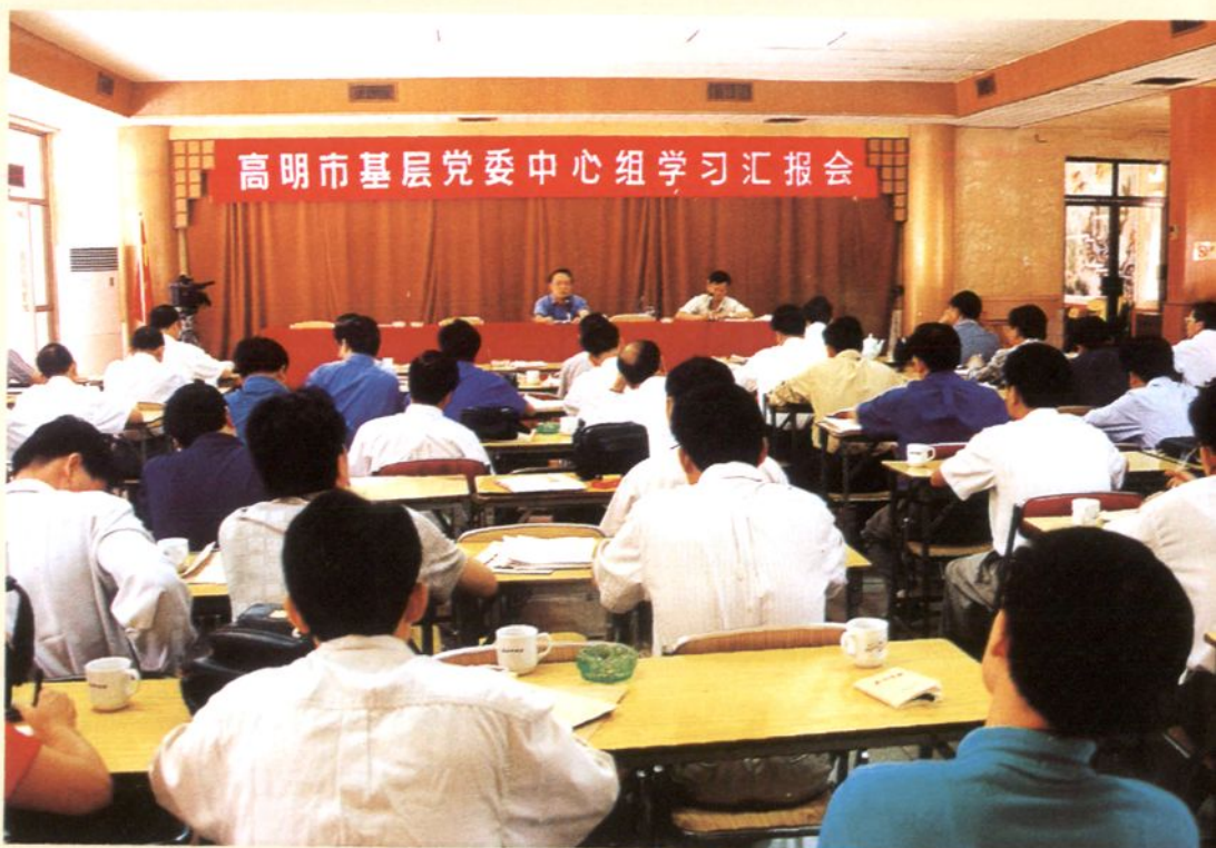
1998年10月，召开高明市基层党委中心组学习汇报会