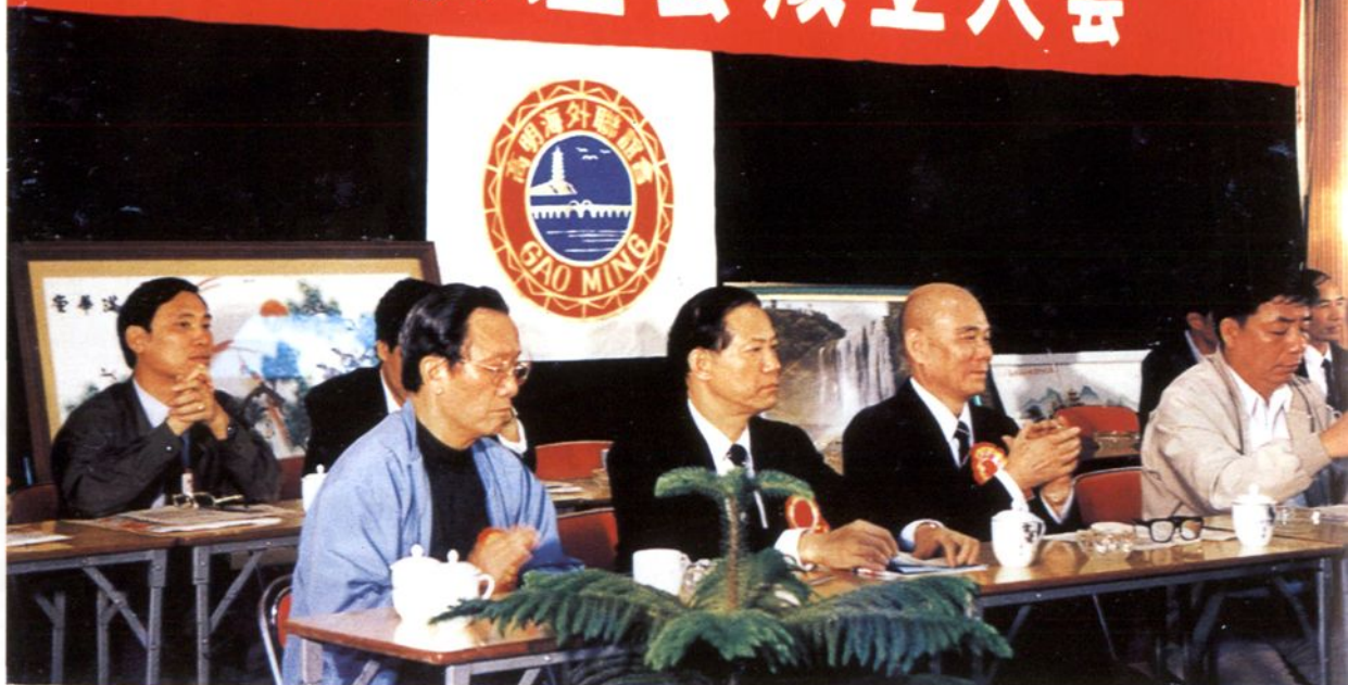
1989年4月11日，高明海外联谊会成立

1993年，荷城区被评为省级文明单位，并在全省城镇卫生检查评比中名列县城组第三名。图为环卫工人在清洁街道