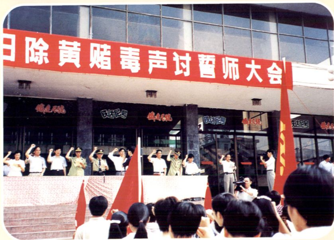
1998年5月，在高明影剧院门前召开“高明市各界干部群众扫除黄、赌、毒声讨誓师大会”