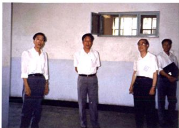
● 1993年8月31日，国内贸易部部长张皓若同志视察北京商学院