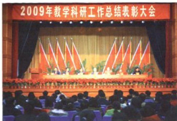
● 2010年1月，学校召开2009年度教学科研工作总结表彰大会