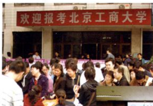
● 学校招生咨询现场