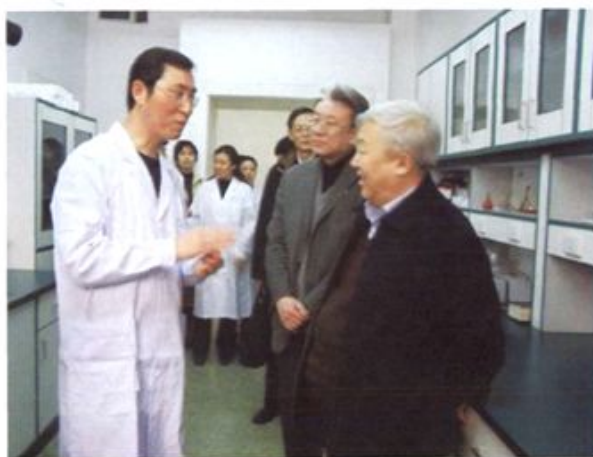
● 教育部原副部长周远清参观实验室