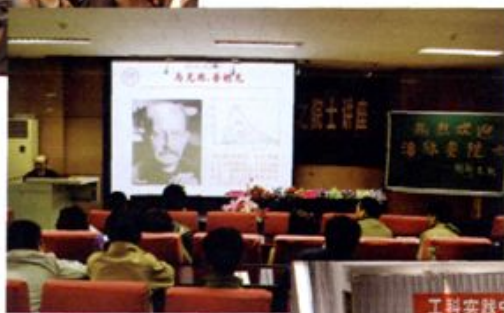
● 学校推行“核心课程校外名师讲学计划”，图为2009年3月25日清华大学潘际鑫院士讲座