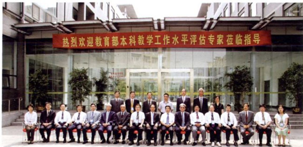
● 2007年，学校获教育部本科教学工作水平评估优秀