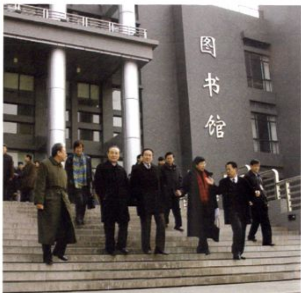
● 2007年2月5日，十一届全国人大常委会副委员长、民盟中央主席蒋树声同志视察北京工商大学良乡校区