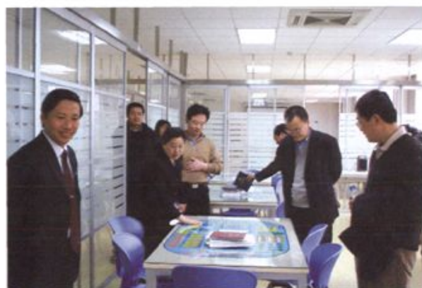
● 北京市教委主任郭广生来文科实践中心指导工作