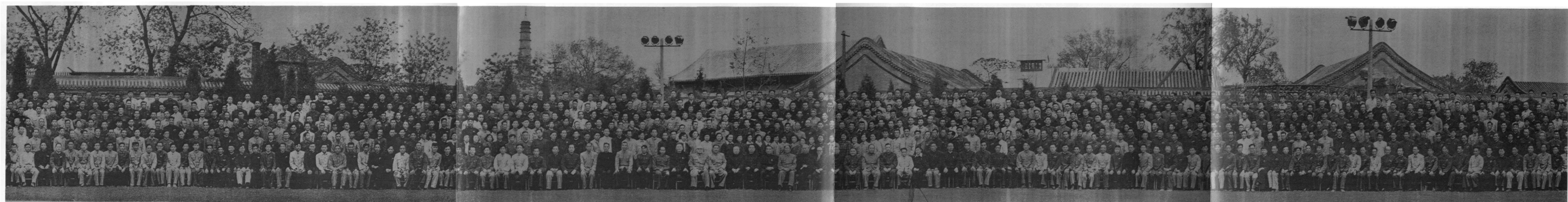
毛主席及中央领导同志接见中央商业干部学校本届毕业生和全体教职人员合影 57.5.7.