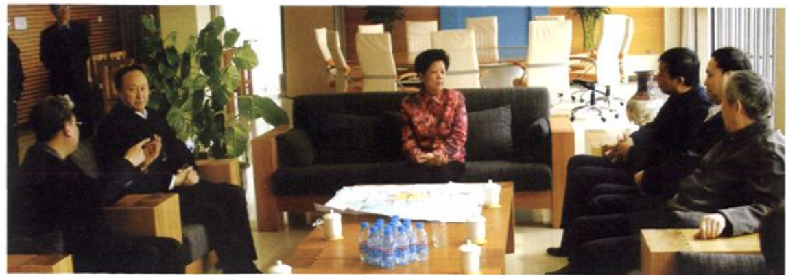
● 2006年4月18日，国务院委员陈至立同志视察北京工商大学良乡校区