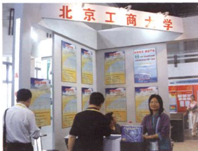
● 学校多次参加北京市科技博览会