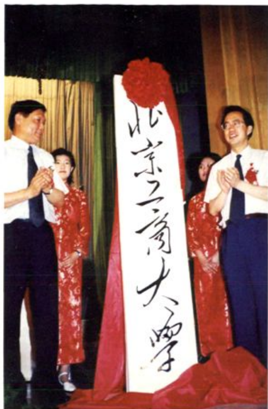
● 1999年6月12日，国务院副秘书长、国家教科领导小组成员徐荣凯和北京市市长刘淇在北京工商大学成立大会上为学校揭牌