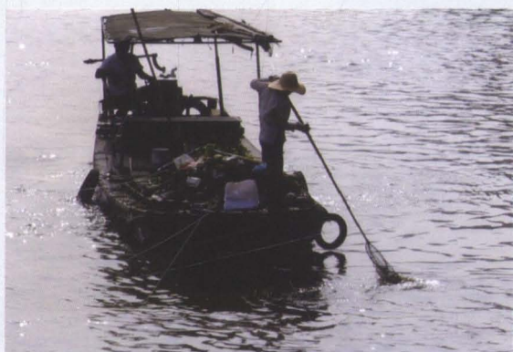
“河道保洁”是上海市人民政府于2003年11月推出的“万人就业项目”之一。图为惠南镇河道保洁服务社职工正在打捞水上漂浮物。