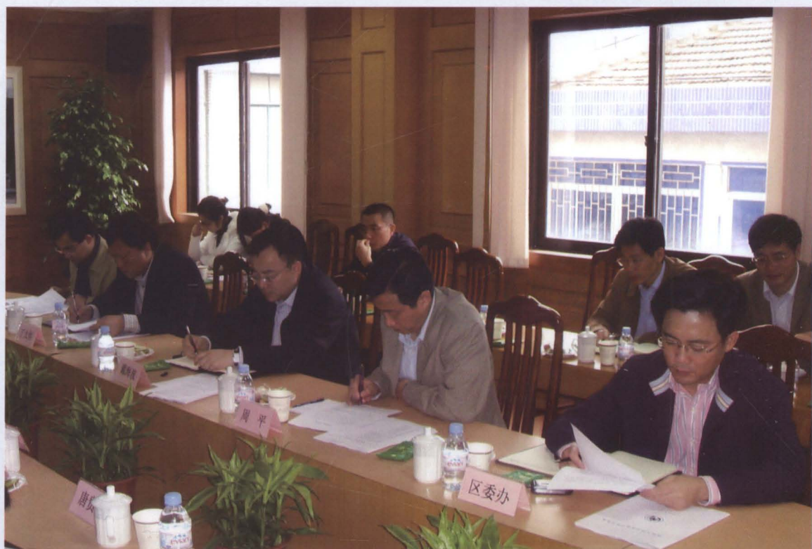
2006年11月，中共南汇区委书记戴海波（图前右起三）、副书记周平（图前右起二）、副区长丁大恒（图前左起二）等领导在区劳动和社会保障局调研与指导工作。