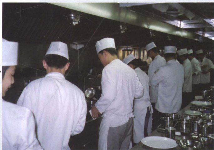
2005年春，社会职业培训机构举办厨师培训班。图为参加培训班的学员正在师傅的指导下认真学习。