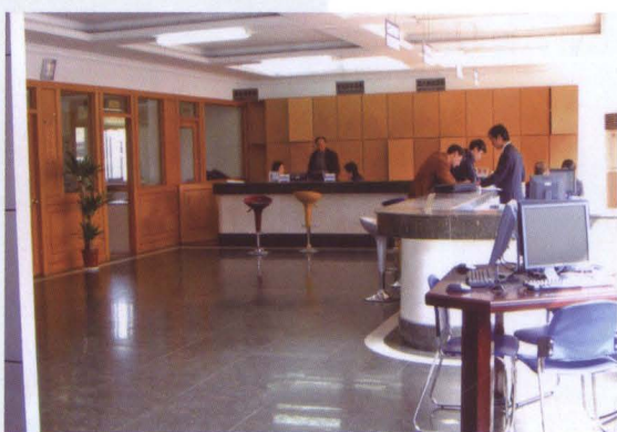
南汇区开业指导服务中心工作人员正在为自主创业者办理开业贷款担保申请手续。