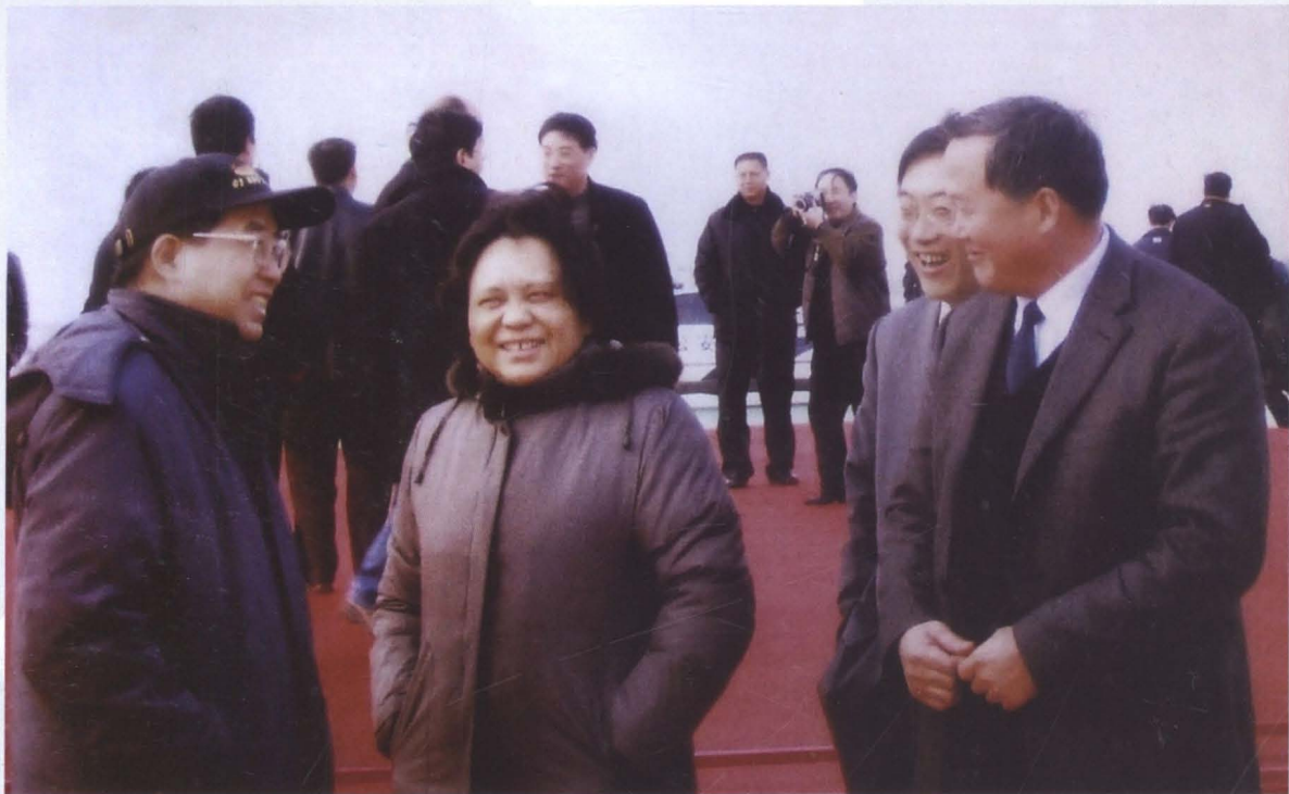
2005年12月10日，劳动和社会保障部副部长张小健（图左）在上海市劳动和社会保障局副局长石觉敏（图中）、南汇区劳动和社会保障局局长储勤民（图右）陪同下视察南汇区促进就业工作。