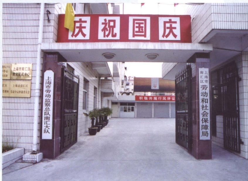
坐落于南汇区惠南镇跃进路14号的区劳动和社会保障局机关办公地。