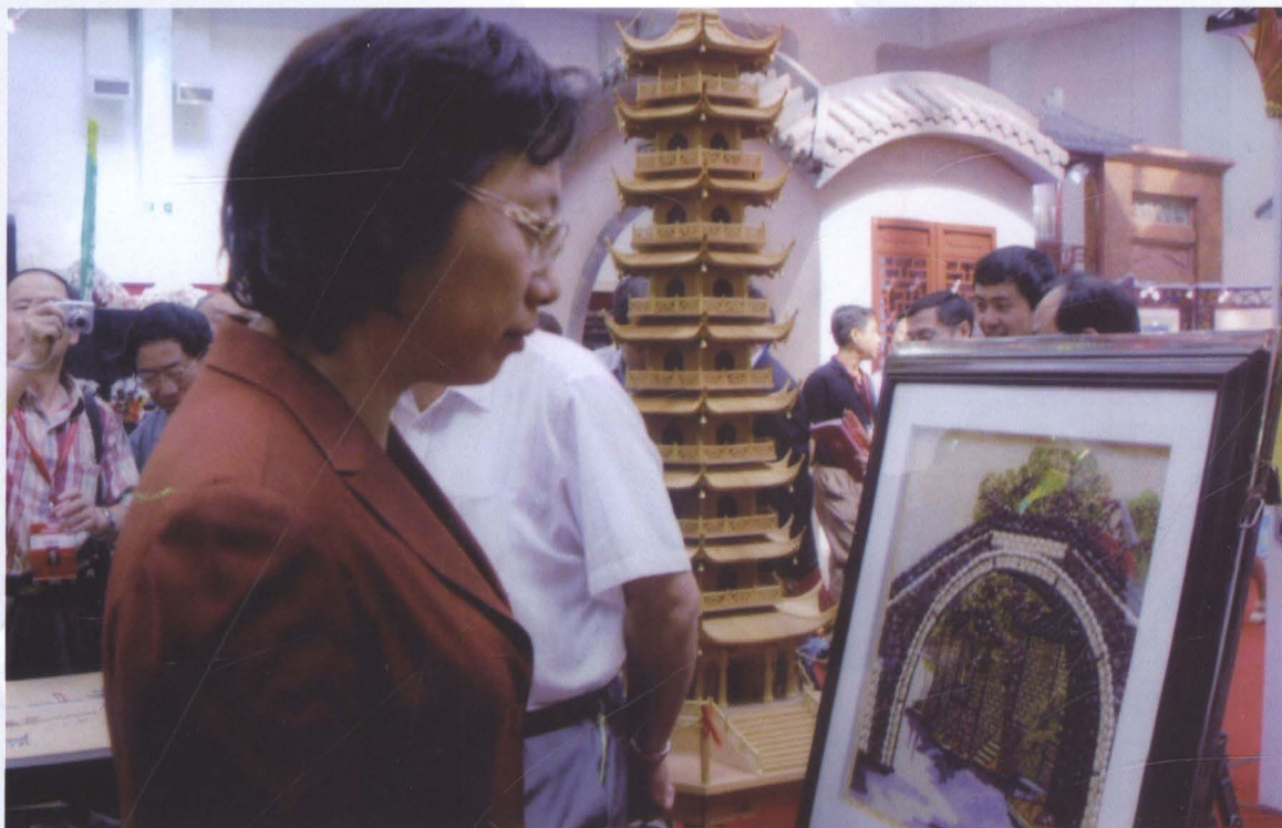
自主创业者邵龙妹创办的“南汇彩衣工艺品制作服务社”制作的一幅彩豆画获“2006上海民族民间艺博会”银奖。图为中共上海市委副书记殷一璀在艺博会上欣赏彩豆画。