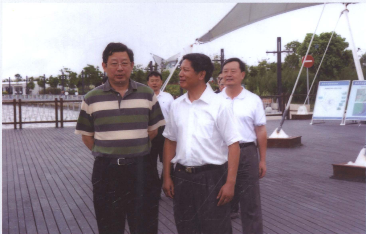
2008年9月，人力资源和社会保障部副部长胡晓义（图左）在南汇区劳动和社会保障局党委书记、局长唐贵明（图前右）的陪同下考察调研南汇区的劳动就业和社会保障工作。