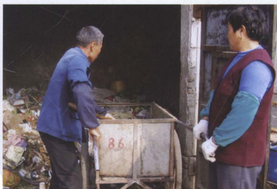
“农村环境卫生保洁”是经上海市劳动和社会保障部门审批于2004年12月起推出的“千人就业项目”之一。图为惠南镇农村环境卫生保洁服务社职工正在将收集的垃圾运到集聚地。