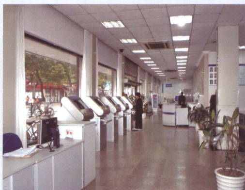
南汇区职业介绍所服务大厅。