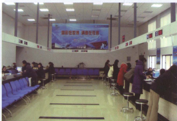
南汇区社会保险事业管理中心服务大厅的工作人员正在为客户办理相关社会保险手续。