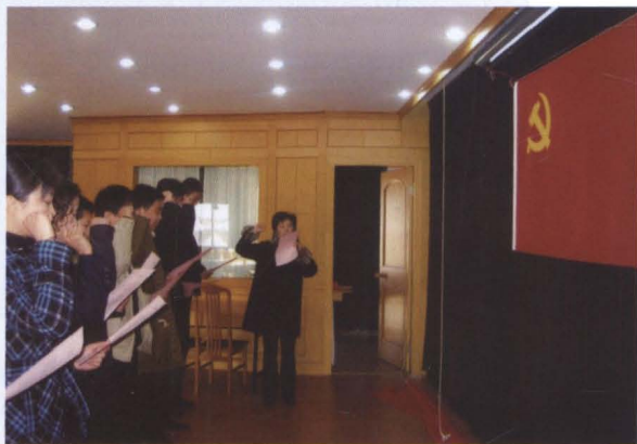
2004年春，南汇区劳动和社会保障局举行入党宣誓仪式。7名预备党员面对党旗进行入党宣誓。