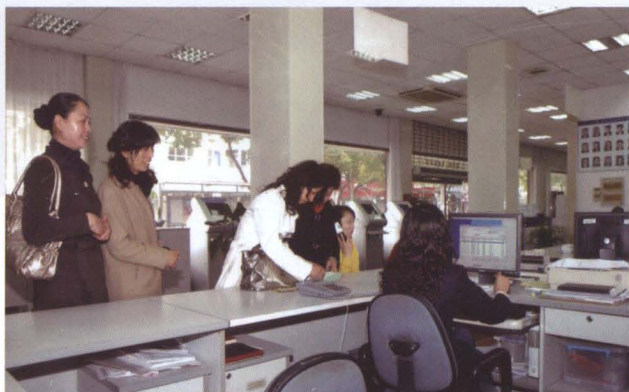
南汇区职业介绍所工作人员正在为求职者服务。