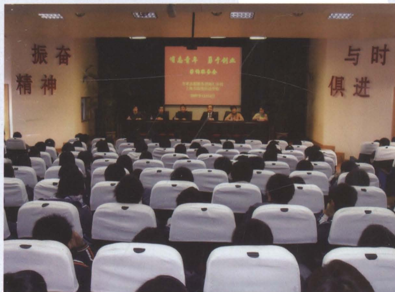
2007年12月4日，上海市开业指导专家志愿服务团南汇分团专家们在上海临港科技学校为应届毕业生作创业辅导。