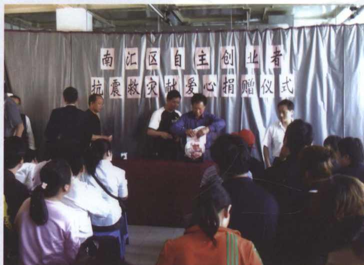
2008年5月16日，南汇开业服务社举行“南汇区自主创业者抗震救灾献爱心捐赠仪式”。260余名自主创业者共捐赠5.57万元，支援四川汶川受灾居民。