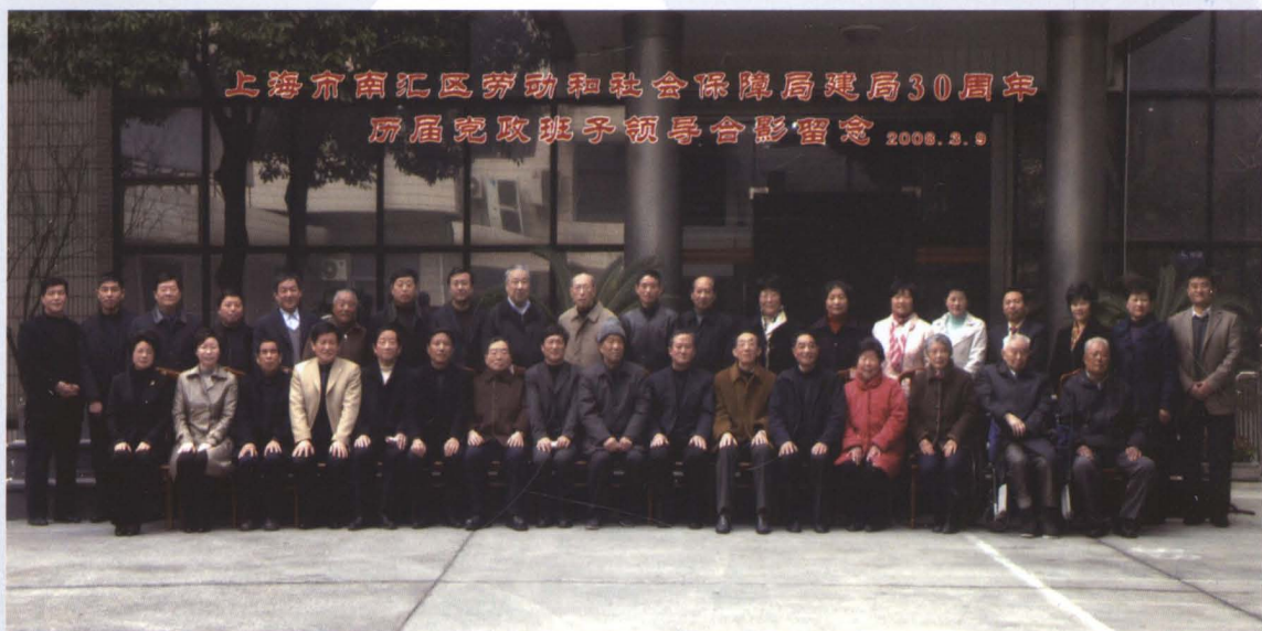
出席建局30周年座谈会的历届局党政领导班子成员合影留念。