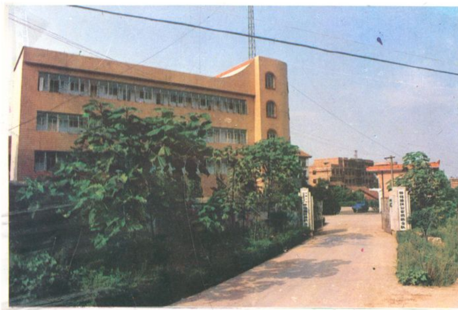
(图为支队机关办公大楼)