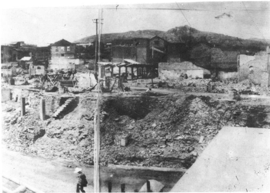
(1985 年 4 月 23 日辰溪县辰阳镇特大火灾现场一角)