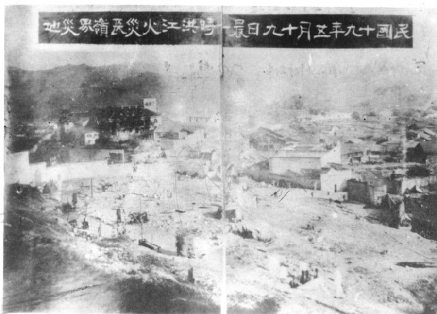
(图为民国十九年五月十九日晨一时洪江长岭界火灾现场)