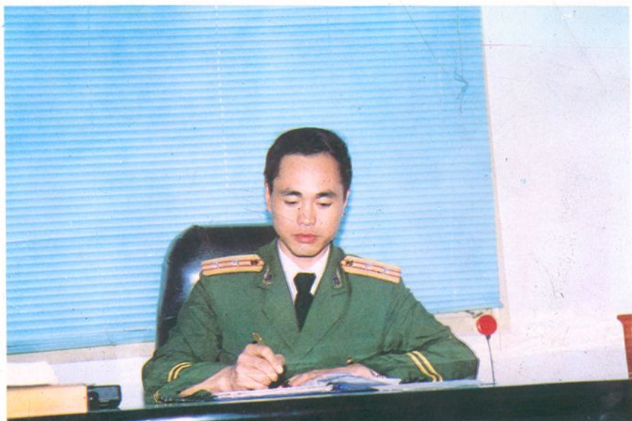
(图为怀化地区消防支队支队长刘德祥)