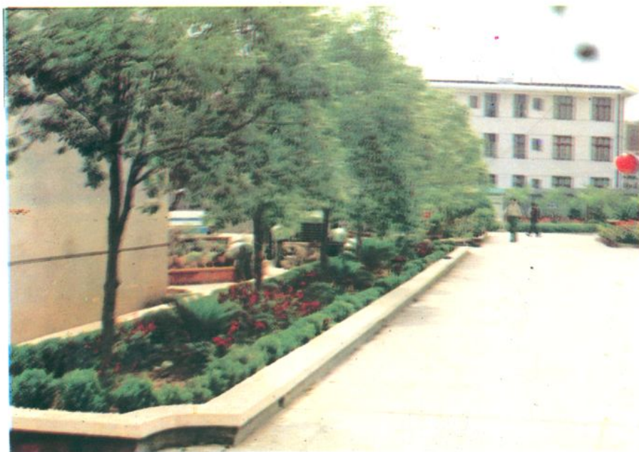
(图为支队机关大院一角)