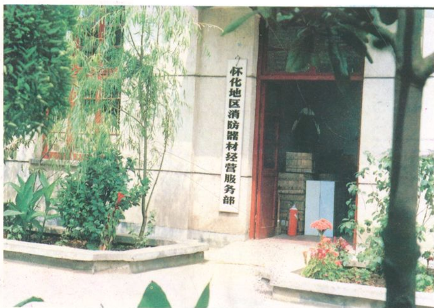
(图为支队消防器材经营服务部)