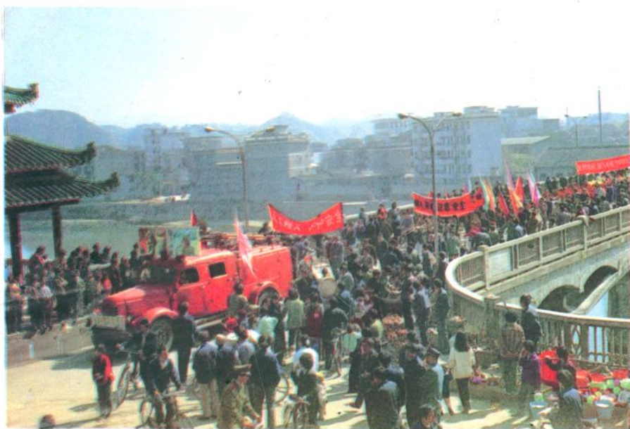
(图为群众性消防宣传活动掠影)