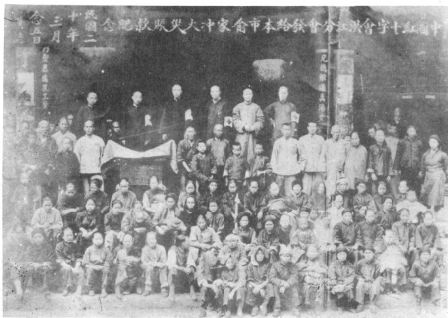
(民国 20 年 3 月中国红十字会洪江分会,在市俞家冲赈灾)