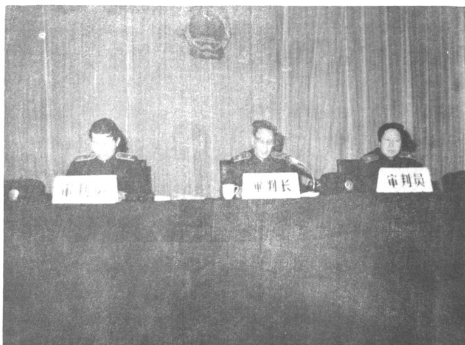
刑事审判一庭开庭审理案件