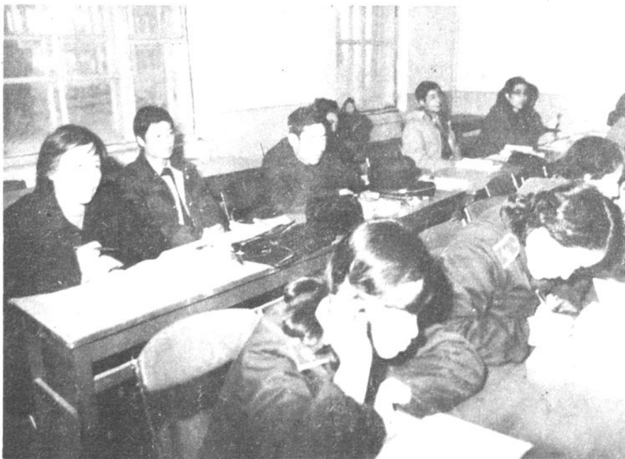
全国法院干部法律业余大学齐市分部学员在听课。