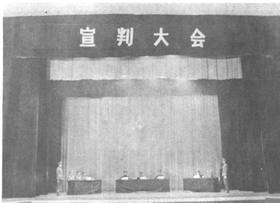
一九八五年底齐齐哈尔市中级人民法院在市工人文化宫召开宣判大会。