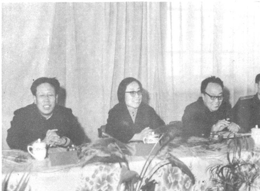
一九八七年十一月六日—九日全省法院系统电子计算机管理人事档案工作会议在我市召开。省法院副院长姚秉珠参加了会议。左起：王永泰、姚秉珠、李长久、邹海文。