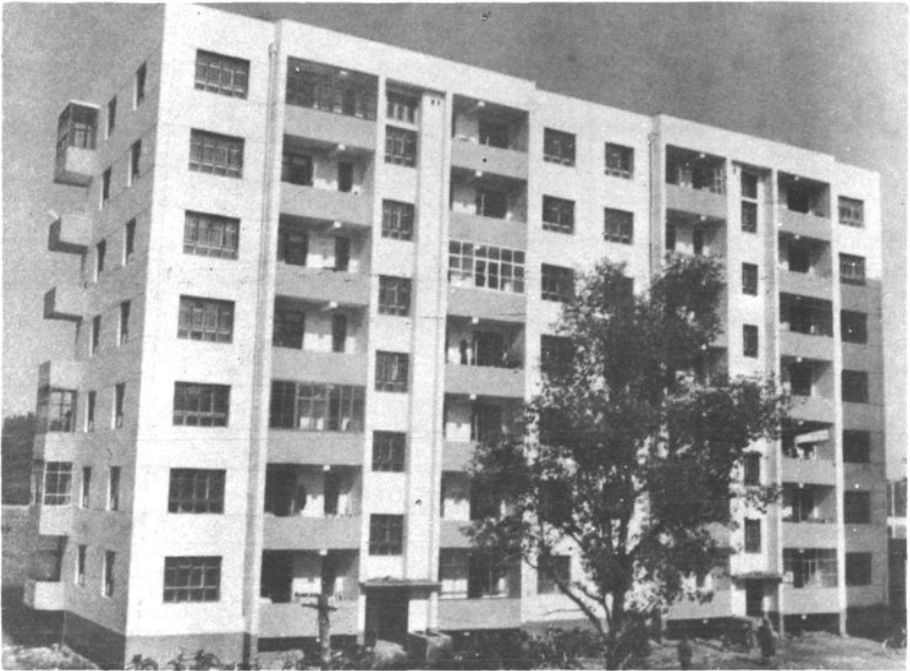
齐齐哈尔市中级人民法院宿舍大楼 (一九八六年十月破土动工,一九八七年十一月竣工)