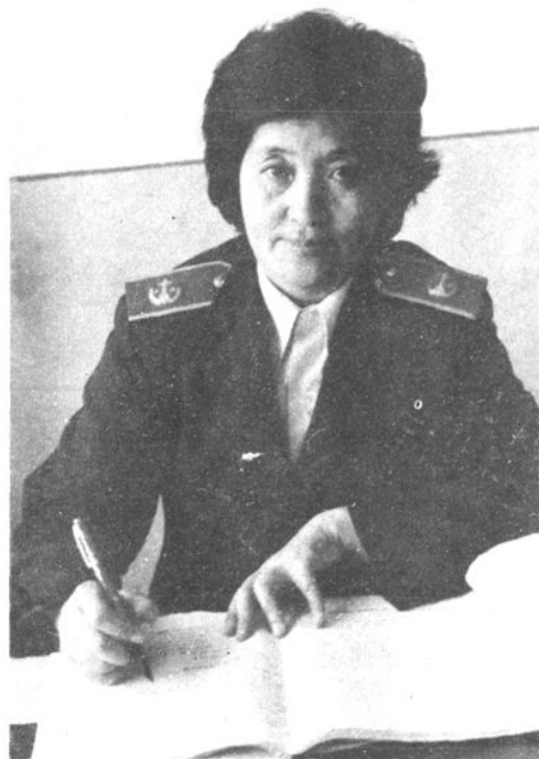
本志书作者 姚泽辉