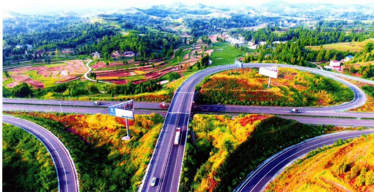
南大梁高速公路渠县互通进出口通道