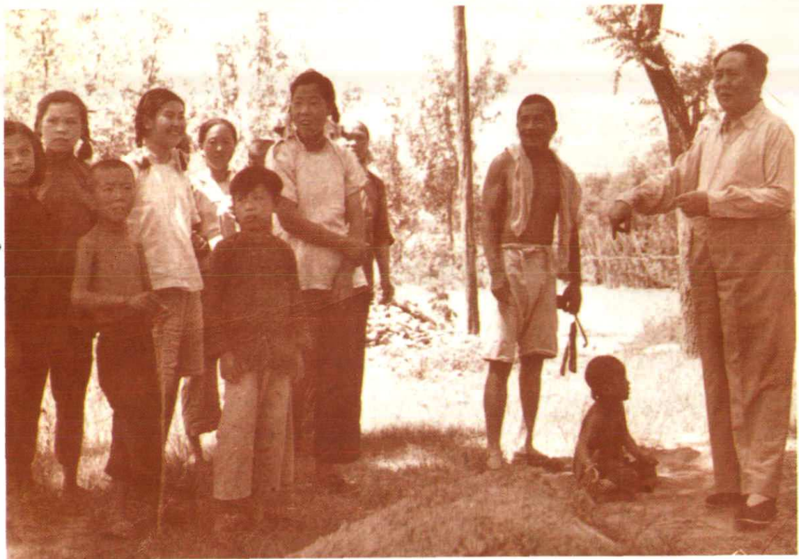
毛泽东与鱼池村(今国家奥林匹克体育中心)农民亲切交谈