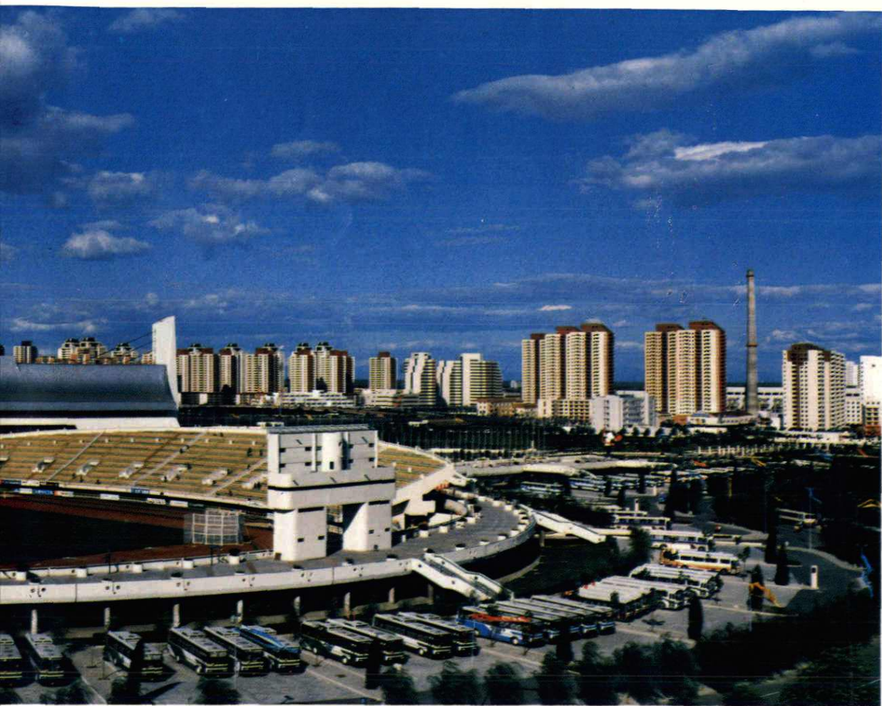
国家奥林匹克体育中心鸟瞰