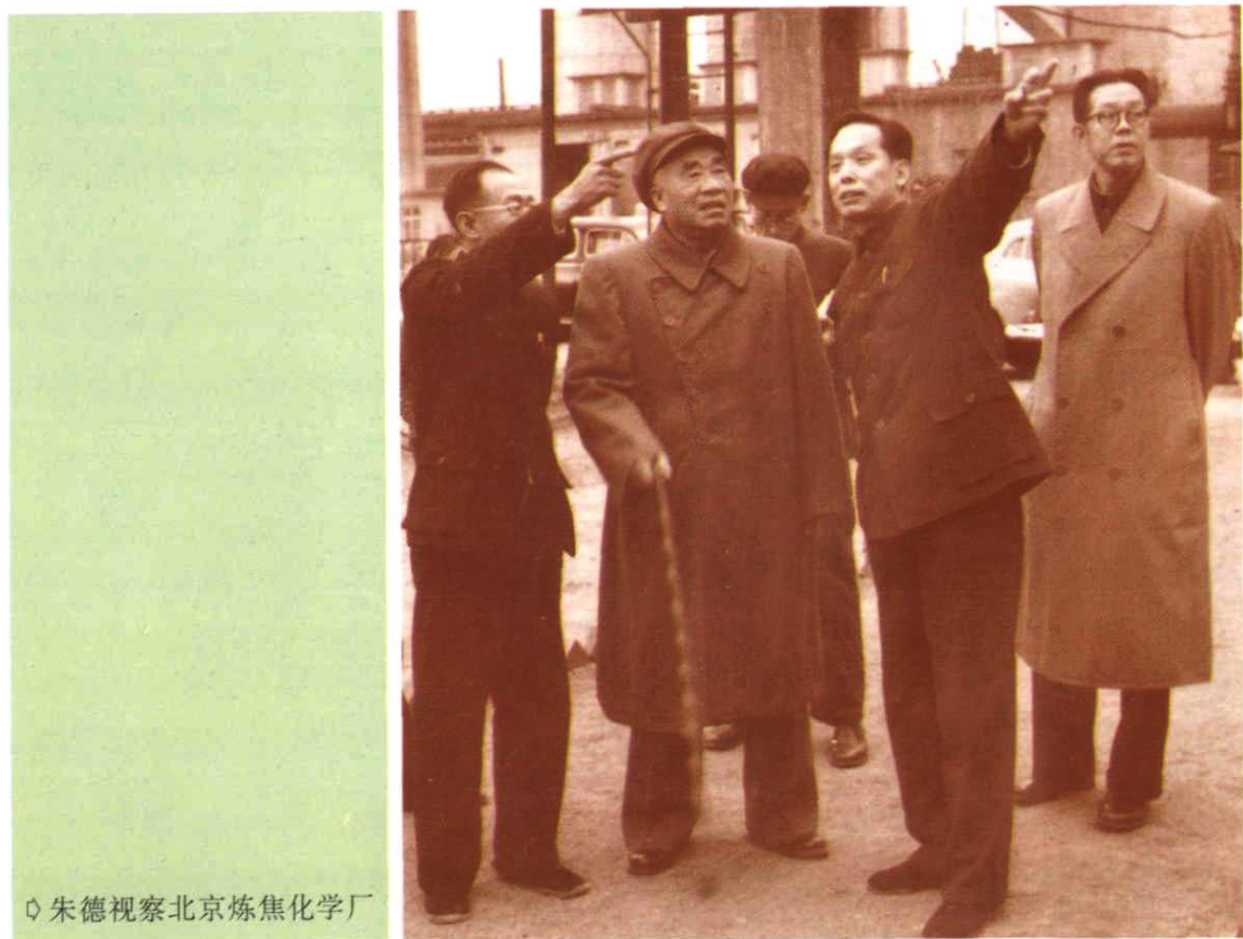
朱德视察北京炼焦化学厂