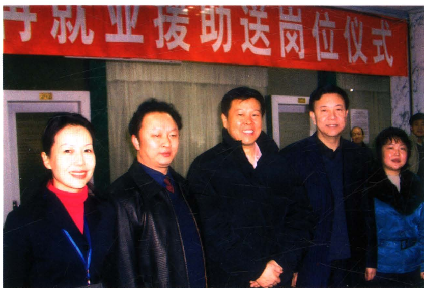
2007 年 1 月，财政部王军副部长（左 3）在兰州市调研本市下岗职工再就业援助送岗位工作