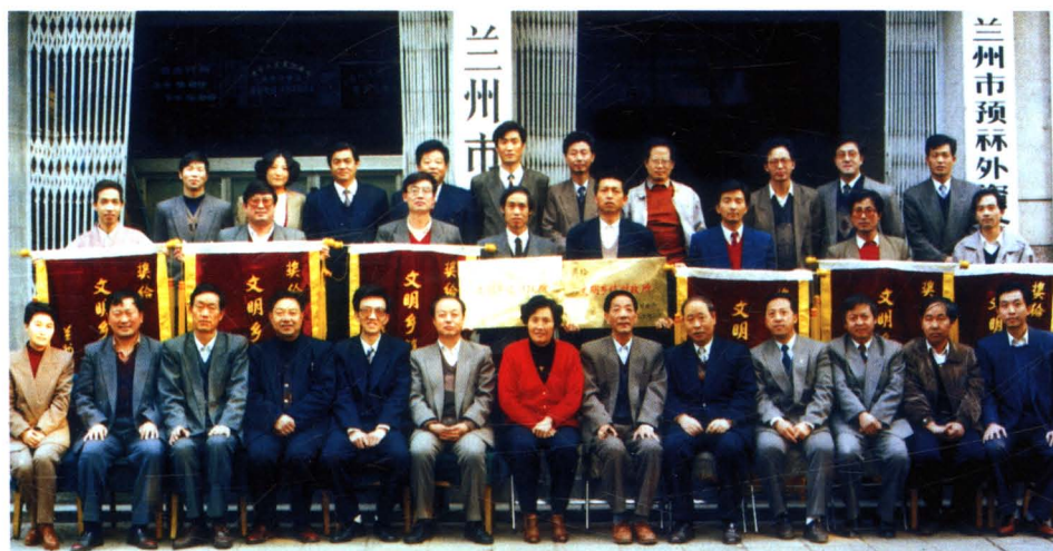
1995 年 10 月，市财政局表彰全市文明乡镇财政所合影