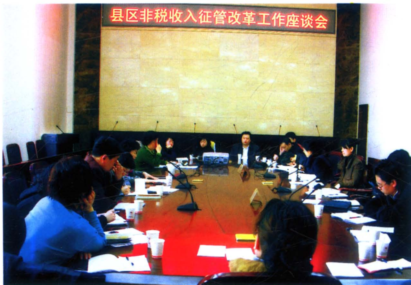
2009 年 11 月，市财政局召开全市非税收入征管改革工作会议