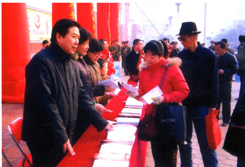
2008年1月，市财 政局在中心广场举办全 市非税收入征管启动仪 式