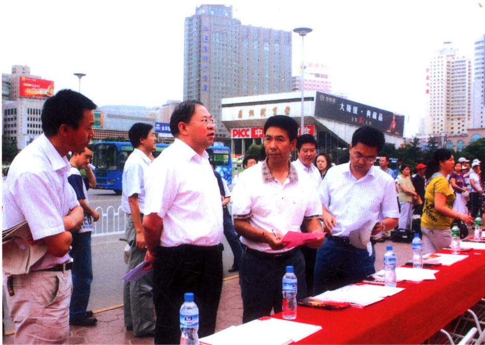
2008年7月，市委常委、常务副市长杨志武参加市非税收入征管启动仪式