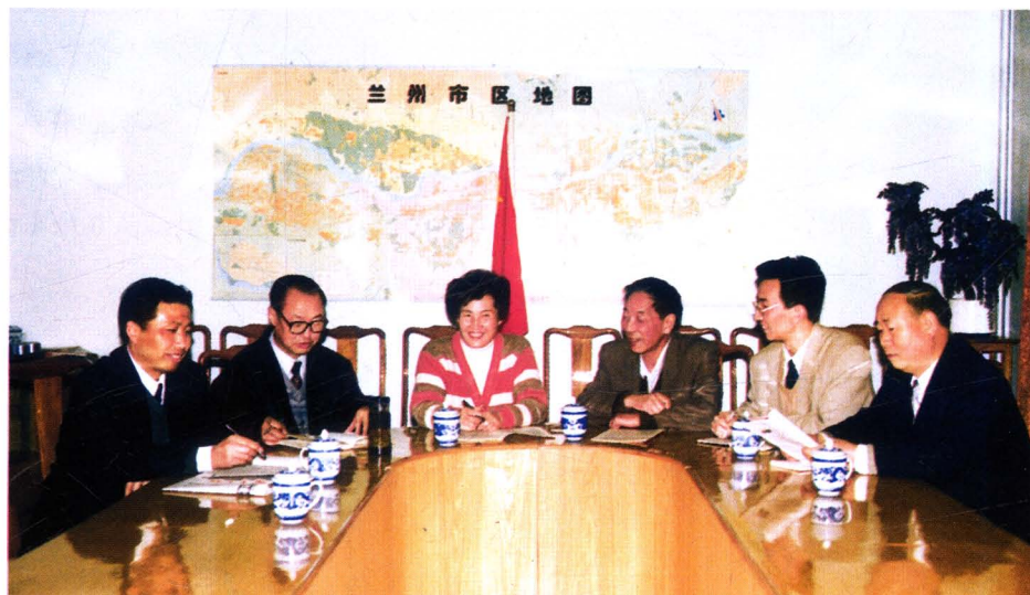
1997 年 11 月，市财政局 党组成员在研 究工作