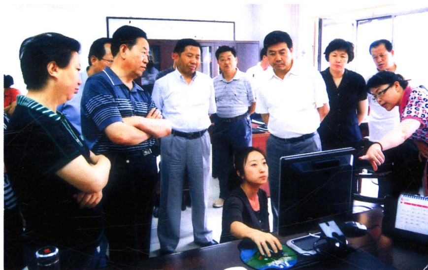
2009年7月， 市财政局领导检查 观摩互联网上工作 流程再造工作