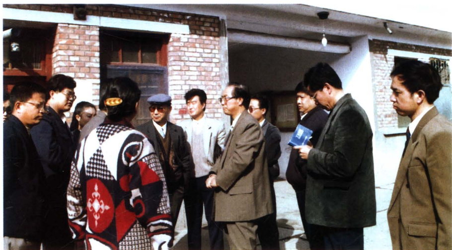
1993 年 10 月，省地税局史文献局长（右 5）在榆中县花寨子税务所检查指导工作