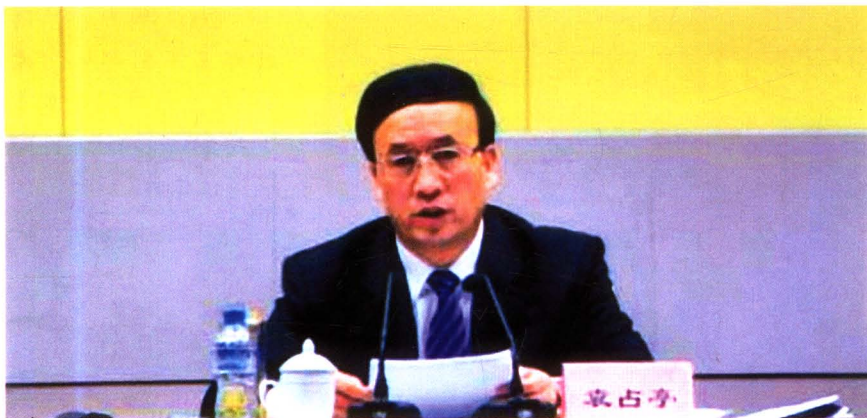
2010年2月，兰州市委副书记、市长袁占亭在全市财政工作会议上讲话