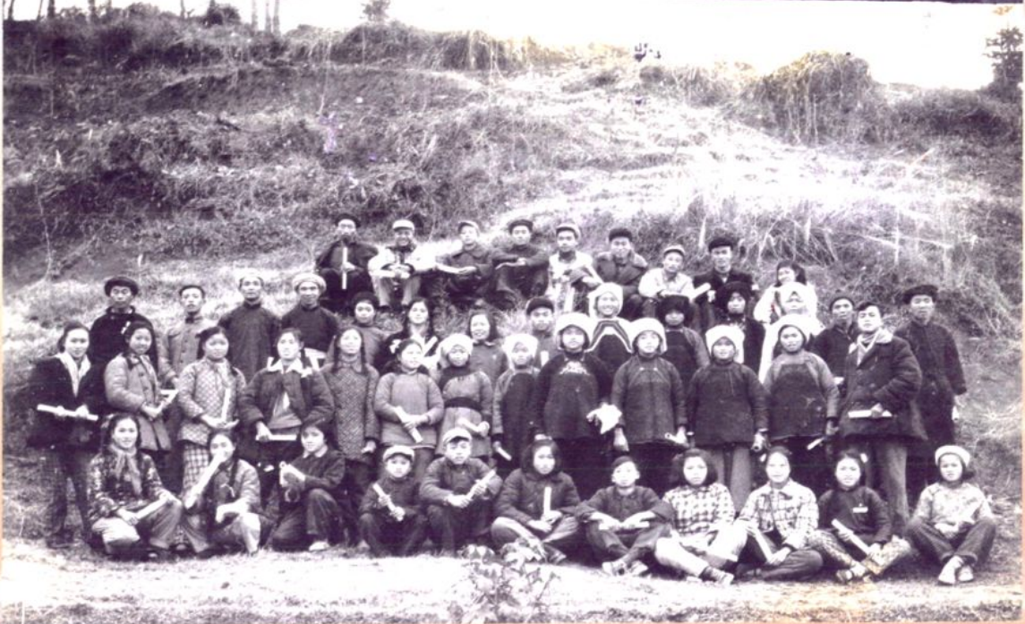
参加惠水县第三届工农业余文艺会演的演员、伴奏、创作、编导教师与先进文化积极分子合影留念

惠水县第三届工农业余文艺会演积极分子、伴奏人员、文艺创作、编导、教师与先进文化积极分子合影留念 1953.12.30.