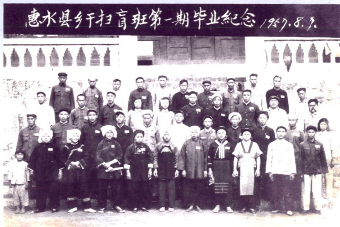
1957年8月惠水县第一期乡干部扫盲班毕业学员合影留念