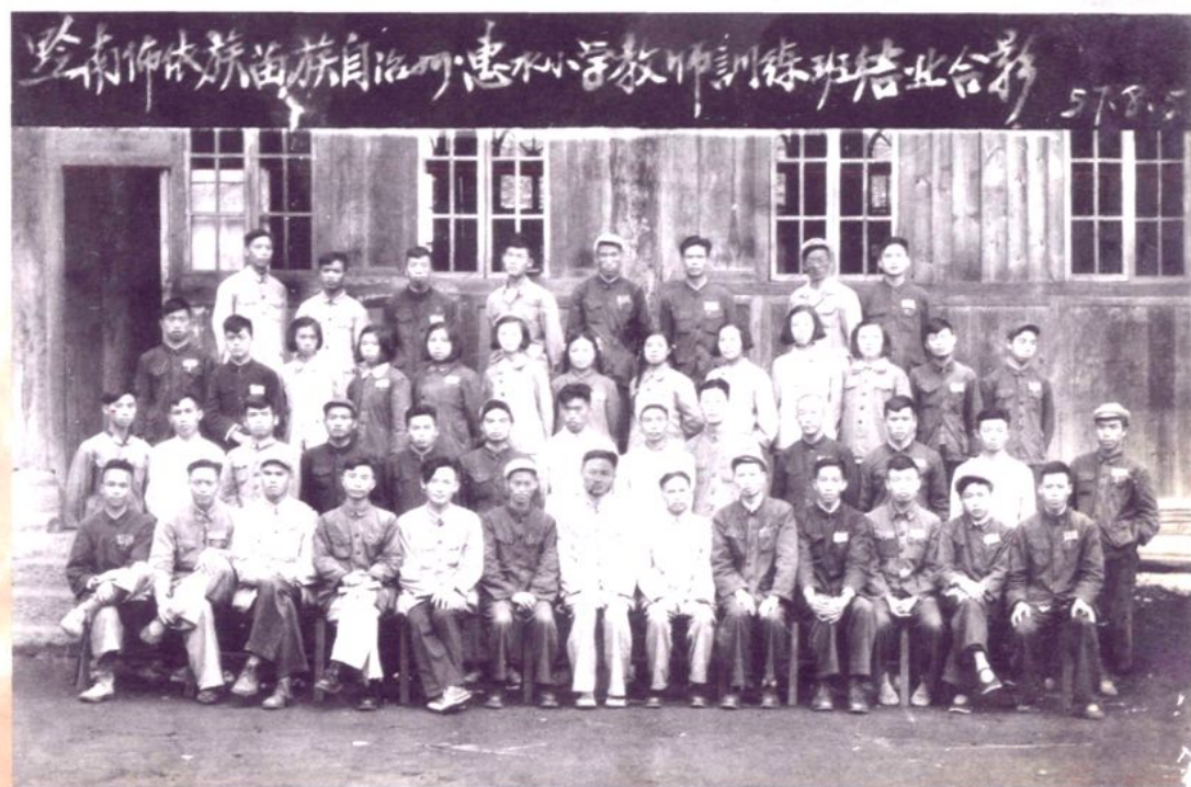
1957年8月惠水县小学教师训练班结业合影留念