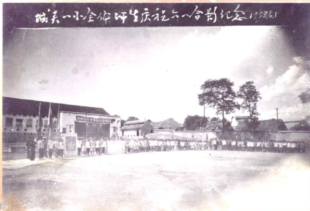
城关一小全体师生庆祝六一合影留念 1958.6.1