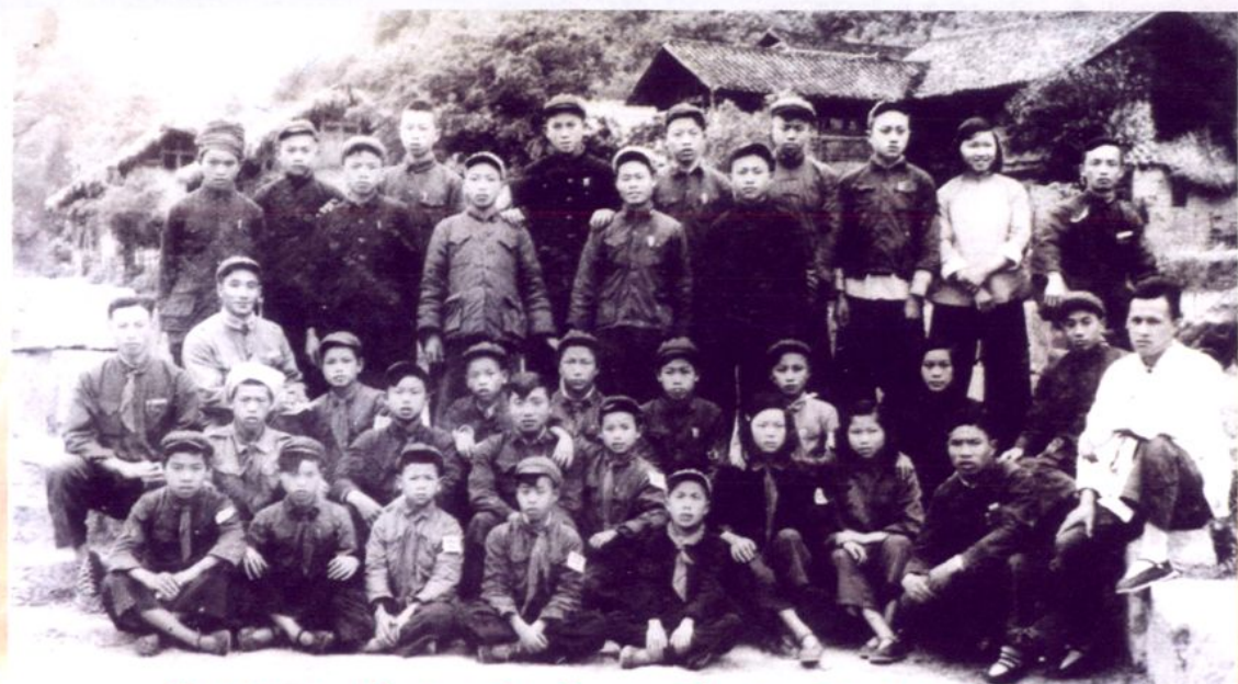
羡塘小学第三届高小毕业同学留影