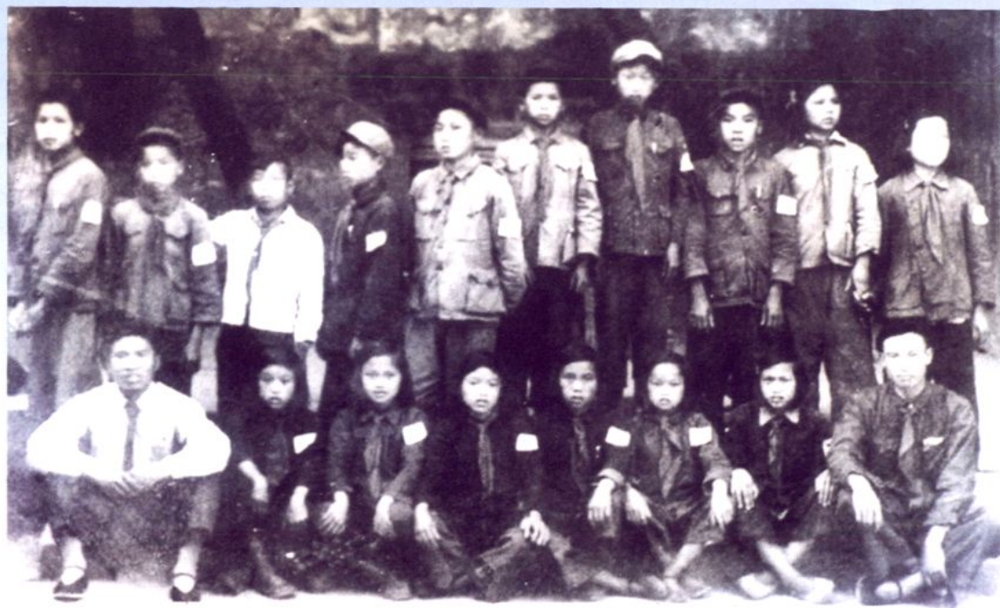
1956年6月1日惠水县羡塘小学少先队干部合影留念