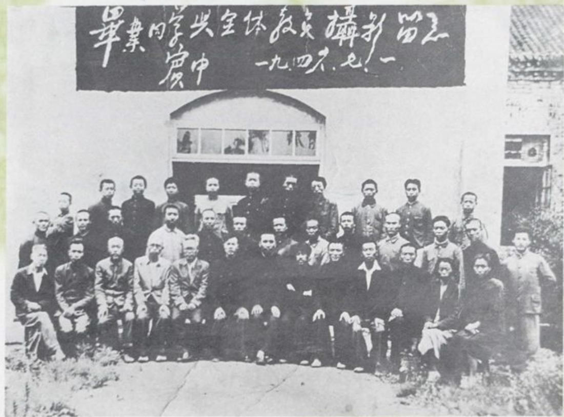
1946年毕业同学与全体教员合影