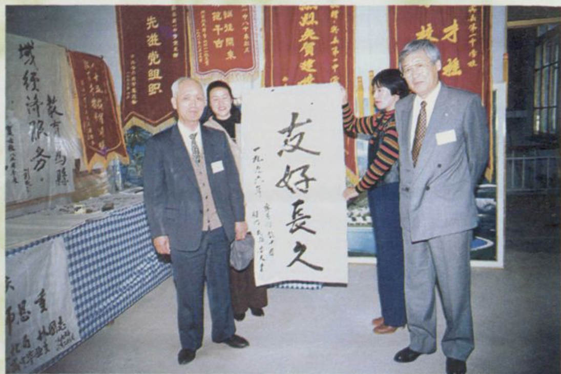
日本友人来校参观访问