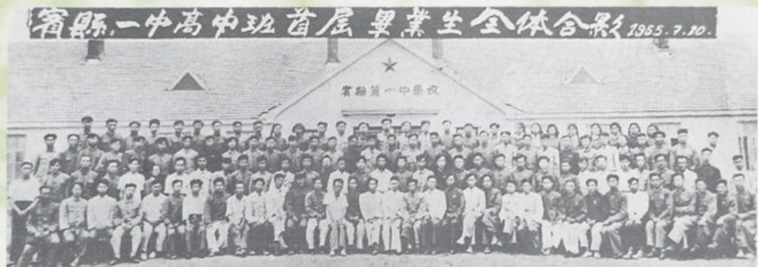
首屆高中畢業生合影