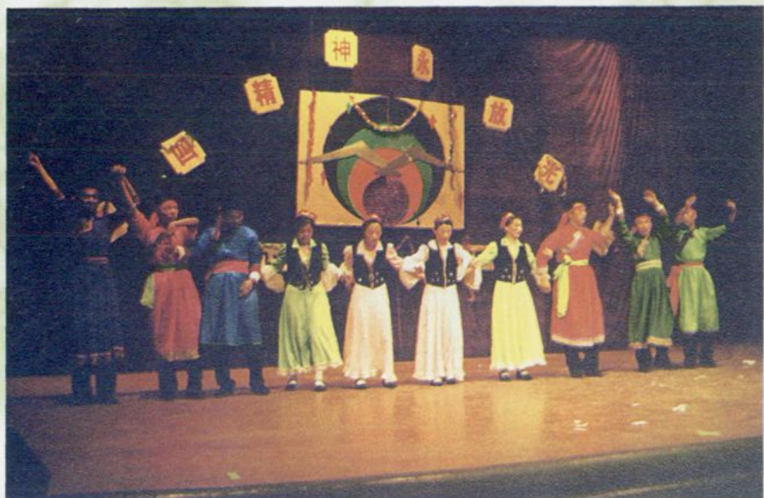
丰富多彩的文艺活动