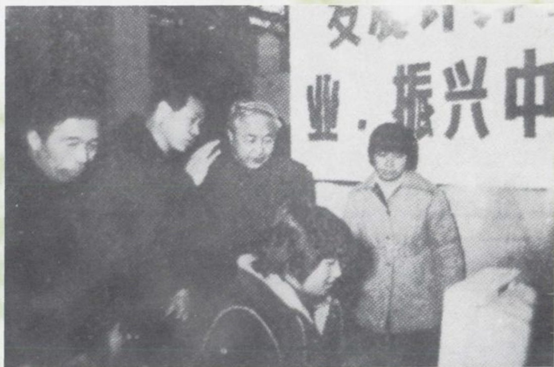
1985年省委书记孙维本观看宾县一中学生微机表演 右二孙维本 右四第六、七届全国人大代表,原一中副校长陈华雄