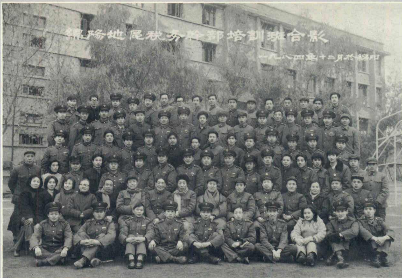
1984年9—12月，绵阳地区税务局在绵阳财干校举办税务干部“岗前培训班”。图为局领导及中层干部与学员、教员合影。