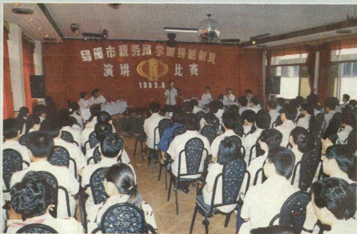
1993年6月，市税务局举办全市税务系统“学雷锋树新风”演讲比赛。