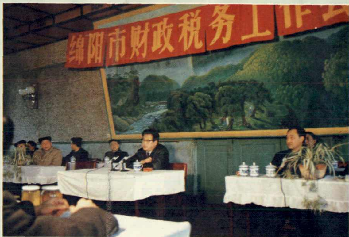
1989年1月,市长王金城在全市财税工作会议上讲话。

1991年9月27日,国家税务局副局长张相海(前排左六)在省税务局局长何明刚(前排左五)陪同下到绵阳检查指导工作,图为张副局长与市局机关干部合影。