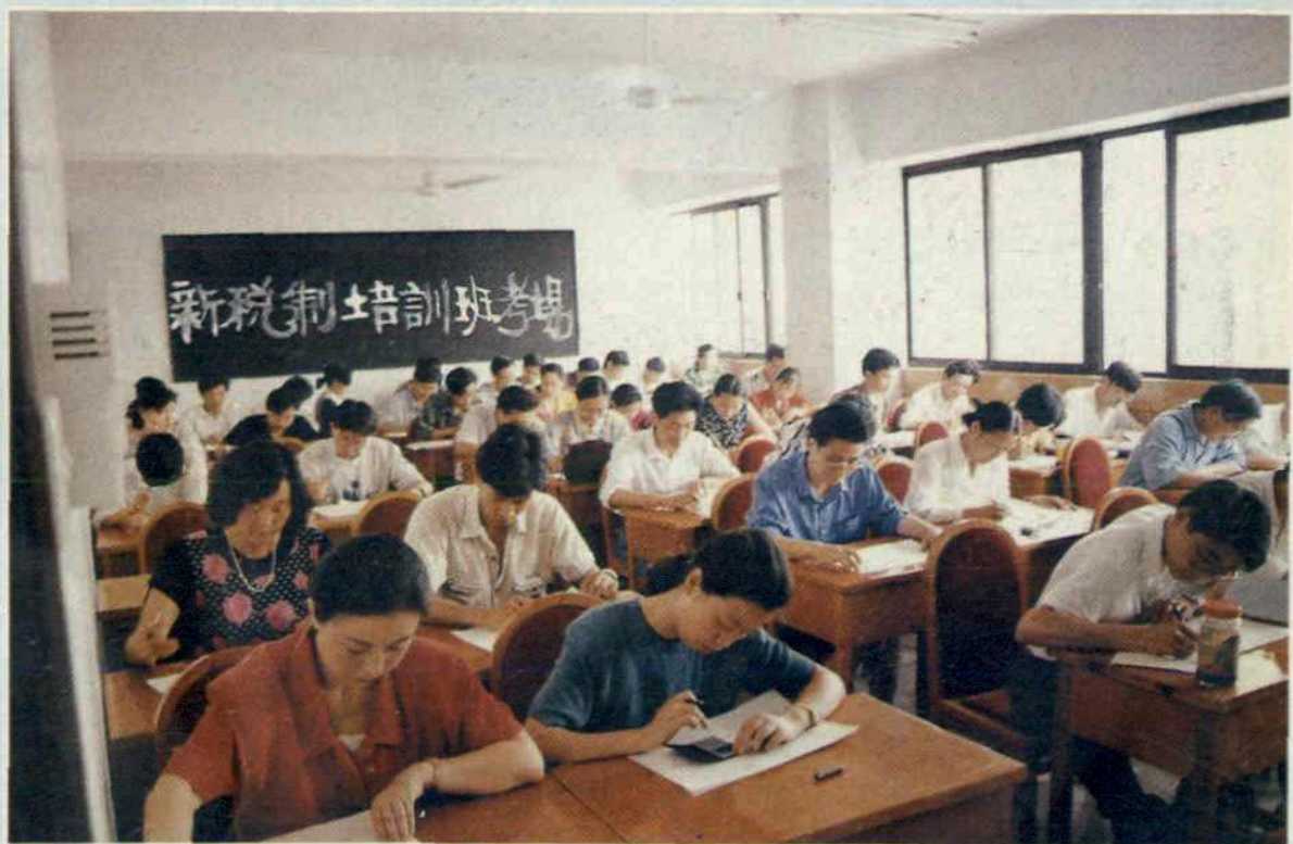
1994年5月23日,绵阳市税务局机关干部参加新税制培训统一考试。