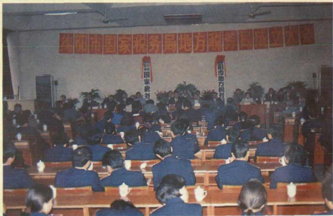
1994年9月26日,绵阳市税务局分设为市国家税务局、市地方税务局,两局成立大会在市政府第一会议厅举行。