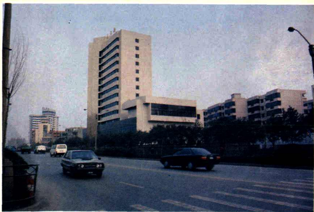
1993 年 12 月交付使用的绵阳市税务局新建的办公大楼和 职工宿舍——临园路西段附 5 号