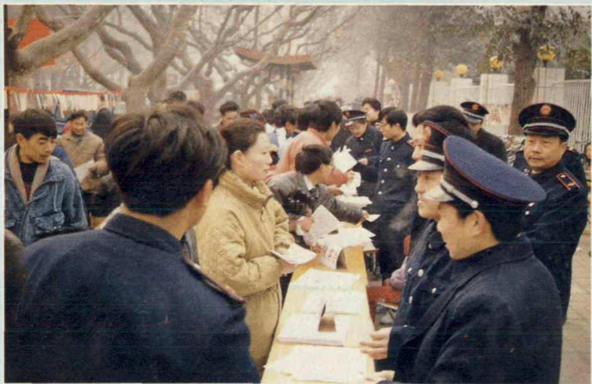
1994年1月23日,绵阳市税务局机关和四个分局的干部在绵阳街头宣传新税制。