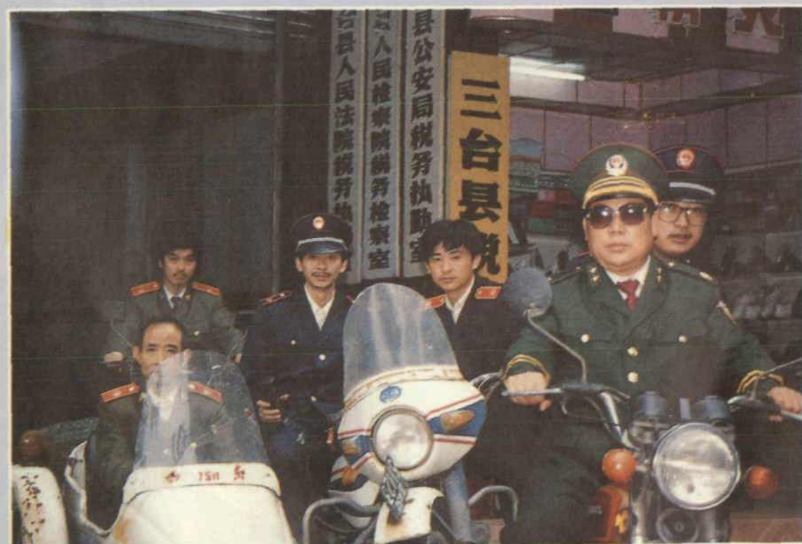
三台县税务三室(执勤室、检察室、执行室)人员外出执行公务。