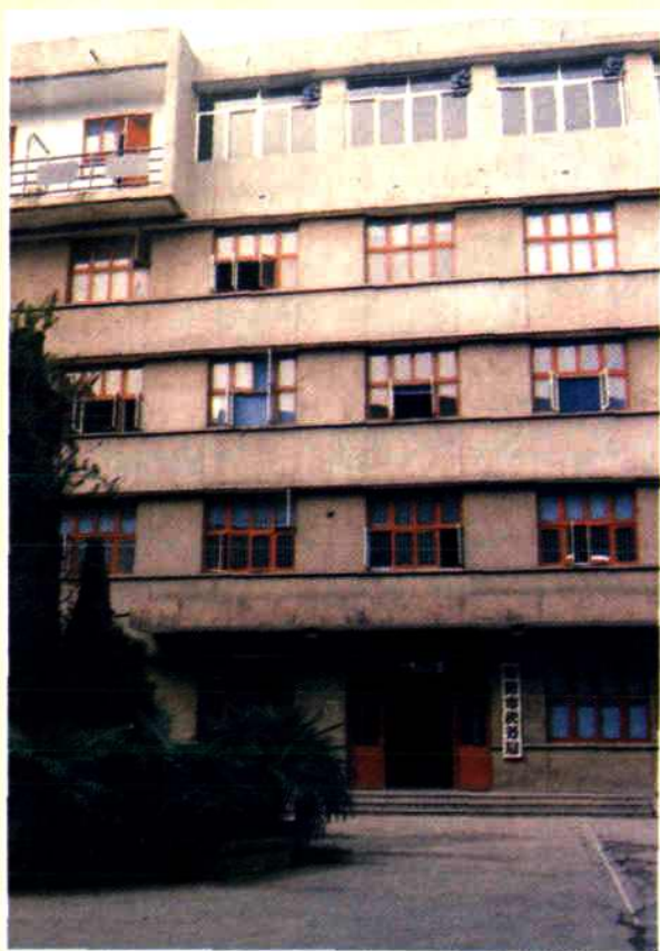
1994 年 2 月之前绵阳市税务局办公地址——警钟街 47 号