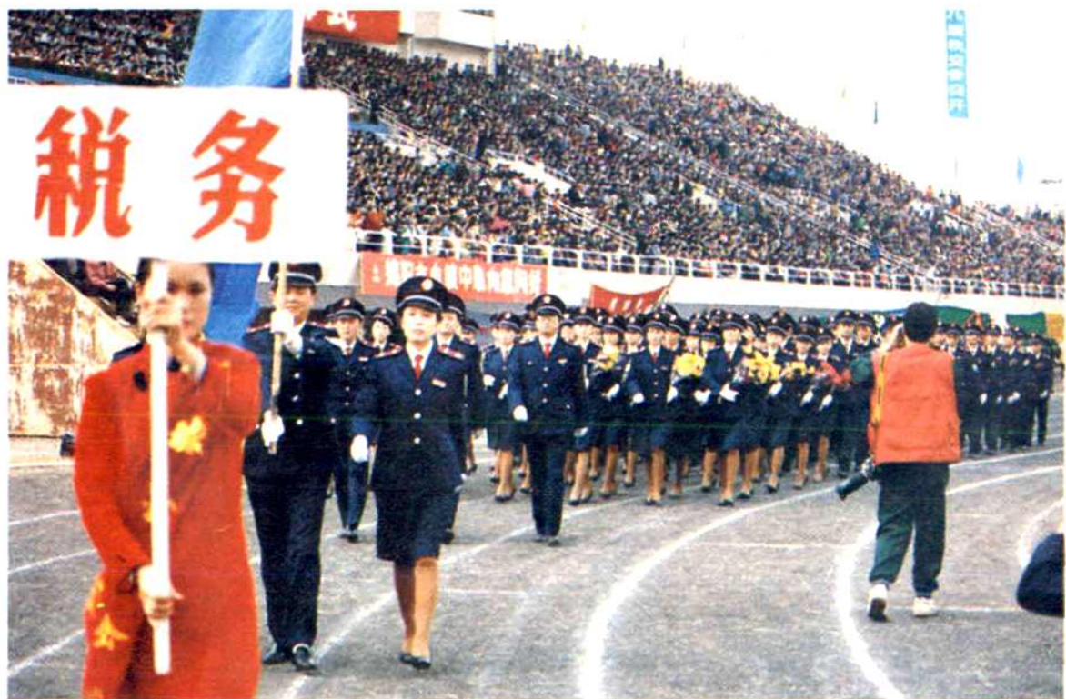
1993年10月,市局机关和四个分局组织的税务方队参加绵阳市第二届运动会和第八届秋交会开幕式。