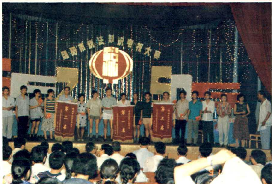
1991年7月,全市税法知识电视大赛在市委党校礼堂举行,图为前三名代表队合影。