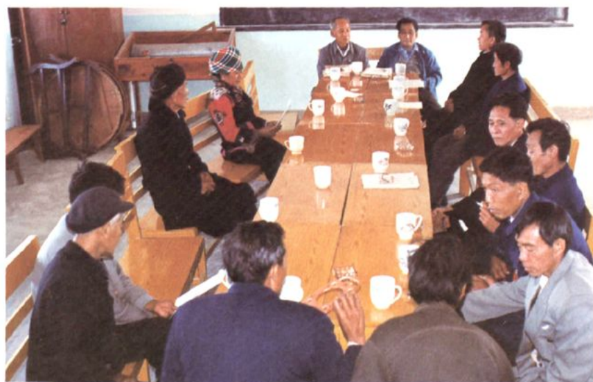
委员们分组审议政协绿春县常务委员会工作报告和协商绿春县人民政府工作报告