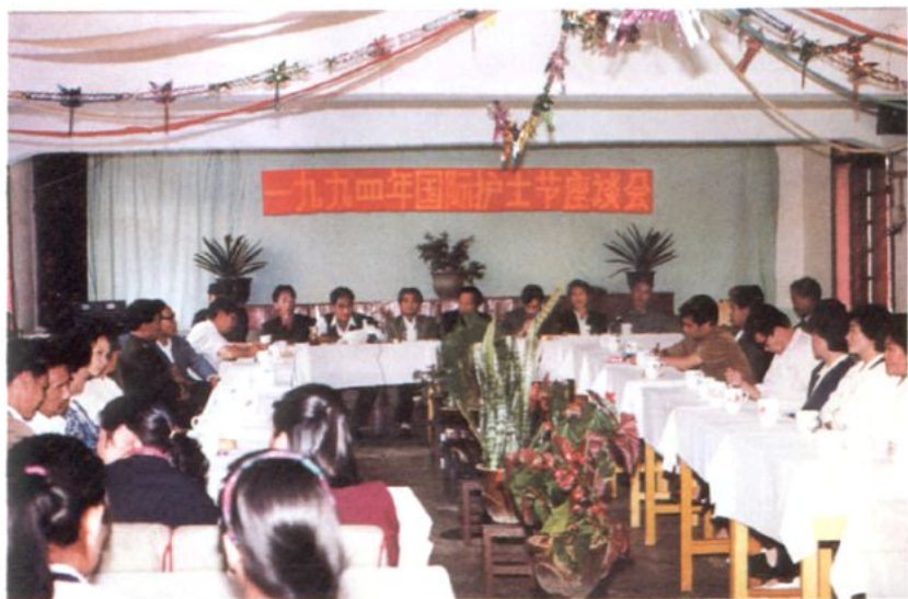
政协绿春县委员会召开『5.12』国际护士节座谈会