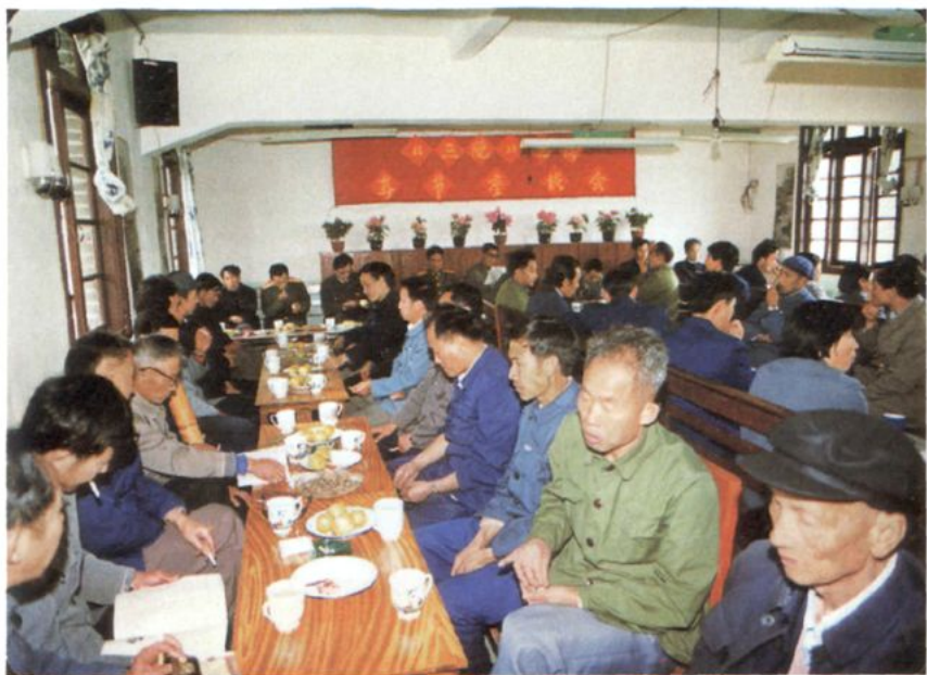
中共绿春县委、县人民政府、县政协召开 『三胞』眷属春节座谈会。