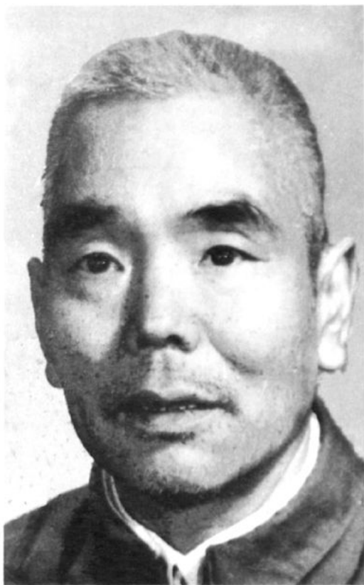
第三届政协主席李诗斌