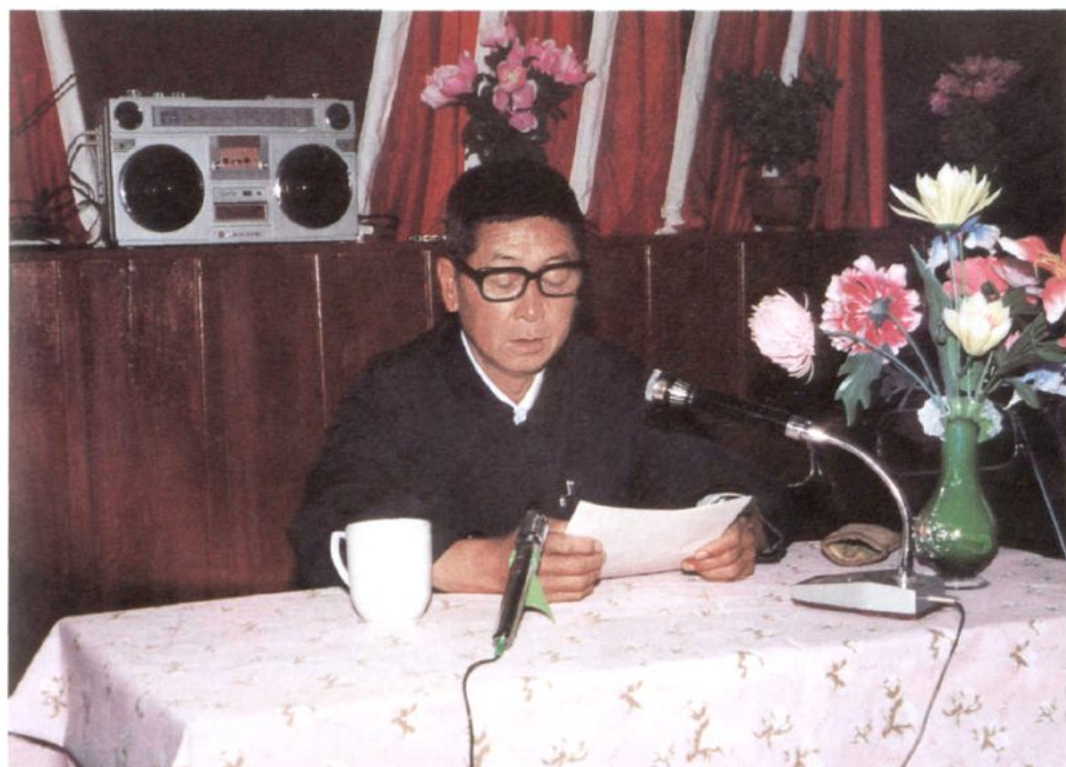
1989年3月15日，许宝义主席在六届二次会议上作常务委员会工作报告。