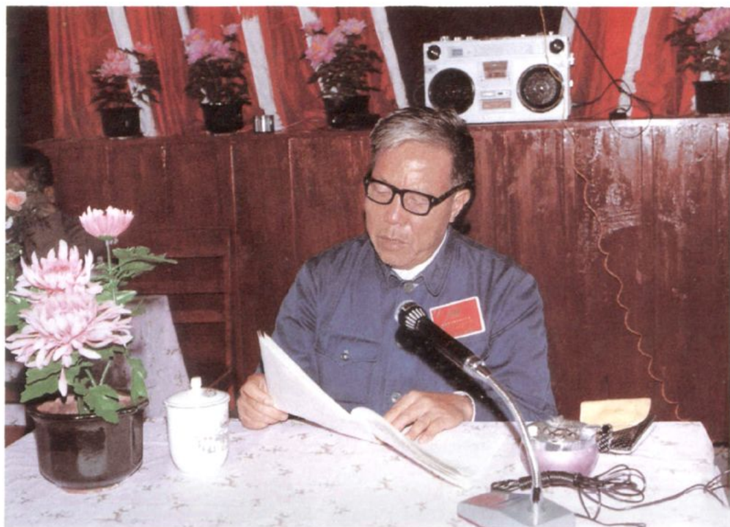
1985年6月15日，李济寿主席在五届二次会议上作常务委员会工作报告。