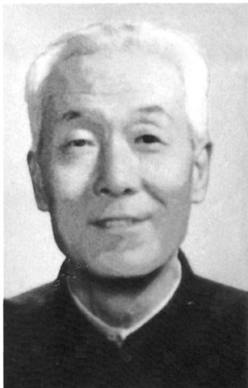
第一、二届政协主席杨发智