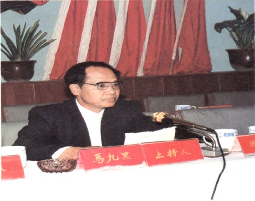
1993年3月6日，马九黑主席主持七届三次会议闭幕式。