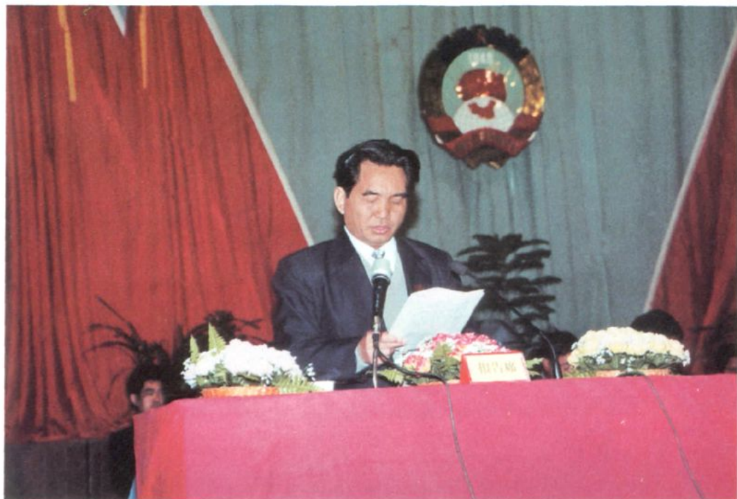
2001年2月19日，张谊宝主席在九届四次全会上作常务委员会工作报告。