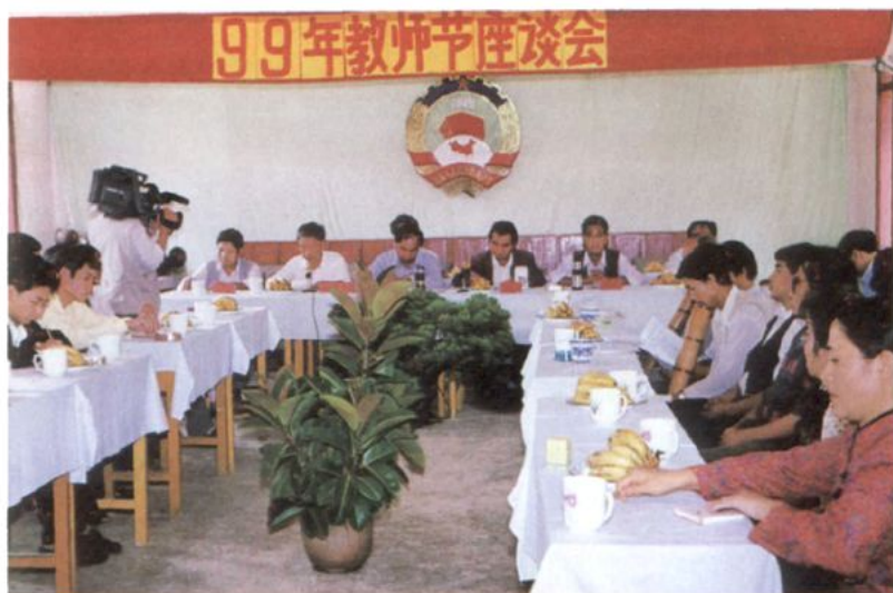
政协绿春县委员会召开教师节座谈会