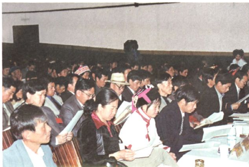
委员们听取常务委员会工作报告