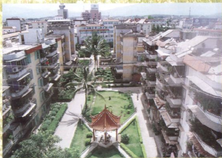
现在的职工宿舍区