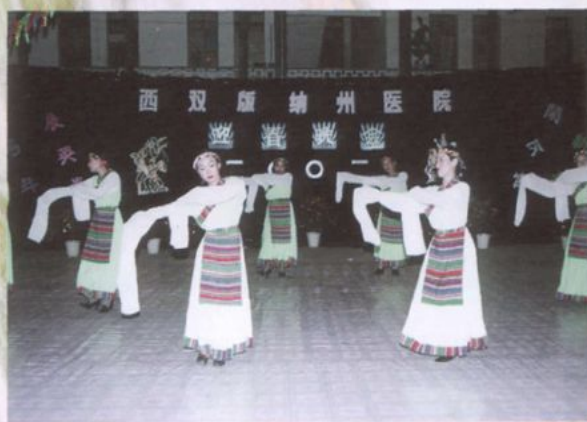
具有民族特色的文艺节目