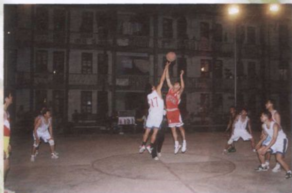
正在进行篮球比赛