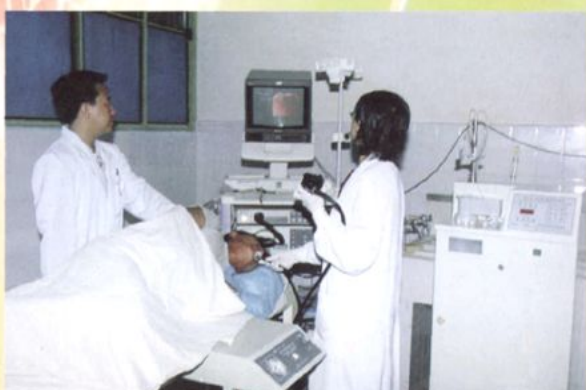
欧林巴斯 240 型电子胃肠镜