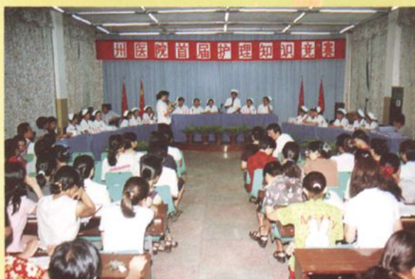
全院护理人员进行护理知识竞赛