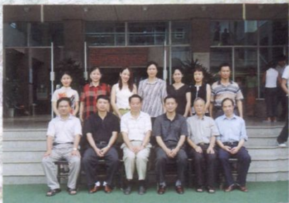
院志编辑领导小组及编辑组成员