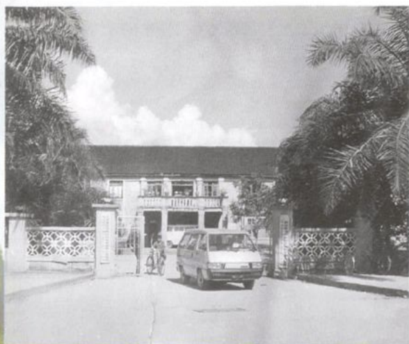
六十年代的门诊大楼