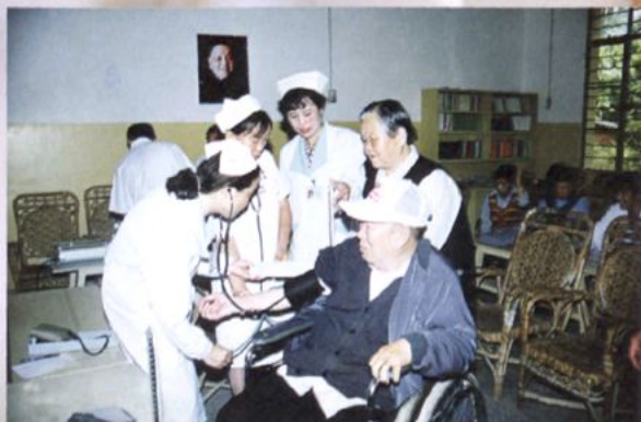
在州干休所为老干部义诊