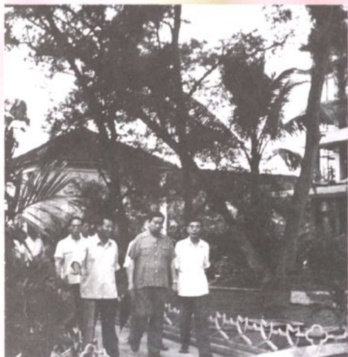
原卫生部长崔月犁视察州人民医院