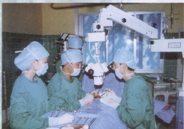
自体睾丸移植术在治疗高位隐睾中的应用 获 2001 年度云南省科技进步三等奖