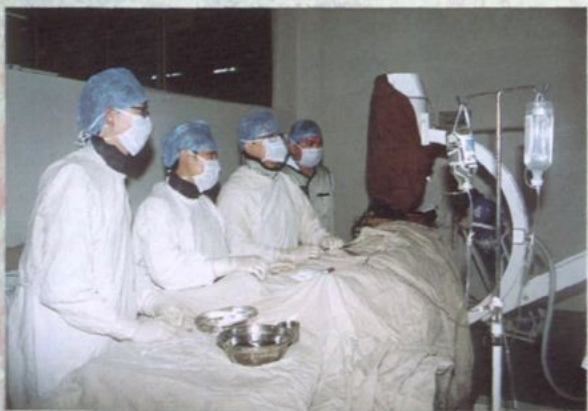
冠状动脉球囊扩张和支架植入术已经州科技局鉴定为 2002 年度西双版纳州科技成果