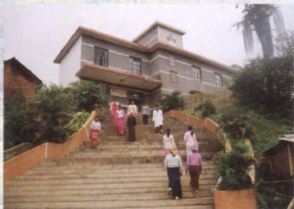
医院为下乡扶贫点勐海县勐宋乡卫生院修建的病人就诊通道