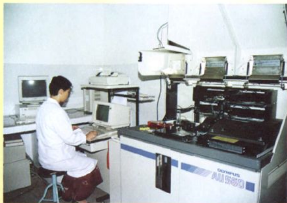
欧林巴斯 AV-560 型全自动生化仪