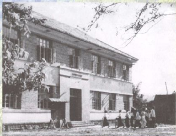
六十年代的州医院