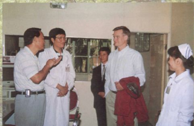
英国医学专家考察州人民医院