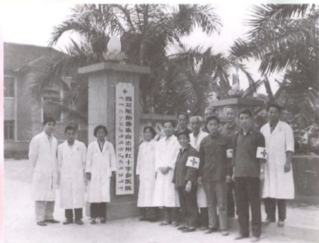
原中国红十字总会副会长杨纯视察州人民医院