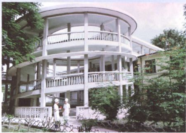
八十年代的住院楼