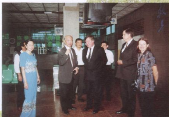
澳大利亚大使考察州人民医院