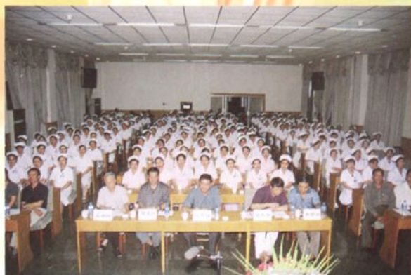
医护人员正在进行职业道德演讲