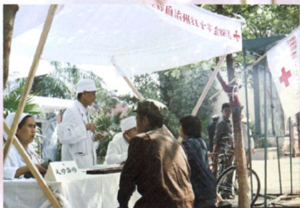
经常派出医疗队为群众义诊治