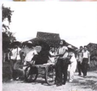
建院初期,医护人员深入村寨为各族群众防病治病。