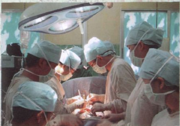
正在进行心脏冠状动脉搭桥术