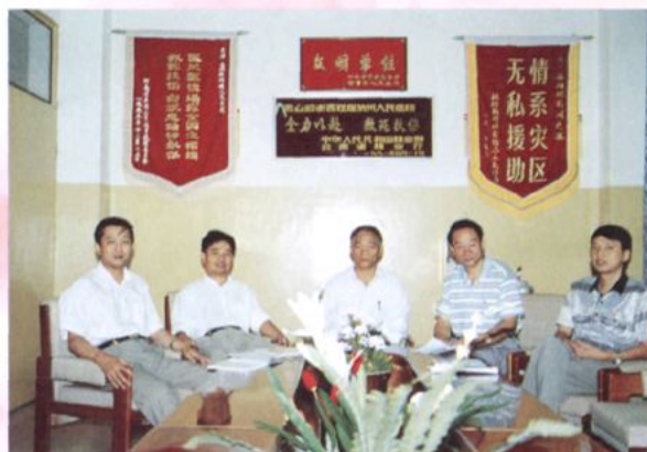
团结、开拓、进取的医院领导班子