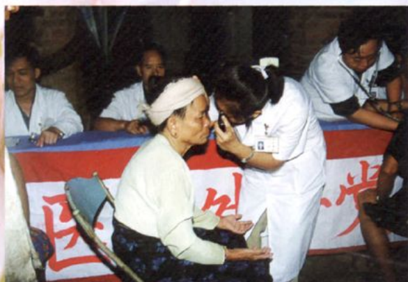
医院外产党支部深入村寨为少数民族送医送药