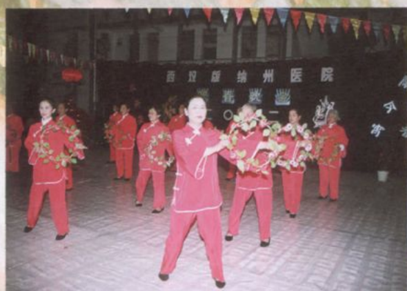
退休职工在医院迎春晚会上献艺