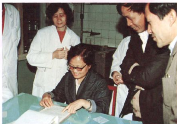
原省卫生厅厅长吴坤仪深入州人民医院 检查医疗质量