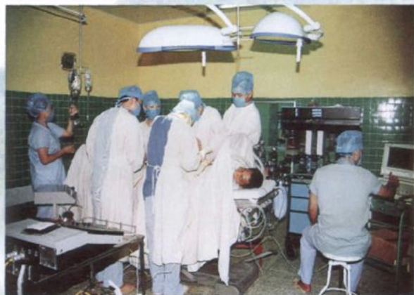
同种异体肾脏移植手术获 1996 年度西双版纳州科技进步一等奖