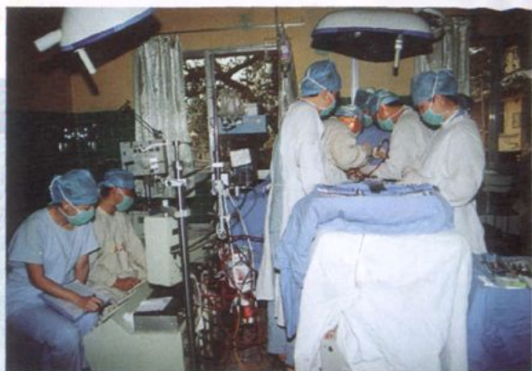
体外循环下行心脏直视手术获 2000 年度西双版纳州科技进步一等奖