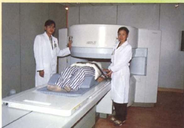
日立 0.3T 永磁开放型磁共振成像系统