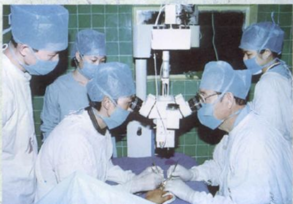
显微镜下行第二趾趾游离移植再造手指术 获 1999 年度云南省科技进步三等奖