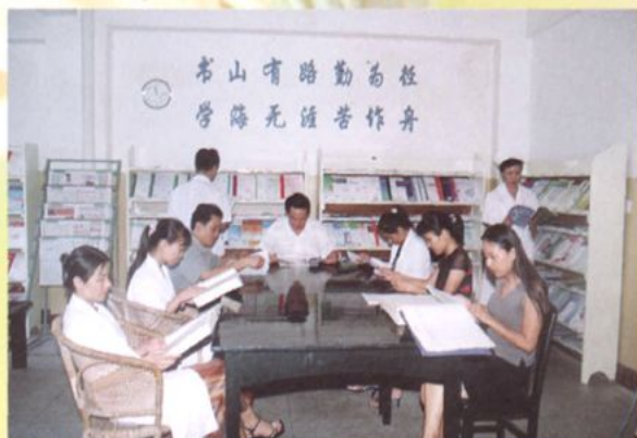
医护人员正在图书室查阅医学资料