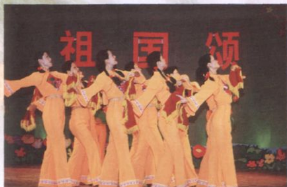
医院职工参加州直机关文艺演出