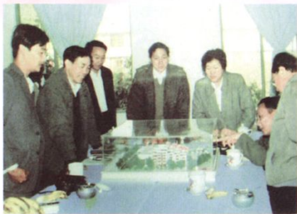
原国家计委副主任郝建秀视察州人民医院 拟建的门诊大楼模型