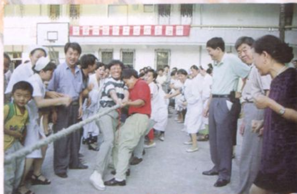
科室之间进行力顶相当的拔河比赛