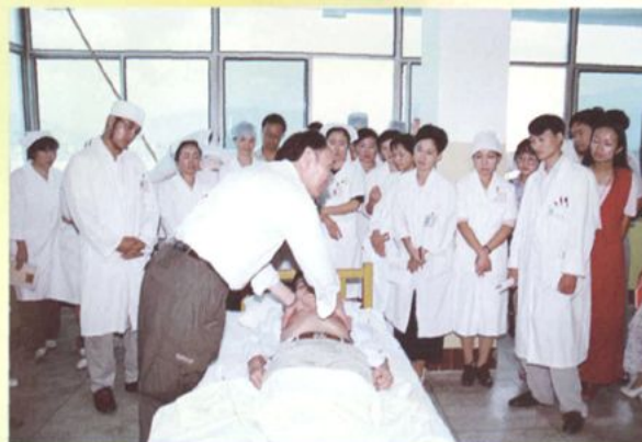
省级医院教授给我院医护人员进行“三基培训”指导