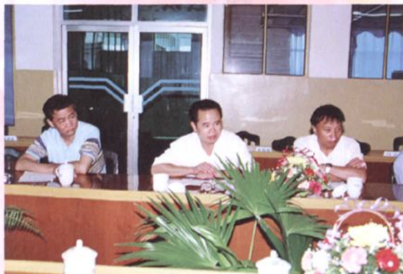
州卫生局局长刀光荣在州人民医院考核 职业道德建设情况