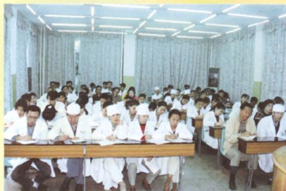
医务人员正在进行学术讲座