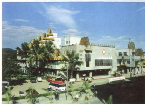
九十年代重建的门诊大楼