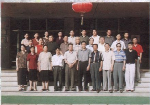
院志评议委员合影