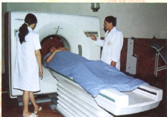
日本产岛津全身 CT 诊断仪