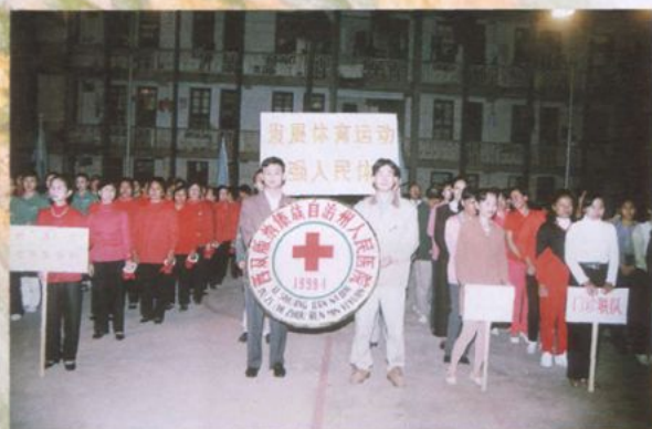
医院职工运动会开幕式