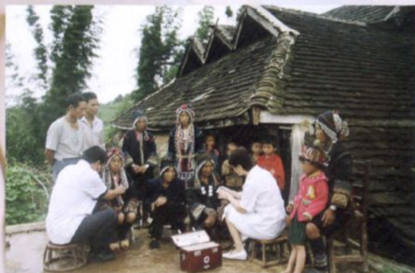
医院到边远村寨为少数民族送医送药