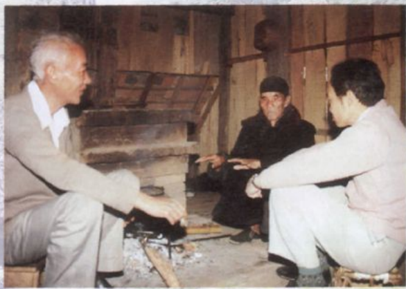
编纂人员走访解放前傣族西医师岩腊老五