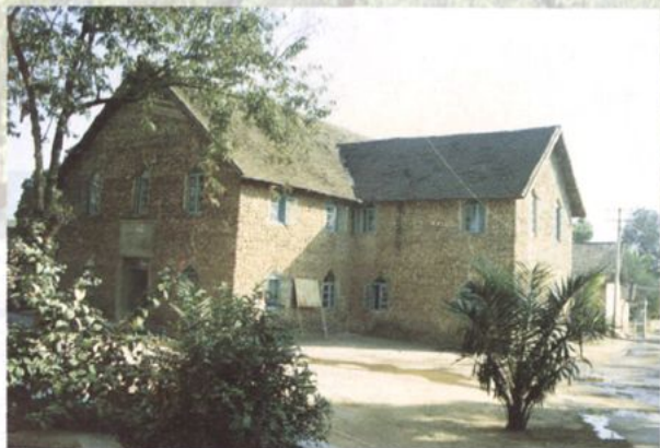
建院初期的州医院