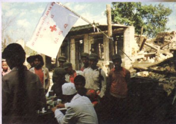
澜沧大地震期间,我院医疗队深入重灾区为群众治病治伤。