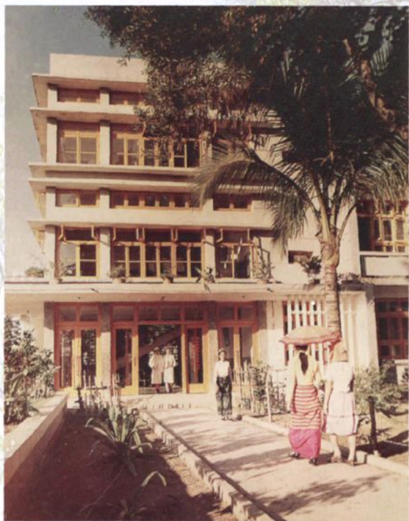
七十年代的住院楼