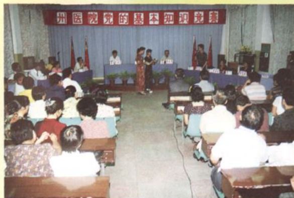
组织党员进行党的基本知识竞赛