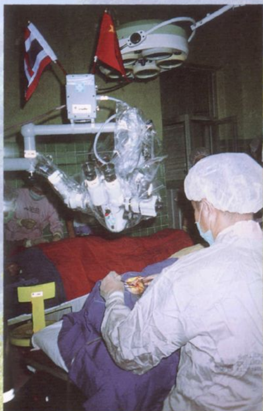
泰国医学专家在州人民医院作手术示范