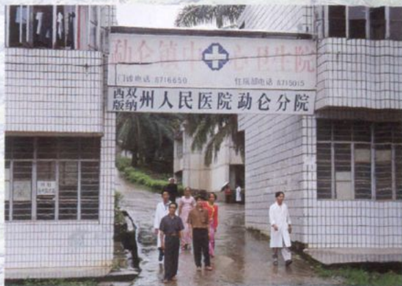
医院的医疗技术扶贫点之一——勐腊县勐仑镇中心卫生院