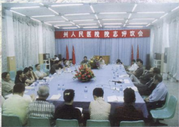
院志评议委员对院志进行评议