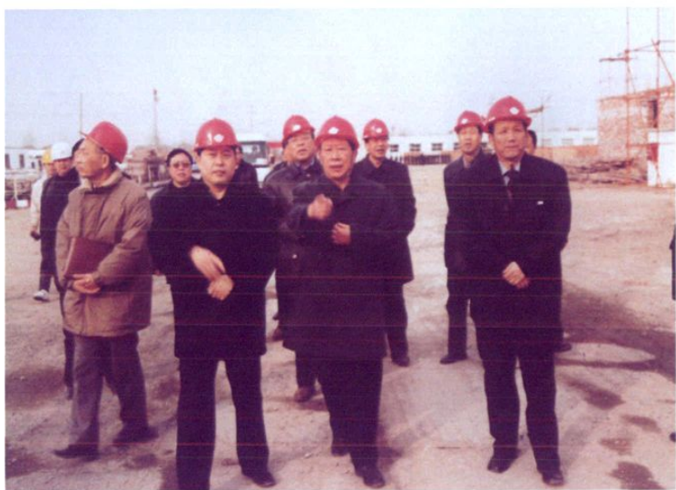
2002年1月,副市长俞海潮考察天津交通职业学院建设工地