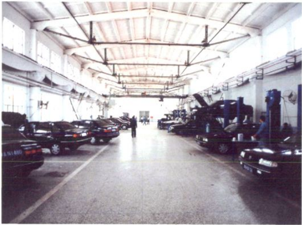
小客车修理厂的修理车间