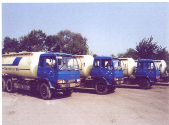
汽车运输二场散装水泥车队