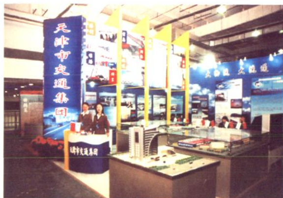
2005年4月,天津市首届经济合作与投资洽谈会暨第十二届春季商品交易会中的交通集团展厅