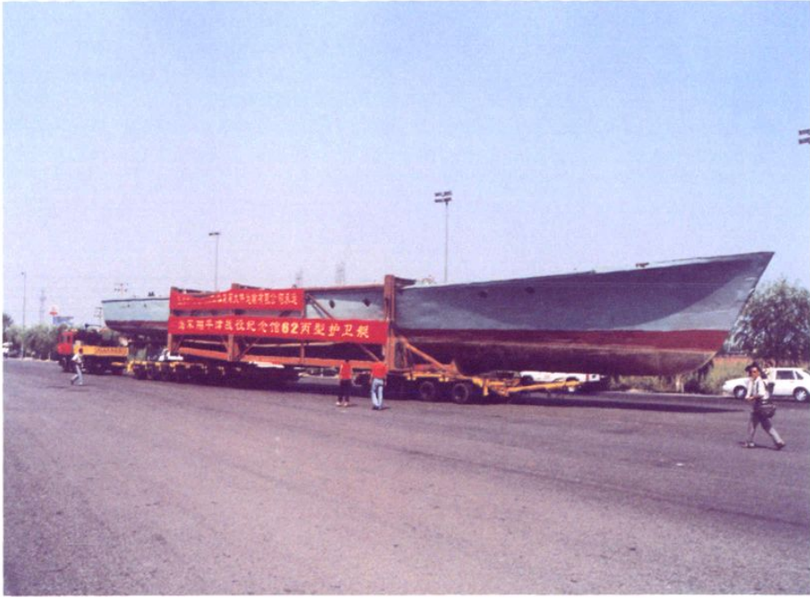
国际集装箱大件运输有限公司为天津平津战役纪念馆运输62丙型护卫舰