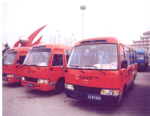
家居装饰建材物流配送专用车