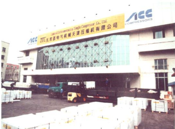
为扎努西电气机械天津压缩机有限公司运输机电产品