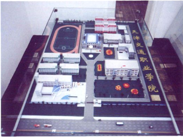
天津交通职业学院规划平面图