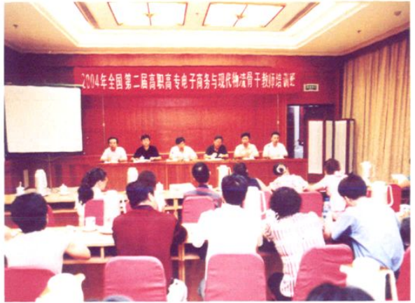
参加全国第二届高职高专电子商务与现代物流 骨干教师培训班