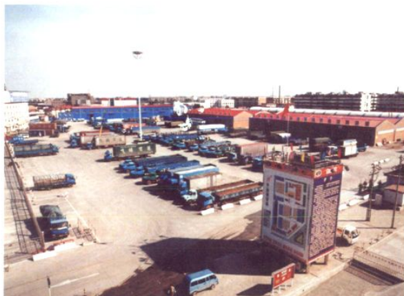
天津市物流货运中心一瞥