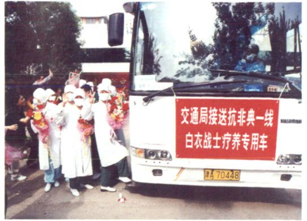
运送抗击“非典”医务人员