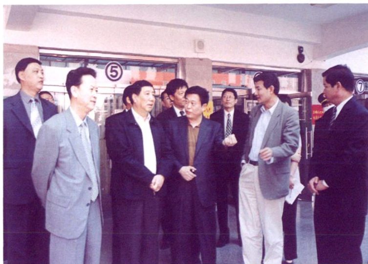
2003年4月21日,交通部副部长洪善祥考察天环客运站