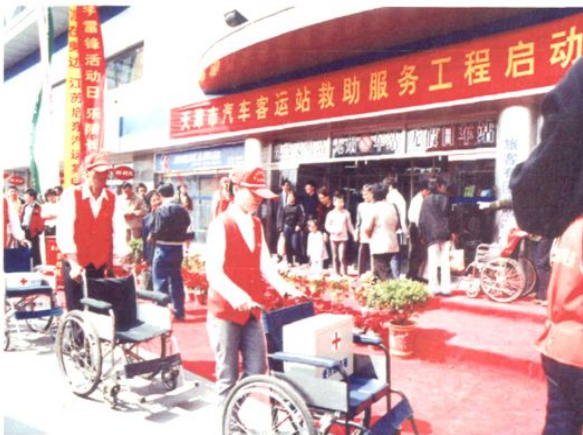
天津市汽车客运站救助服务工程启动