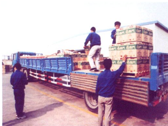
工人们在现场装运福临门食用油