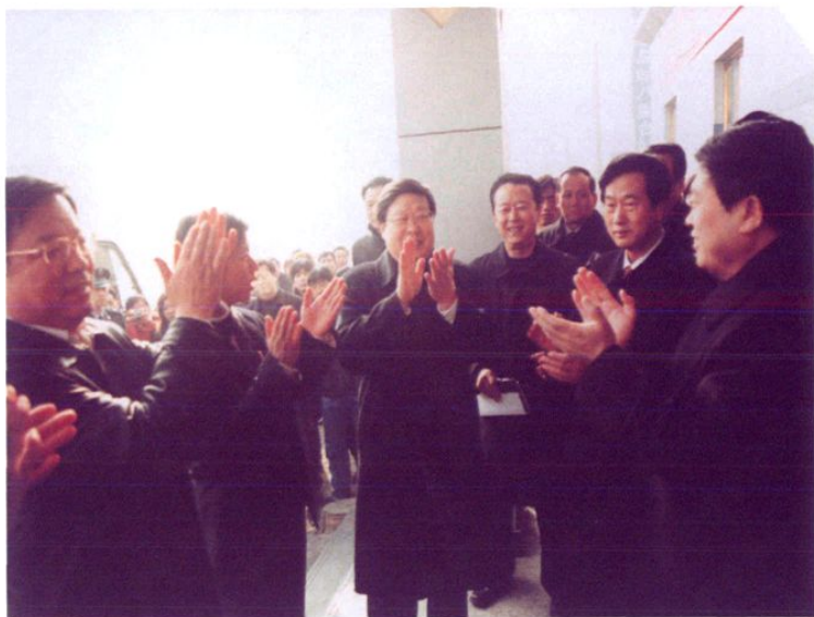
2006年1月27日,中共天津市委副书记、常务副市长黄兴国考察长途汽车西站客运站