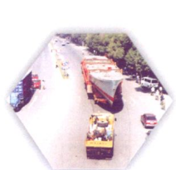
62丙型护卫舰在运输途中