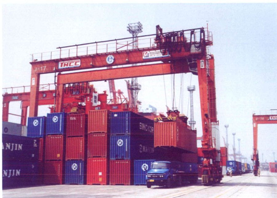
集装箱正吊装到汽车上