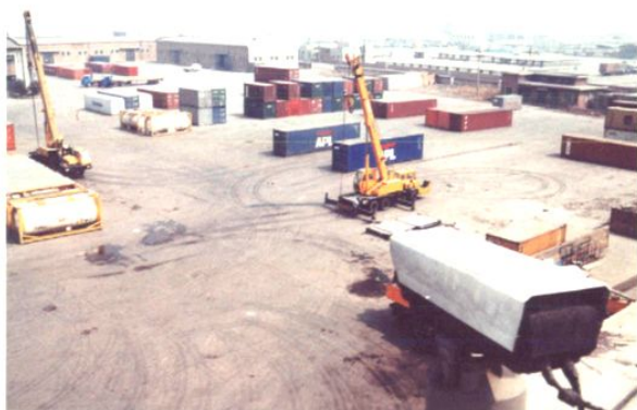
吊装集装箱和各类超限物资的起重汽车