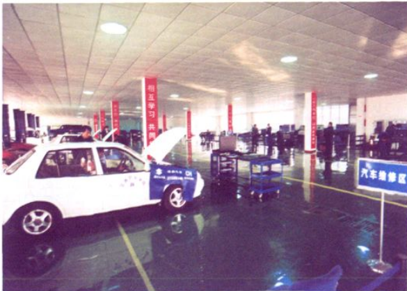
交通职业学院的汽车实训中心