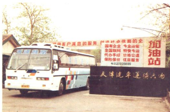
汽车运输六场外景