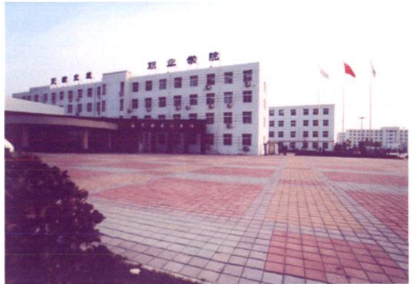
天津交通职业学院