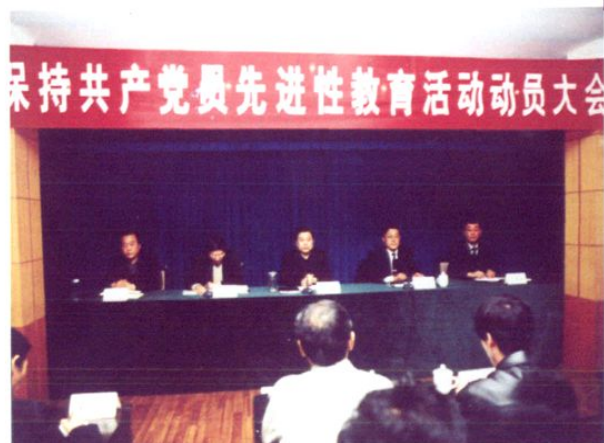
2005年6月,市交通局系统开展保持共产党员先进性教育活动