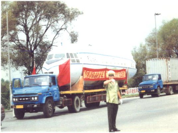
1998年8月13日-14日,周恩来总理所乘专机在运津途中