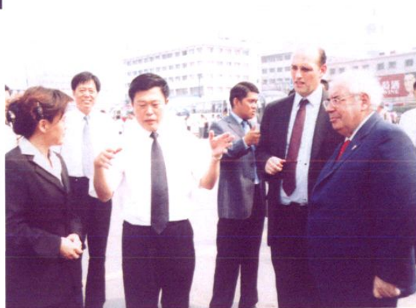
2004年5月,日本三八五集团向天津市交通局赠车仪式在交通职业学院举行