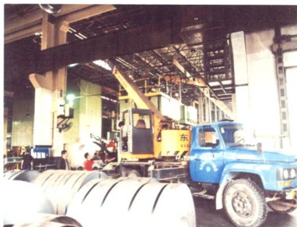
正在吊装作业的起重汽车