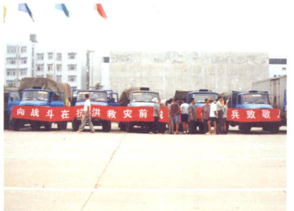
支援湖北抗洪救灾的运输车队待发