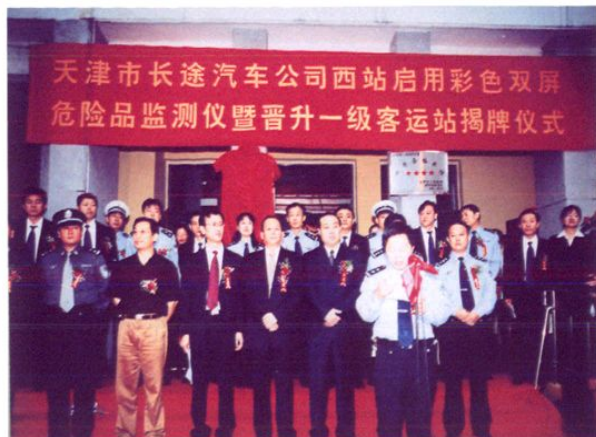
长途客运西站启用彩色双屏危险品监测仪暨晋升一级客运站揭牌仪式