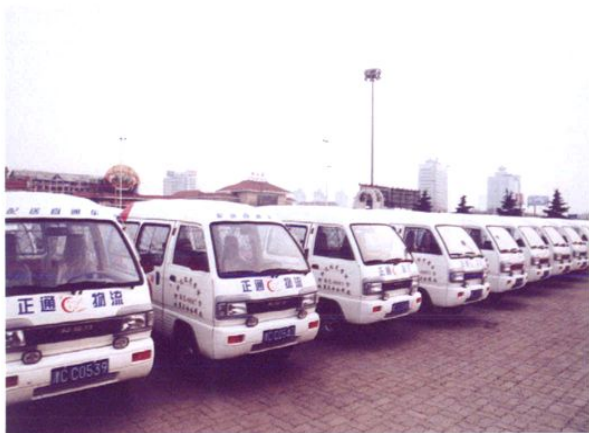
正通物流配送直通车