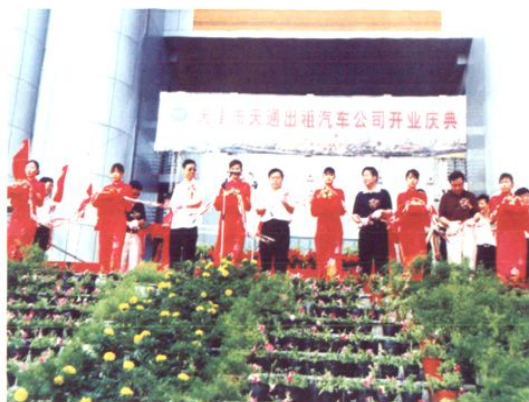
2005年6月,天津市天通出租汽车公司开业庆典