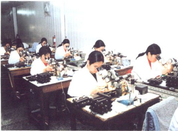
红旗电子灯泡厂的工人们对产品一丝不苟、精益求精