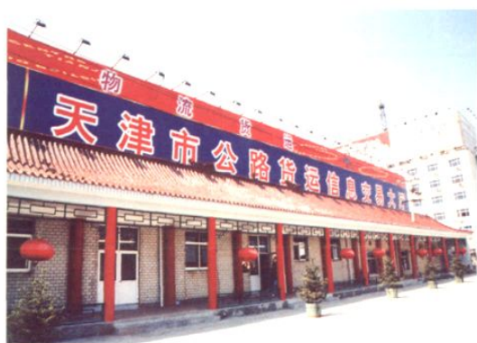
天津市公路货运信息交易大厅