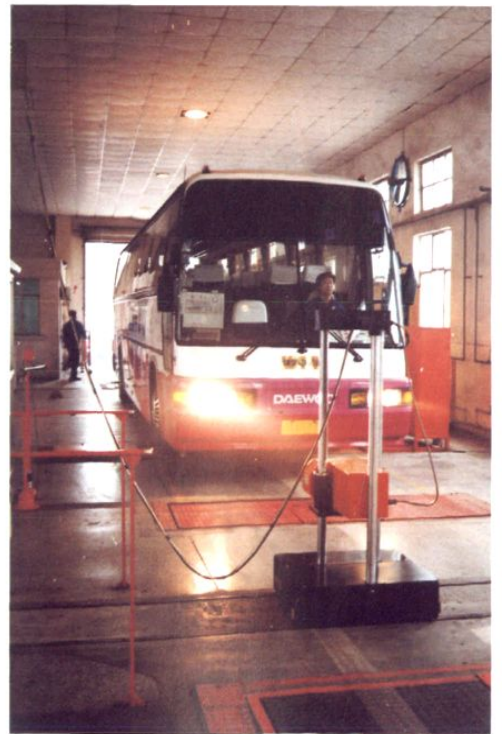
特种车修理厂的汽车安全技术性能检测线