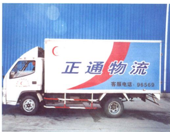
物流配送厢式货车