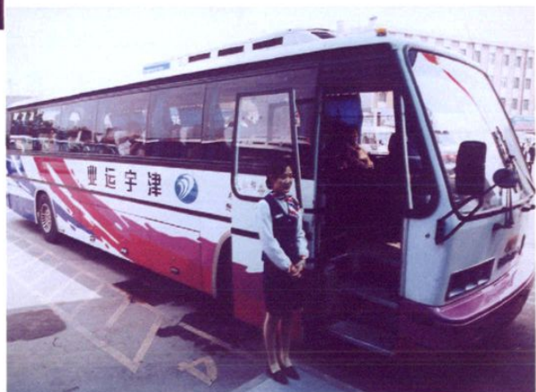
津宇运业有限公司汽车客运乘务员热情迎候旅客