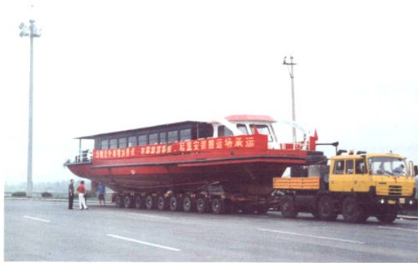
2004年7月,为塘沽外滩景点运输大型游艇