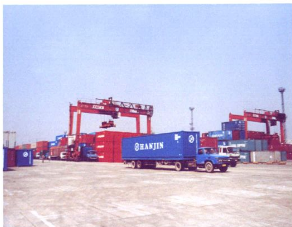
正在作业的集装箱专用运输车