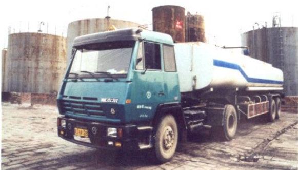
正在作业的危险品专用运输车