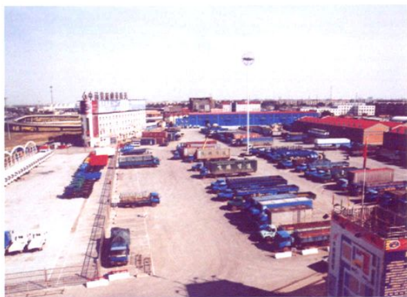
停放在物流货运中心的各类货运汽车