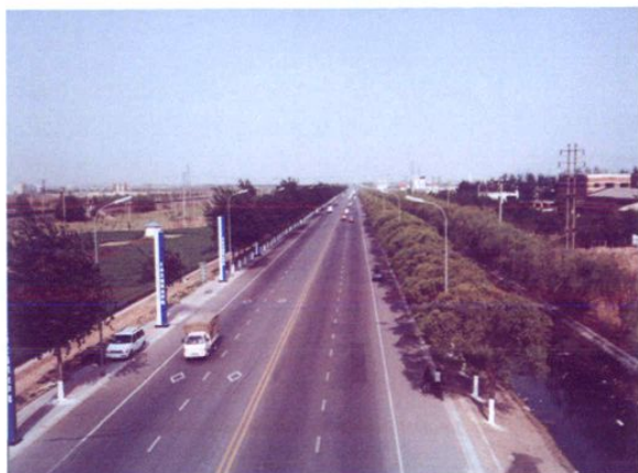
物流配送厢式货车行驶在西青公路上