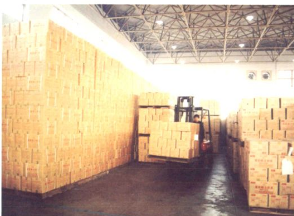
汽车运输六场为大家制药服务的物流配送仓储