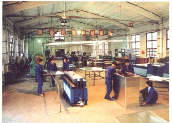
奥凯设备安装工程有限公司的职工们正在紧张地制作中央空调通道