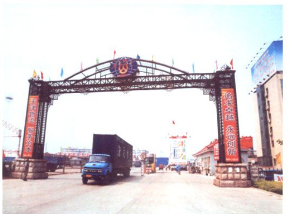
满载各类物资的集装箱运输车驶离物流货运中心