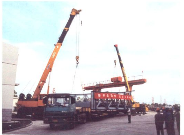
为金汤桥改造工程运输桥体