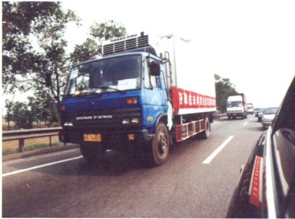
运送抗击“非典”物资