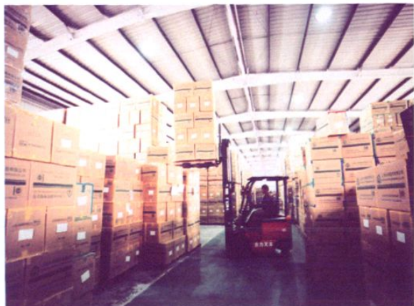
物流仓储的化工产品