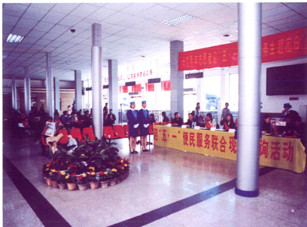
长途汽车公司客运站青年志愿者开展“迎五·一便民服务”活动