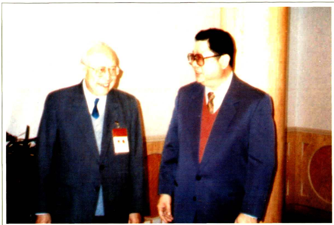
全国政协副主席钱伟长(左一)视察许墅关开发区