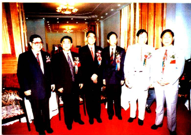
国家安全部部长贾春旺(右三)、江苏省副省长王珉(右四)及苏州市委领导视察维德木业时合影