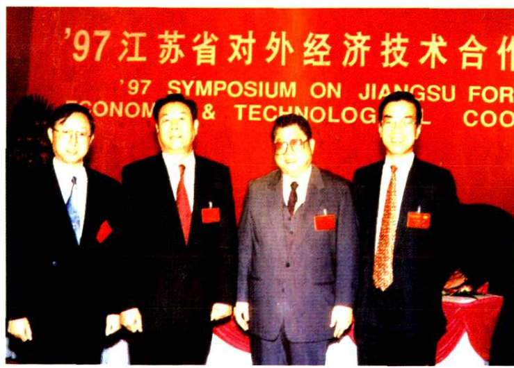
江苏省省长郑斯林(左二)视察维德木业时合影