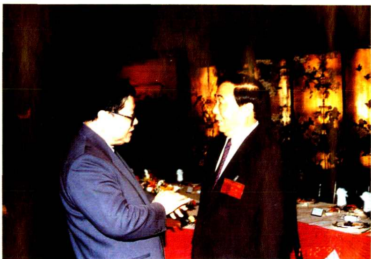
江苏省委书记陈焕友(右一)在许墅关开发区会见庄启程