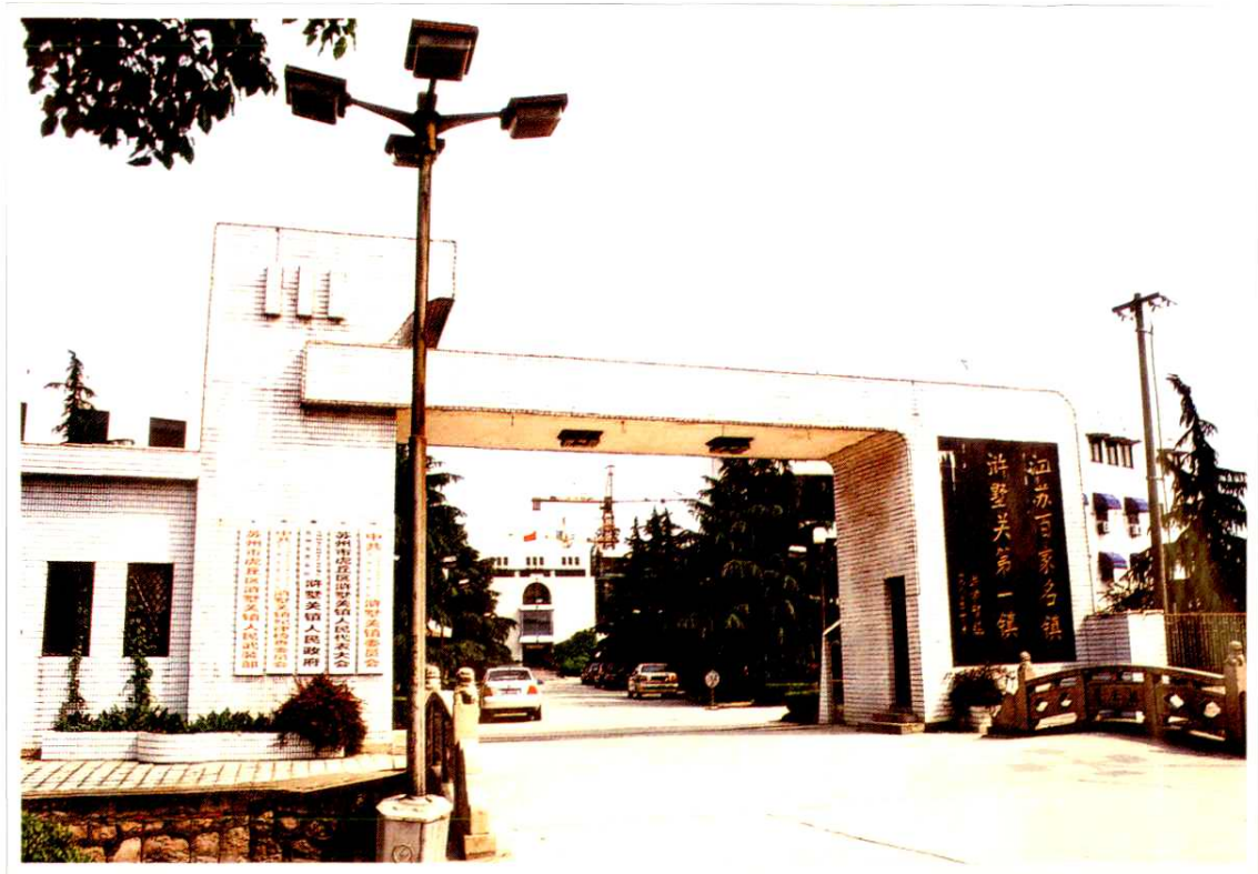
浒墅关镇政府，右为1992年10月洪学智 题词：江苏百家名镇 浒墅关第一镇