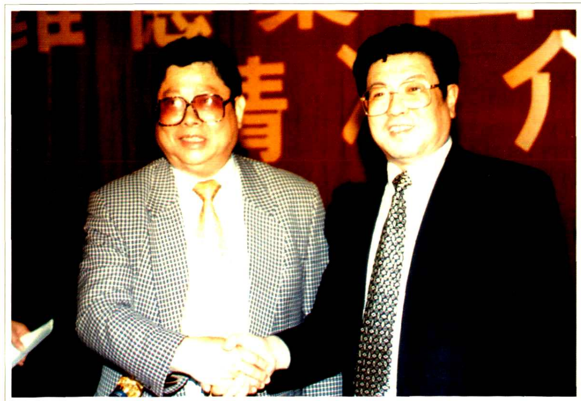
中共中央统战部部长王兆国(右一)在维德集团会见庄启程