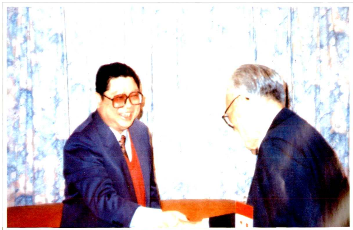
1995年全国人大常委会副委员长程思远(右一)会见维德集团主席庄启程