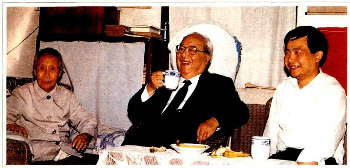
全国人大常委会副委员长费孝通(中)视察浒墅关镇