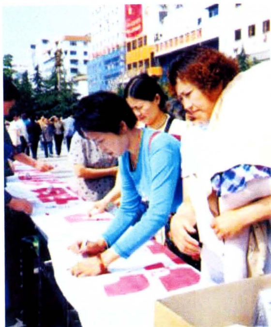
全社会关心支持残疾人事业蔚然成风，群众在“关爱残疾人纪念横幅”上签上自己的名字