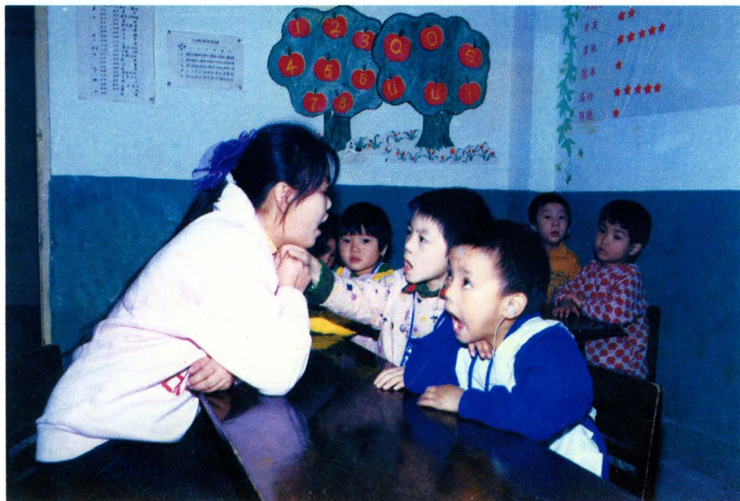
聋哑学校哑语训练