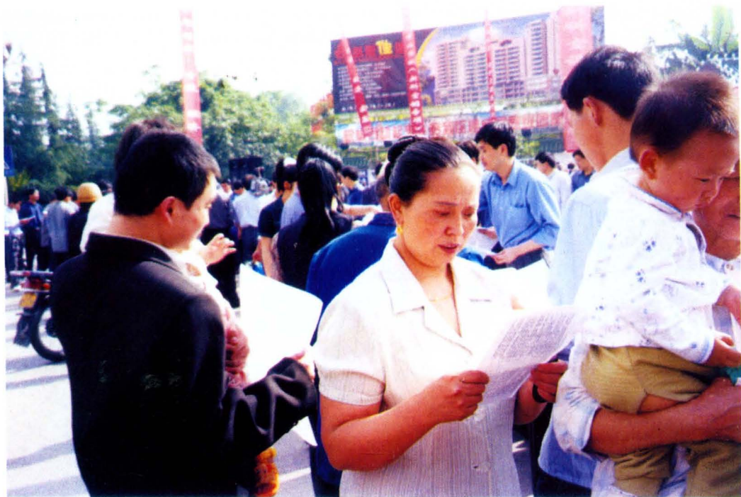
在开展“全国助残日”活动中，群众阅读预防残疾健康知识