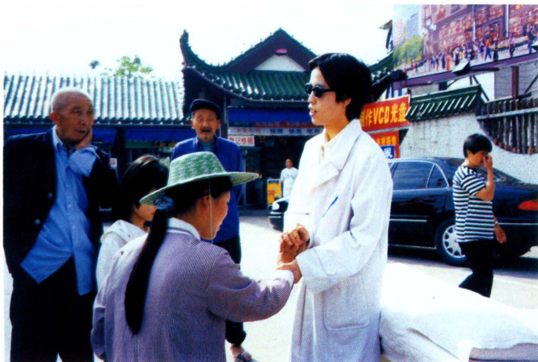
2002年“全国助残日”活动中，盲人免费为群众义诊