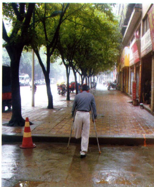
残疾人自我康复训练