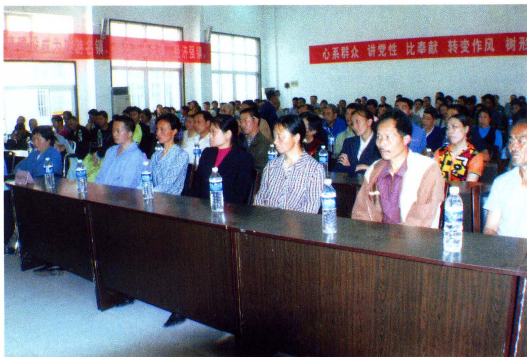
1999年8月，区残联组织残疾人就业前专业技能培训现场