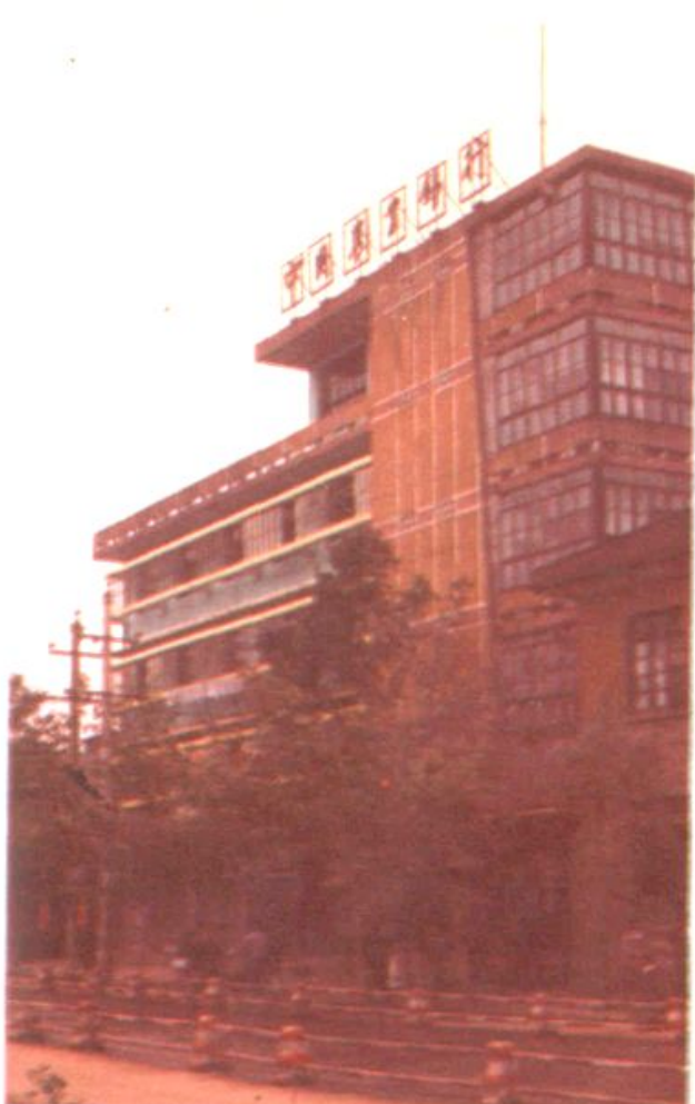
道县农业银行办公楼