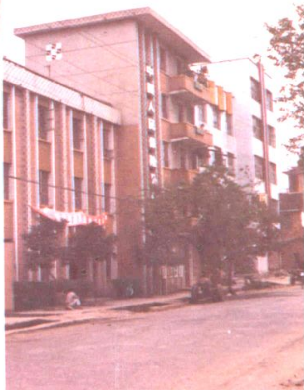
道县建设银行办公楼