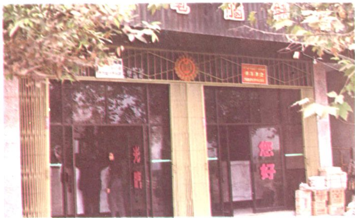
道县农业银行营业部专柜