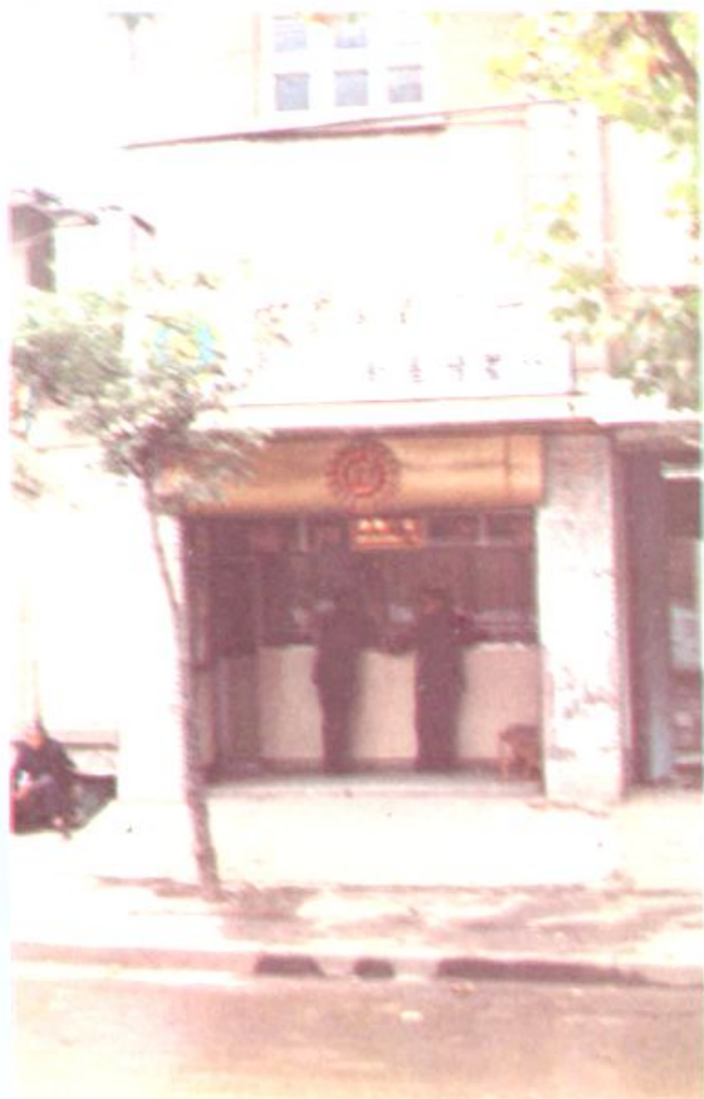
道县农业银行新星储蓄所 4