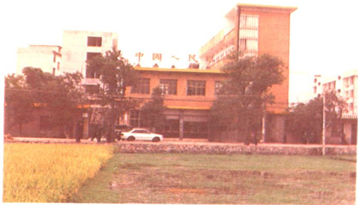
道县人民银行办公楼