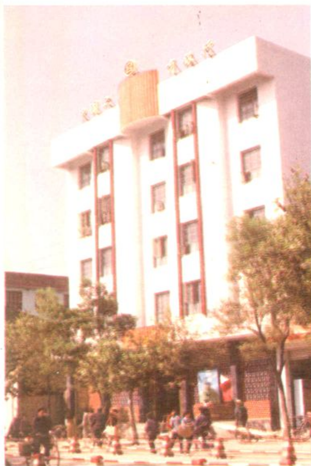
道县建设银行房产信贷部