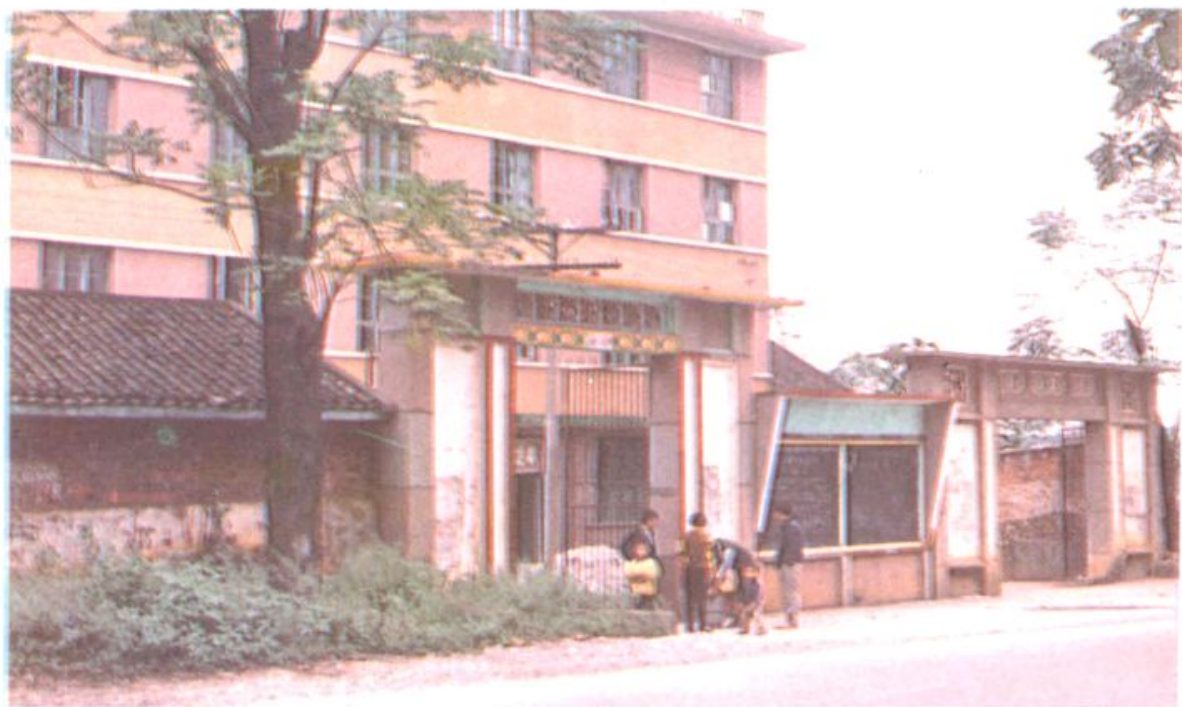
道县农业银行祥林铺营业所