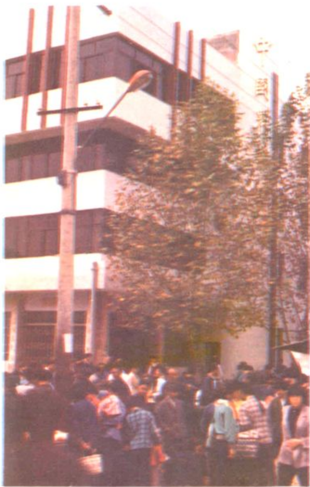
道县农业银行清塘营业所办公楼