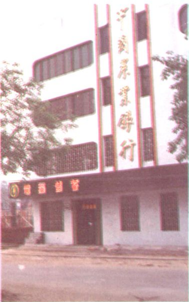
道县农业银行城郊储蓄所