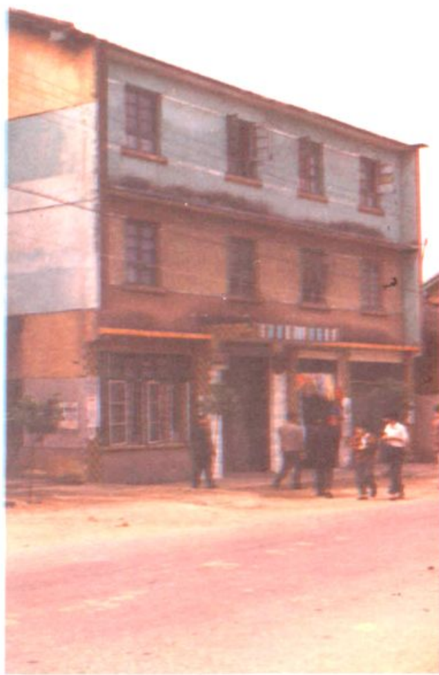
道县农业银行寿雁营业所