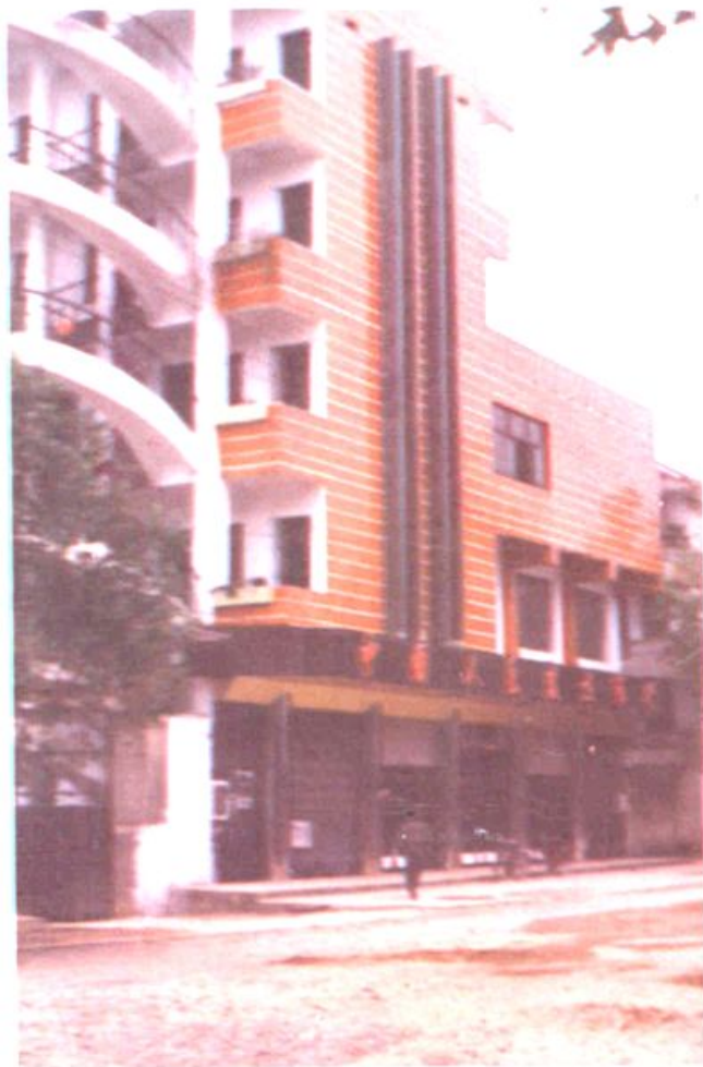
道县保险公司办公楼