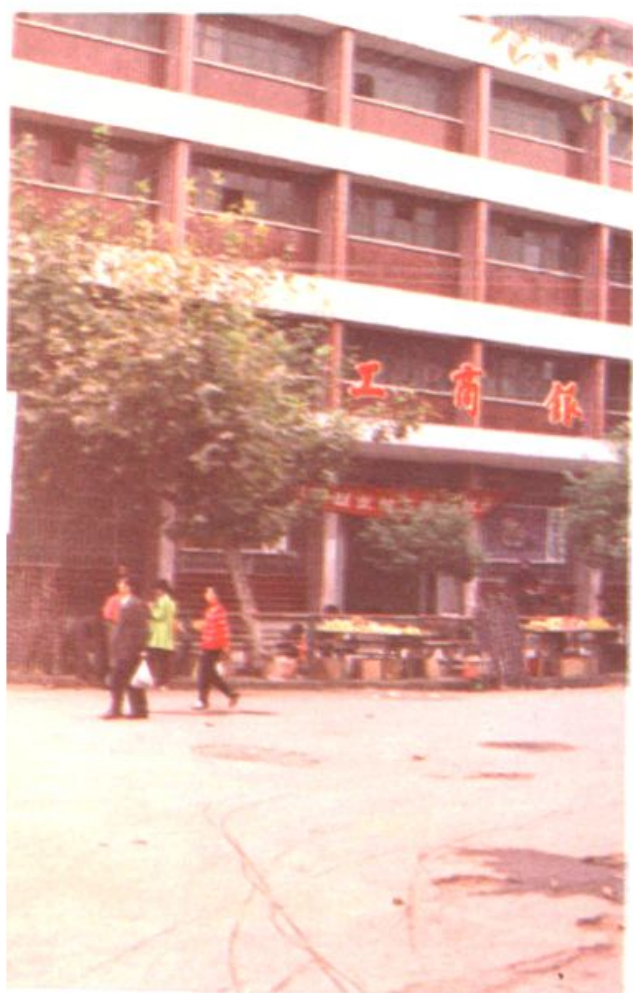
道县工商银行办公楼