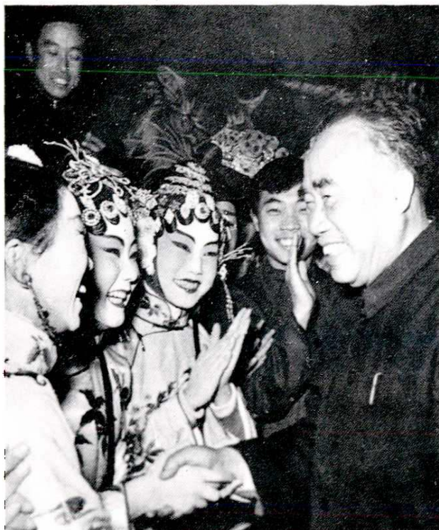
1959年朱德委员长 在北京与陕西省赴京汇报 演出团演员在一起