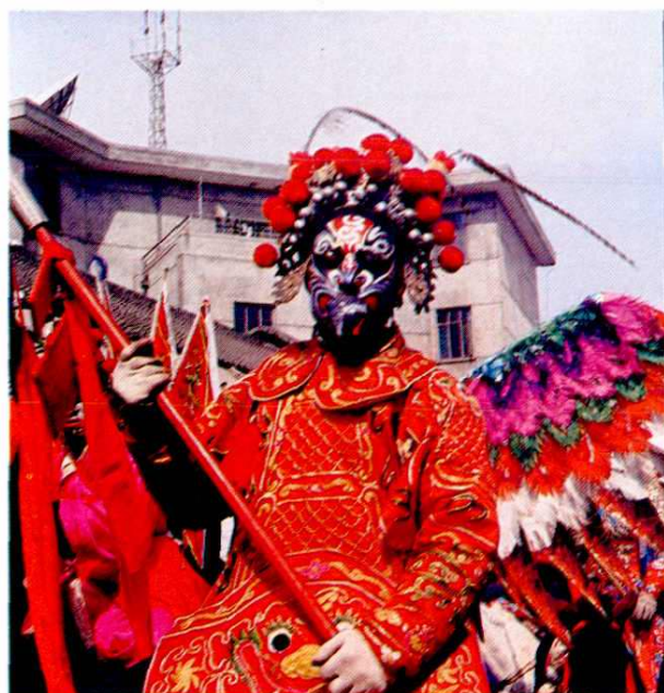
浮雕脸谱大鹏金翅雕雷震子