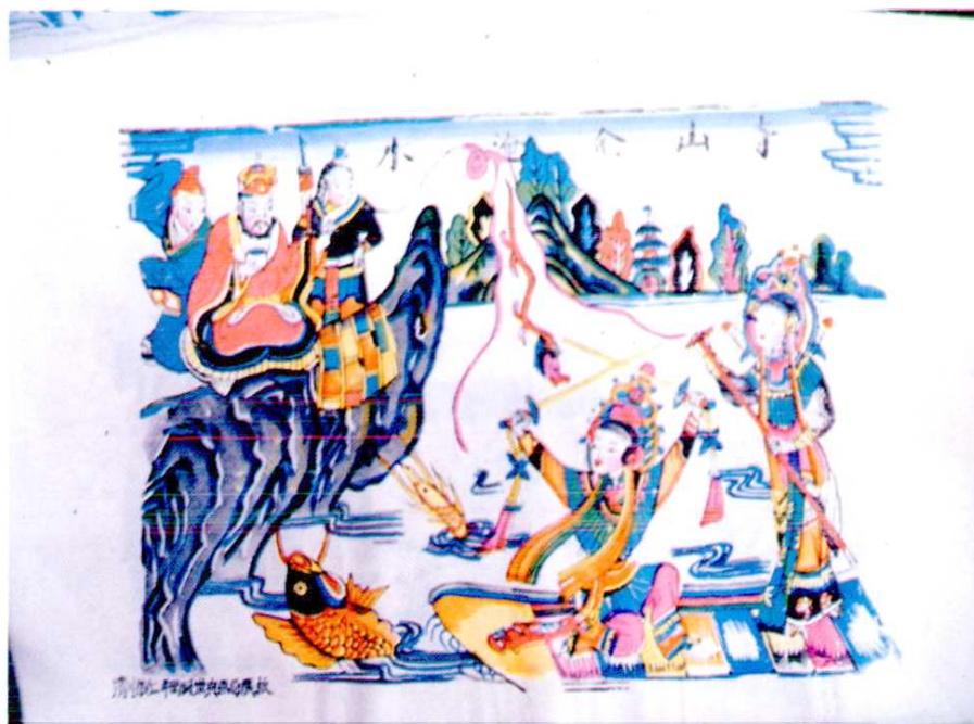
清·顺治二年《水漫金山》木板画