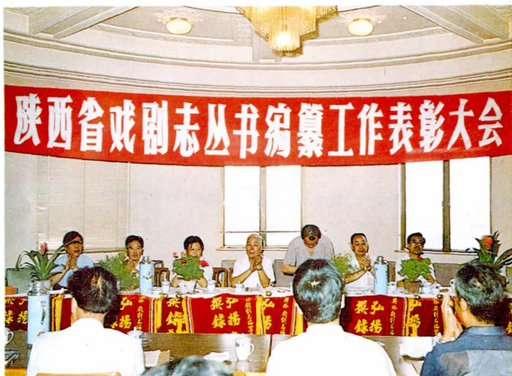
1992年8月陕西省戏剧志丛书编纂工作表彰大会