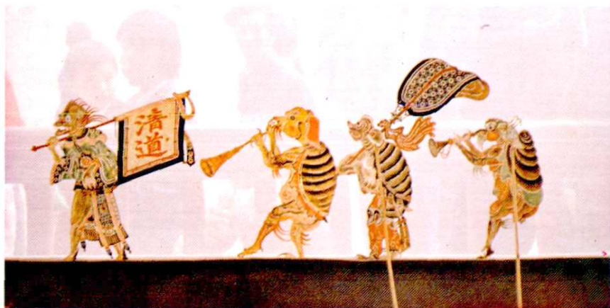
清代乐盛班皮影雕刻《闹龙宫》①