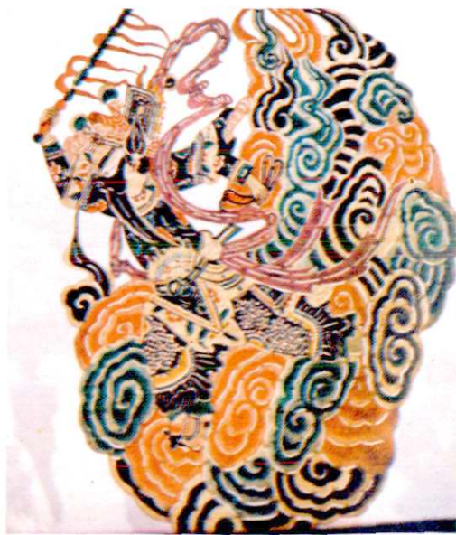
清代乐盛班皮影灵官、黑虎角色脸谱造型雕刻