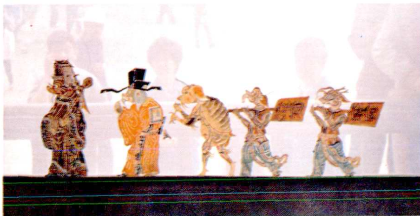
清代乐盛班皮影雕刻《闹龙宫》④