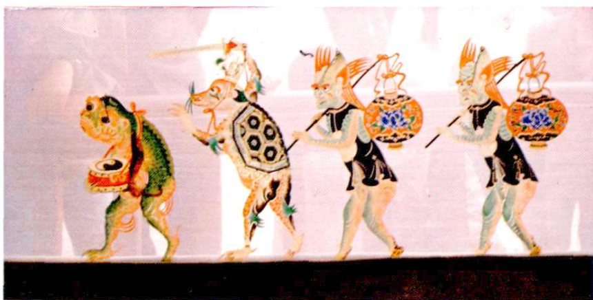
清代乐盛班皮影雕刻《闹龙宫》③