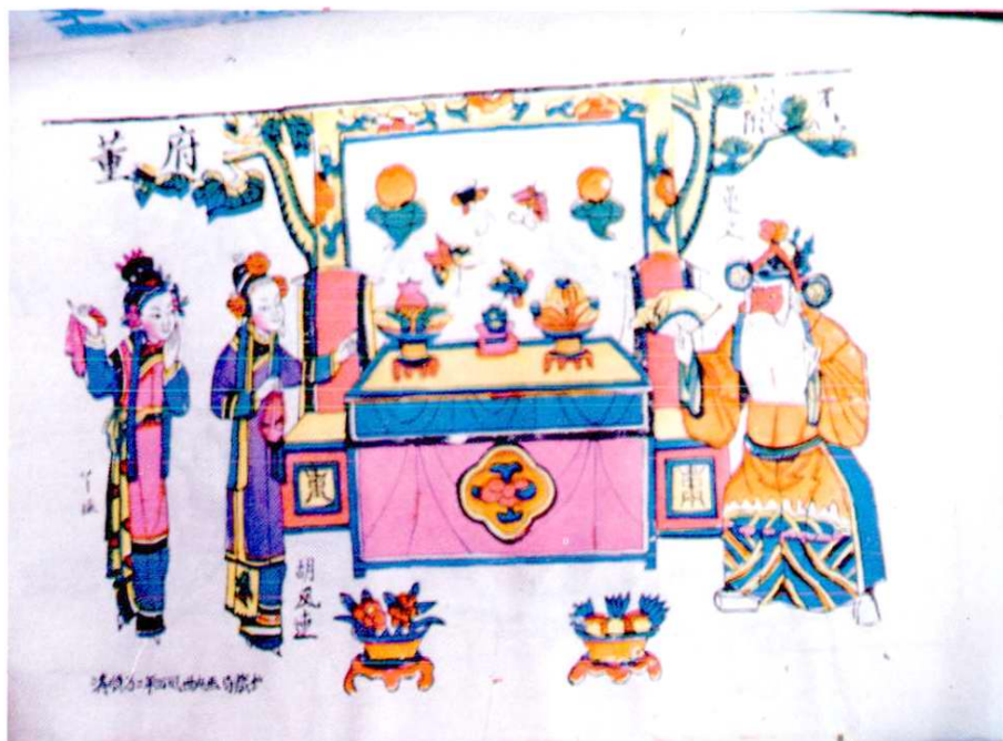
清·顺治二年《董府献杯》木板画