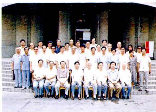
表彰大会与会代表