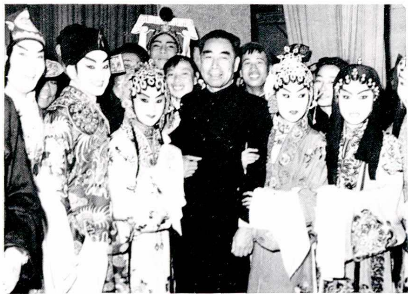
1959年周恩来总理接见陕西省赴京汇报演出团