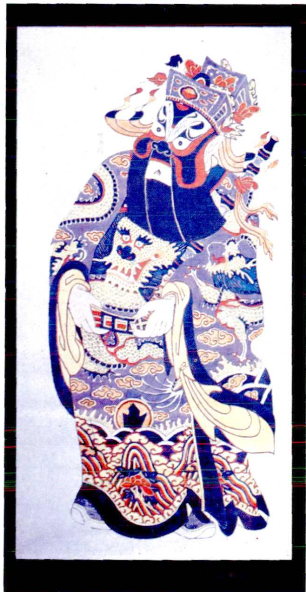
明·正德木板画服饰、脸谱 《敬德》