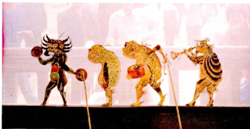
清代乐盛班皮影雕刻《闹龙宫》②