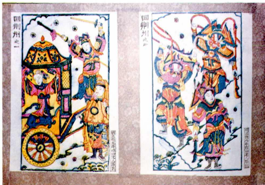
明·正德九年《回荆州》木板画