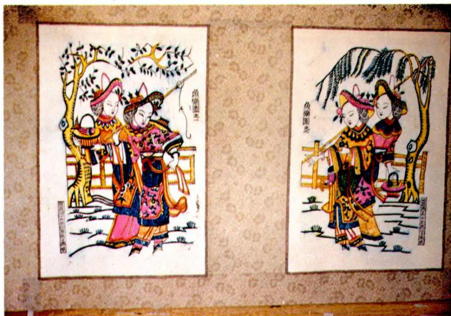
明·嘉靖十四年《鱼乐图》木板画