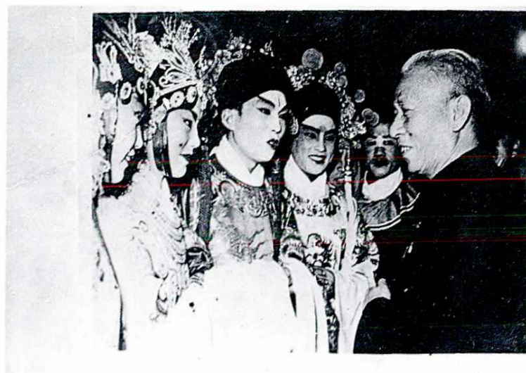
1959 年 11 月刘少奇副主席在北京与陕西省 赴京汇报演员在一起