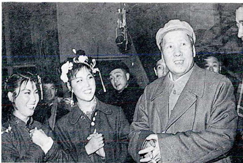
1957 年毛泽东主席在长春电影制片厂与秦腔演员在一起