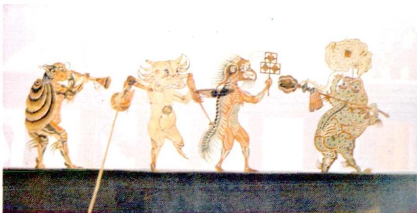
清代乐盛班皮影雕刻《闹龙宫》⑤