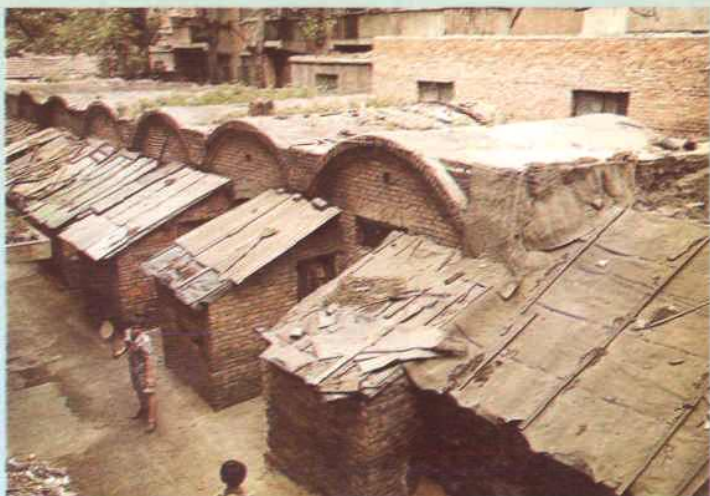
▷五十年代矿区家属住宅