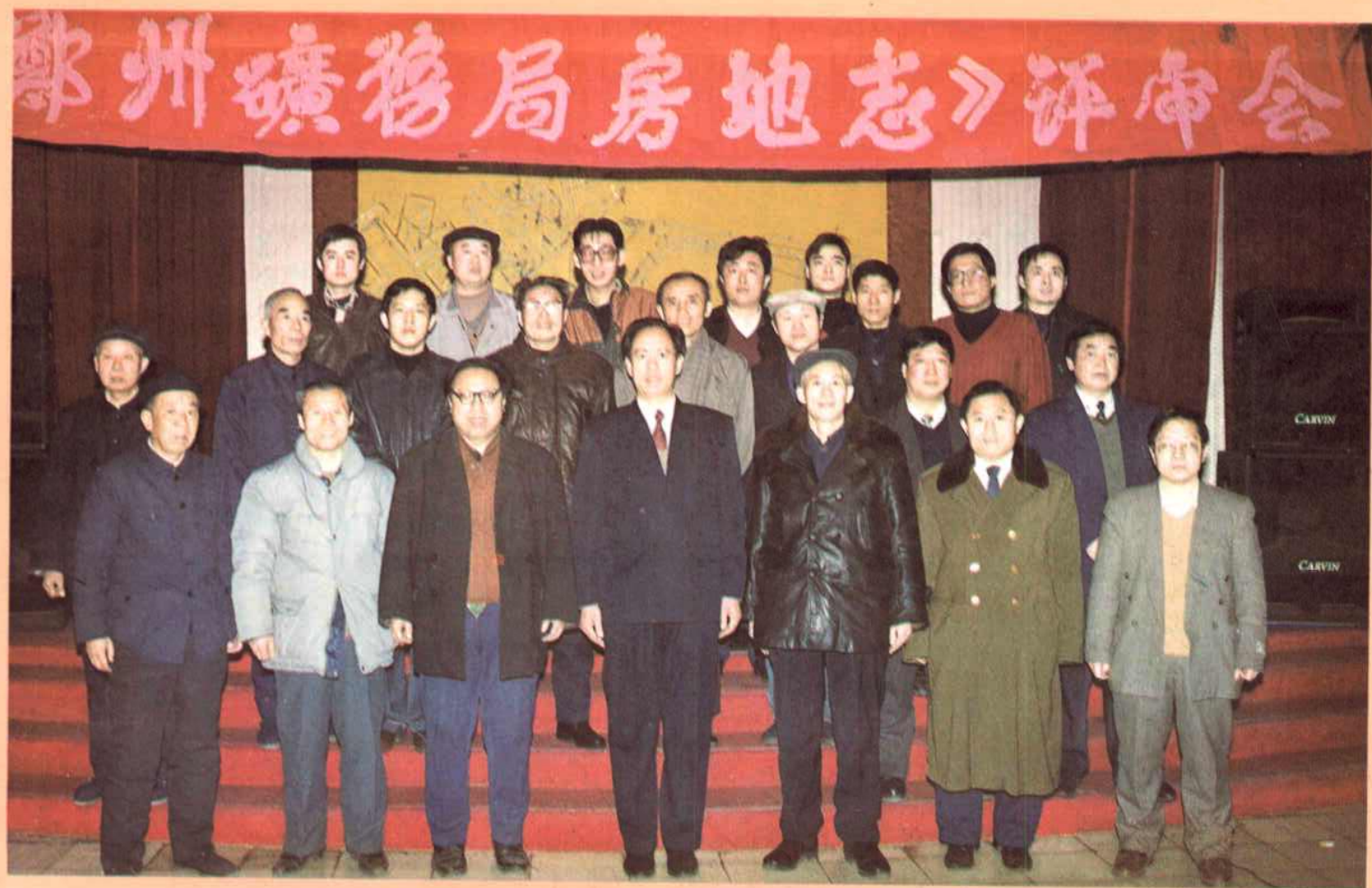
《郑州矿务局房地志》审稿会议人员合影