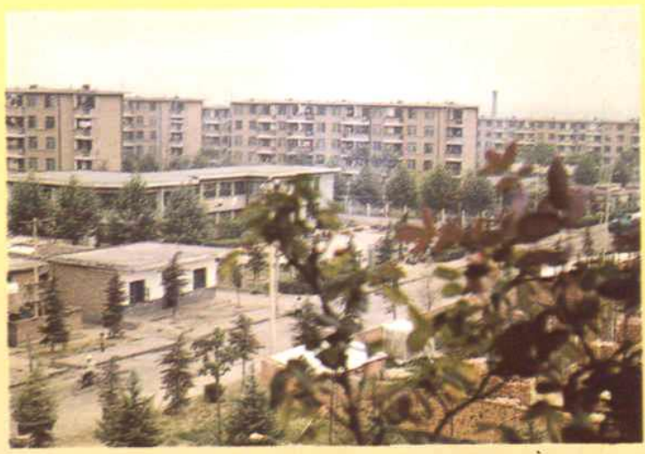
◁ 宿舍区 九十年代超化矿单职工