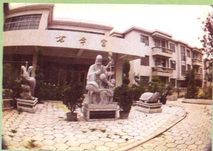
◁ 九十年代干休所老年宫楼