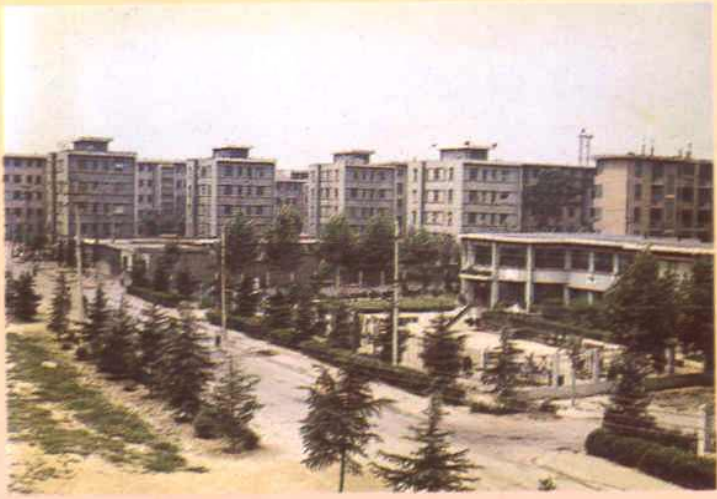
▷ 九十年代裴沟矿单职工公寓楼