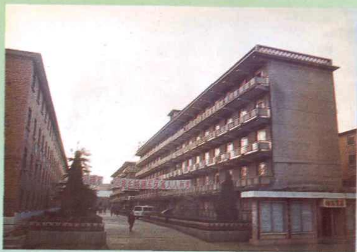
◁ 八十年代大平矿家属住宅区