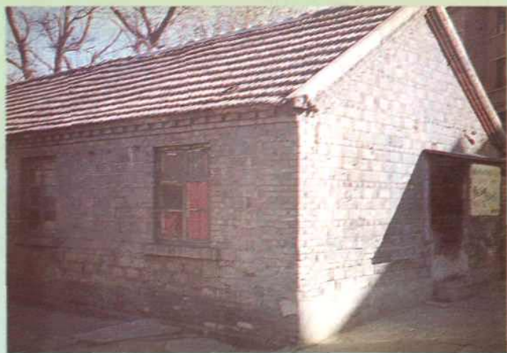
◁六十年代米村矿家属住宅