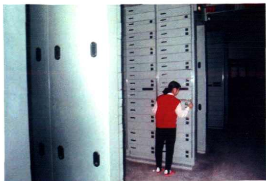
921 型纵横制交换设备