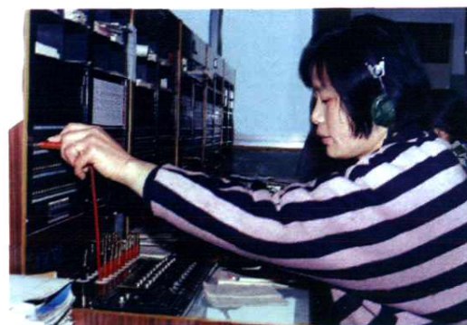
1992 年扩容长话人工台