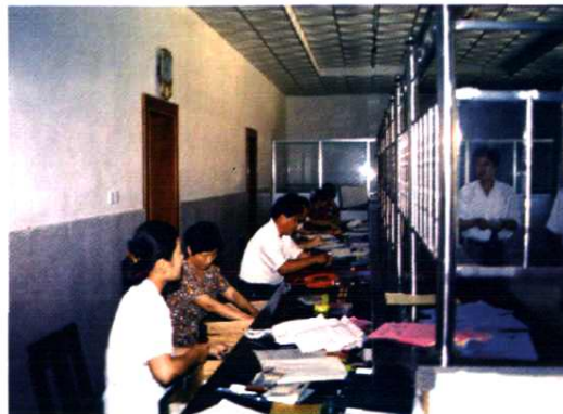
市话营业厅里工作人员在工作