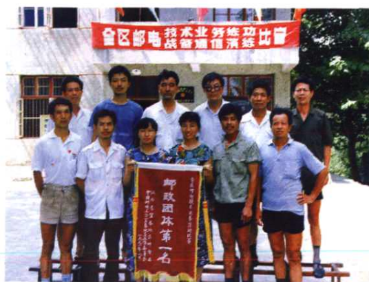
全区邮电练兵比赛邮政团体第一名