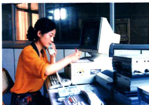
1992 年 10 月 25 日开通的无线寻呼台