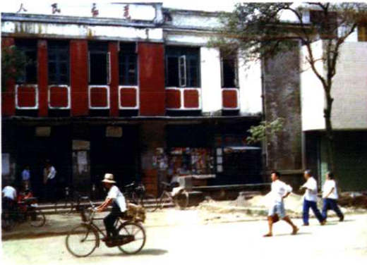
高安市老邮电大楼