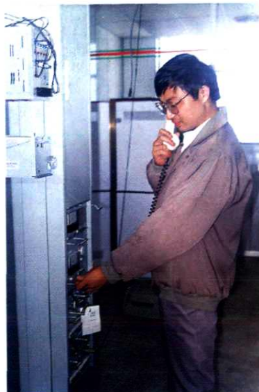
机务人员正在调测移动通信设备