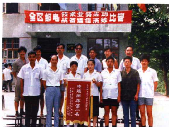
全区邮电练兵比赛电信团体第一名