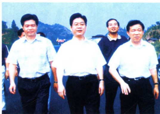
▲ 时任市长李亿龙（前排中）调研怀新高速公路