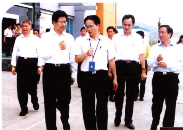
▶ 时任市委书记张文雄（右二）、市长陈志强（右一）陪同省委书记张春贤（左二）视察怀化