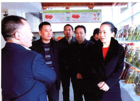
▲ 时任市长李晖（右）在芷江侗族自治县调研