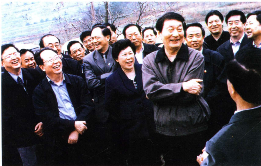
▲ 2001年4月9日，国务院总理朱镕基视察溆浦县