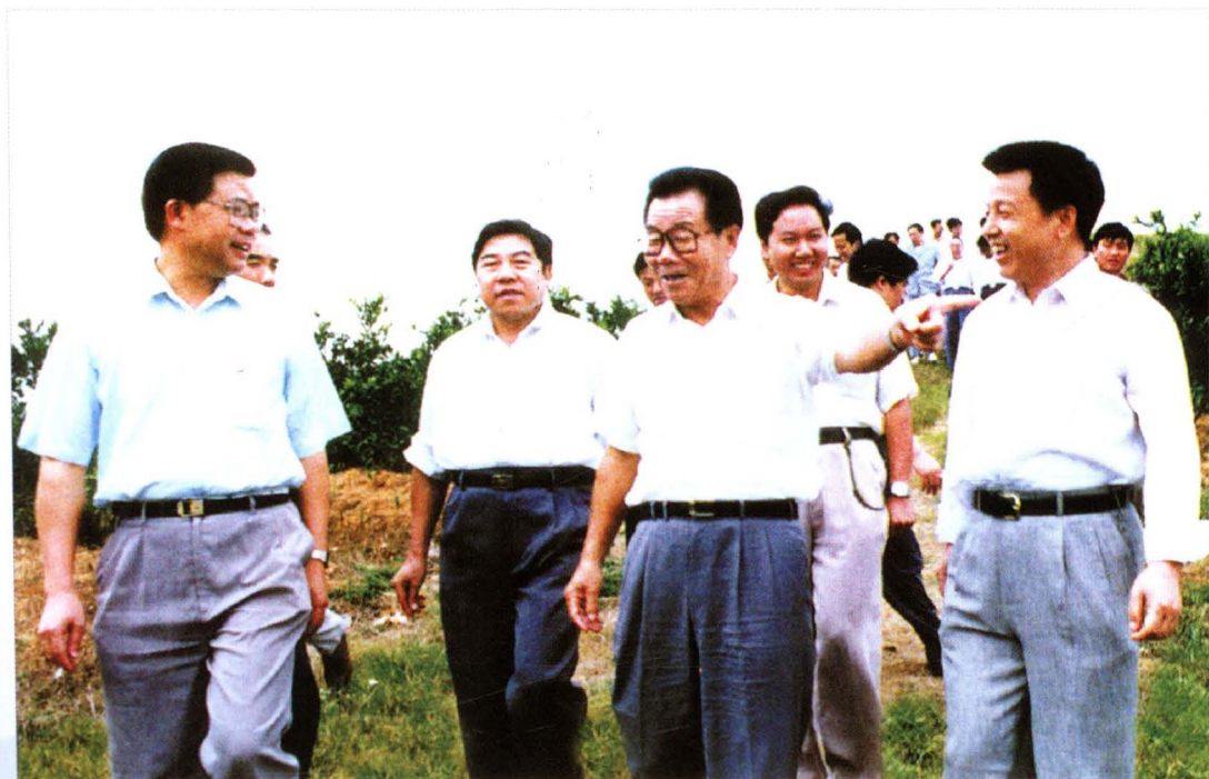
▲ 1995年9月11日，全国政协主席李瑞环视察怀化