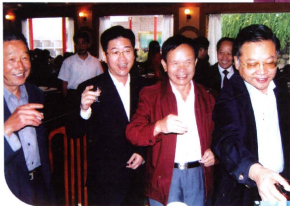
▶ 时任市委书记李亿龙（右三）、市长易鹏飞（右一）参加民族活动