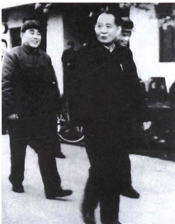
▶ 1984年1月8日，中共中央总书记胡耀邦在麻阳视察