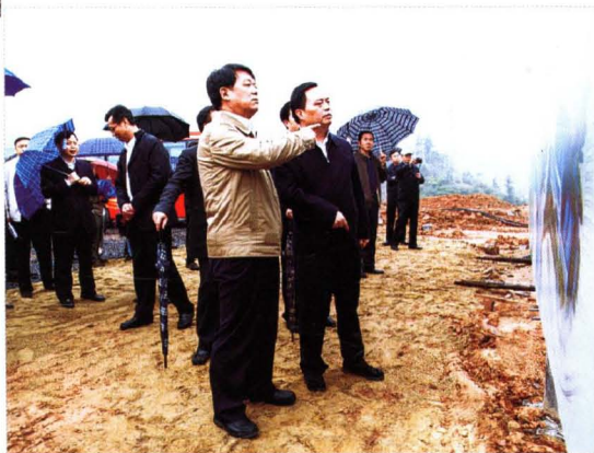
▶ 国家民委副主任丹珠昂奔（前排左一）视察通道侗族自治县60周年县庆项目