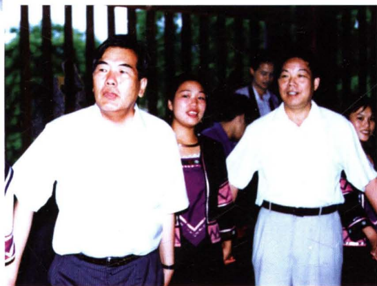
▶ 国家民委副主任图道多吉（左一）到通道侗族自治县视察和侗族群众联欢