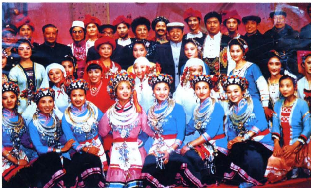
▶ 时任湖南省委书记熊清泉和怀化组队参加全省少数民族文艺汇演的少数民族演员合影留念