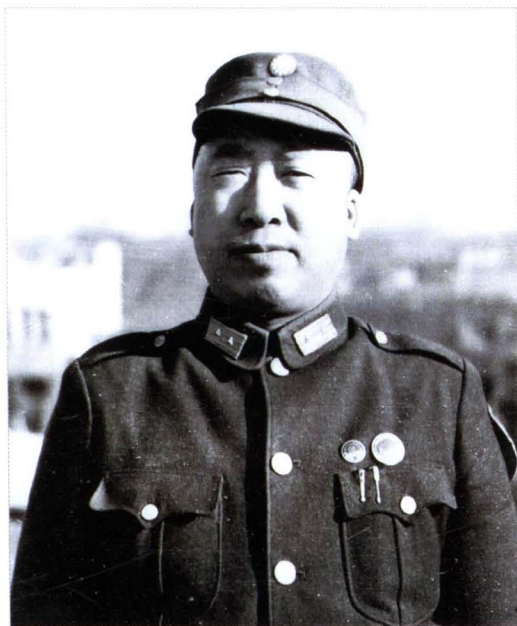
▲ 滕代远（1904~1974），麻阳苗族自治县人，苗族。共和国第一任铁道部长，全国政协副主席。