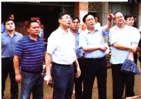
◀ 市长赵应云（右二）调研新晃米贝