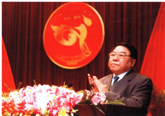
◀ 怀化撤地设市 第一任市长吴宗源 就职发言