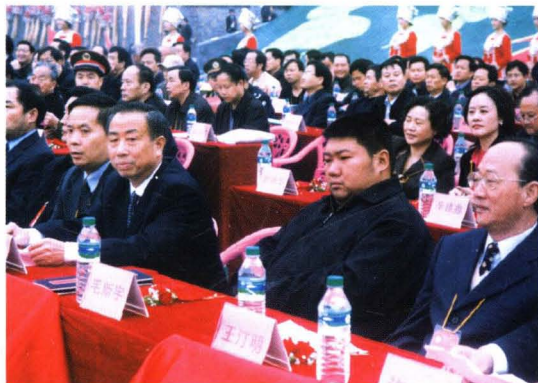
▲ 时任市长陈志强陪同毛泽东主席的孙子毛新宇（右二）参加通道50周年县庆