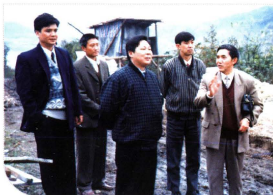
▲ 时任地（市）委书记杨泰波（右三）深入基层调研民族工作