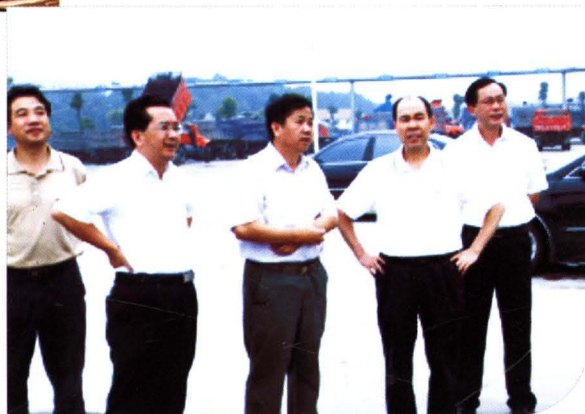
▶ 市人大主任杨方明（右二）检查指导工作