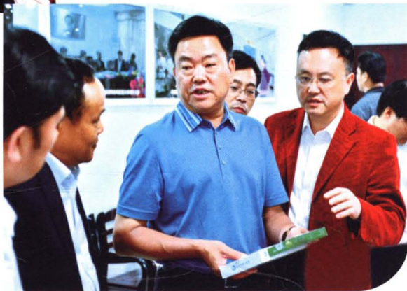
▶ 时任市委书记张自银（左三）在靖州苗族侗族自治县调研