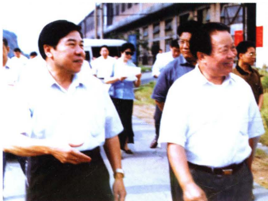
◀ 全国人大民委主任王朝文（右一）在怀化市市长吴宗源（左一）陪同下视察