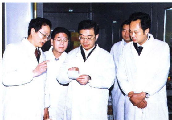
▶ 时任湖南省委书记周强（左三）在民族特殊商品定点生产企业——怀化正清制药厂调研