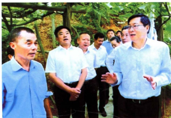
▶ 湖南省省长杜家毫（右一）在中方县考察