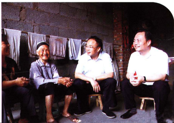
▶ 2014年6月15日，新任市委书记彭国甫（右二）到通道调研指导工作