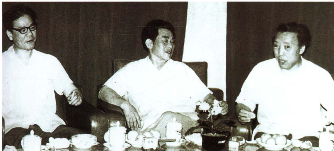
▲ 时任地委书记吴彦凡（中）与省地志办领导交谈