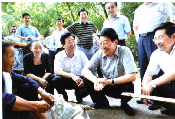
◀ 湖南省委书记徐守盛（右一）在靖州苗族侗族自治县考察