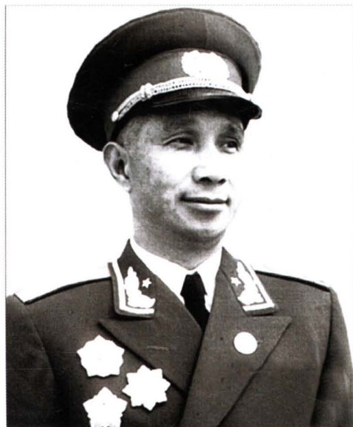
▲ 粟裕（1907~1984），会同县人，侗族，共和国第一大将，全国人大常委会副委员长。