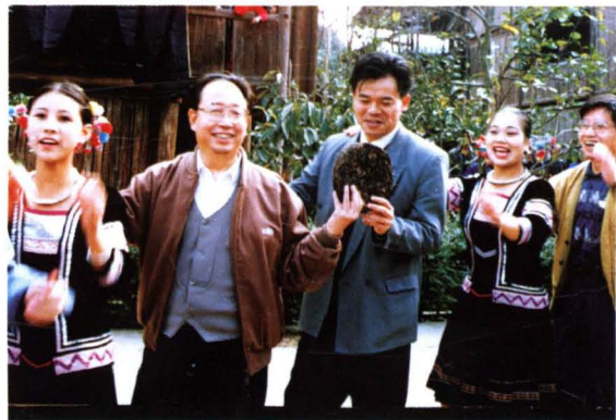
▶ 时任湖南省委书记杨正午（左二）在通道侗族自治县调研并与群众联欢