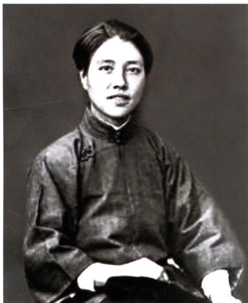
▲ 向警予（1895~1928），女，溆浦县人，土家族。第一位女中央委员、妇女工作部部长。