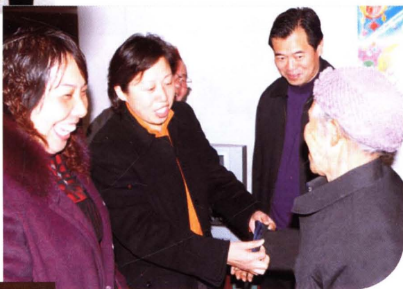
▶ 时任市委书记刘莲玉（左二）深入芷江侗族自治县禾梨坳乡古冲村调研新农村建设，并看望村敬老院的老人