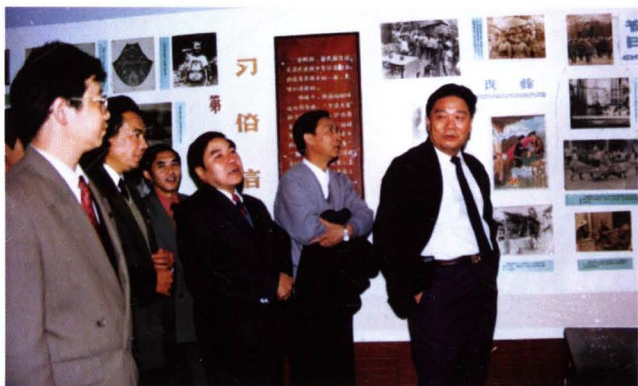
◀ 时任湖南省委书记王茂林在会同县粟裕纪念馆考察