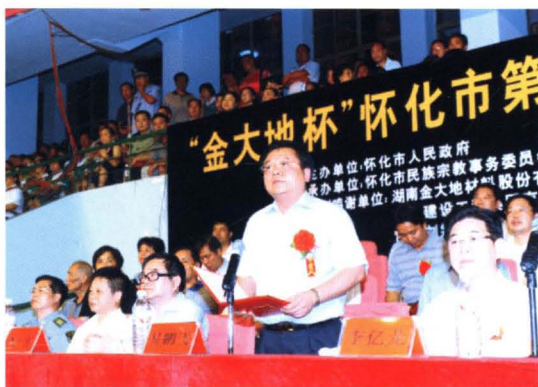
▲ 时任市长易鹏飞（右二）在怀化市第三届民运会上致开幕辞