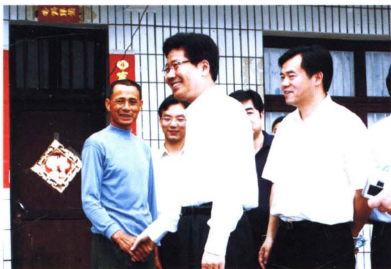
◀ 时任湖南省委书记张春贤（右二）在芷江侗族自治县农村调研