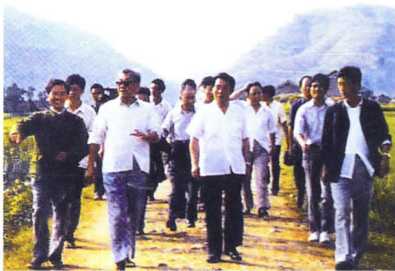
◀ 时任湖南省委书记毛致用（左二）到麻阳苗族自治县视察