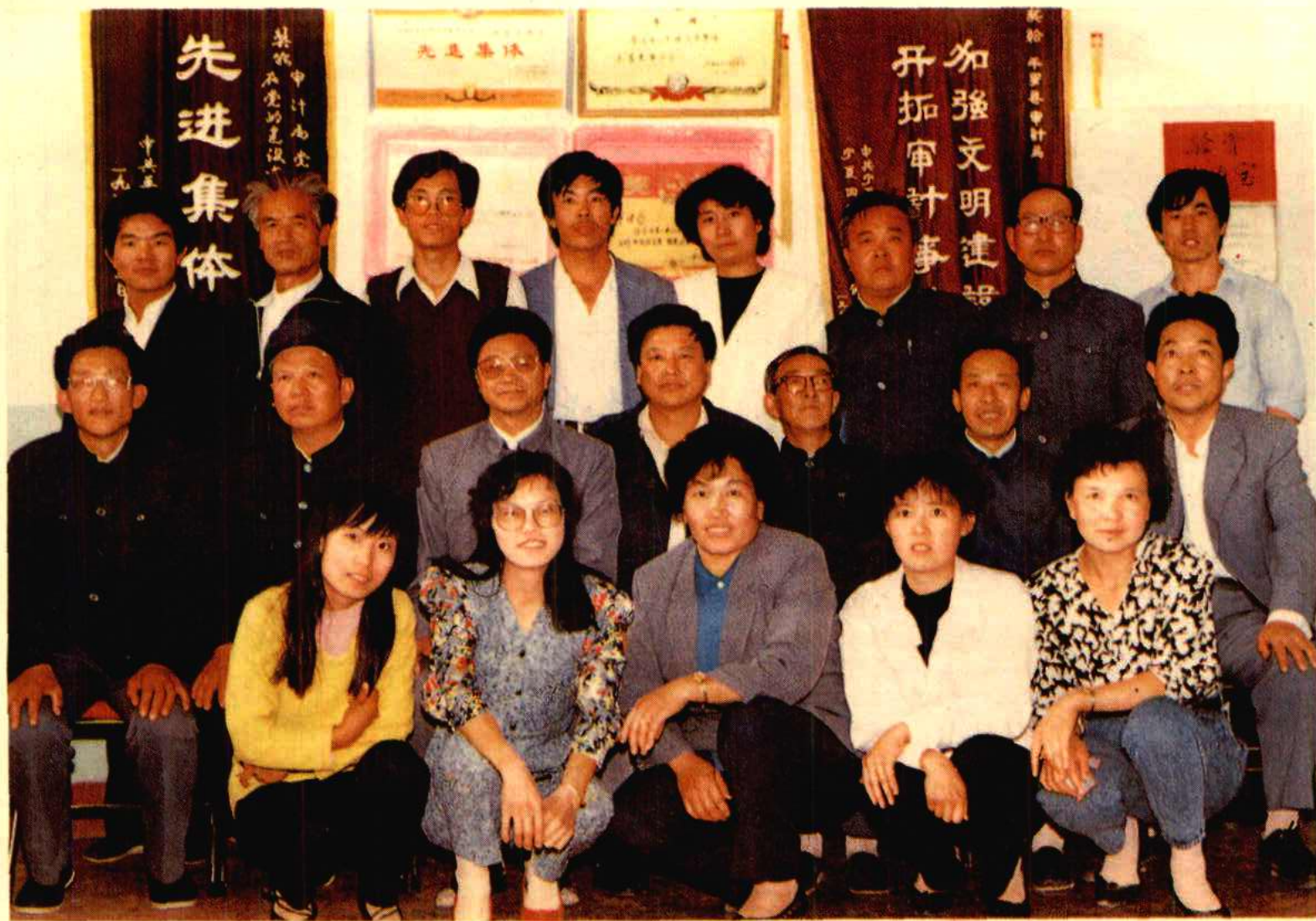
平罗县审计局全体职工