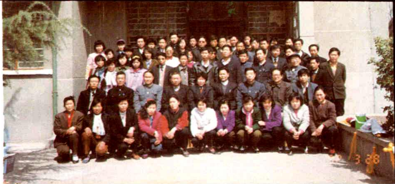
▲县委、人大、政协有关领导与参加91年度侨务系统表彰会的先进个人、先进集体代表合影留念。