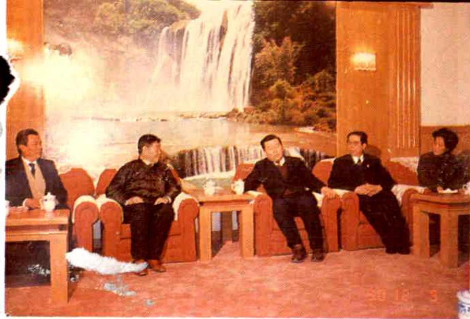
省长李长春（左三），同杨景尧先生（左二）亲切交谈。右二为省统战部长武守全、右一为省侨联主席、侨办主任林雪梅、左一为省侨联副主席、侨办副主任张钦文。