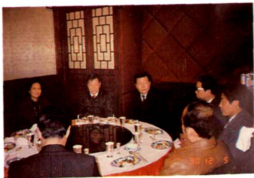
1990年12月5日 省长李长春（左三） 在郑州国际饭店宴请 杨景尧先生（左二）。 省侨联主席、侨办主 任林雪梅（左一）等 陪同。