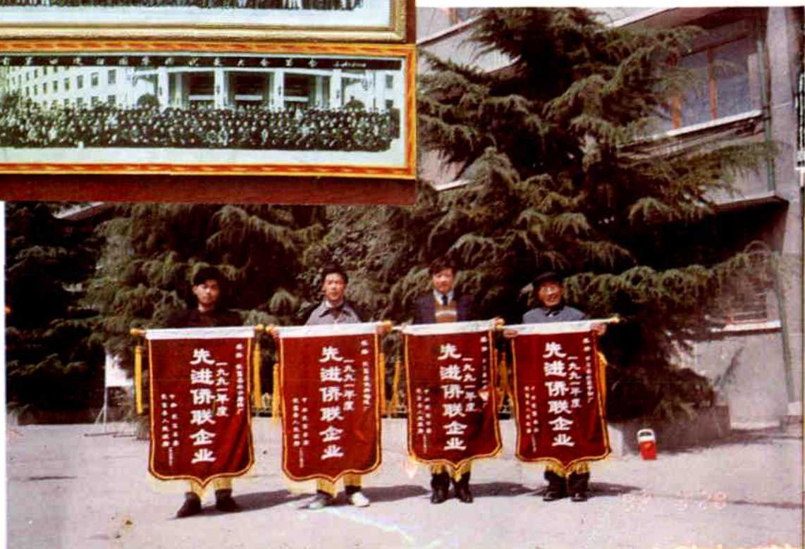
▼1991年度受到县委、县政府表彰的四家先进侨联企业。左一为海侨磨料厂，左二为侨新铸造厂、左三为针织制线厂、左四为红星预制厂。