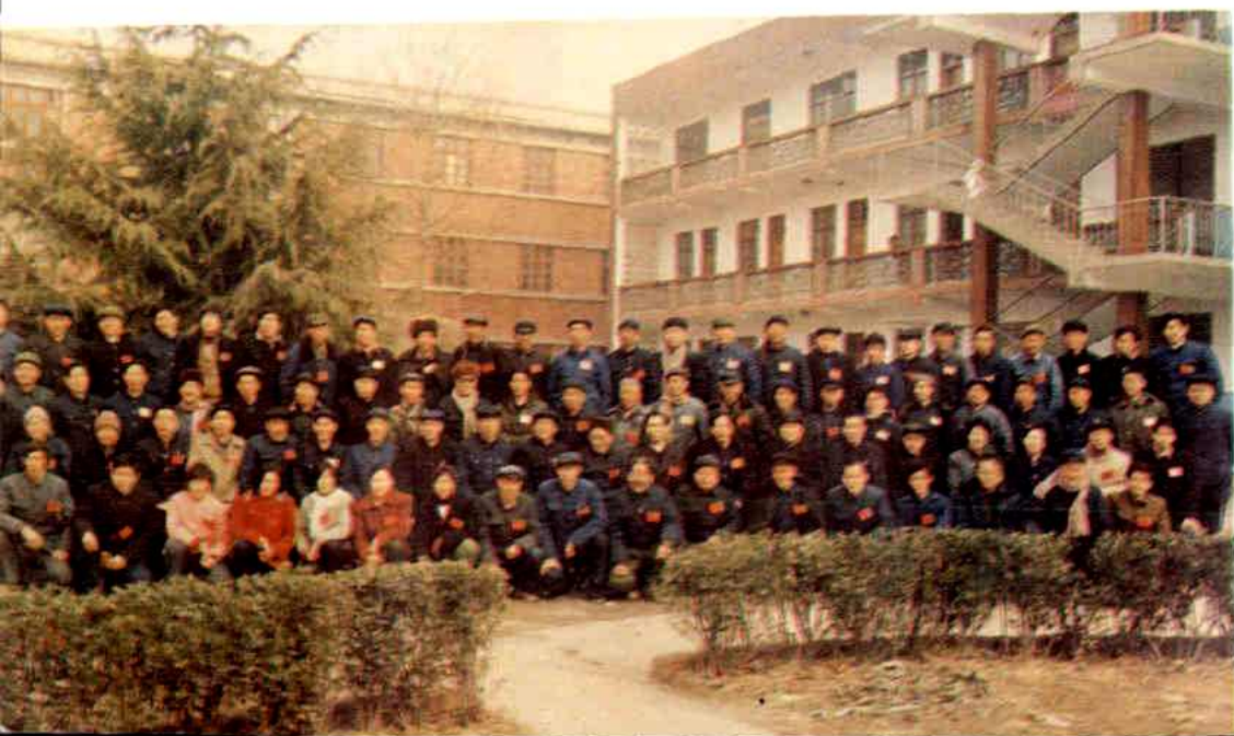
◀县党、政领导与出席第二次侨代会的全体代表合影。