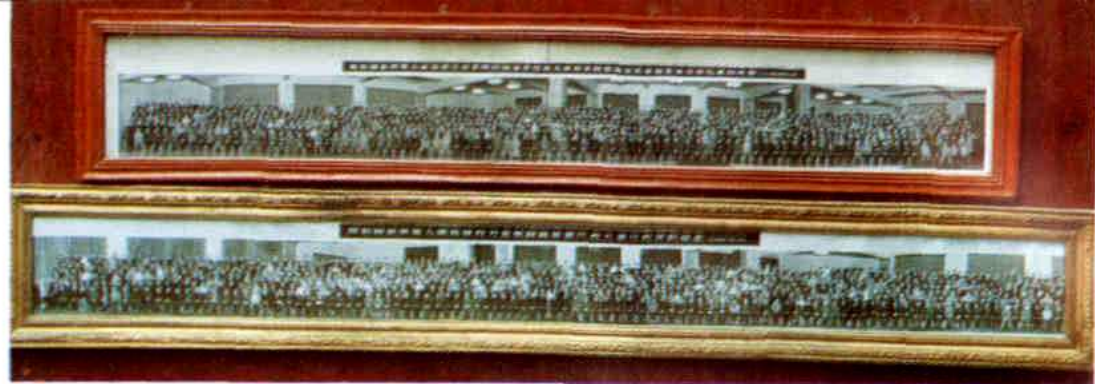
党和国家领导人邓小平、胡耀邦、赵紫阳、江泽民会见侨务工作者及全国侨代会代表。