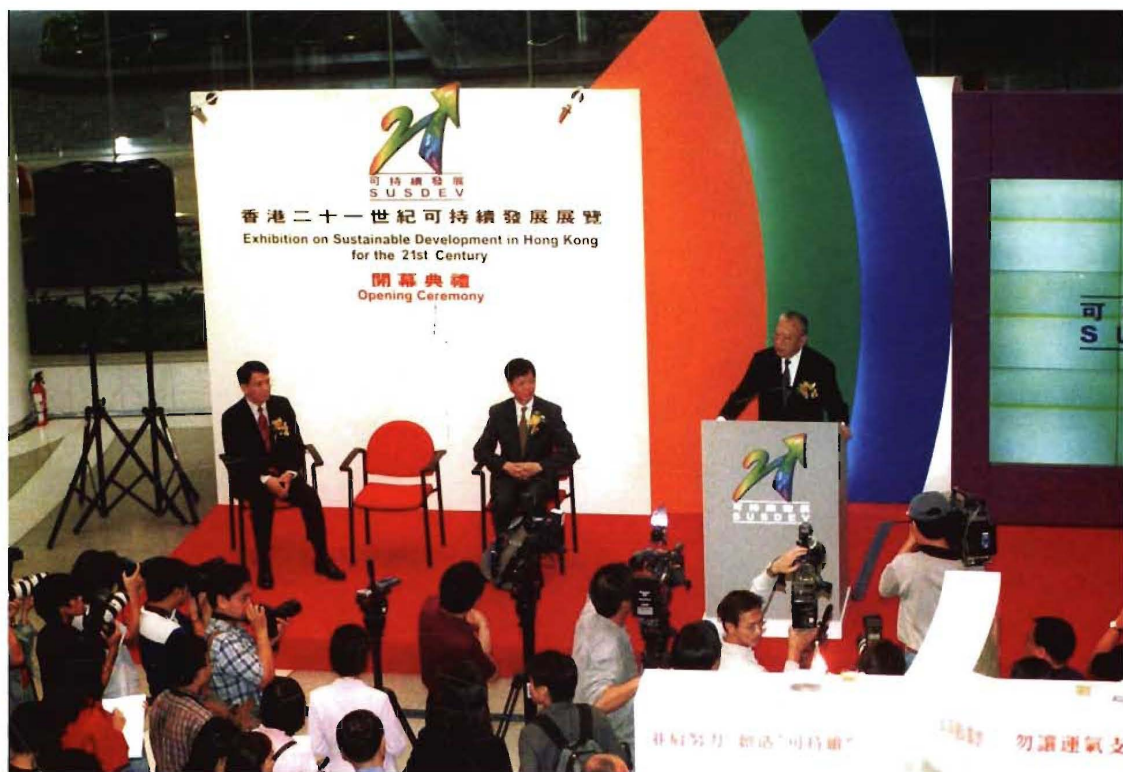
香港特区政府举办“香港二十一世纪可持续发展展览”