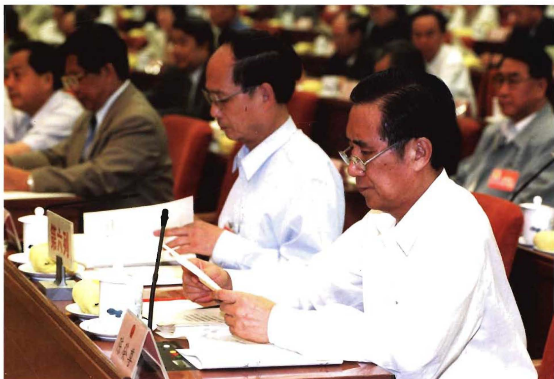
6月26日，九届全国人大常委会十次会议表决通过《全国人民代表大会常务委员会关于〈中华人民共和国香港特别行政区基本法〉第二十二条第四款和第二十四条第二款第（三）项的解释（草案）》