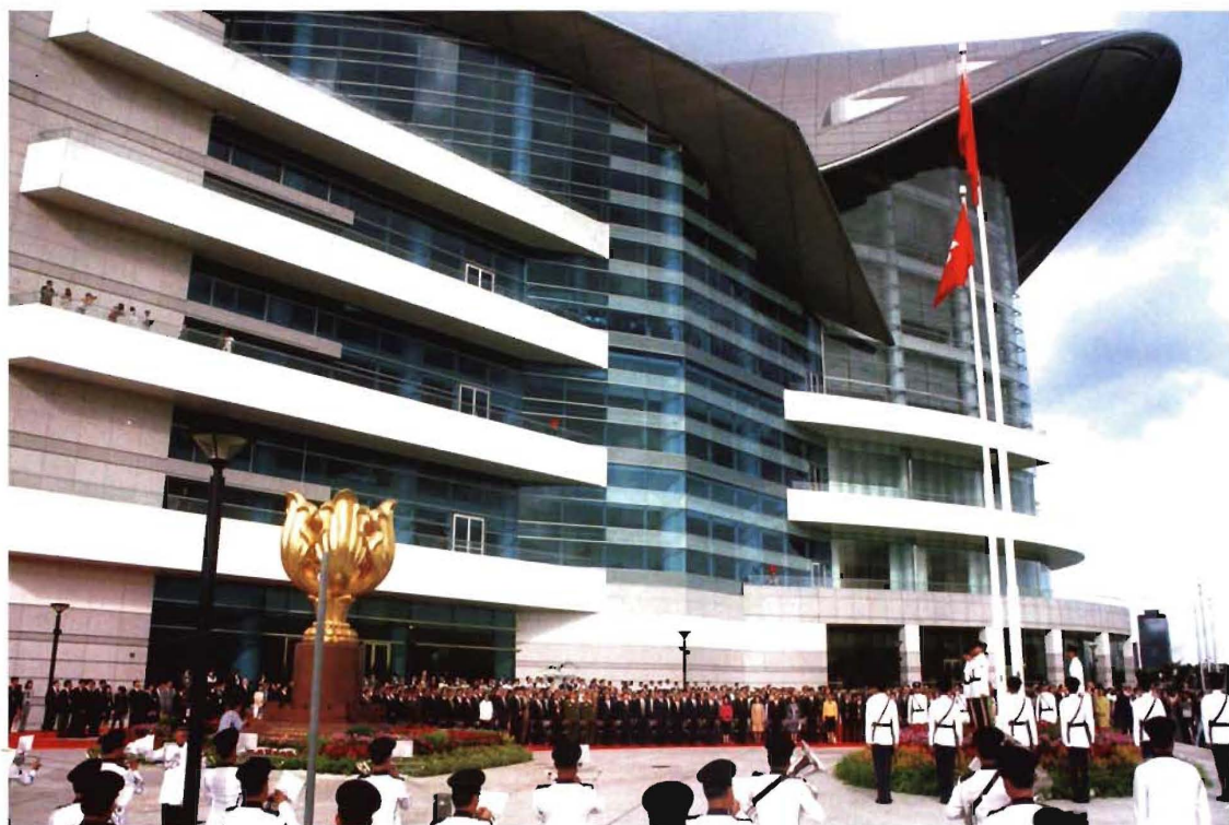
7月1日清晨，国家领导人和香港各界人士参加庆祝香港特区成立两周年升旗仪式