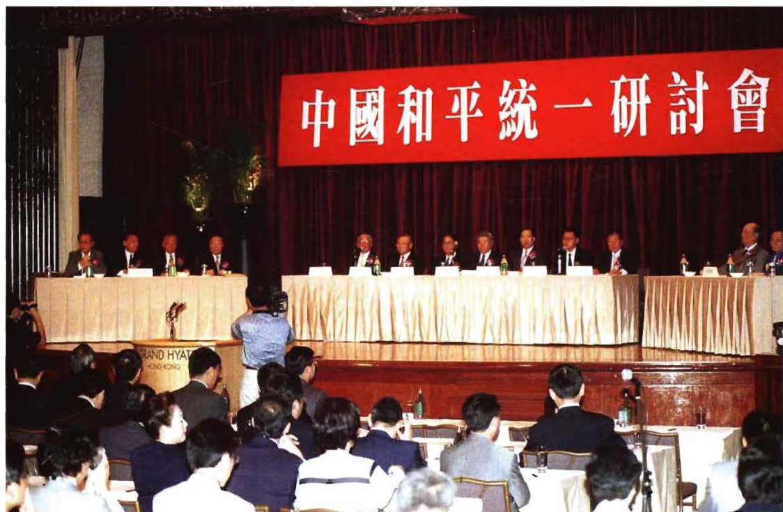
7月10日，海峡两岸统一促进会在香港举办“中国和平统一研讨会”，海内外190位学者专家出席，是历来规模最大、层次最高的两岸关系研讨会