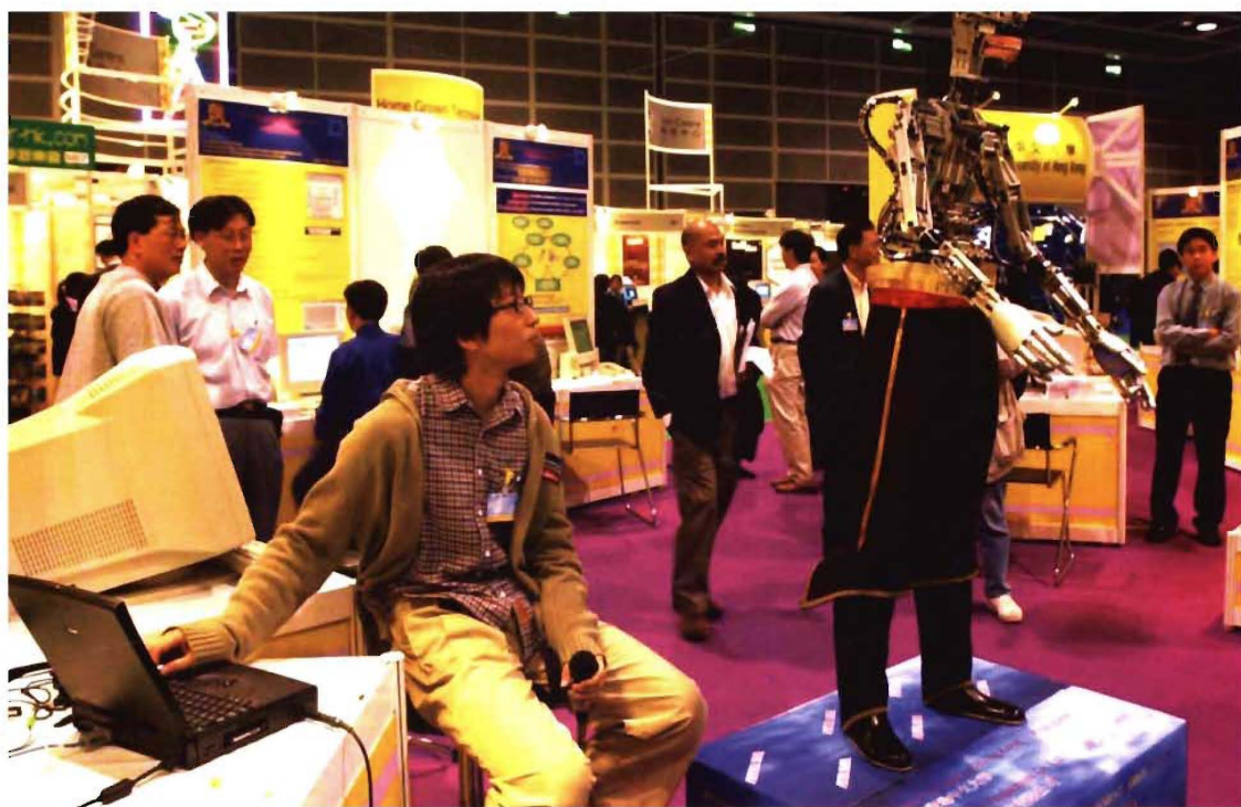
“创新博览会 2000——开创千禧新前线”在香港会议中心举行