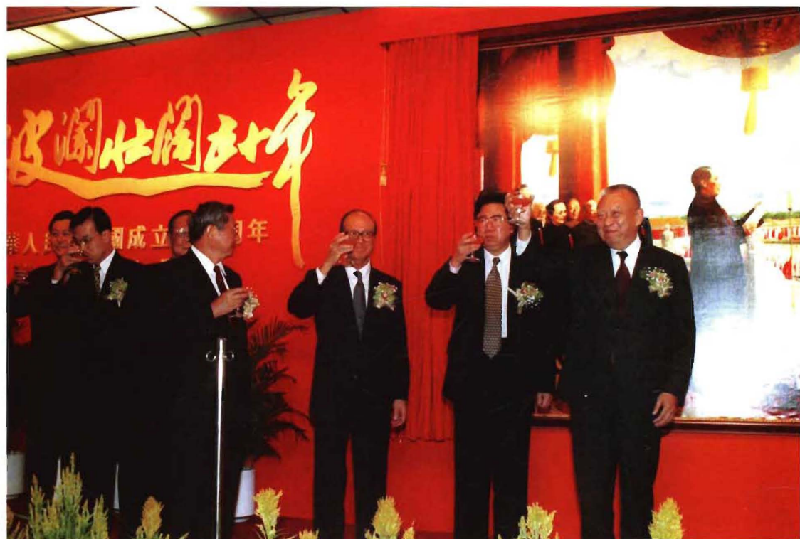
展示新中国建国五十年成就的“波澜壮阔五十年”展览在香港展览中心开幕