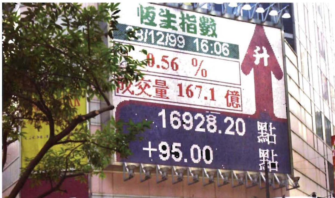
12月28日,香港股市再创新高, 恒生指数以接近17000点迎接千禧之年