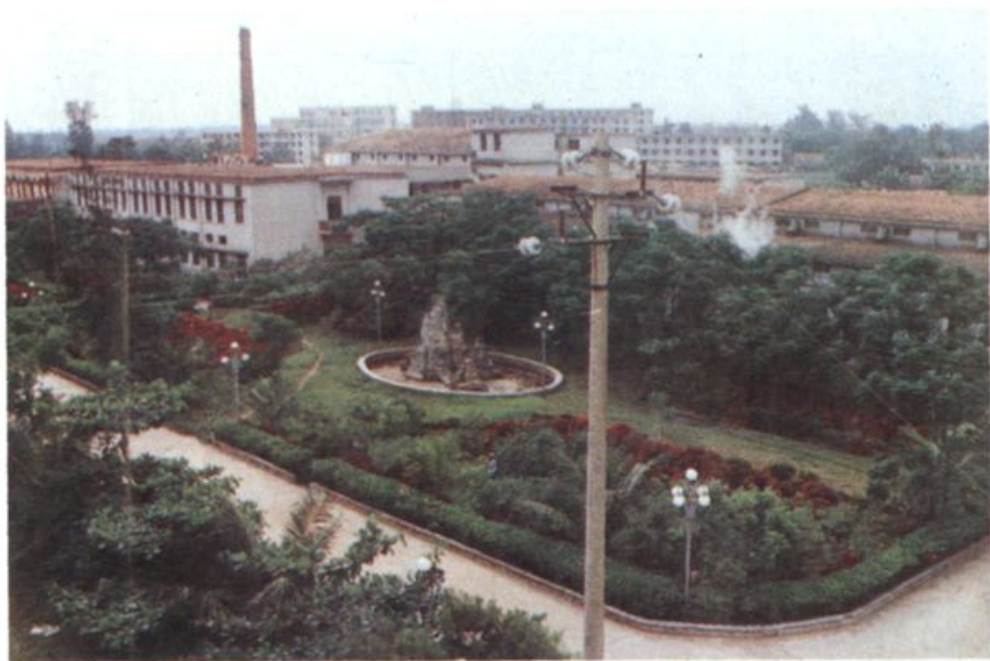
△琼州烟厂一角