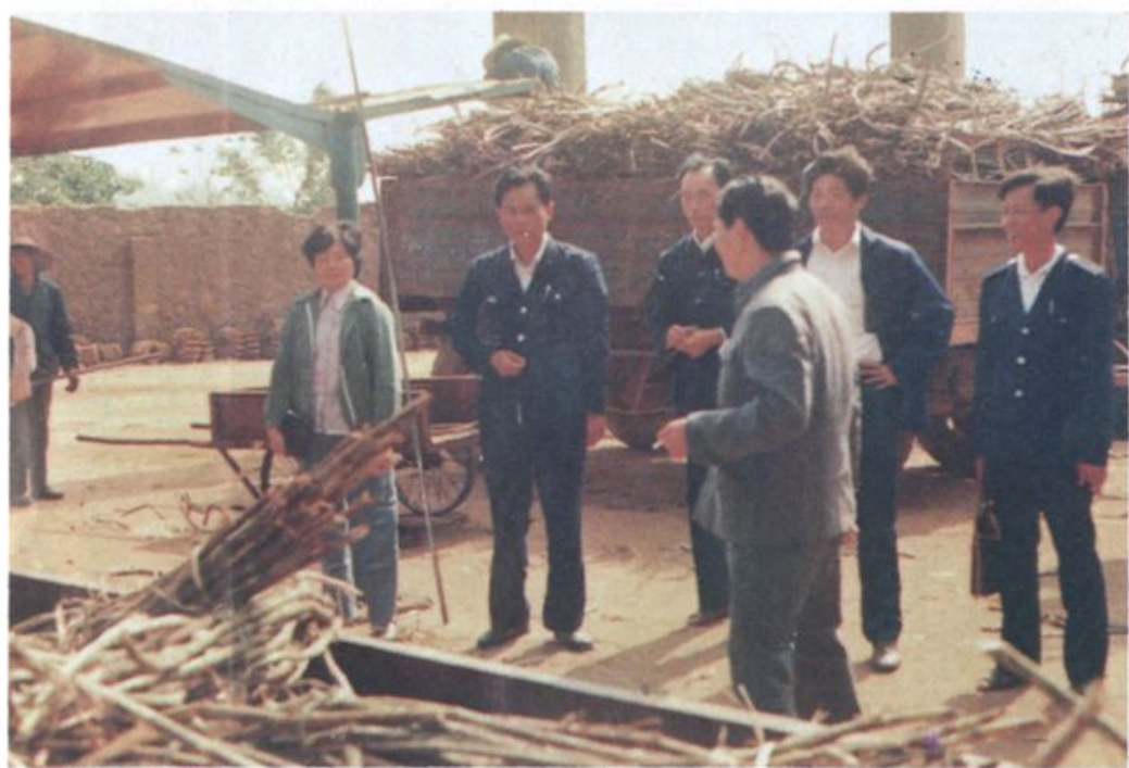
县政府同财政局领导在龙塘糖厂检查生产