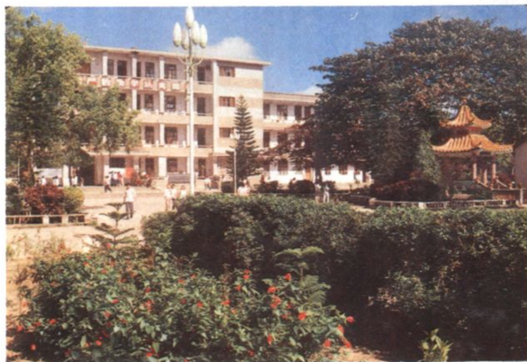
琼山中学教学大楼