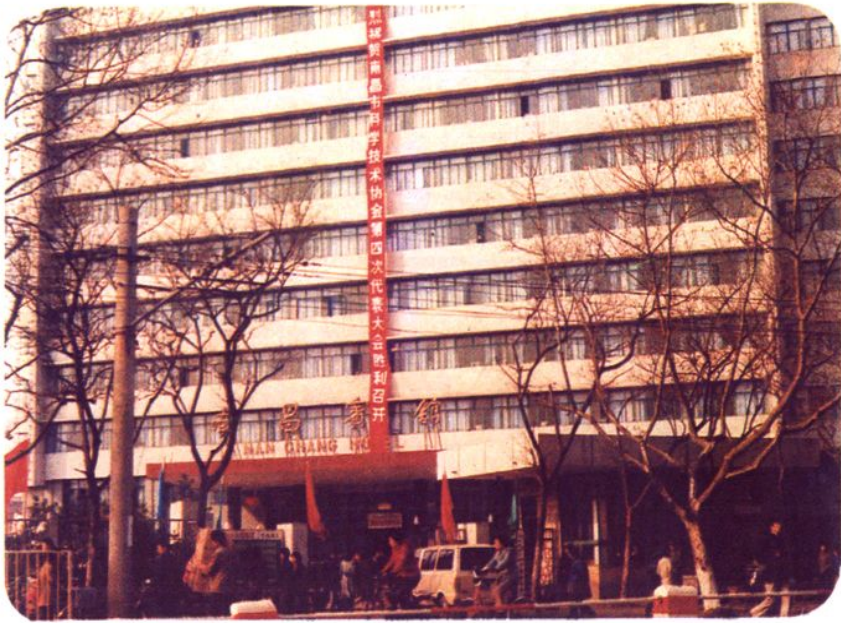
1986年12月，市科协第四次代表大会在南昌宾馆召开