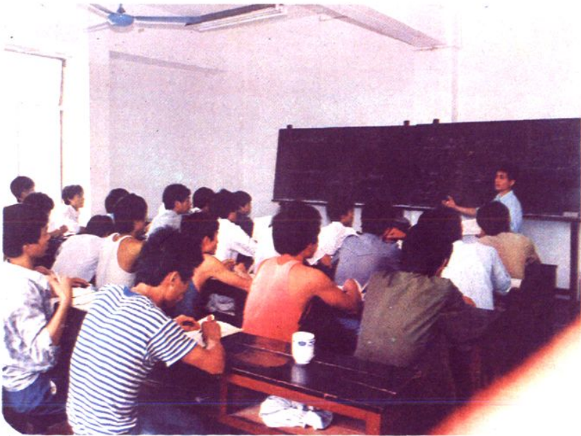
南昌市科技进修学院学生在上课