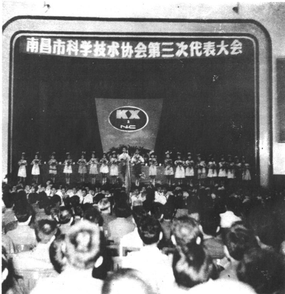
南昌市科协第三次大表大会开幕（1980年）