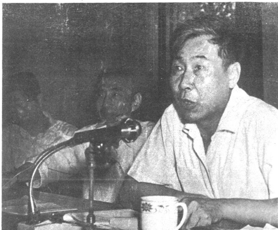
中共南昌市委副书记王显文在市科协第三次代表大会 上讲话（1980年）