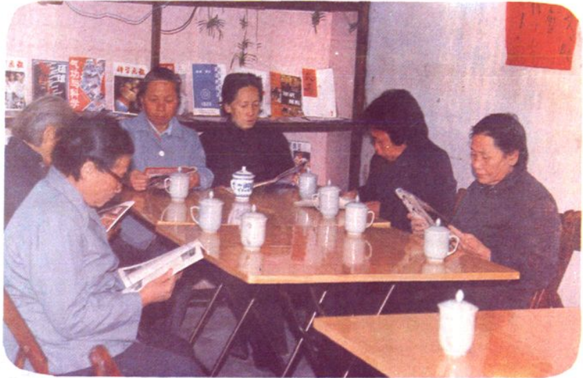
街道科普画廊一 瞥