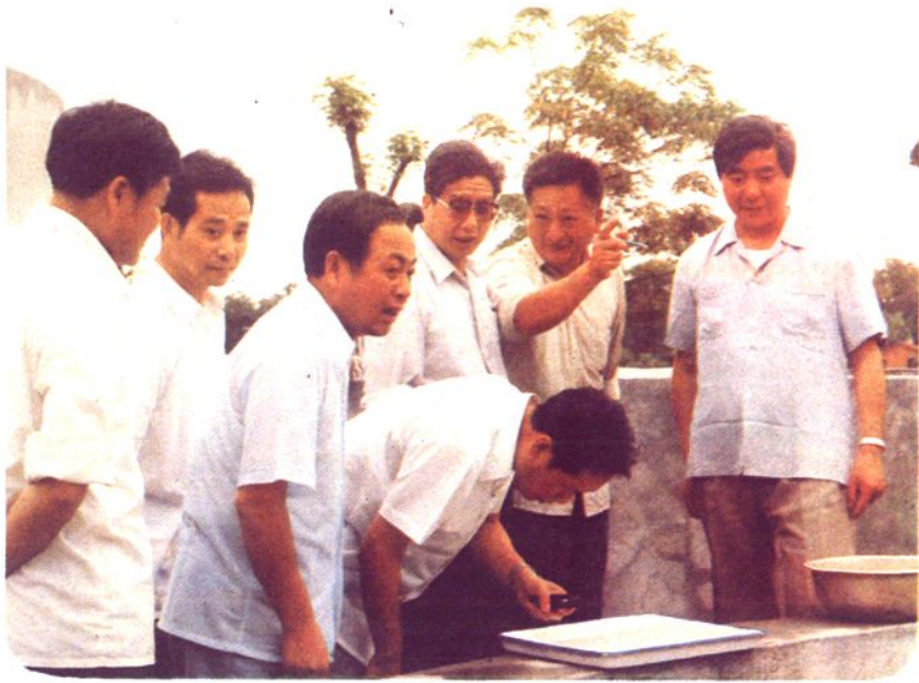
南昌市的水产生产与科研活动，得到了省市领导的重视、支持和关怀。副省长蒋祝平、南昌市委书记李爱芬、南昌市长程安东、副市长周鑫群等领导在南昌市水产研究所检查鳊鱼人工孵化情况。