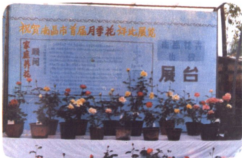
举办花展 南昌市花卉协会