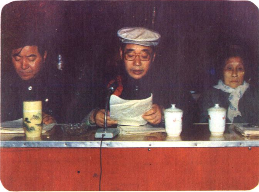
中共南昌市委副书记、南昌市市长程安东，中共南昌市委副书记史骏飞，原中共南昌市委副书记、市科协一、二届主席何恒在市科协第四次代表大会会议上（图为史骏飞在大会上讲话）（1986年）