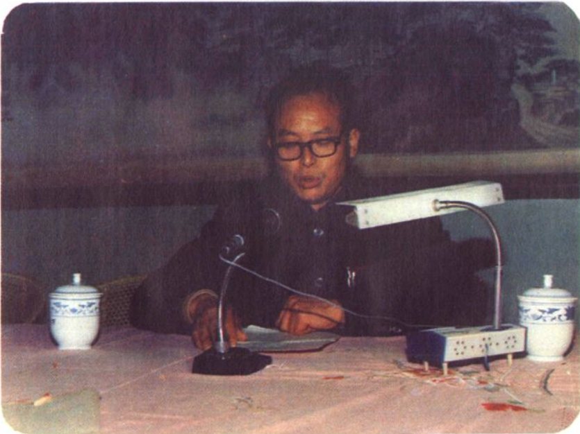
南昌市科协主席万木林在市科协四届一次全委会上讲话（1986年）