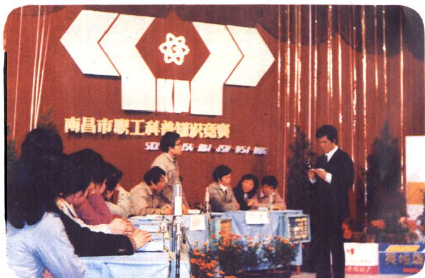
知识竞赛活动（1986年） 组织了南昌市职工科 南昌市科协等有关单位联合组