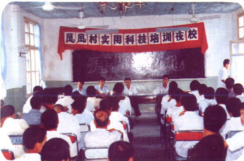
郊区凤凰村实用 科技培训夜校开学典礼