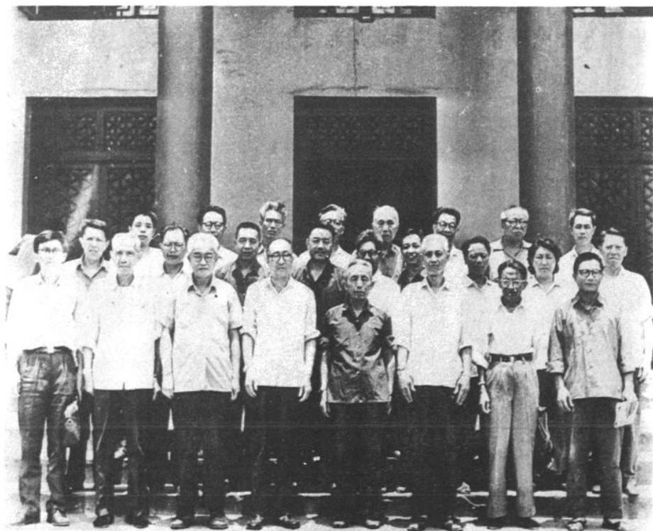
南昌市科协第三届常委合影（1980年）