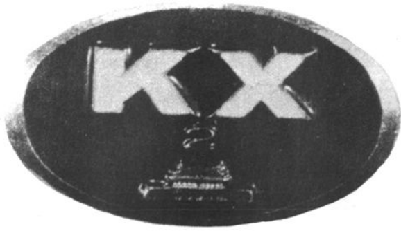
南昌市科学技术协会第二次代表大会会徽（1964年）