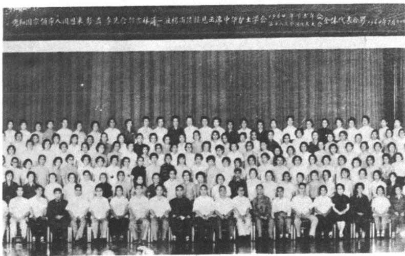
1964年8月党中央领导周恩来，李先念，彭真等接见中华护士学会代表，其中陈玉华，张志华、陈忍谦、吴茜曼为中华护士学会南昌分会代表。