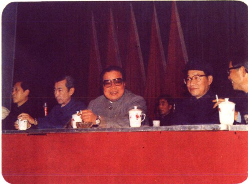
中共南昌市委书记李爱荪，省科协党组书记、省科协主席徐贻庭，中共南昌市委副书记、南昌市人民政府市长蒋仲平，南昌市政协主席林本英在市科协第四次代表大会上。