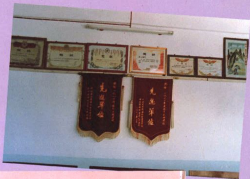
本院被领导机关评为 先进单位的部分奖状锦旗