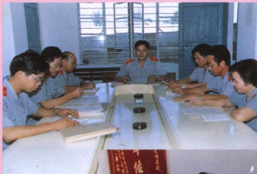
院审判委员会 在讨论案件