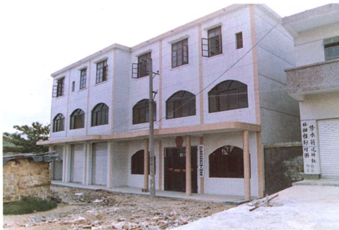
刚建成的石碌人民法庭