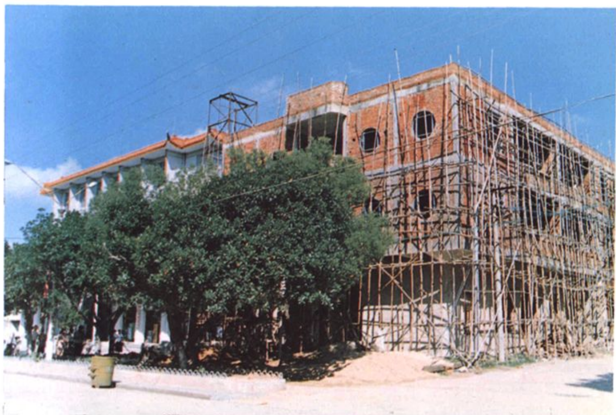
正在兴建中的本院审判庭