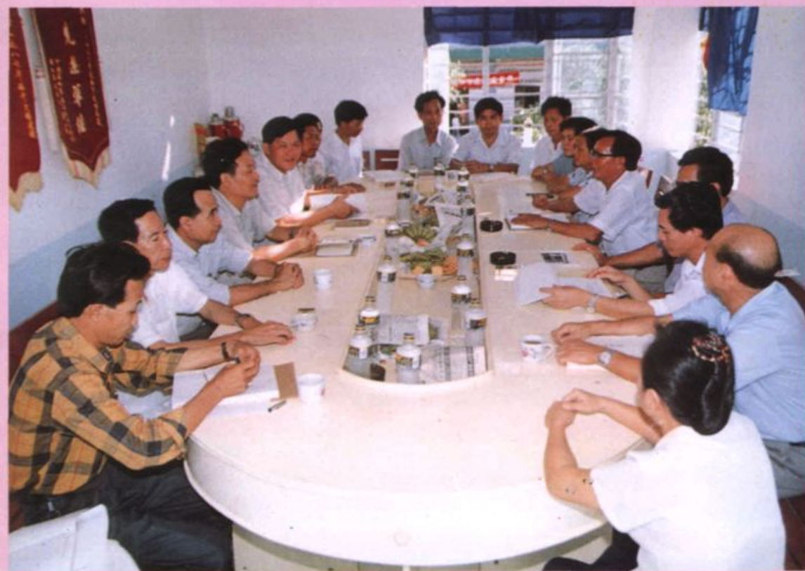
法院志审稿会情景