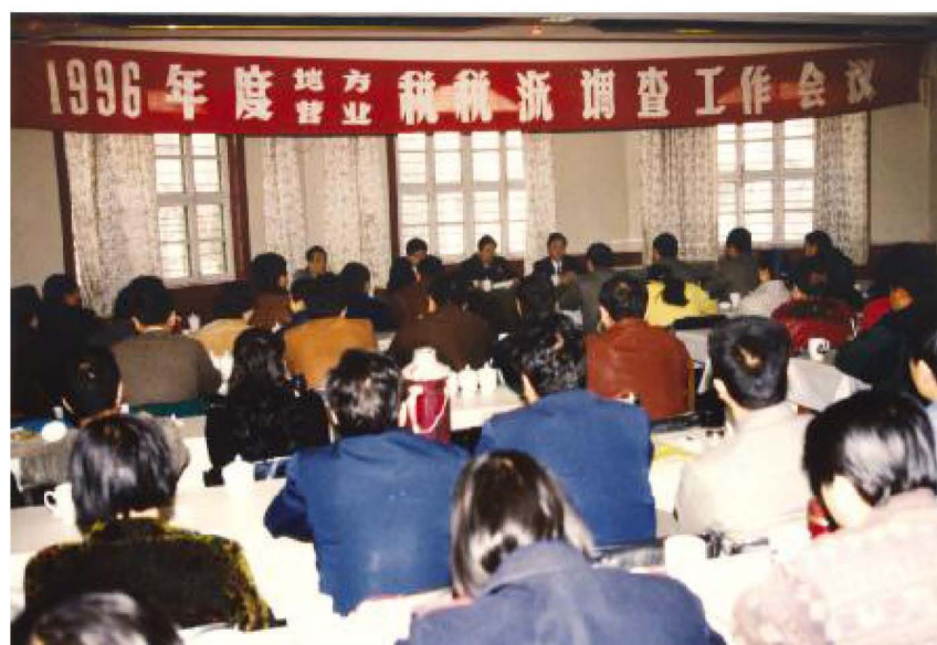
1996年度地方税、营业税税源调查工作会议会场。