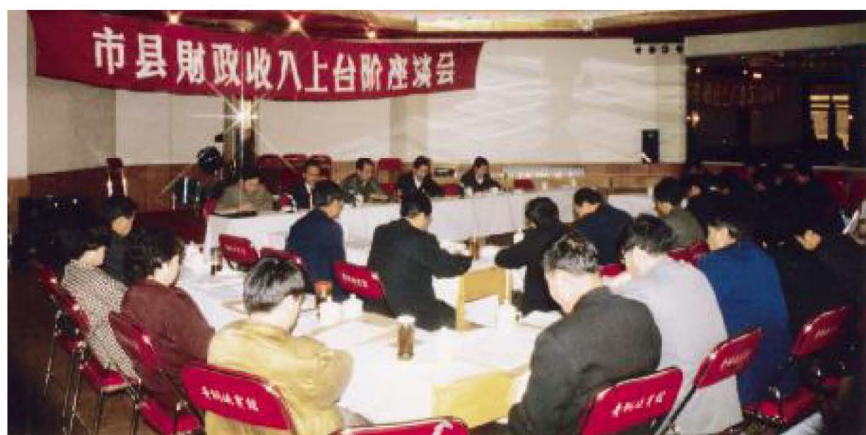
自治区财政厅组织召开“市县财政收入上台阶”座谈会。