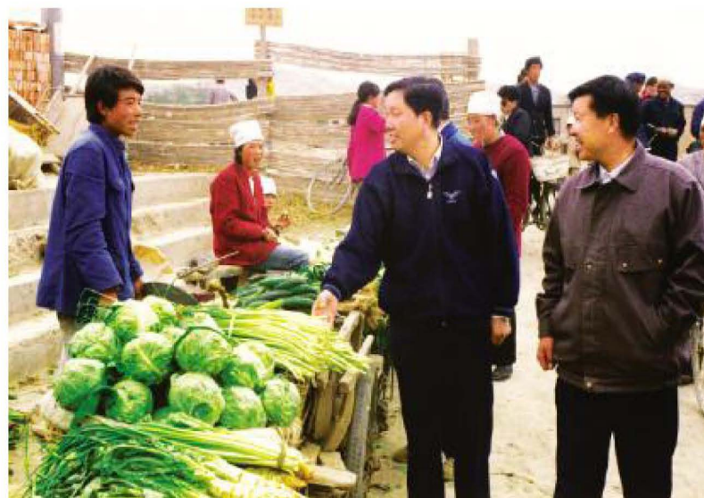
自治区财政厅厅长马骏廷(右二)在宁南山区视察市场。