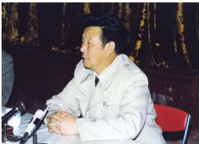
自治区财政厅厅长 雷鸣在全区财政工作会 议上。