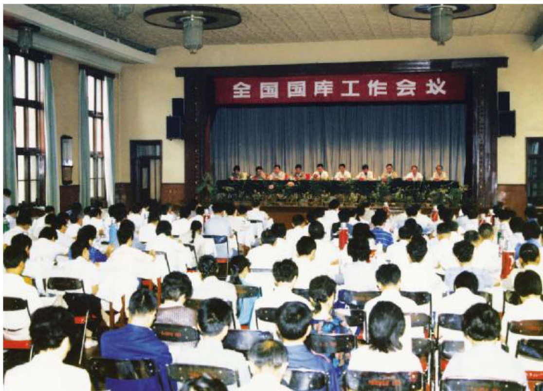
1989年8月,财政部、中国人民银行、国家税务总局在银川市召开全国国库工作会议。