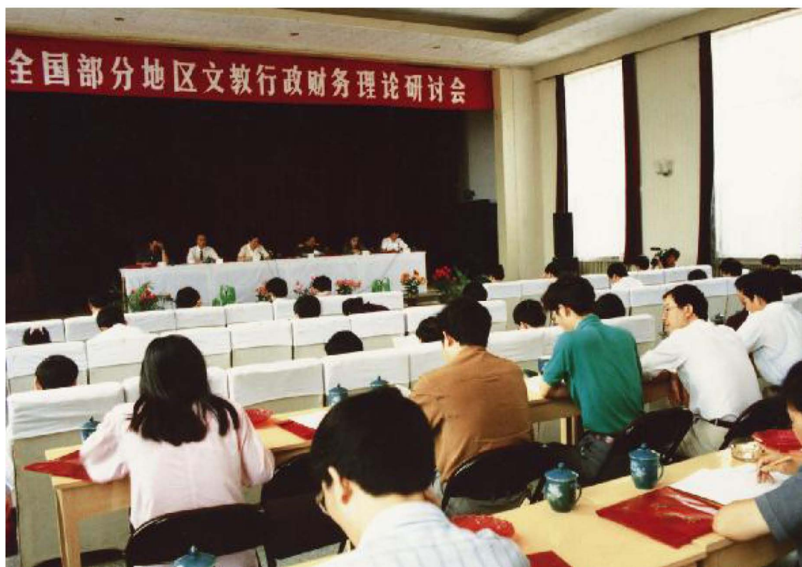
1992年8月,全国部分地区文教行政财务理论研讨会在银川召开。