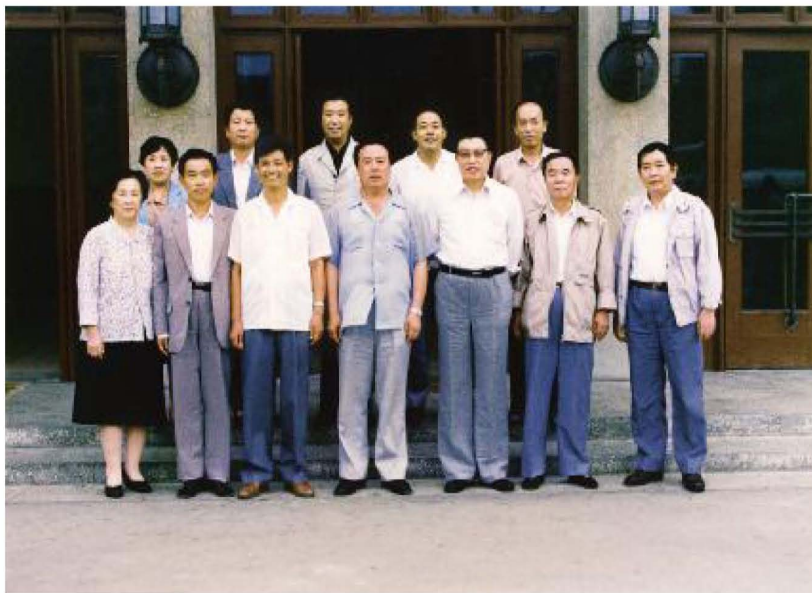
财政部副部长迟海滨（前排右三）在宁夏考察并与自治区主席白立忱（前排右四）及自治区财政厅领导合影。