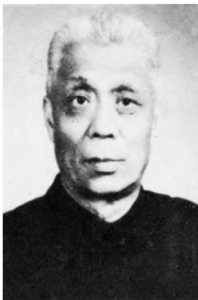
解放初首任宁夏省财政厅 厅长石子珍。