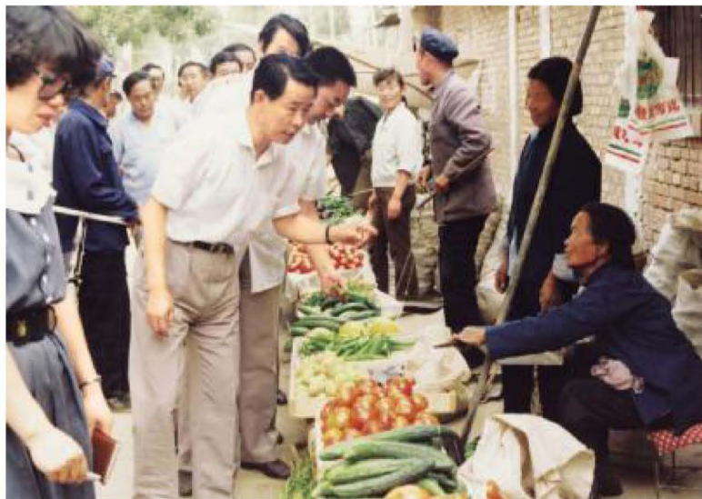
自治区财政厅厅长程法光在吴忠了解市场发展状况。