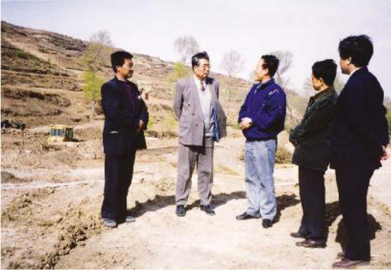
自治区财政厅厅长邓炎辉(左二)在隆德县调研。