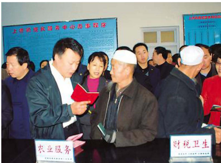
自治区财政厅厅长王和山(前排右二)深入农村基层调研。