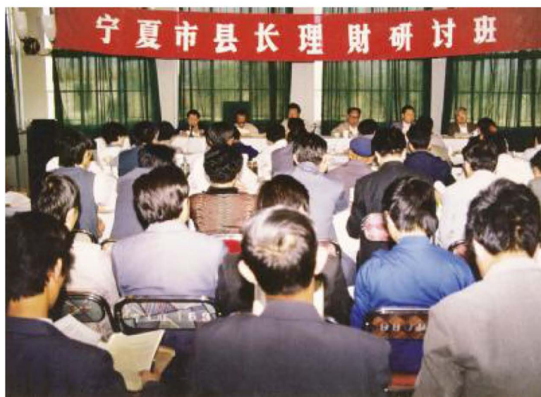
1991年5月,自治区财政厅在银川举办“宁夏市县长理财研讨班”。