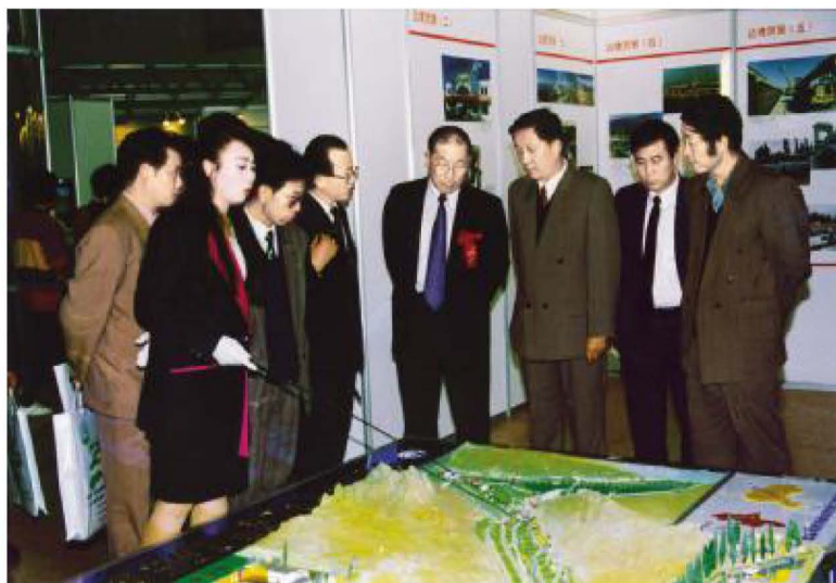
1994年10月，财政部在北京民族文化宫举办了“全国支援经济不发达地区发展资金十五年使用成果展示会”。财政部部长刘仲藜（右四）参观“宁夏吊庄发展模型”。