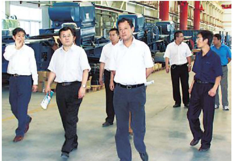
自治区财政厅厅长陶源(前排左三)深入企业调研。