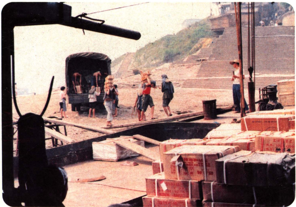
10、驳船在朝天门码头装载