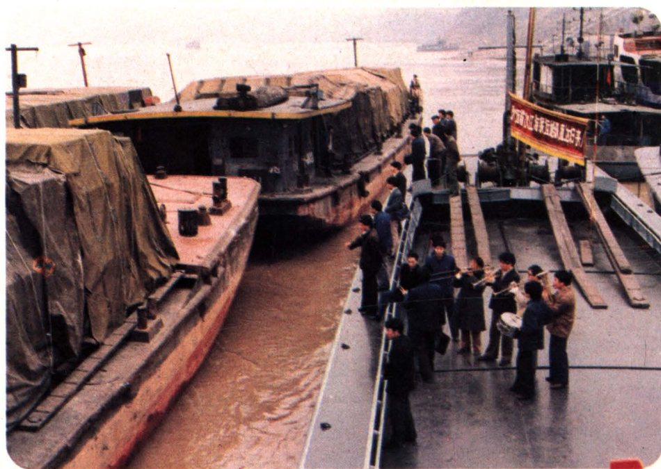
12、1986年首次江海联运亚马哈配件胜利归来， 停靠在建设厂码头