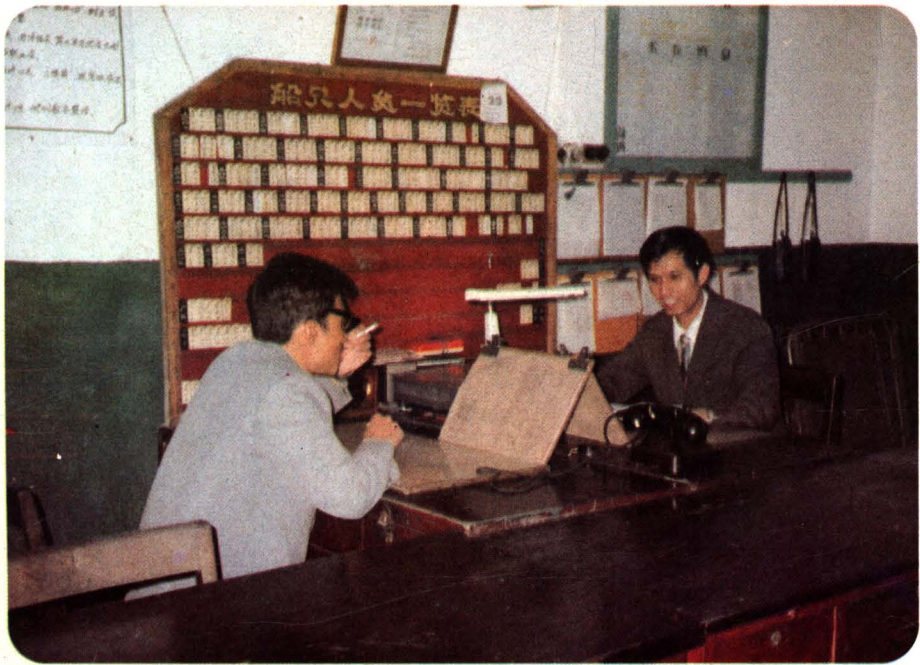
6、公司生产调度指挥中心