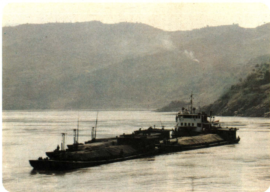
7、1984年802轮运出川物资由长寿开往长江下游