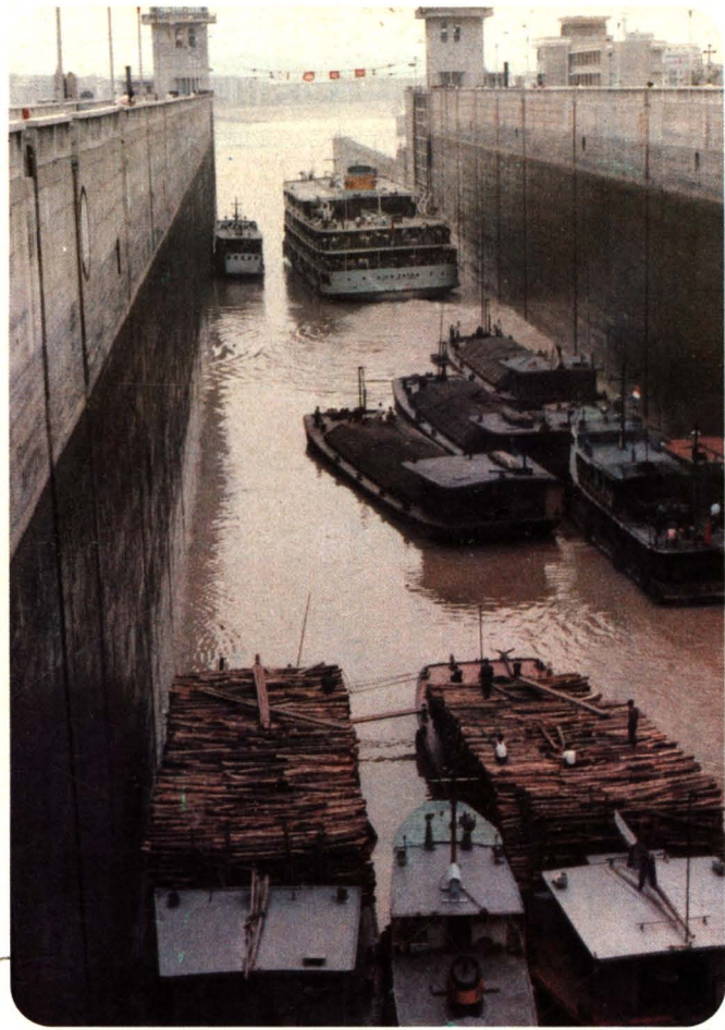
9、一九八四年五〇八轮船队运煤出川，通过葛洲坝