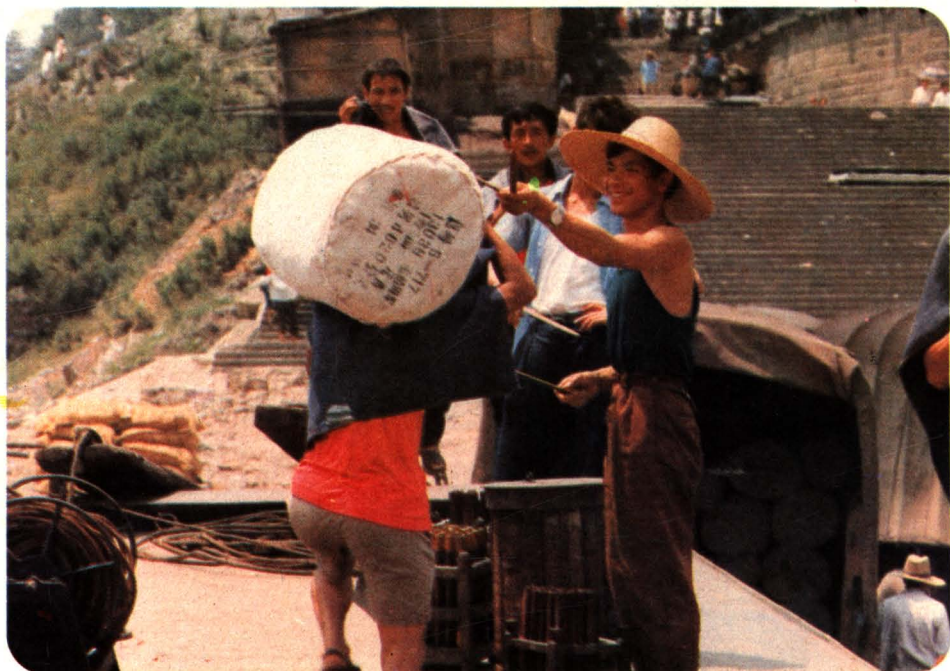
11、驳船在朝天门码头卸载