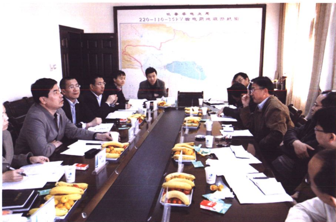
吐鲁番电业局领导与新疆电力公司领导共同谋划超高压时代吐鲁番电网发展