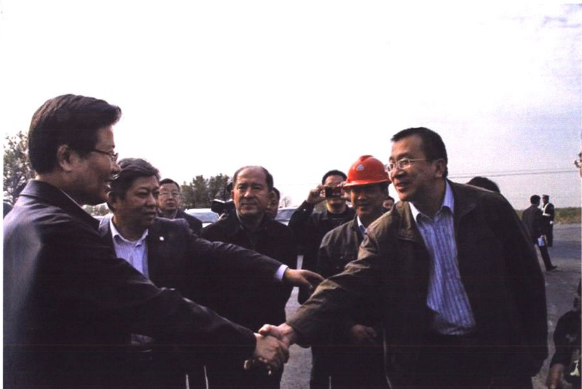
2010年10月,自治区党委书记张春贤来吐鲁番电业局慰问。