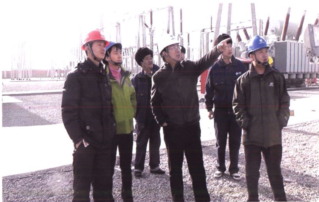
吐鲁番电业局领导检查变电站运行管理工作