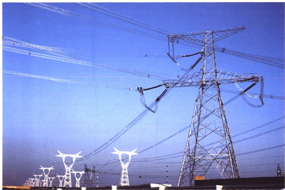
750 千伏线路巍峨耸立的铁塔