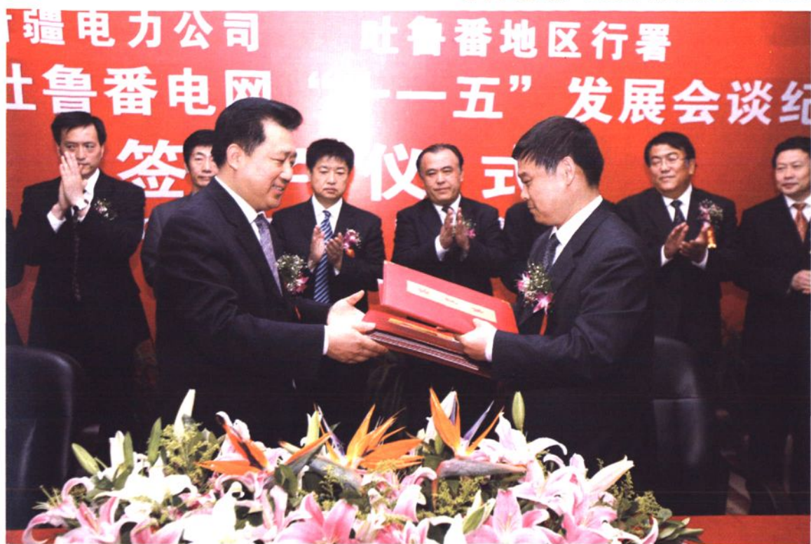
2007年4月,新疆电力公司与吐鲁番地区行署签订“十一五”发展会谈纪要。