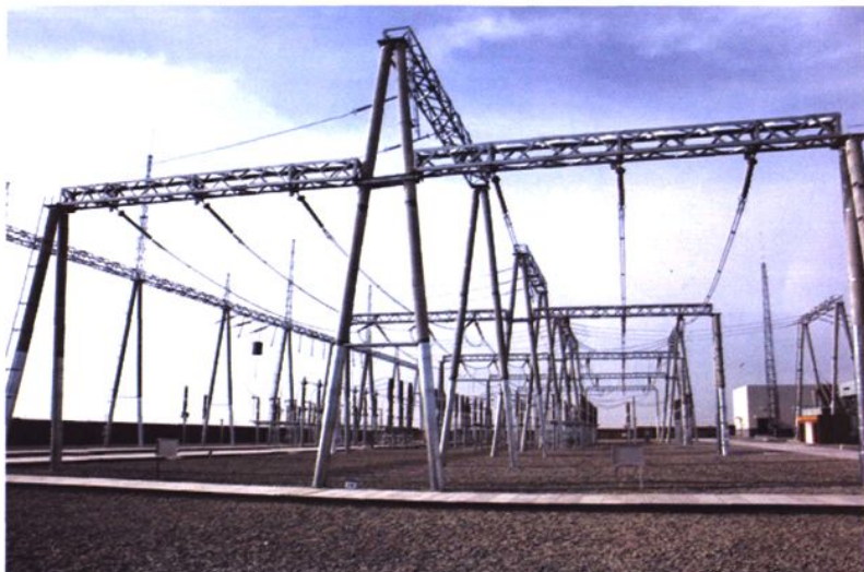
220 千伏小草湖变 电站设备区