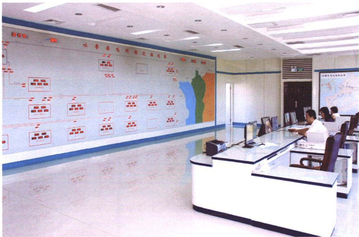
宽敞明亮的调度中心