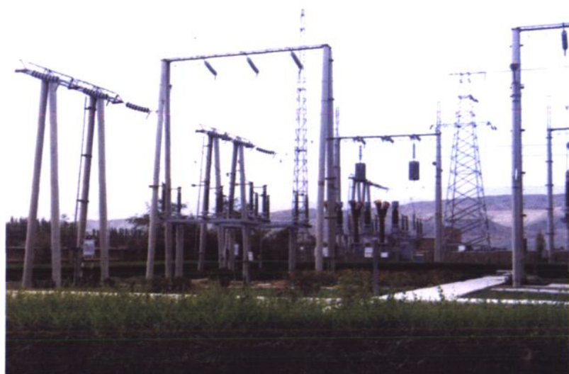
110 千伏葡萄沟变电站