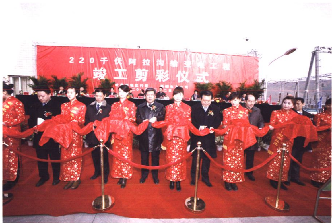
220千伏阿拉沟输变电工程竣工剪彩仪式