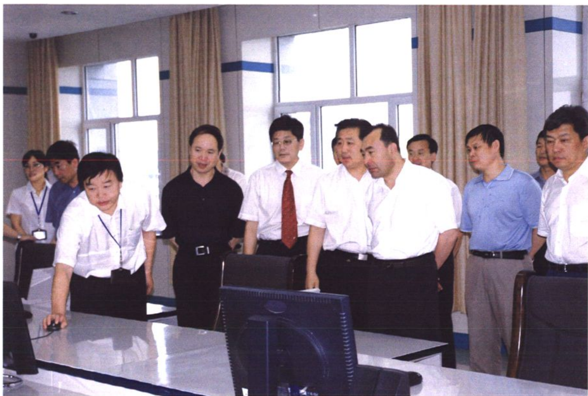
2008年5月,自治区党委常委、副主席库热西·买合苏提参观吐鲁番电业局电力调度中心。