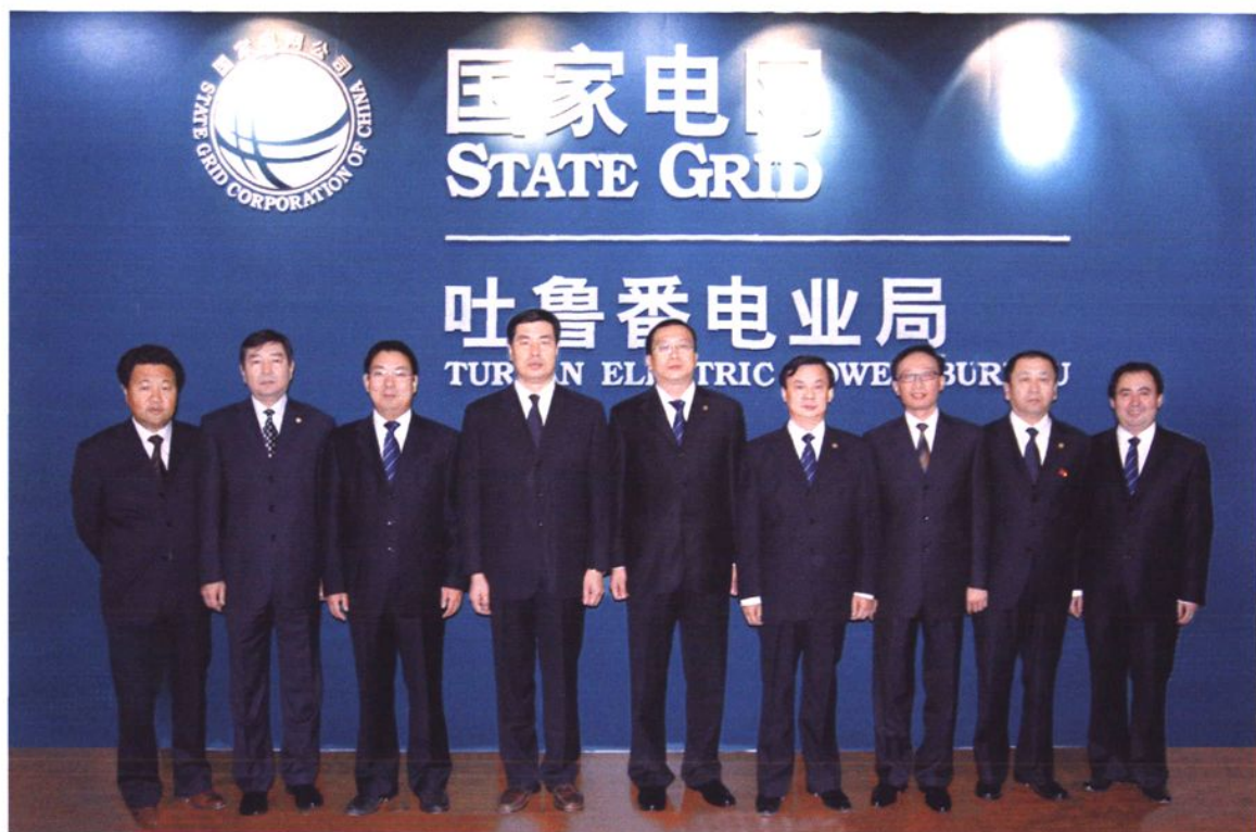
2010年吐鲁番电业局领导班子合影