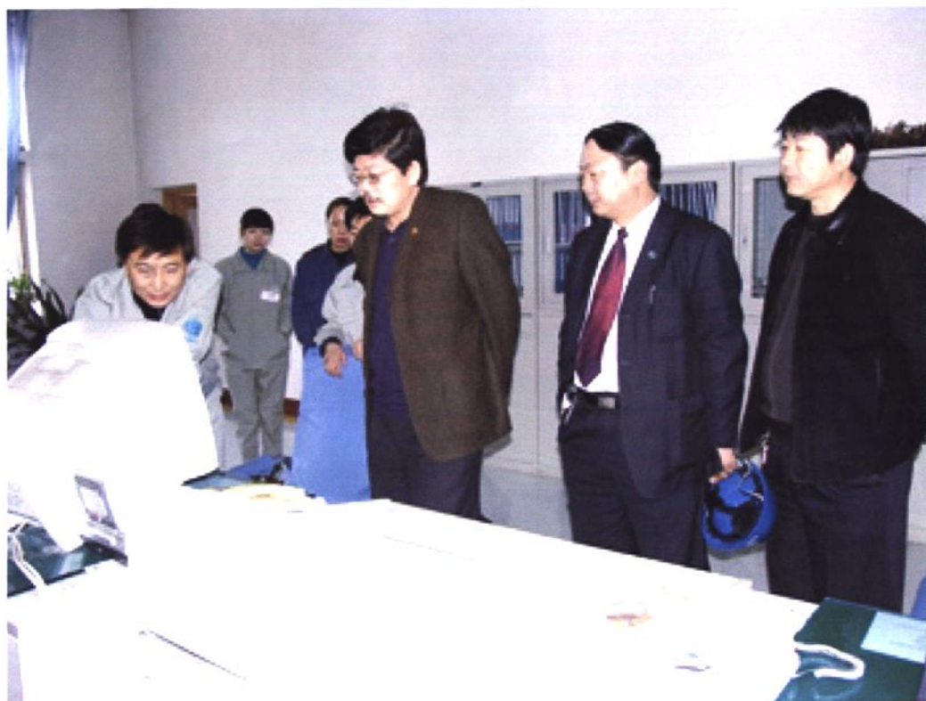
2007年2月,吐鲁番电业局领导检查变电站工作。