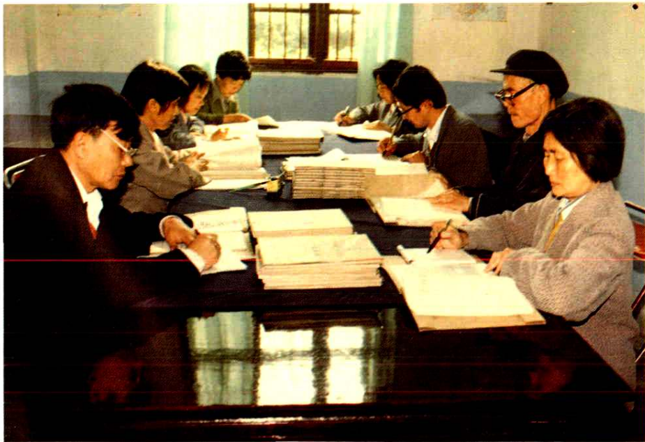
隆昌县档案馆阅览室一角