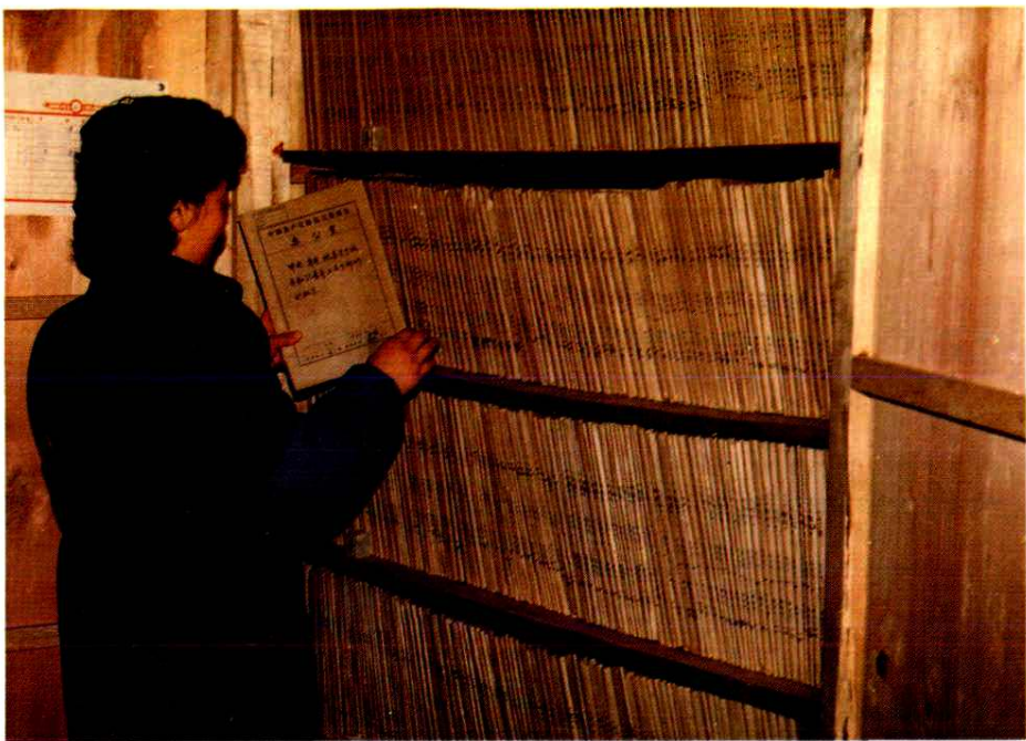
隆昌县档案馆档案管理人员正在提卷