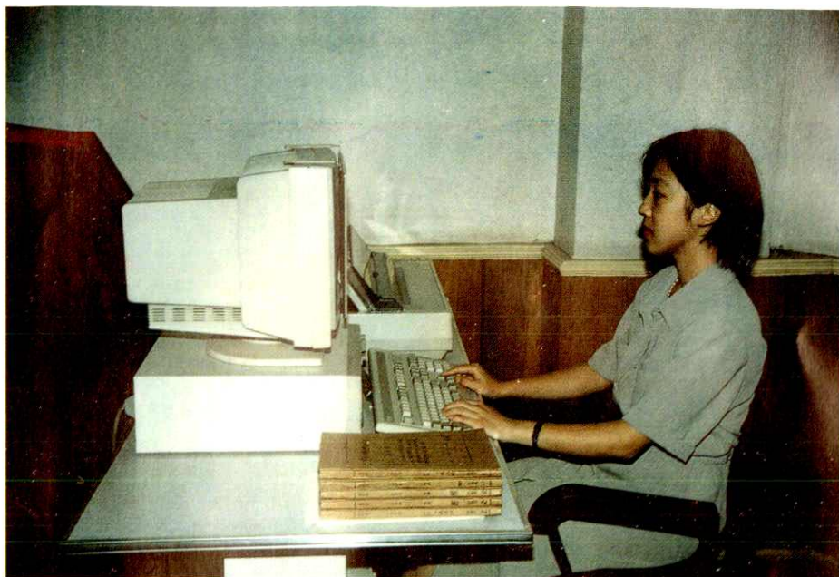
中国人民银行隆昌县支行已将档案管理现代化纳入 本机关办公自动化系统,应用微机管理档案。