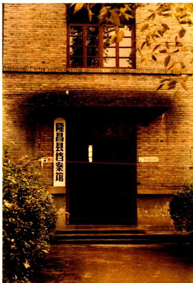
隆昌县档案馆馆址