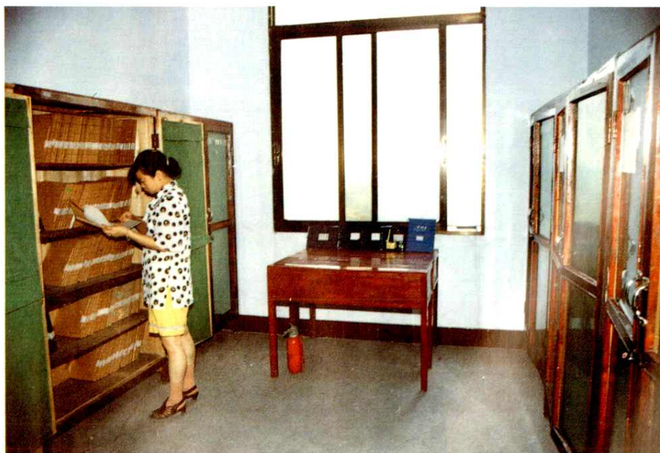
隆昌县氮肥厂科技档案室