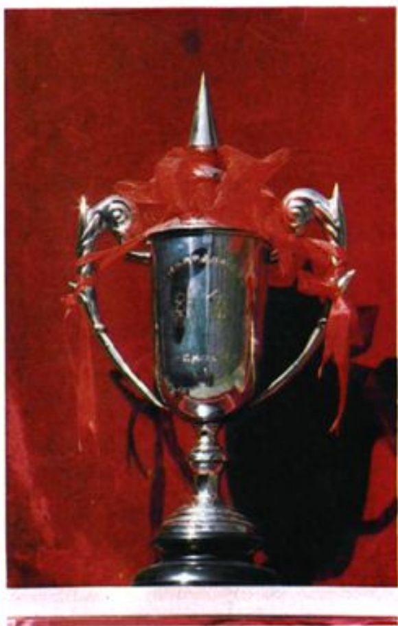
1987年荣获全国振兴中药技术竞赛奖杯