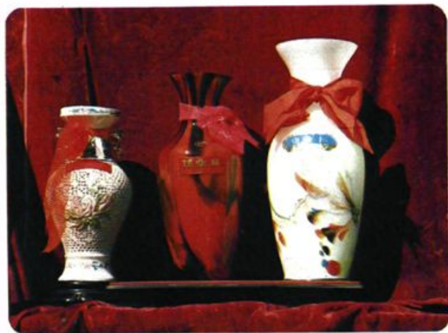
连续三年获市总工会建业杯奖