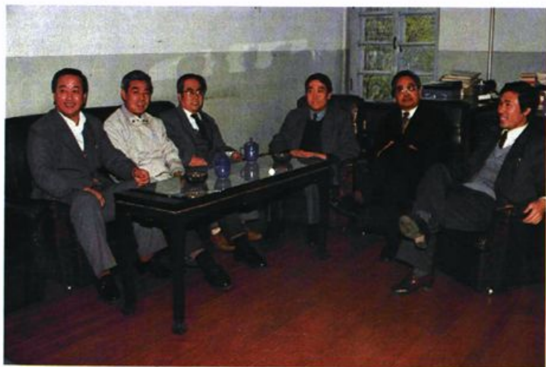
沈阳市药材公司党、政、工领导成员