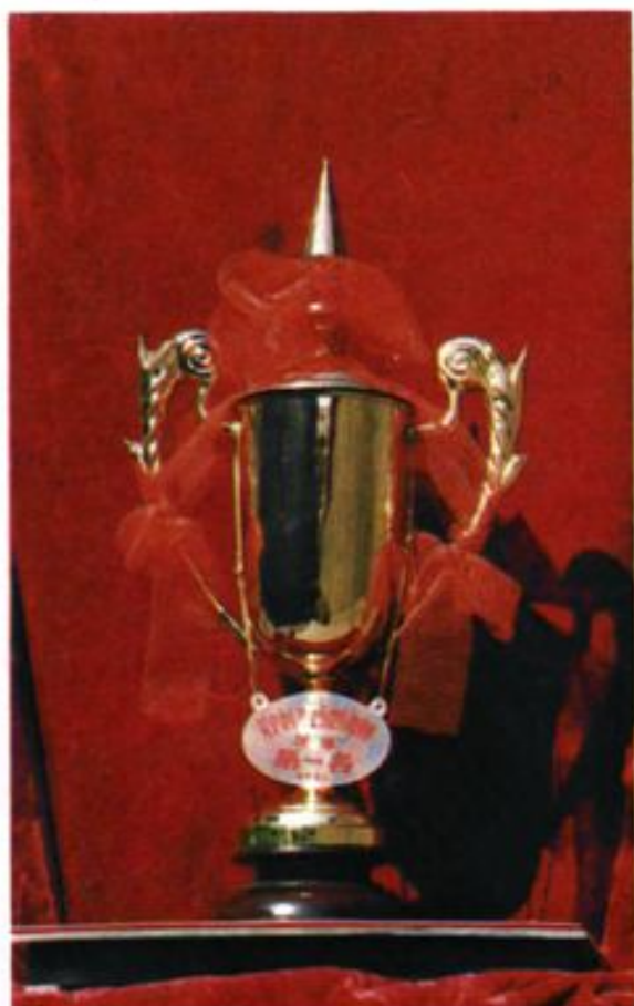
1986年荣获辽宁省中药业务技术表演赛第一名