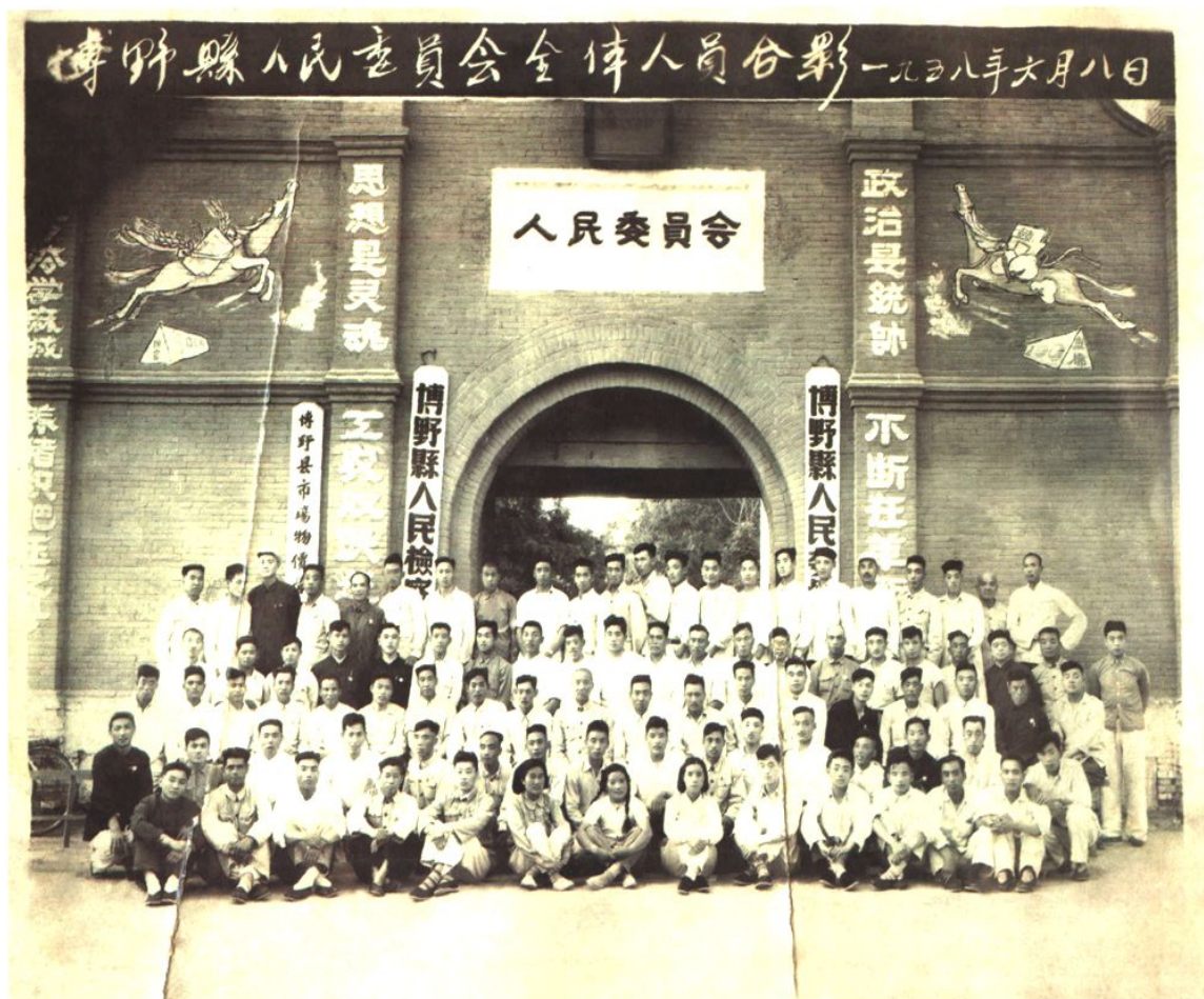
1958年撤消博野县时，县人委全体人员在县人委大门前合影 (含炊事员、看大门、交通员、服务员共99人，其中女同志3人)