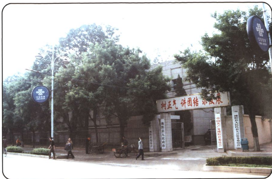
七八十年代县委、县政府办公大院