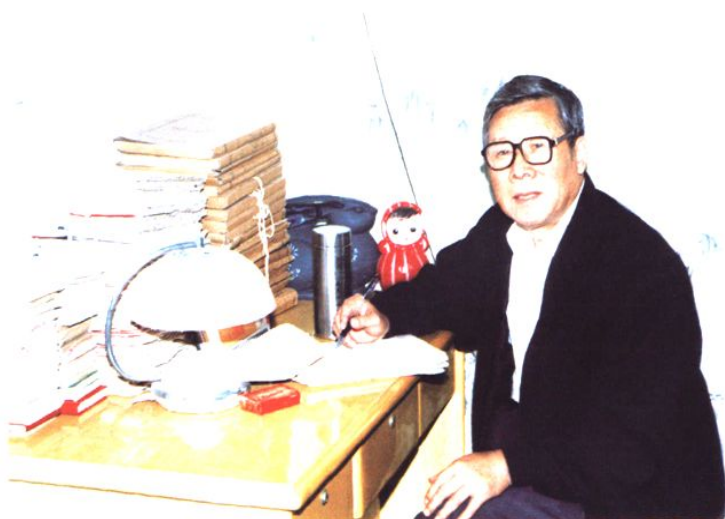
王富林编写畜牧志