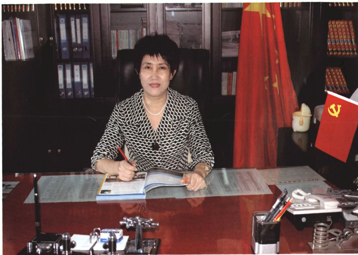
博野县人民政府县长 陈春霞