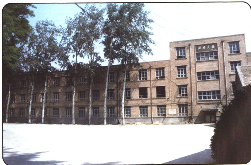
七八十年代县委、县政府办公楼