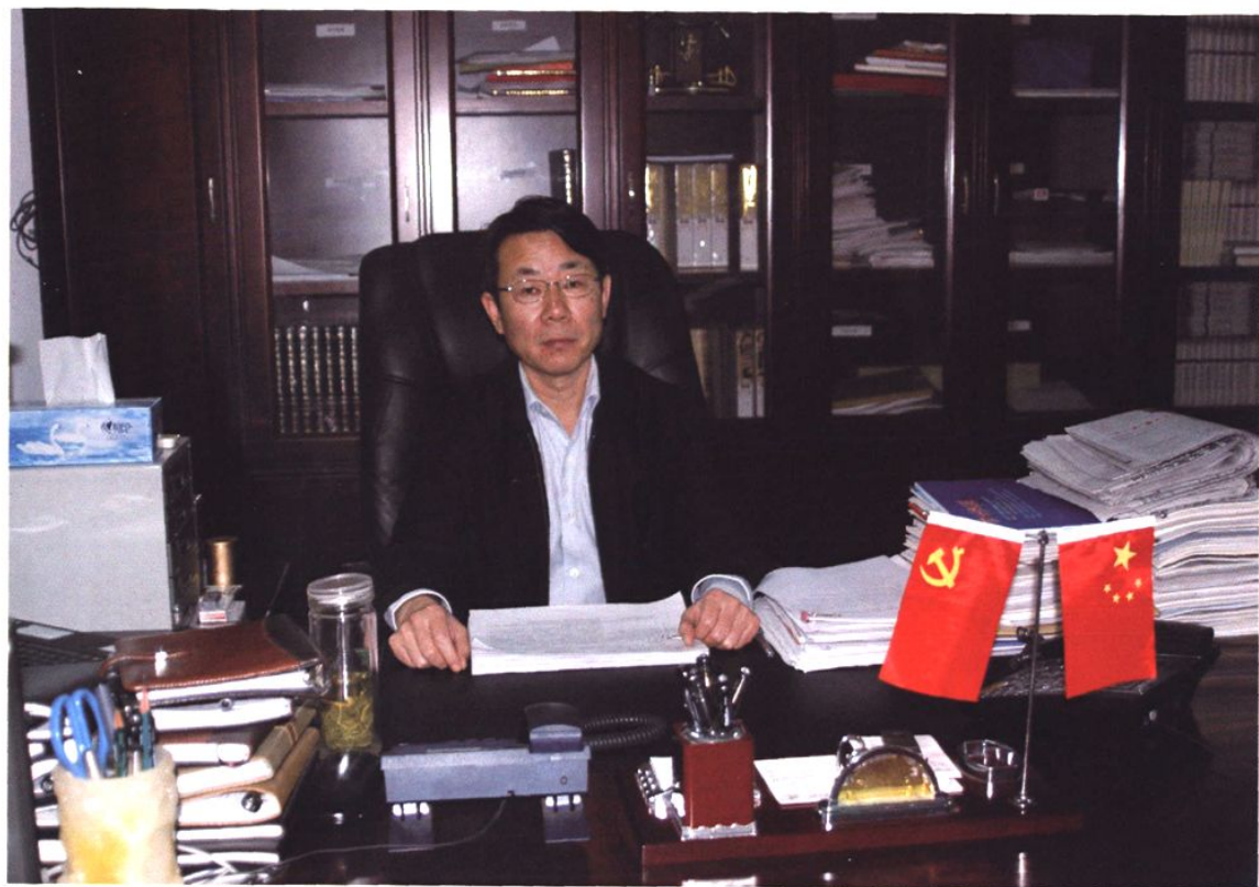
中共博野县委书记 马志超