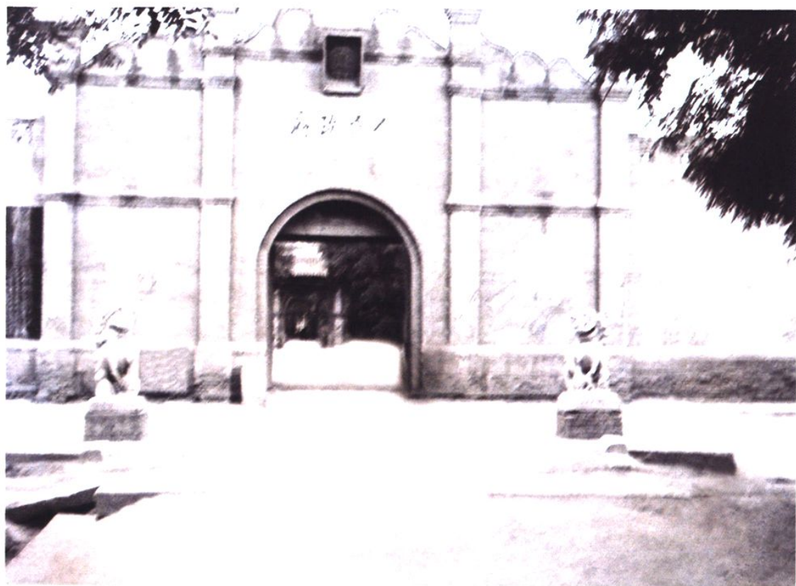
建国后至60年代县政府