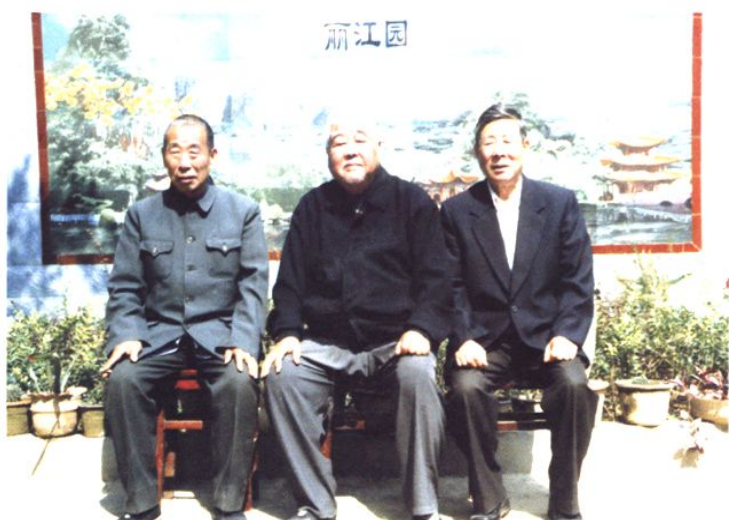
三位编修人员在原县老干部局合影