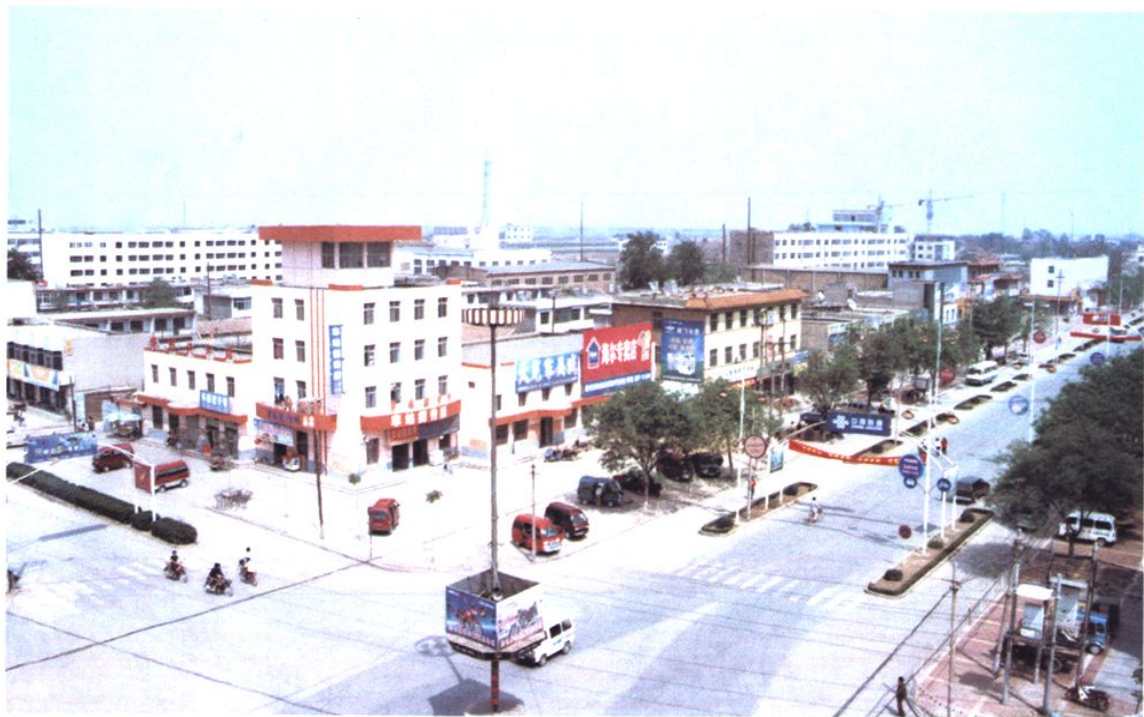
博野县县城大街（2011年）