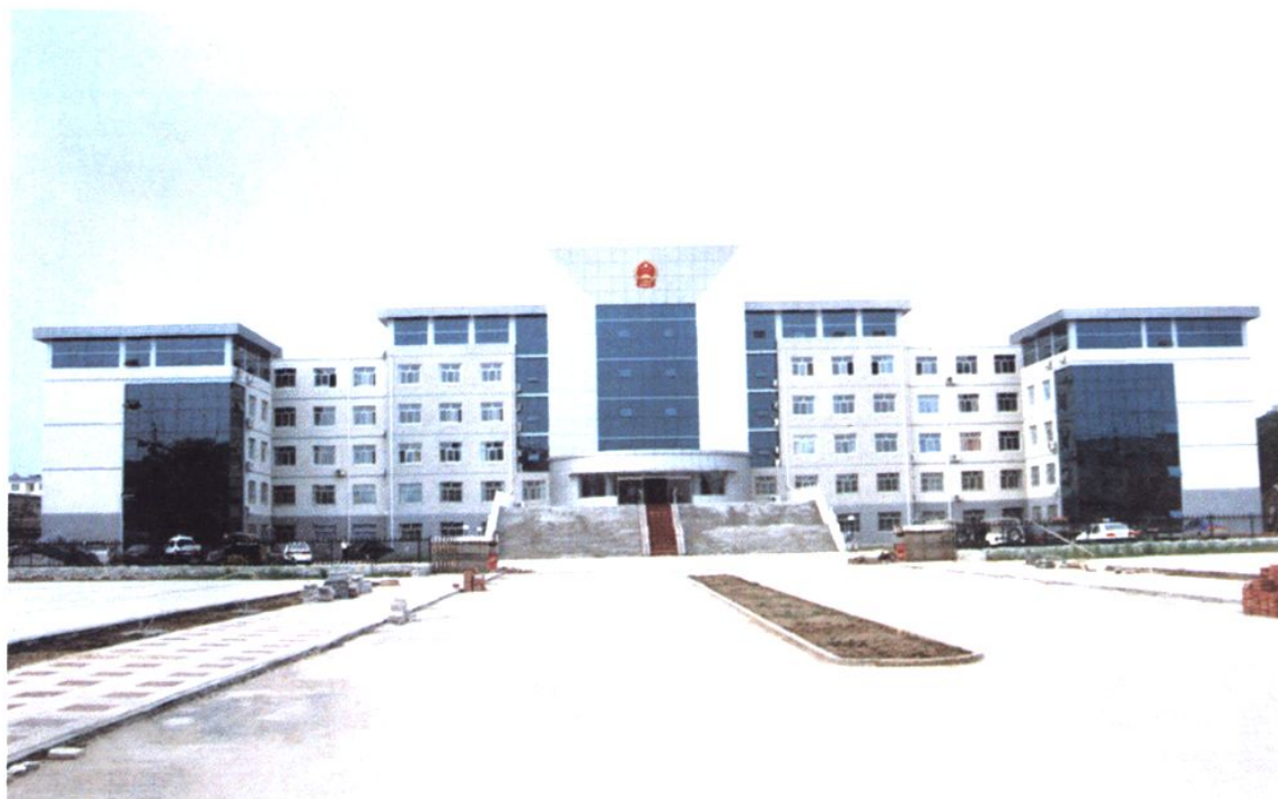
县委、县政府办公大楼（2011年）