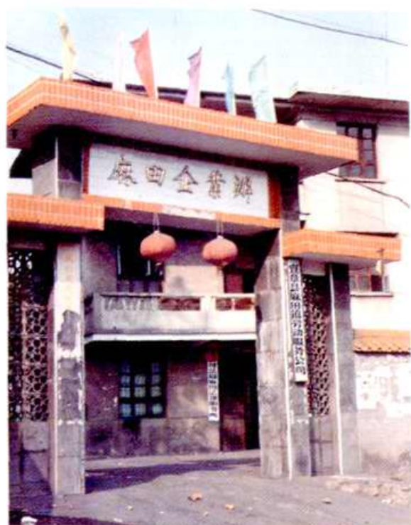
麻田企业办、安监站 办公楼