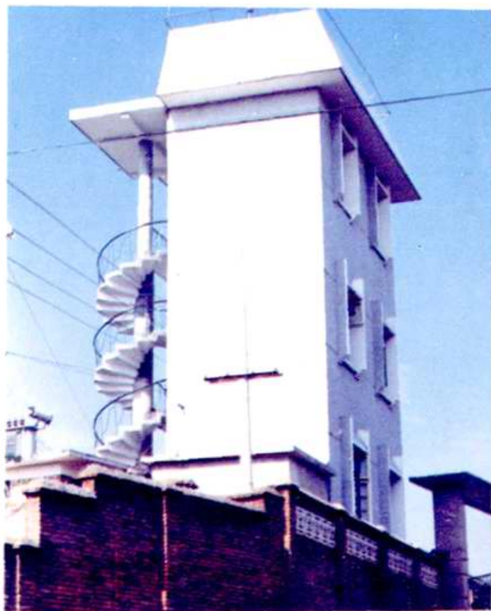
◀ 宜昌县煤炭工业公司水塔楼