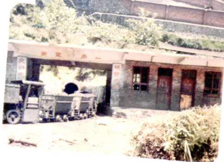
牛皮冲煤矿用电瓶车 牵引井内运输