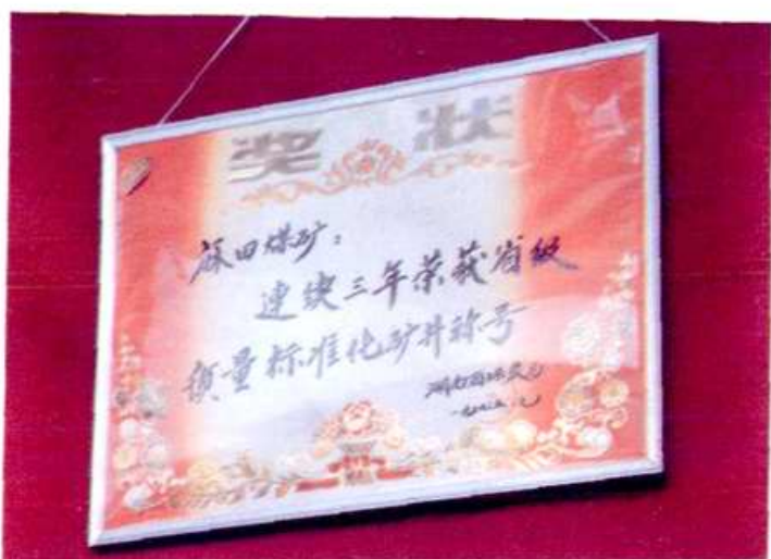
▲湖南省煤炭厅授予麻田煤矿连续三年荣获省级质量标准化矿井称号奖状、奖品 ▼