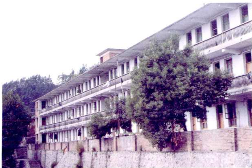
麻田煤矿职工住宅