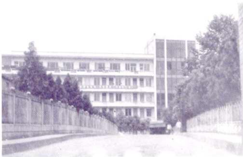
梅田矿务局办公楼