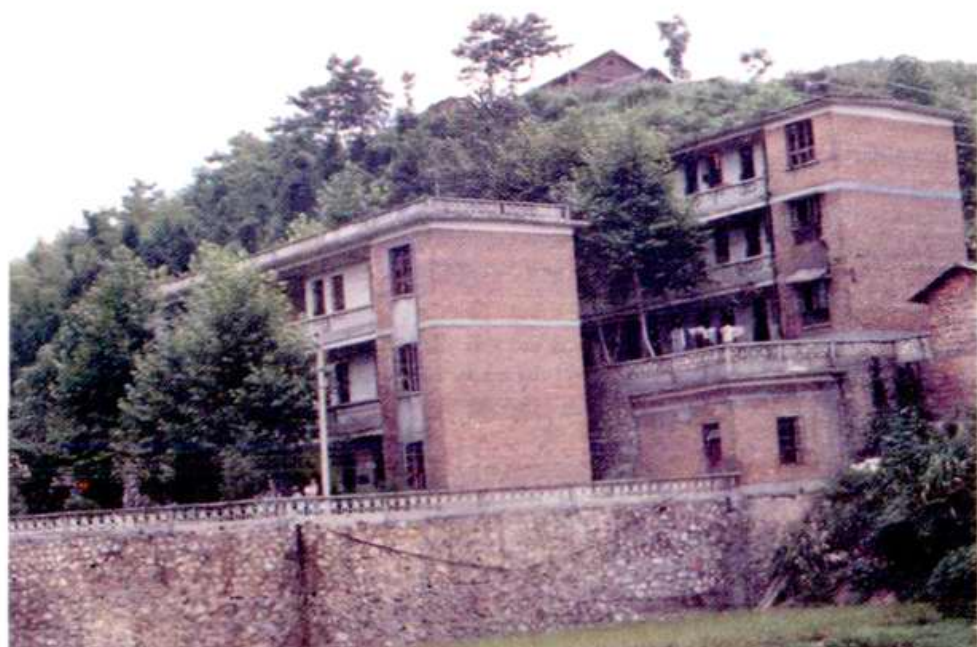
山门水煤矿办公楼