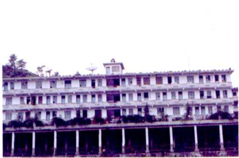
梅田矿务局六矿矿区一角