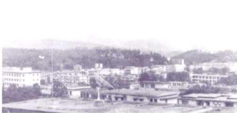
广东省梅田矿务局矿区远眺