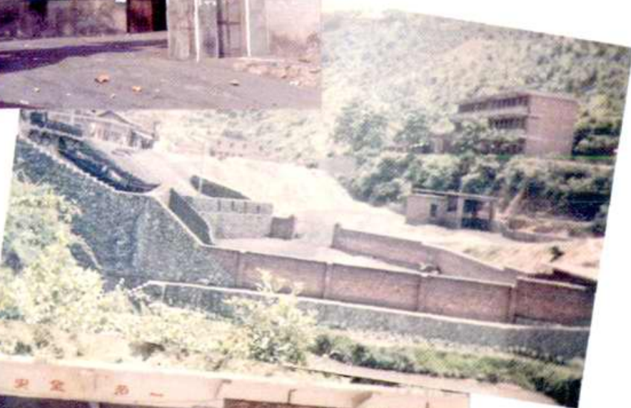
▼麻田乡牛皮冲煤矿办 公楼、煤仓