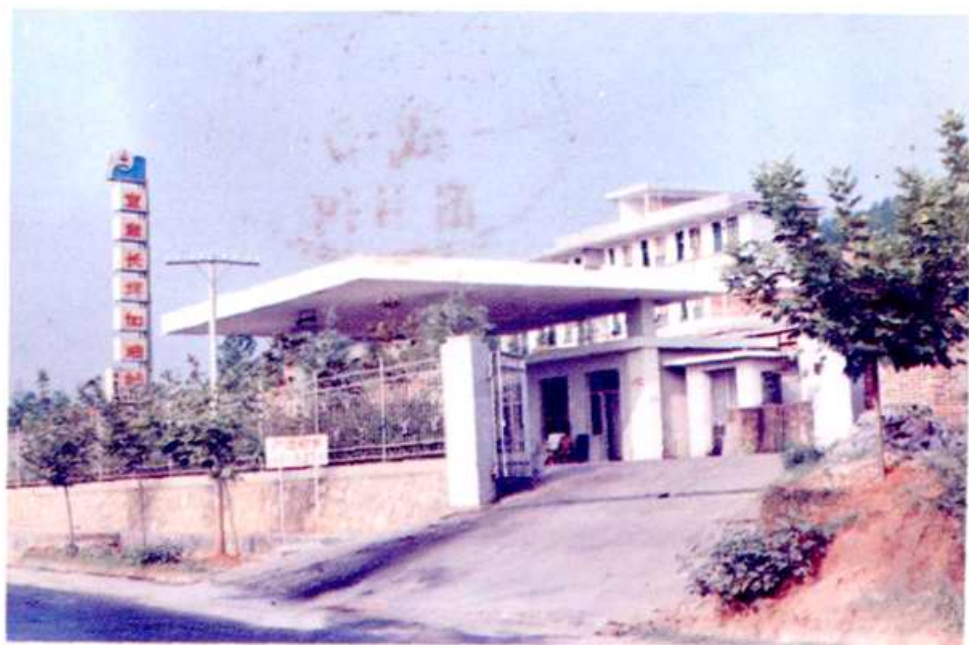
多种经营中的长坪加油站