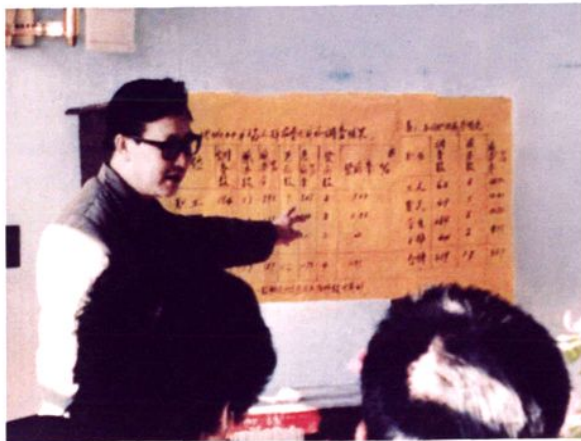
布鲁氏菌病专家徐震舟研究员作学术报告