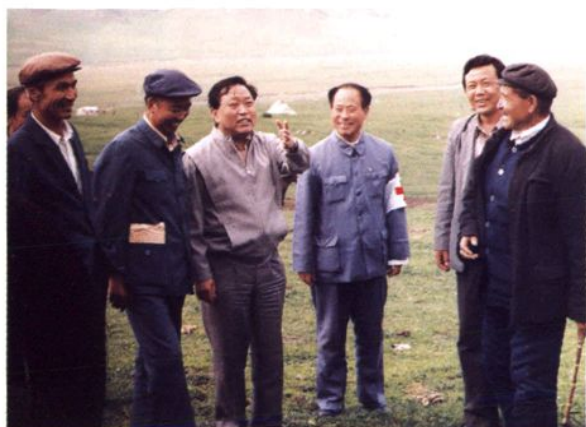
自治区党委书记宋汉良(左3) 在鼠疫疫区指导工作