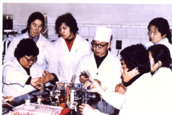
卫生部包虫病防治培训基地 举办包虫病防治培训班