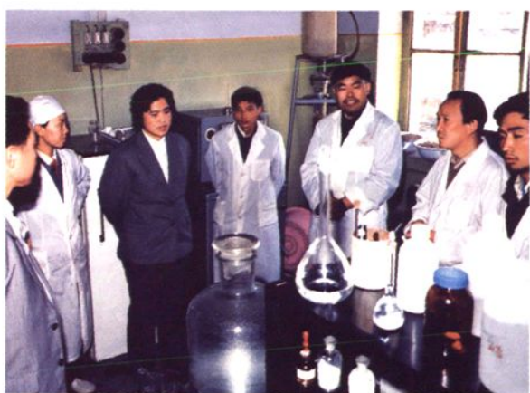
卫生部副部长何界生(左3)视察碘缺乏病研究室