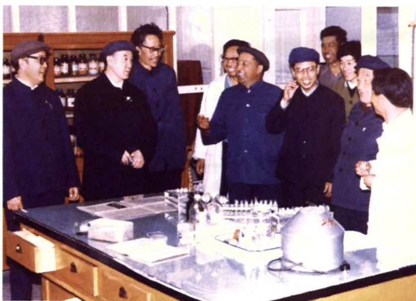
新疆维吾尔自治区党委地方病防治领导小组组长巴岱(左1)、卫生厅厅长依沙克江(左2) 由所长热合木·吾马尔、副所长滕云峰与科室领导张波副主任医师和 刘志文副研究员陪同视察第二研究室