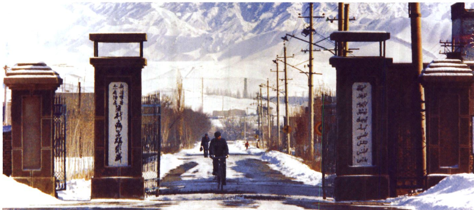
新疆维吾尔自治区流行病学研究所