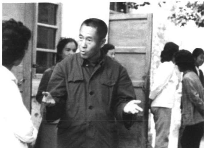
新疆维吾尔自治区流行病学研究所 英幼钧副所长在病区指导工作