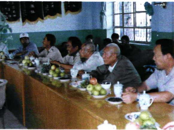
兵团副司令毛乃舜(右二)视察一团