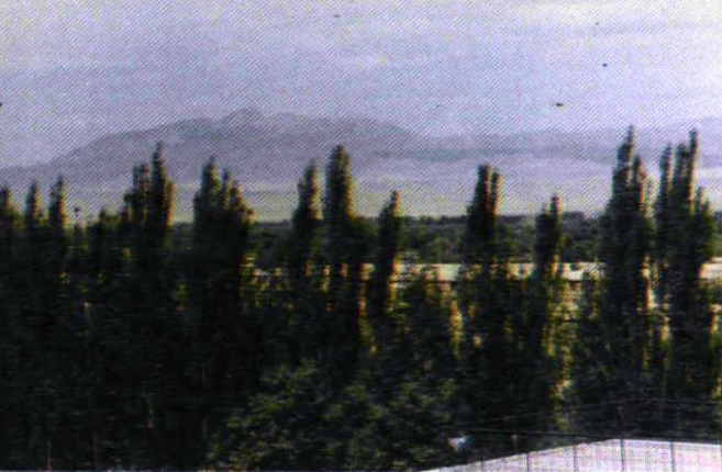
哈拉梯克山下的一团农场