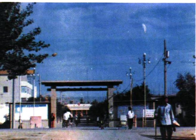
金银川镇红桥大门