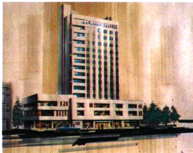
一团在乌鲁木齐市兴建的金银川大厦