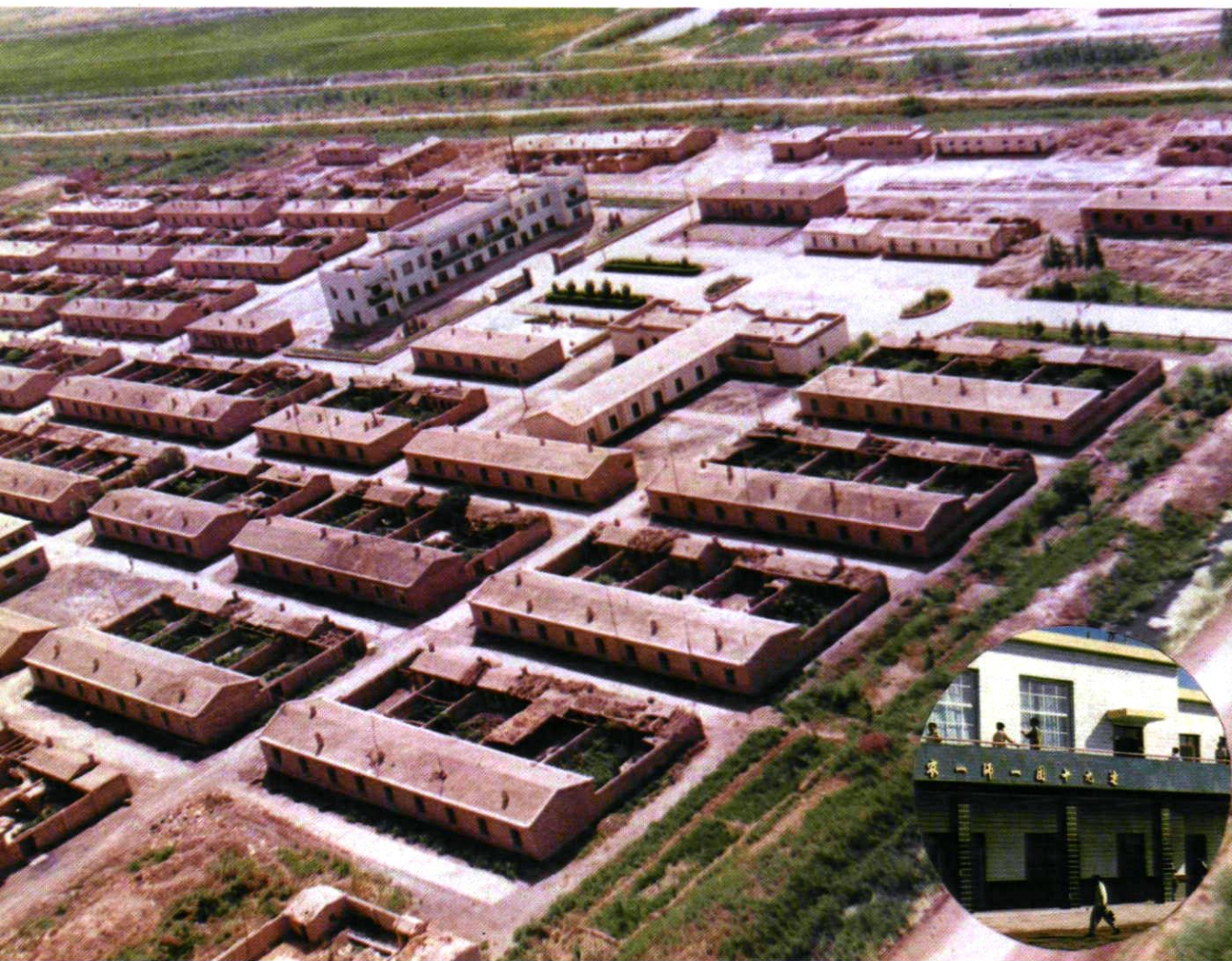
连队住宅区和办公楼