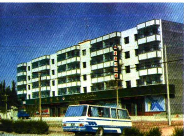
一团建在阿克苏市的金银川商场