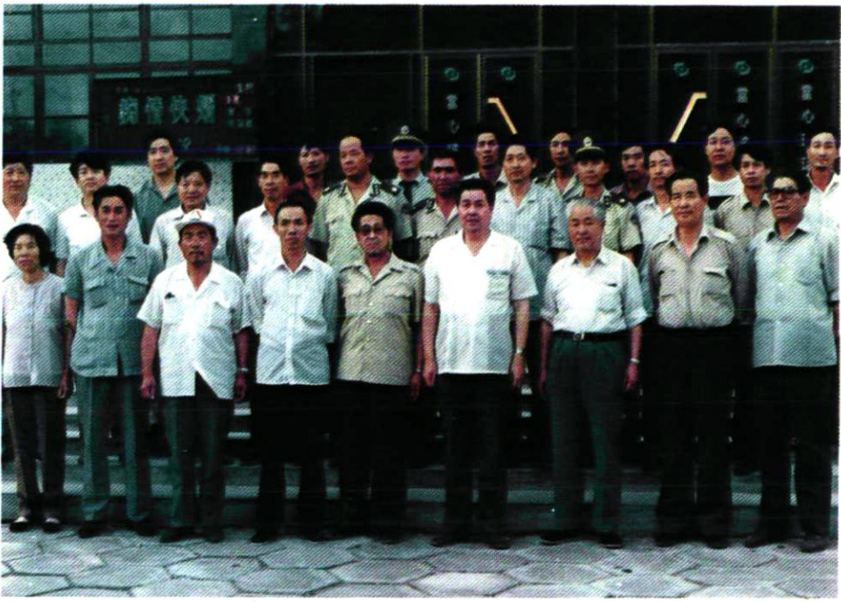
兵团、师首长和团领导合影