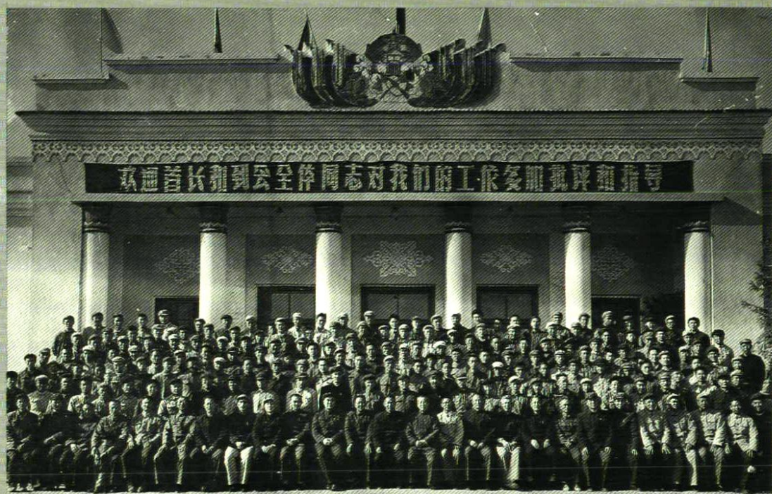
1965年10月24日兵团首届水稻生产经验交流会在一团召开。 图为全体代表合影留念