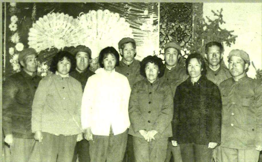
农一师十个标兵,其中一团三个: