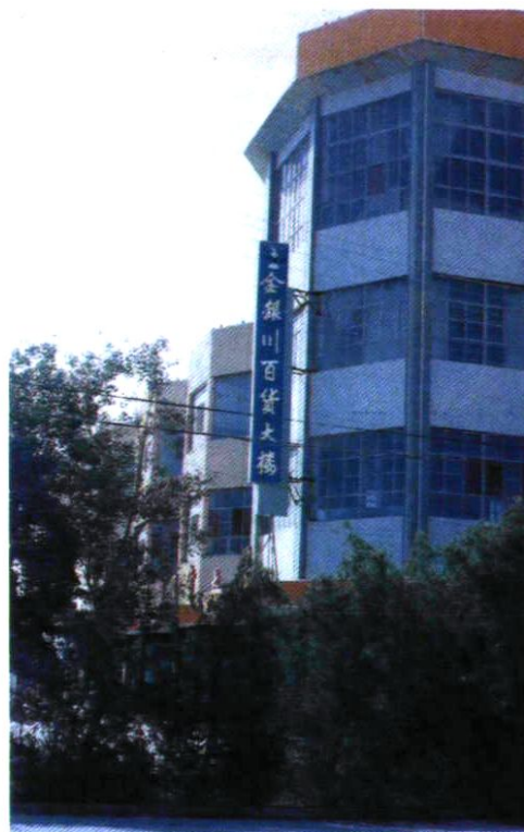
一团团部的金银川百货大楼