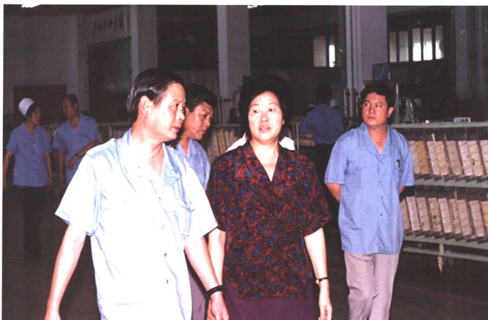
1994年8月11日，时任国家计委副主任郝建秀来青岛卷烟厂视察