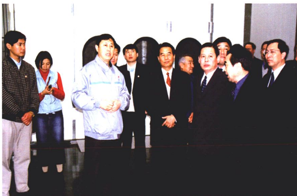
2001年4月30日，时任中央政治局委员、山东省委书记吴官正视察颐中集团