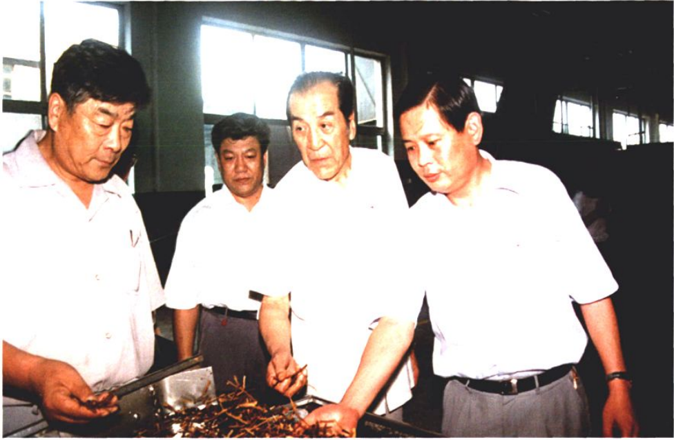
1996年7月24日，时任全国政协常委袁木来青岛卷烟厂视察