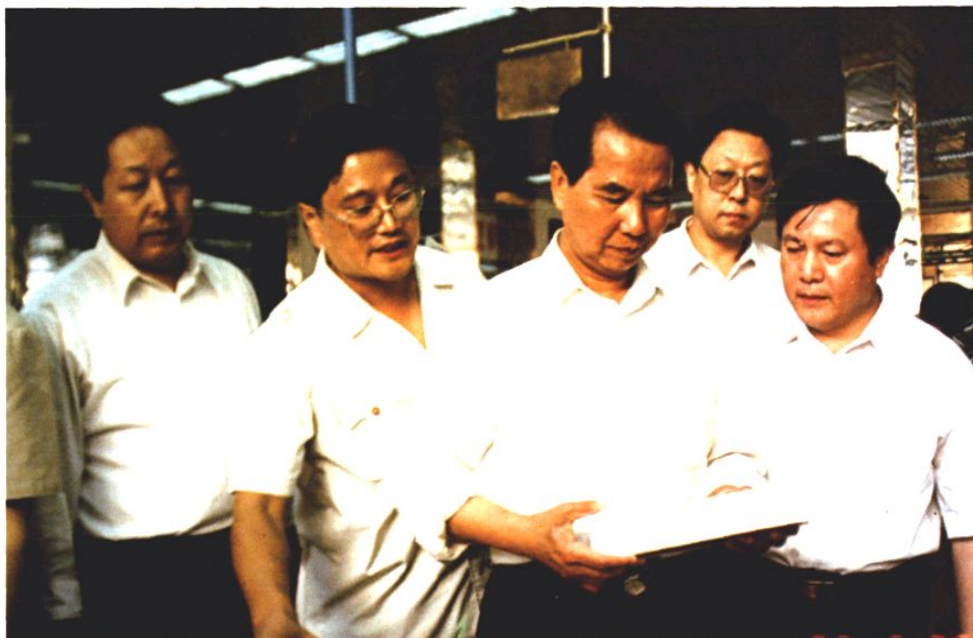
1997年6月20日，时任菏泽烟草专卖局局长王永昌、菏泽卷烟厂厂长周健 陪同时任山东省委书记吴官正视察颐中集团菏泽卷烟厂