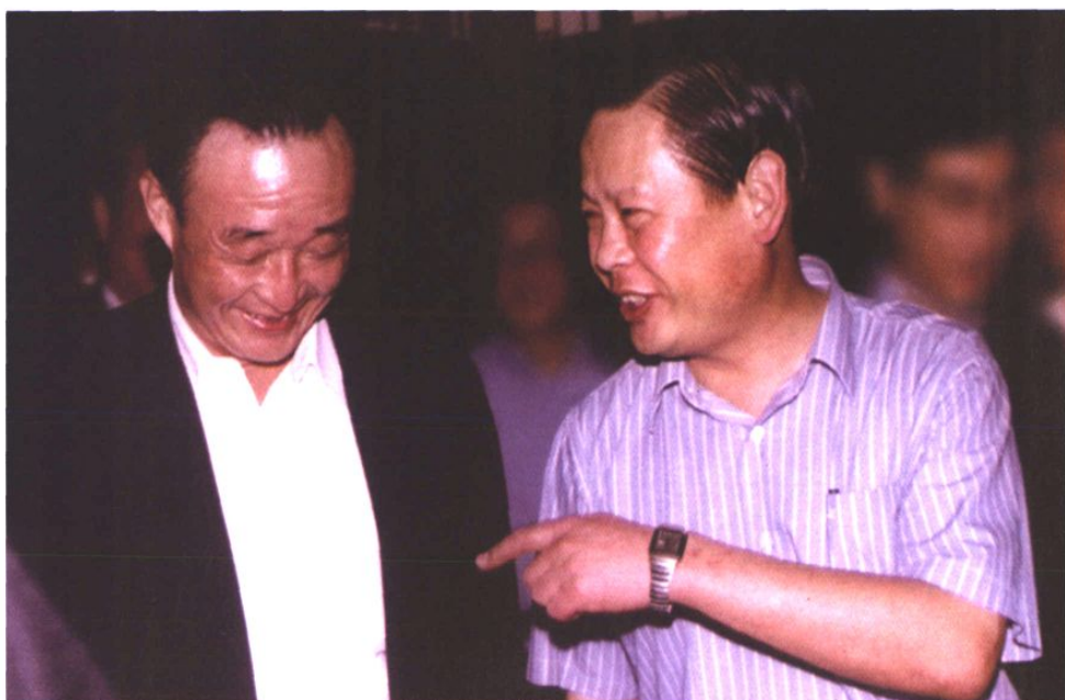
1999年9月7日，时任中央政治局委员、国务院副总理，现任中央政治局常委、全国人大常委会委员长吴邦国接见颐中集团董事长蒲强