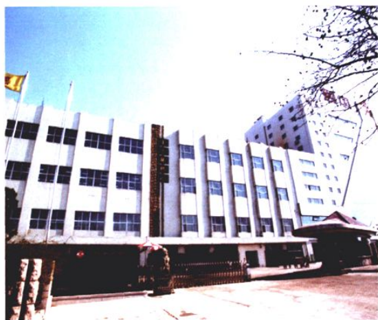
青岛卷烟厂原厂区