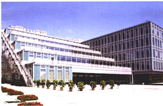
2006年更名为山东中烟工业公司青岛卷烟厂, 图为新厂区办公楼