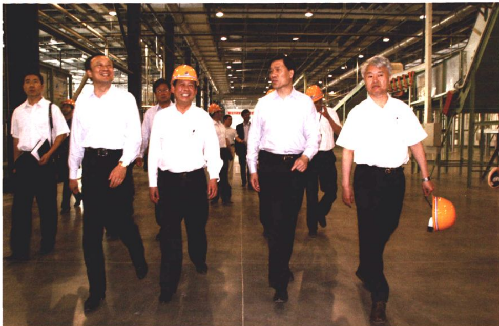
2006年6月1日，青岛市委副书记、市长夏耕来青岛卷烟厂调研指导工作