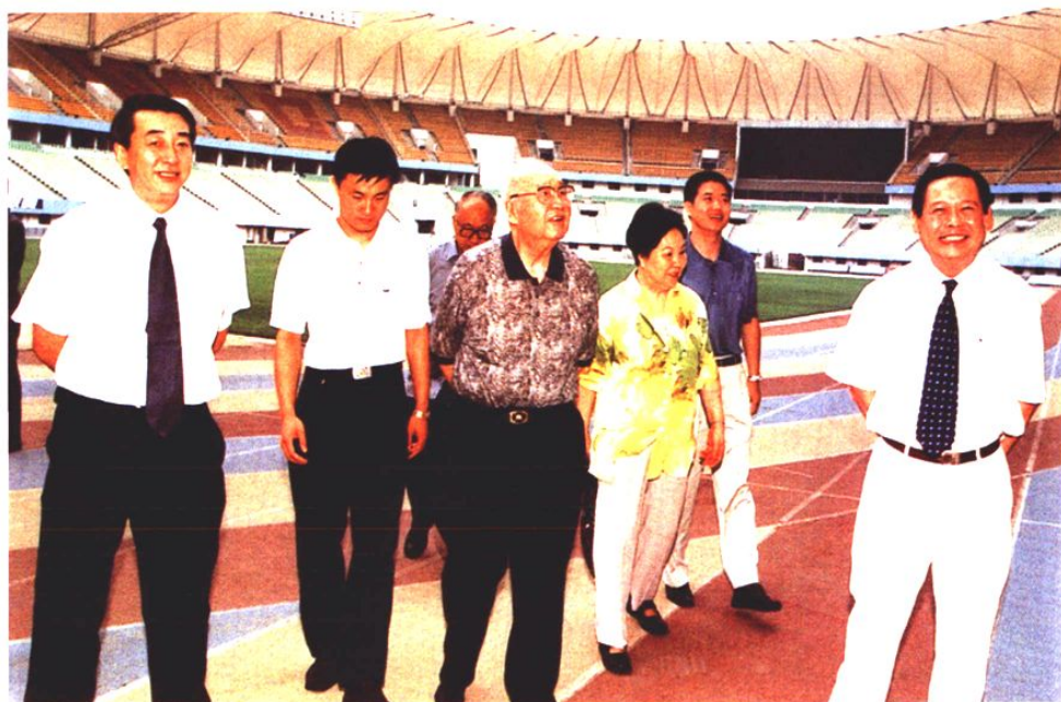
2001年7月26日，时任全国人大常委会副委员长王光英视察颐中体育中心