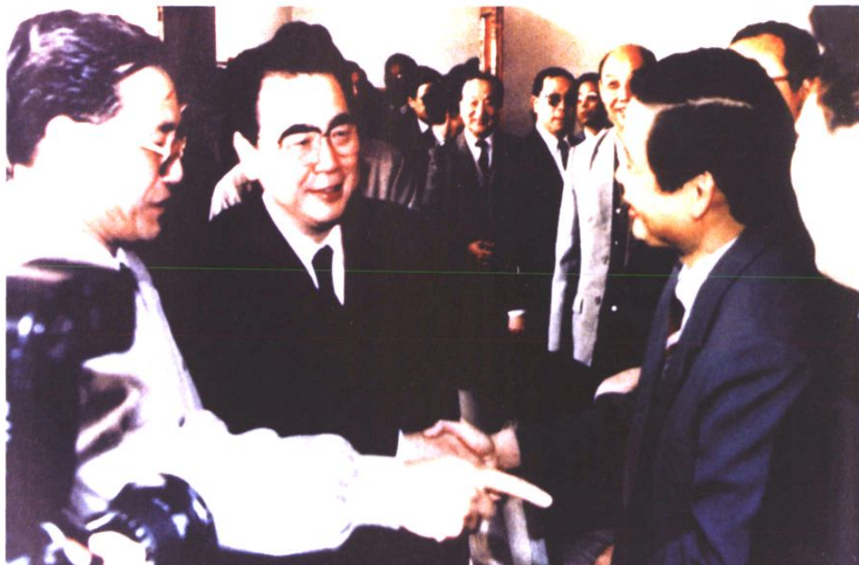
1991年10月29日，时任中央政治局常委、国务院总理李鹏接见青岛卷烟厂厂长蒲强