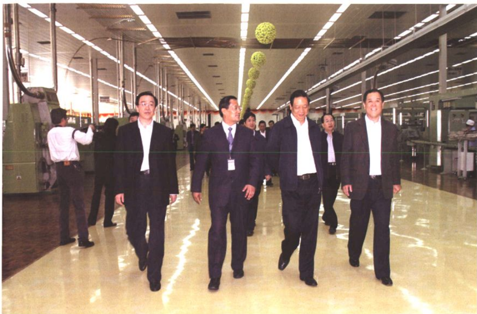
2008年5月15日，国家烟草专卖局局长姜成康在青岛卷烟厂卷包车间现场调研