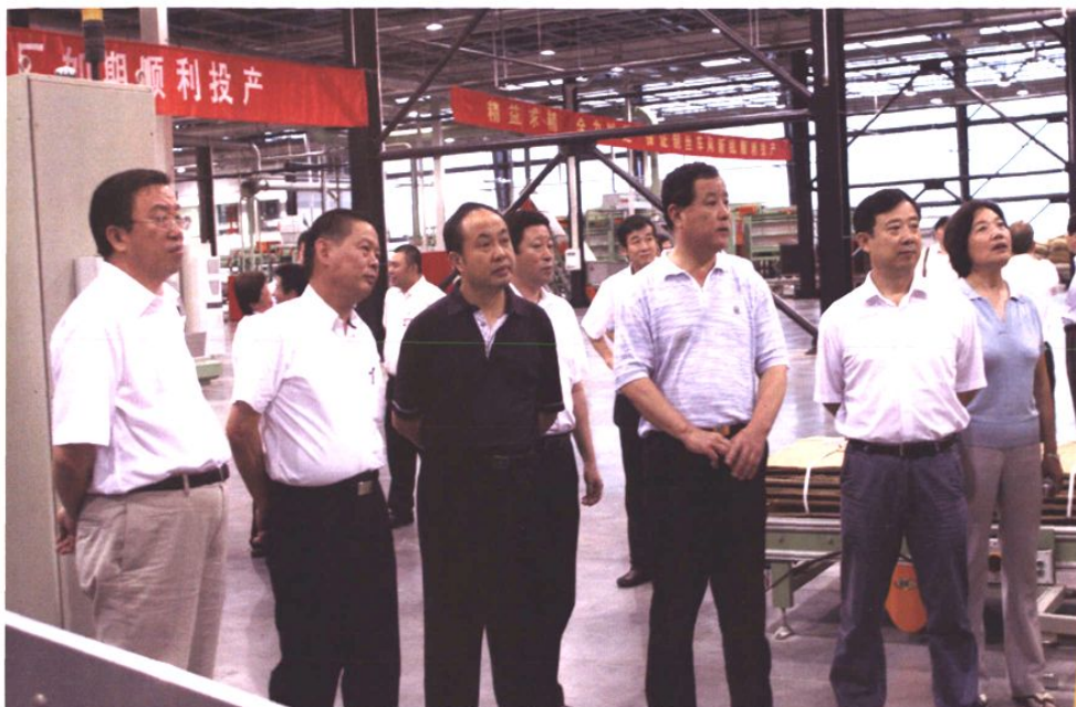
2006年8月26日，國家煙草專賣局副局長何澤華來青島捲煙廠調研