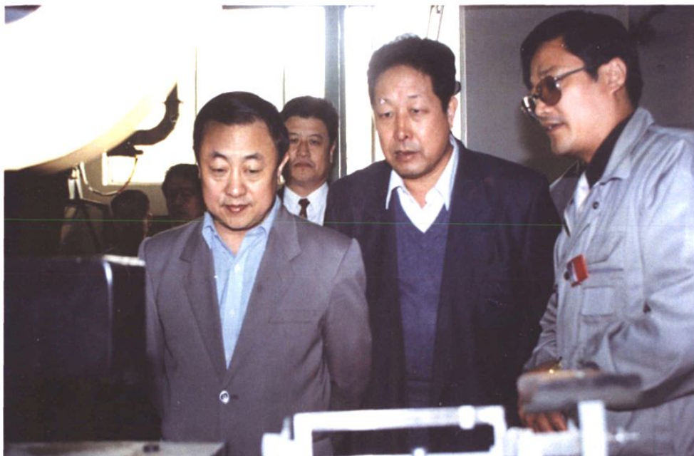
1996年10月19日，时任山东省副省长韩寓群视察颐中集团菏泽卷烟厂