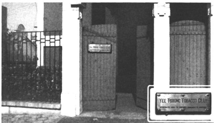
1934年更名为英商颐中烟草股份有限公司青島分公司