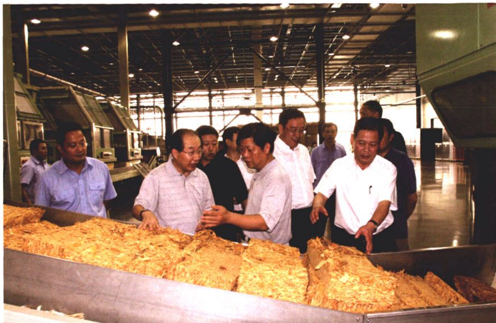
2007年9月22日，国家烟草专卖局纪检组组长潘家华来青岛卷烟厂调研