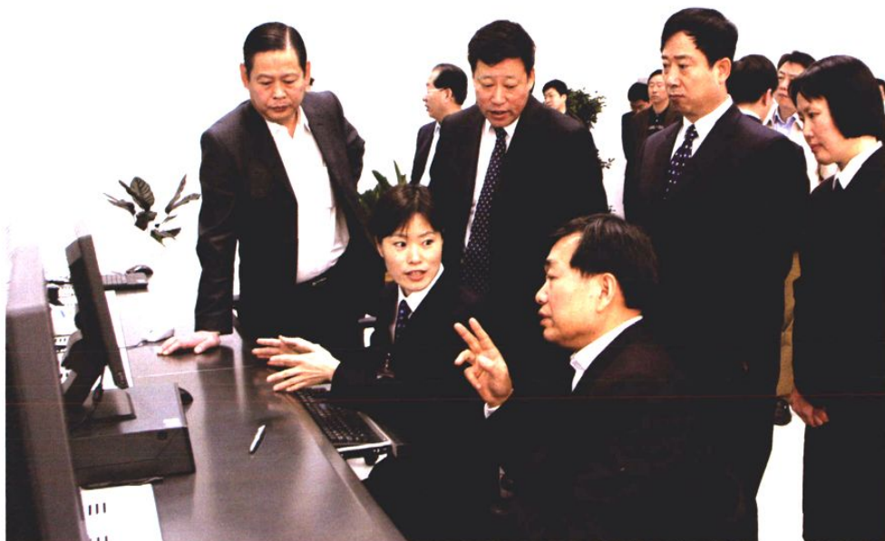
2007年4月3日，国家烟草专卖局副局长张保振来青岛卷烟厂调研