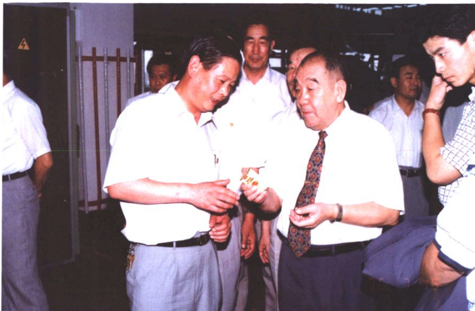
1996年7月16日，时任全国人大常委会副委员长布赫来青岛卷烟厂视察