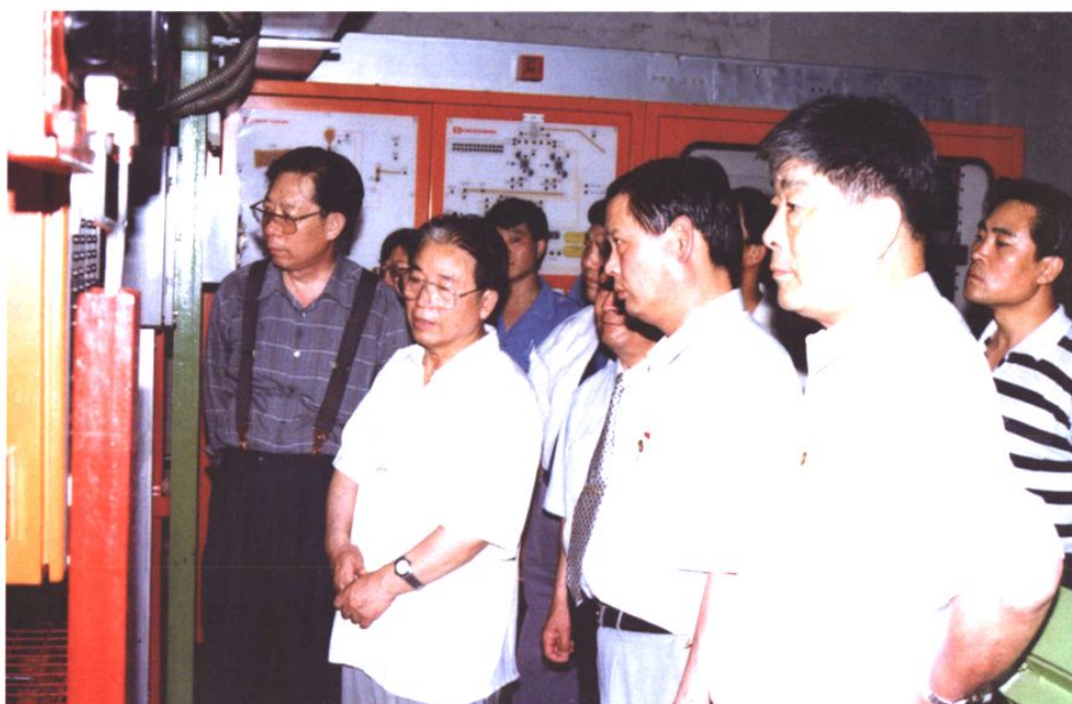
1996年7月16日，时任国家烟草专卖局局长江明来青岛卷烟厂调研