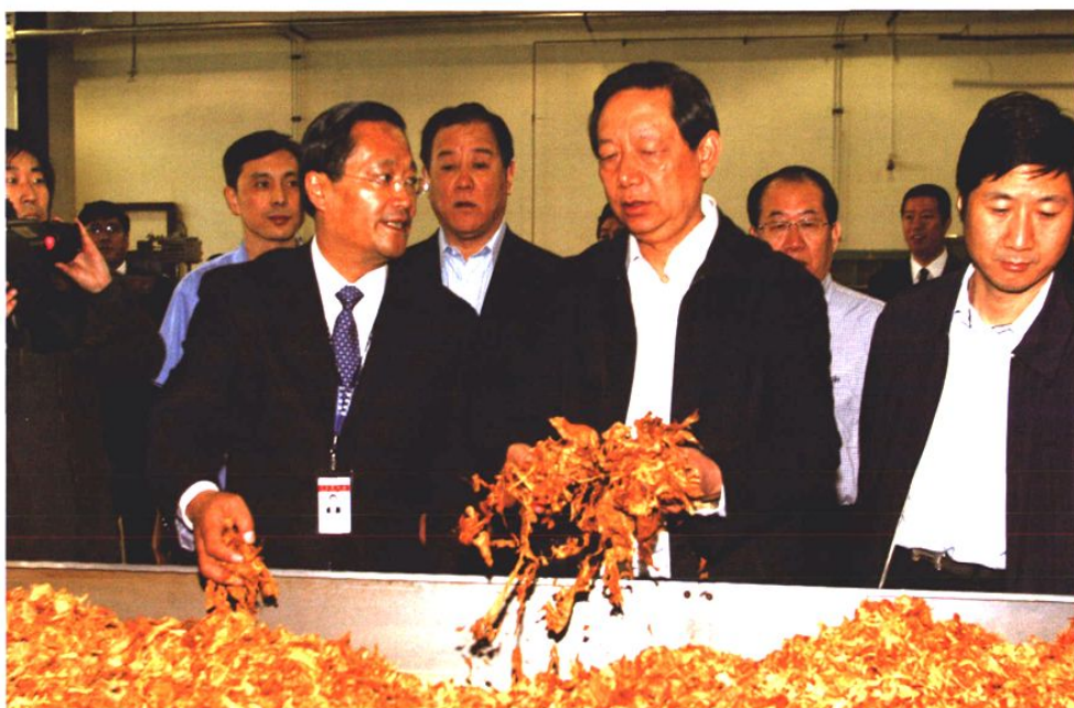
2008年5月15日，国家烟草专卖局局长姜成康在青岛卷烟厂制丝车间现场调研