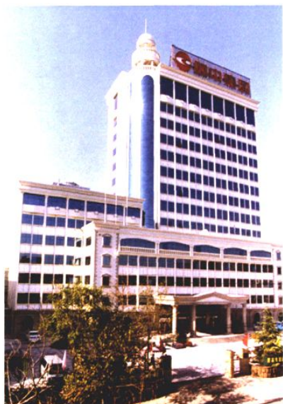
1995年更名为颐中烟草(集团)有限公司 青岛卷烟厂, 图为办公大楼