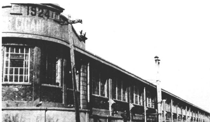
1925年迁址于孟庄路7号的大英烟草股份有限公司青島分公司（厂）