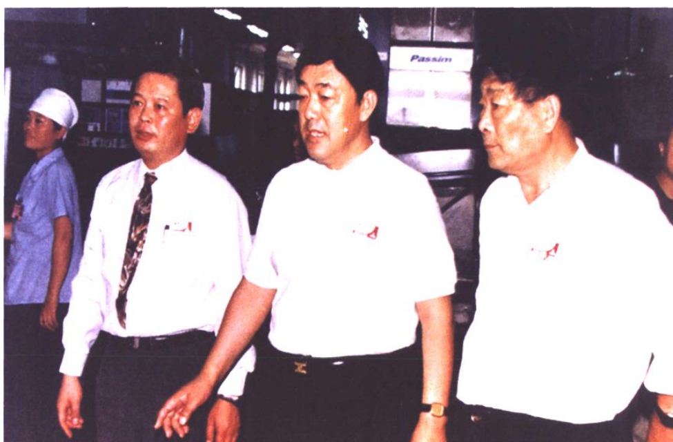
1997年山东省常委、青岛市委书记张惠来到青岛卷烟厂调研指导工作