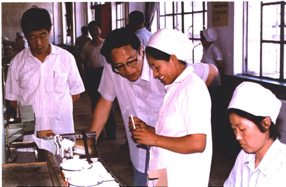
1989年8月2日，时任青岛市副市长，现任中央政治局委员、上海市委书记俞正声来青岛卷烟厂视察