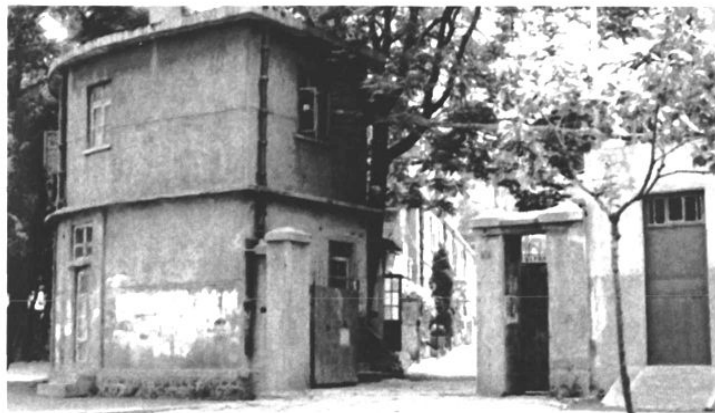
1919年大英烟草股份有限公司驻青島办事处