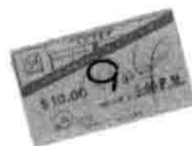
1948年南京戲院的廣告。